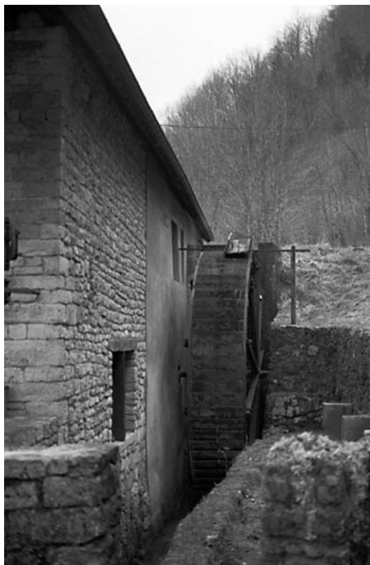
Façade latérale droite : la roue hydraulique verticale.

25, Bonnevaux-le-Prieuré route départementale 280, lieudit : Bonnevaux du Bas