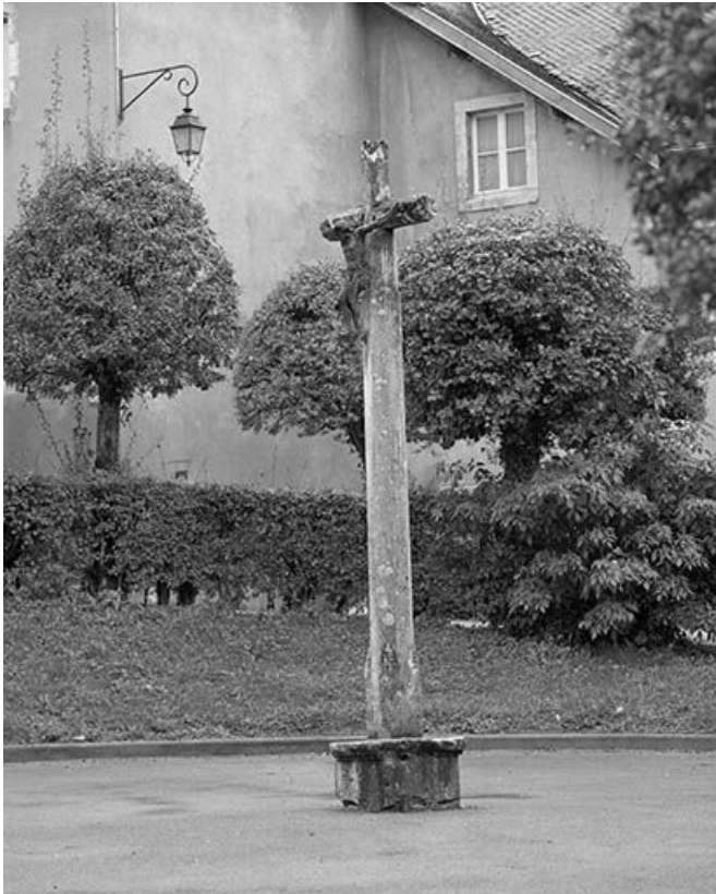
Vue générale de trois quarts droit. 25, Ornans rue Saint-Laurent