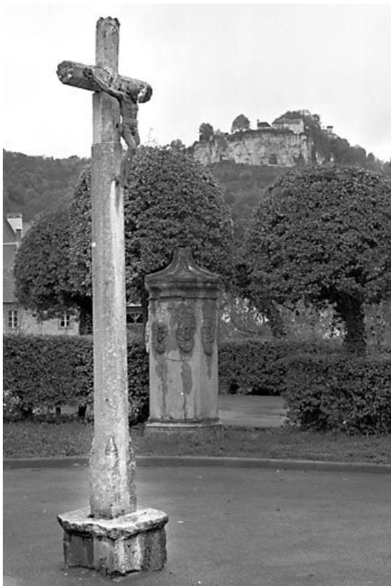
Vue générale de trois quarts gauche.