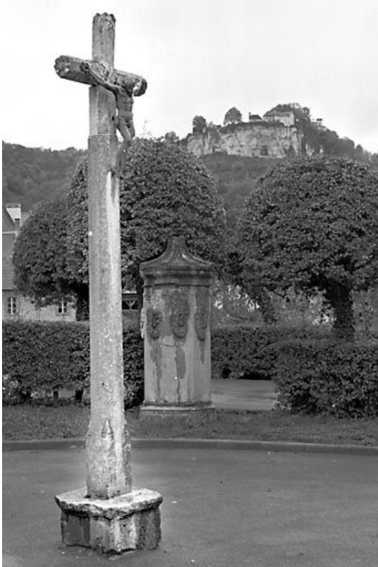
Vue générale de trois quarts gauche. 25, Ornans rue Saint-Laurent