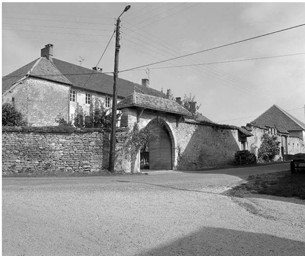
Vue d'ensemble. 25, Scey-Maisières