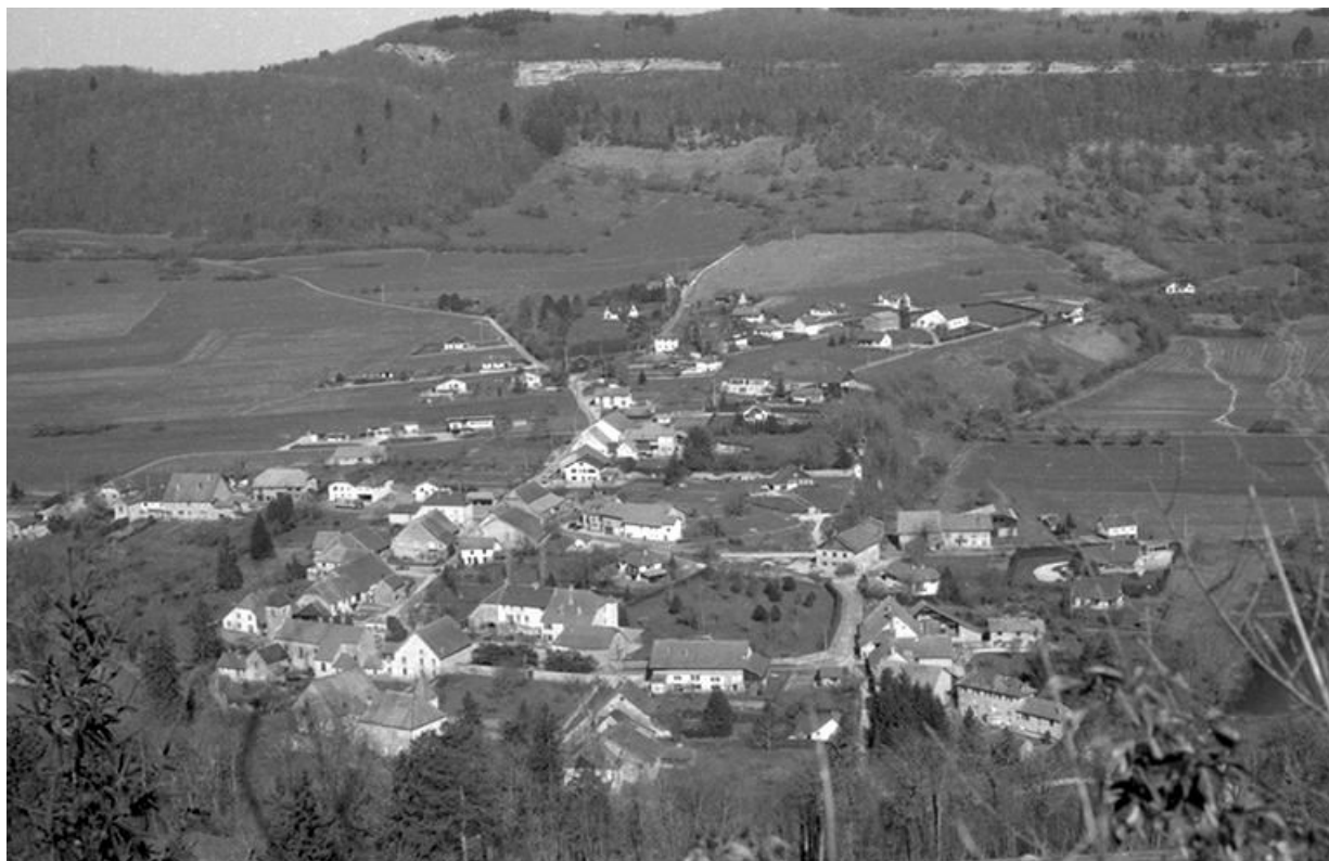
Vue générale du village depuis le château fort de Chassagne-Saint-Denis. 25, Scey-Maisières