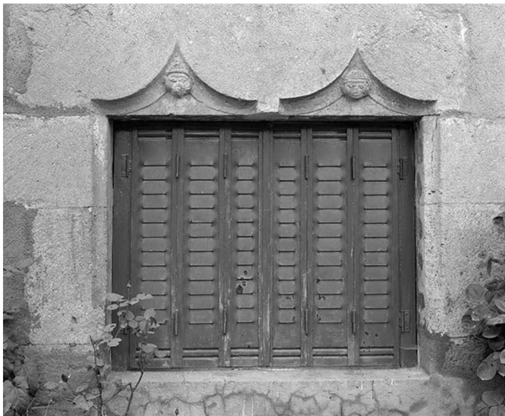
Maison située à Maisières-Notre-Dame, cadastrée 1971 AB 23 : linteau de baie orné de têtes humaines. 25, Scey-Maisières