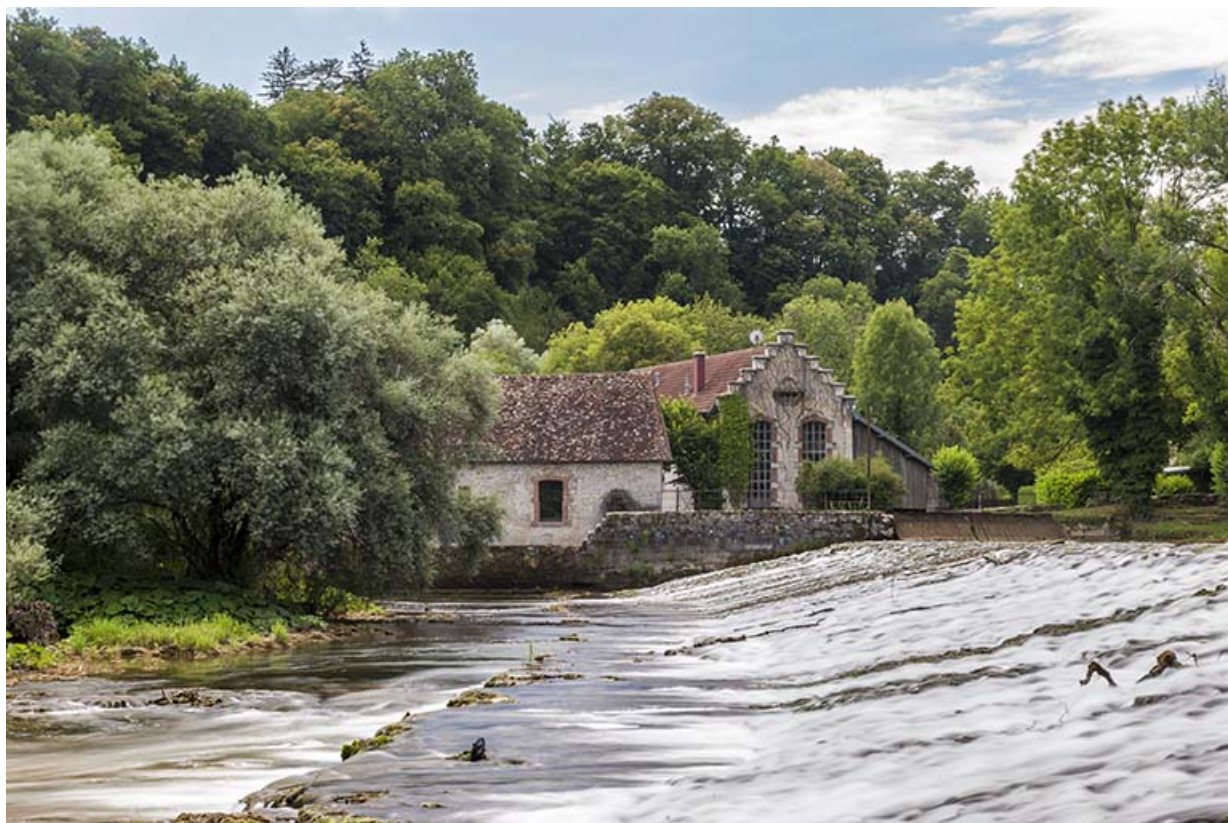
Vue d'ensemble depuis l'extrémité du barrage, au nord.