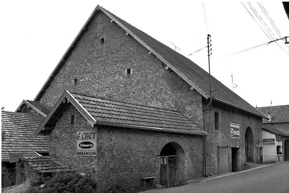
Façade antérieure vue de trois quarts gauche. 25, Scey-Maisières