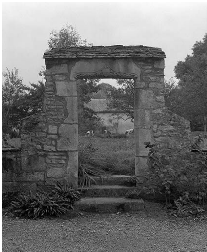
Maison située à Maisières-Notre-Dame : vestiges d'une porte piétonne au linteau décoré. 25, Scey-Maisières