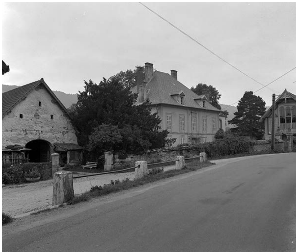
Vue d'ensemble depuis la rue. 25, Scey-Maisières