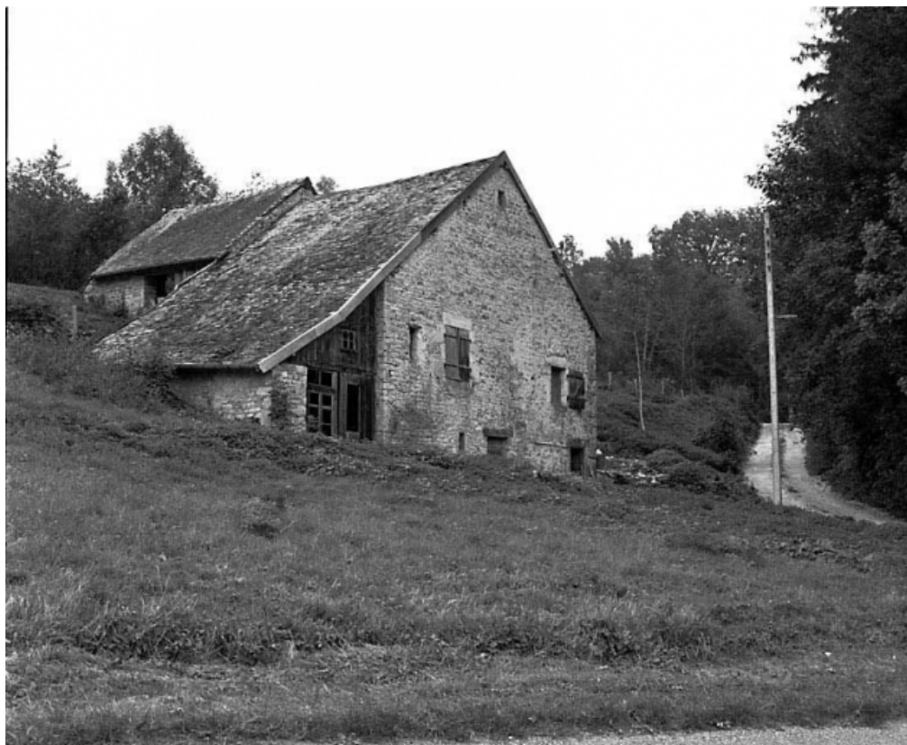
Vue générale de trois quarts gauche. 25, Scey-Maisières