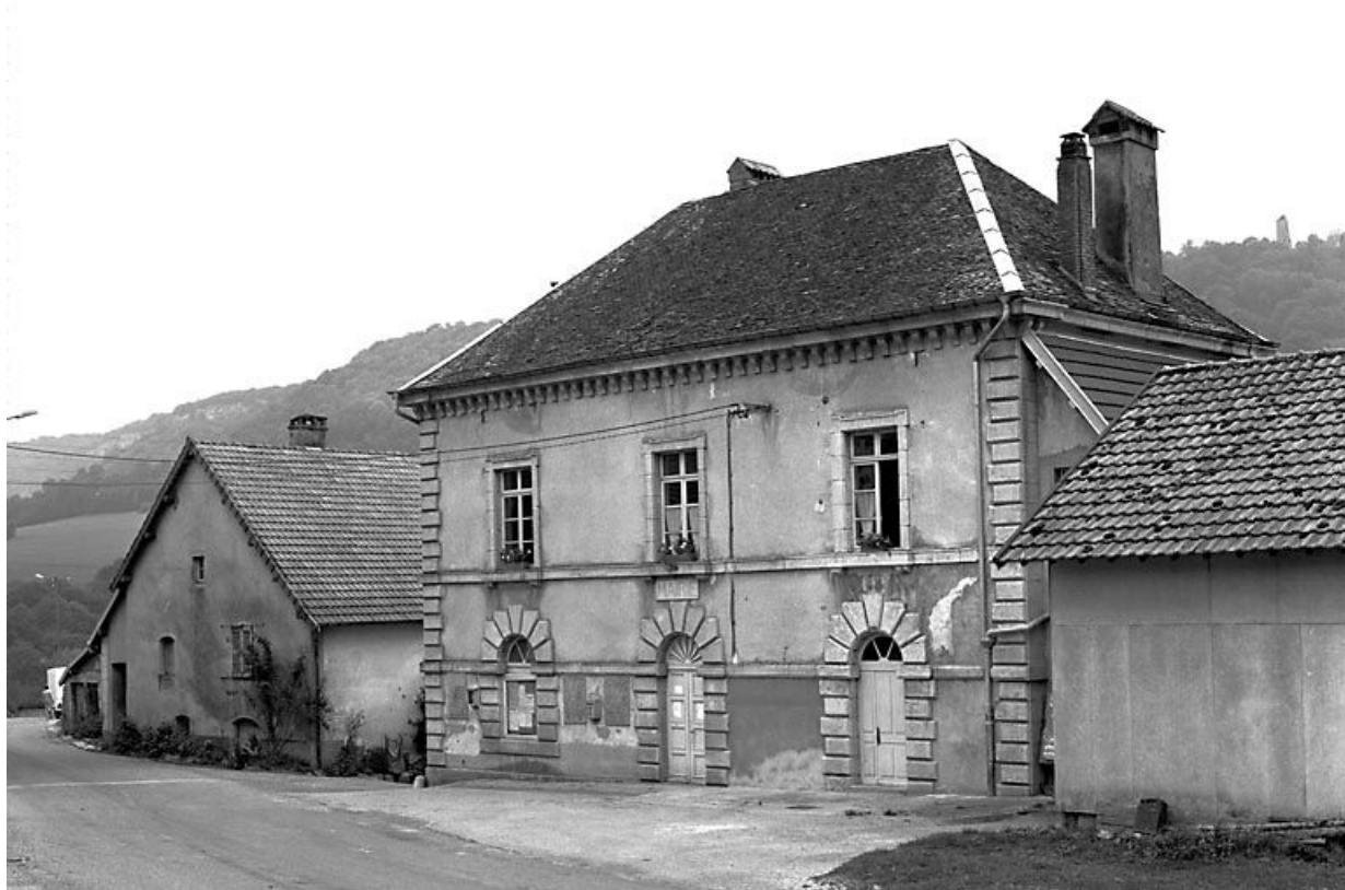
Façade antérieure. 25, Scey-Maisières