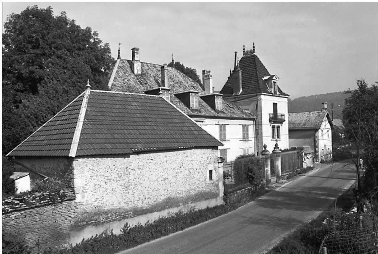
Vue d'ensemble. 25, Scey-Maisières