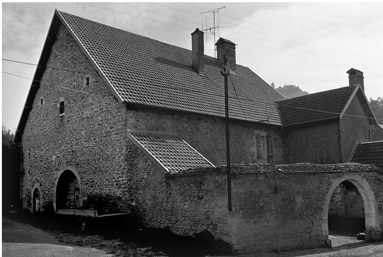
Façade antérieure et face latérale gauche. 25, Scey-Maisières