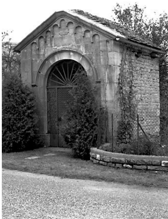
Face antérieure. 25, Scey-Maisières