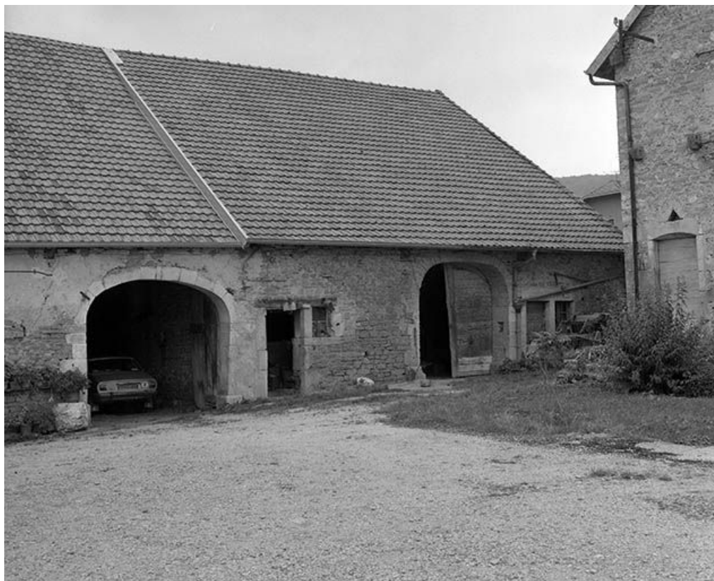
Ferme située à Scey-en-Varais, rue de l'Eglise. 25, Scey-Maisières