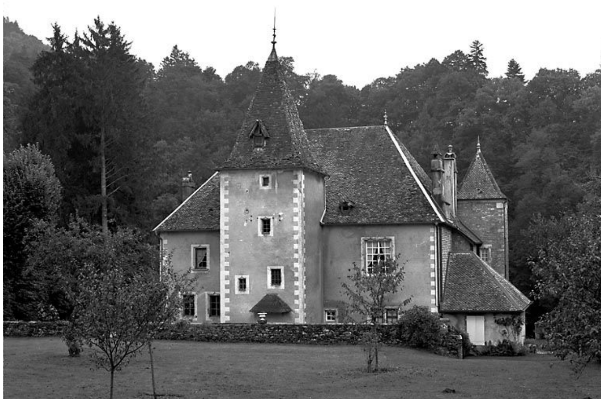
Façade antérieure. 25, Scey-Maisières