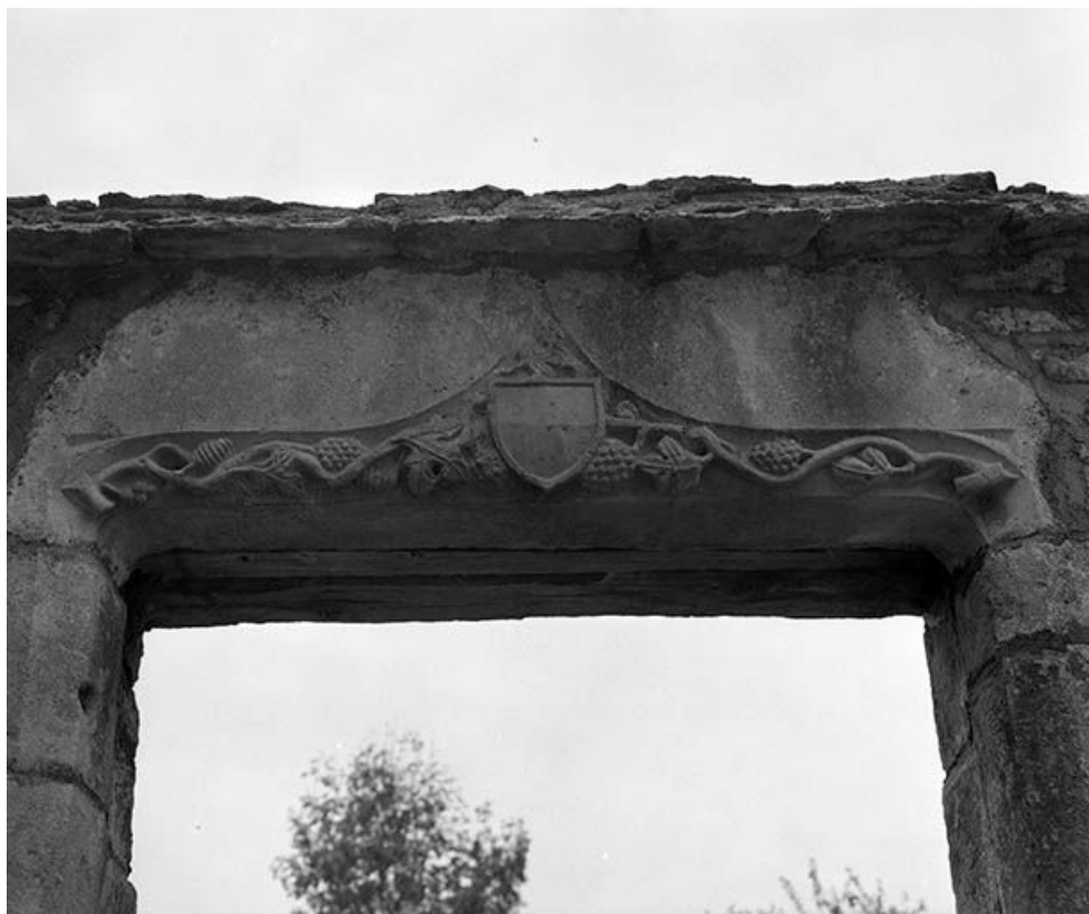
Maison située à Maisières-Notre-Dame : linteau décoré de la porte piétonne. 25, Scey-Maisières