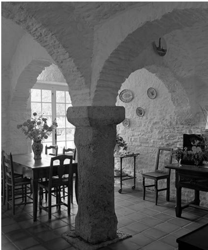
Maison située à Maisières-Notre-Dame : cuisine voûtée avec pilier central. 25, Scey-Maisières