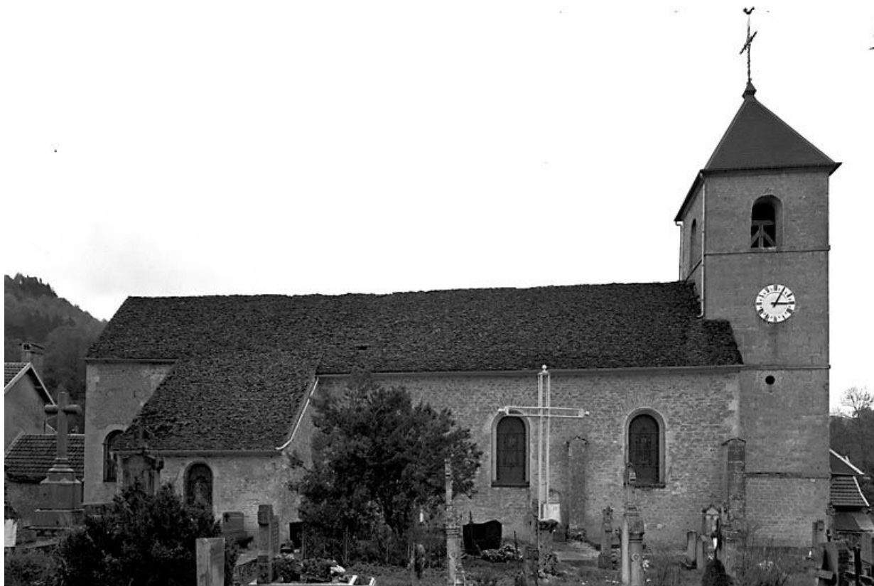
Face latérale nord. 25, Scey-Maisières