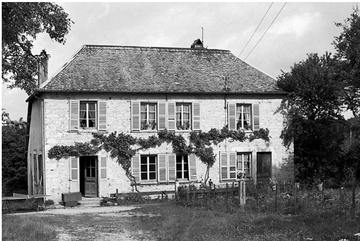
Façade antérieure et face latérale gauche. 25, Bonnevaux-le-Prieuré