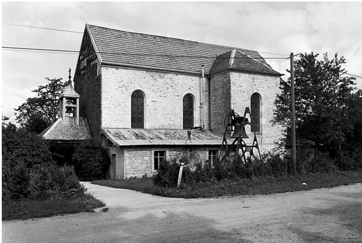
Face latérale droite.