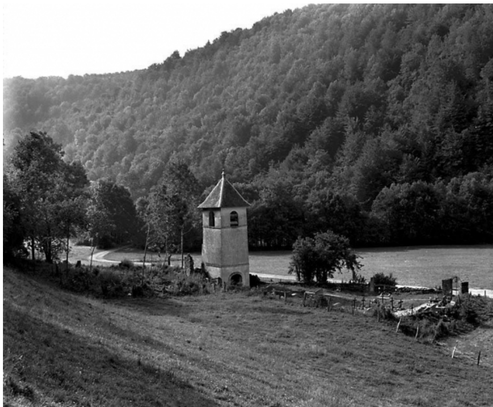
Vue générale depuis le nord-ouest.