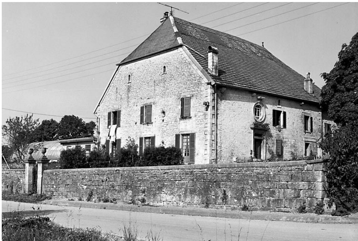
Façade antérieure et face latérale gauche depuis la rue. 25, Amathay-Vésigneux