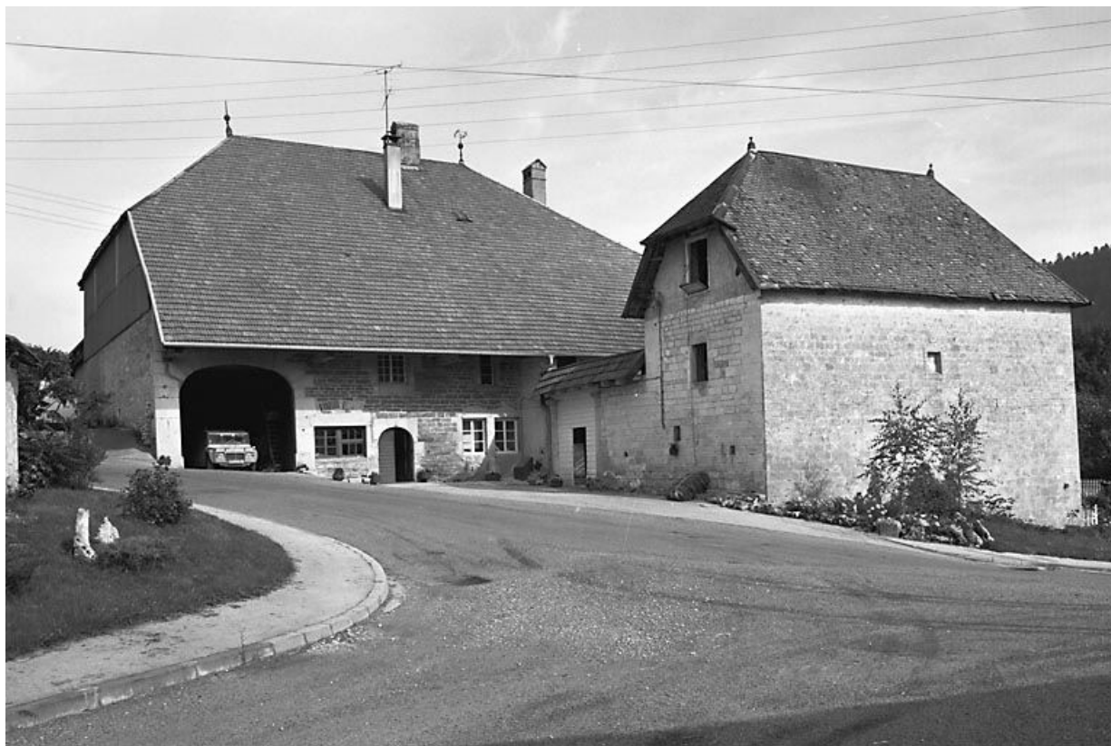
Vue générale depuis la rue.