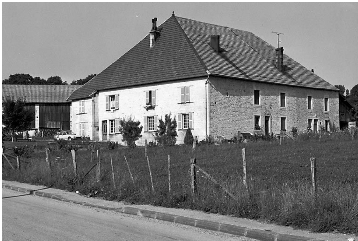
Vue générale depuis la rue. 25, Amathay-Vésigneux