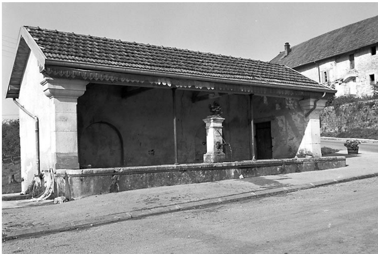
Vue générale de trois quarts gauche. 25, Amathay-Vésigneux