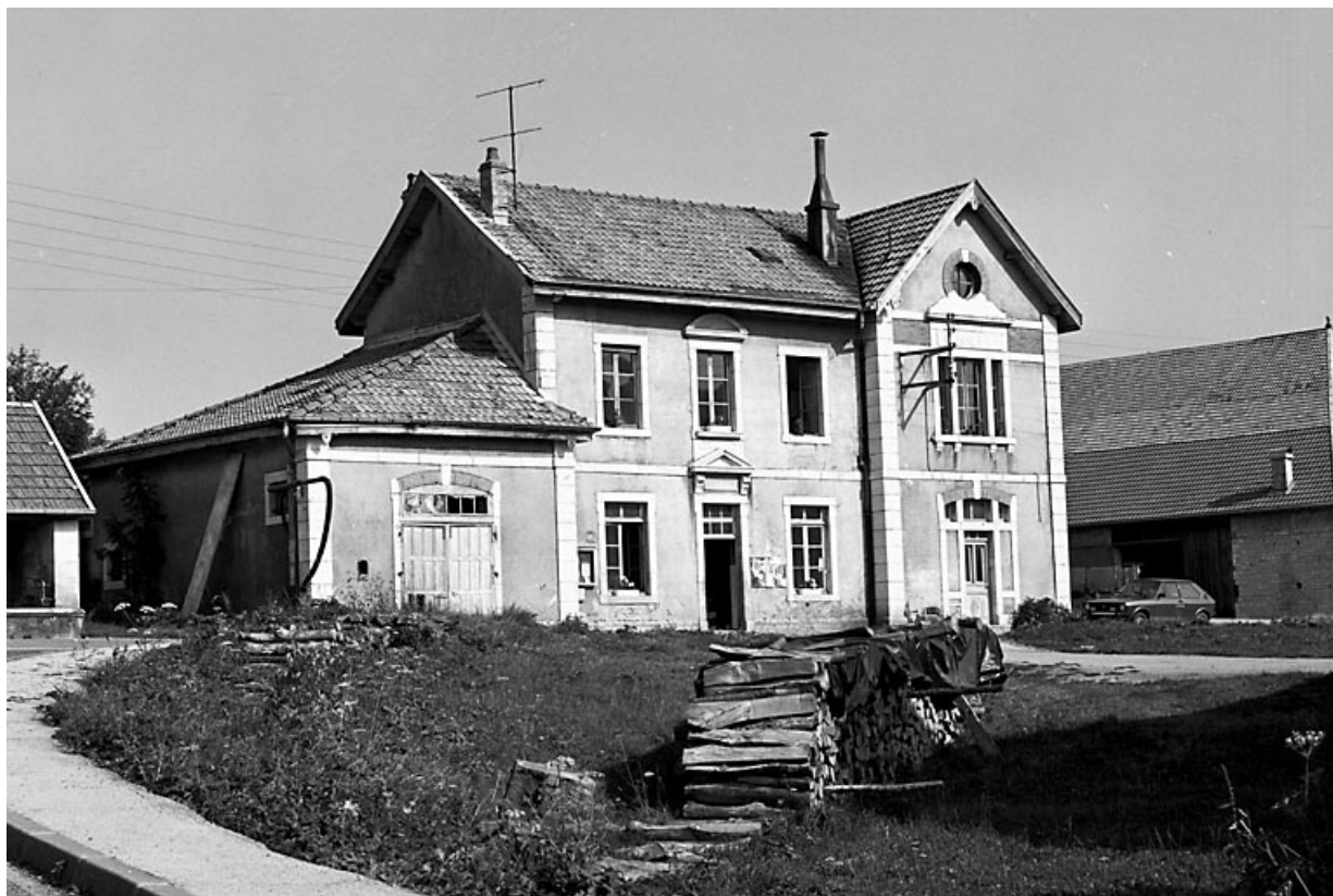
Vue de trois quarts gauche. 25, Amathay-Vésigneux