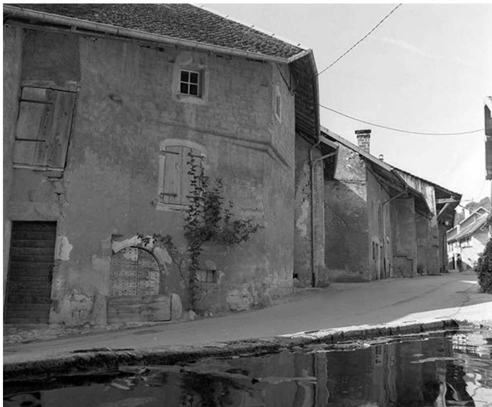
Maisons situées rue Robert Dame vues depuis la fontaine-lavoir. 25, Mouthier-Haute-Pierre