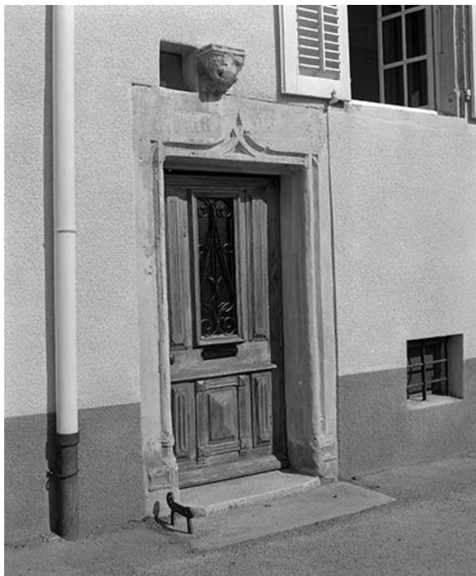
Maison située rue Robert Dame, cadastrée 1971 AB 529 : porte piétonne de trois quarts gauche. 25, Mouthier-Haute-Pierre