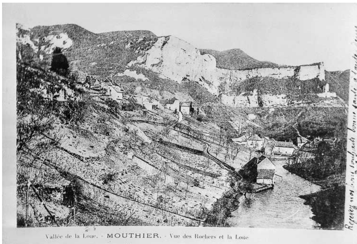
Vallée de la Loue. - MOUTHIER. - Vue des Rochers et la Loue