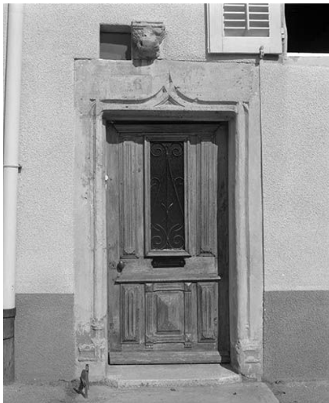
Maison située route d'HautePierre, cadastrée 1971 AB 529 : porte piétonne. 25, Mouthier-Haute-Pierre