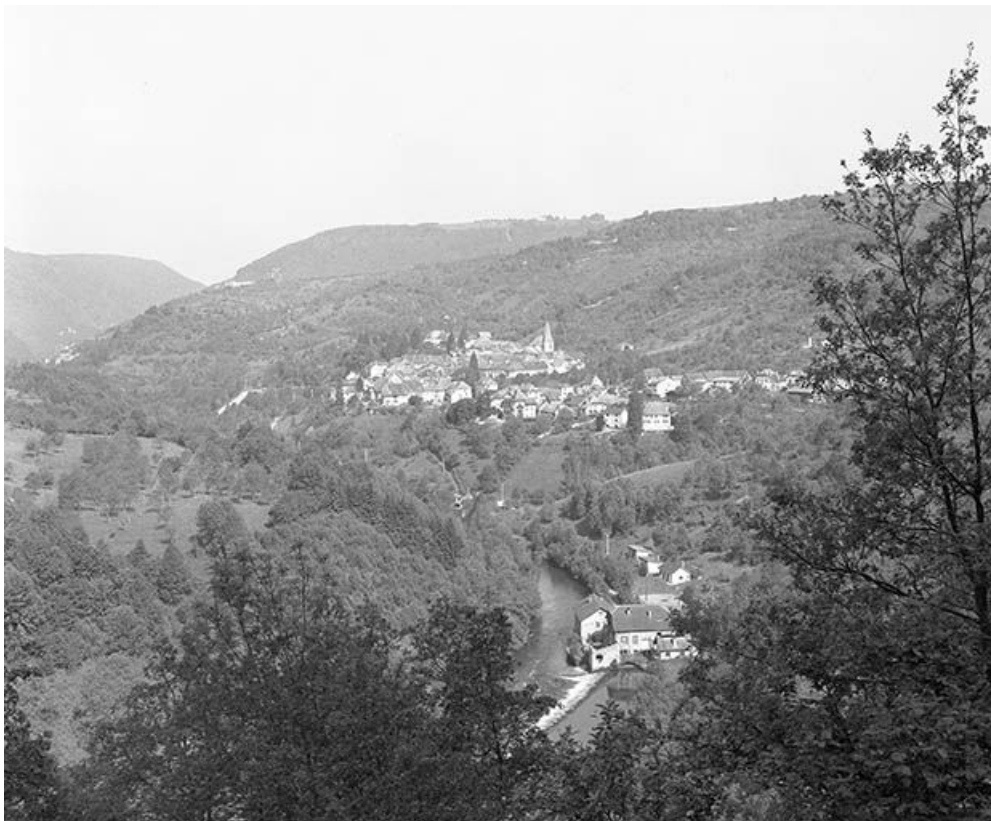
Vue générale depuis le point de vue en bordure de la N67 en amont du village. 25, Mouthier-Haute-Pierre