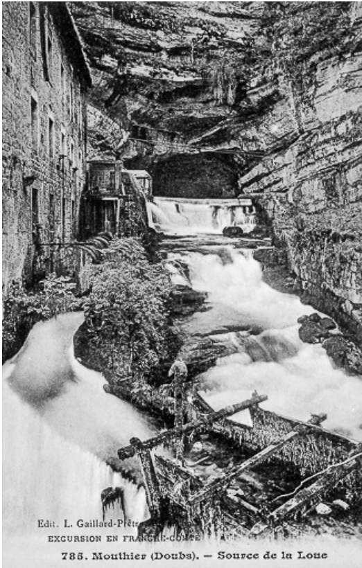
EXCURSION EN FRANCHE-COMTE; 786. Mouthier (Doubs). - Sources de la Loue. 25, Mouthier-Haute-Pierre