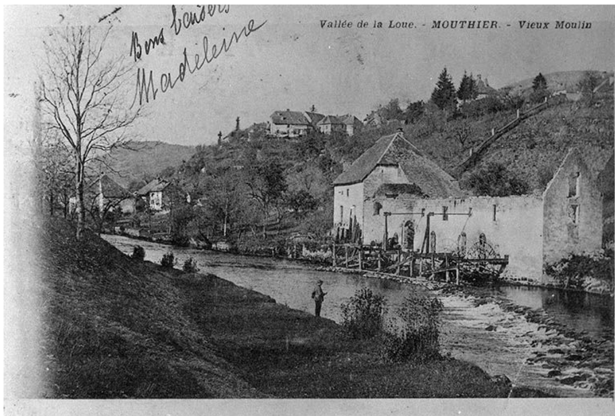
Vallée de la Loue.- Mouthier.- Vieux Moulin, entre 1881 et 1903. 25, Mouthier-Haute-Pierre