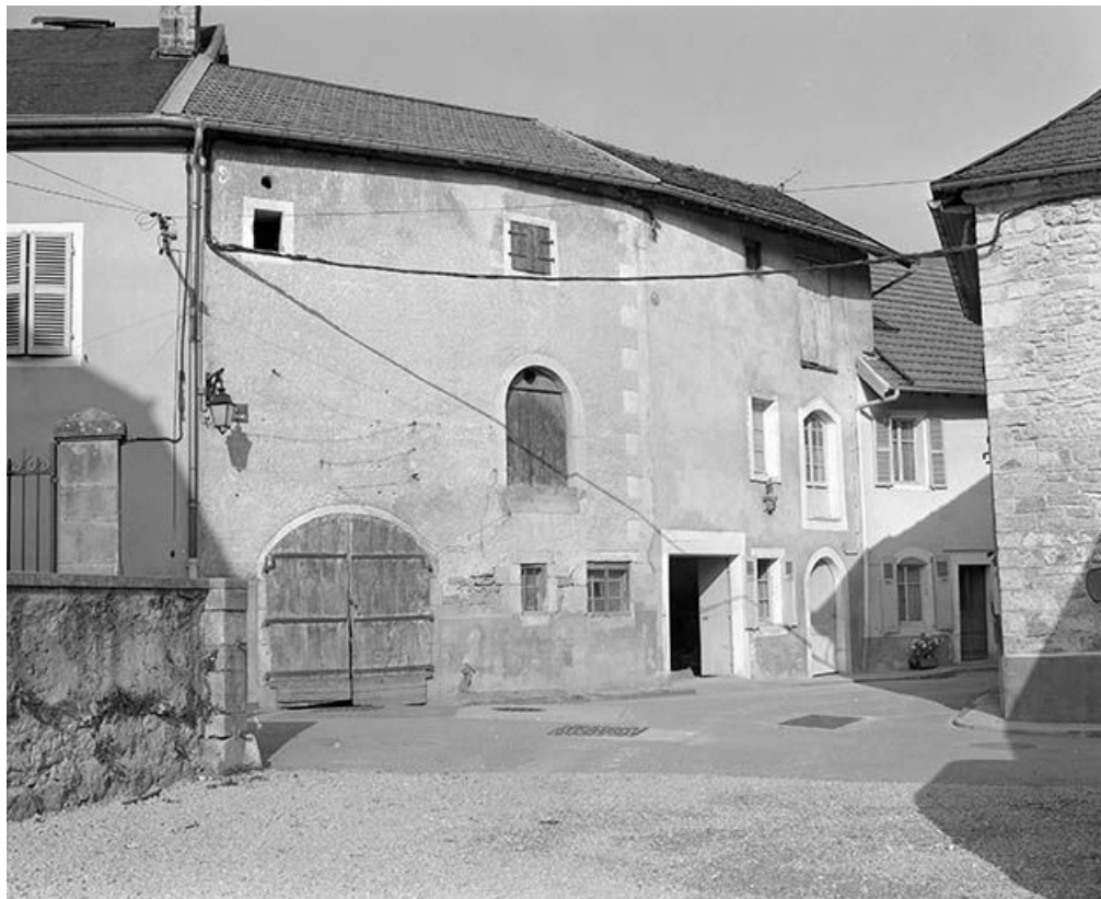
Maison située 2 rue Pavée. 25, Mouthier-Haute-Pierre