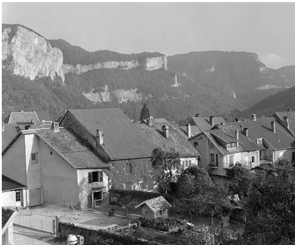
Façades postérieures des maisons de la rue Robert Dame. 25, Mouthier-Haute-Pierre