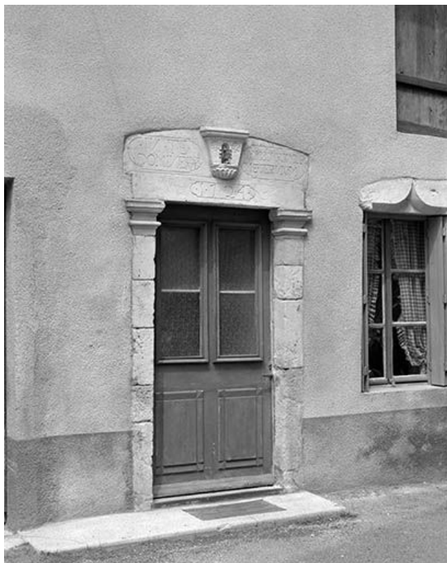
Maison située rue de la Croix de Sompré, cadastrée 1971 AB 278. 25, Mouthier-Haute-Pierre