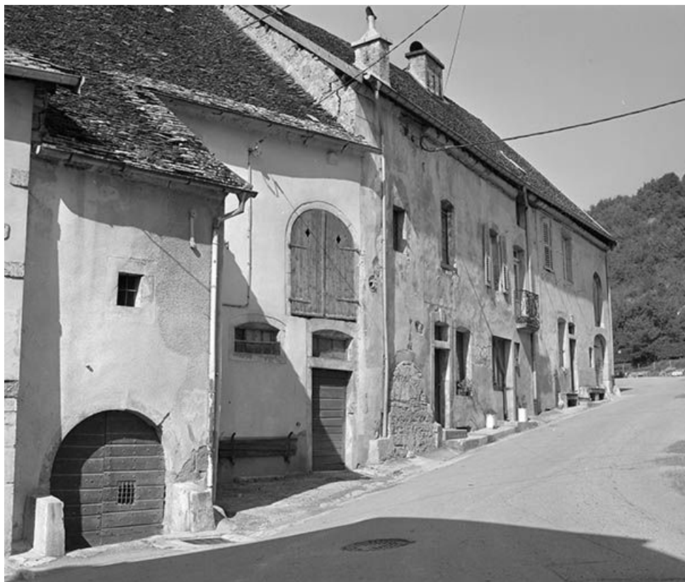
Maisons situées rue du Chapité, cadastrées 1971 AB 322 à 324. 25, Mouthier-Haute-Pierre