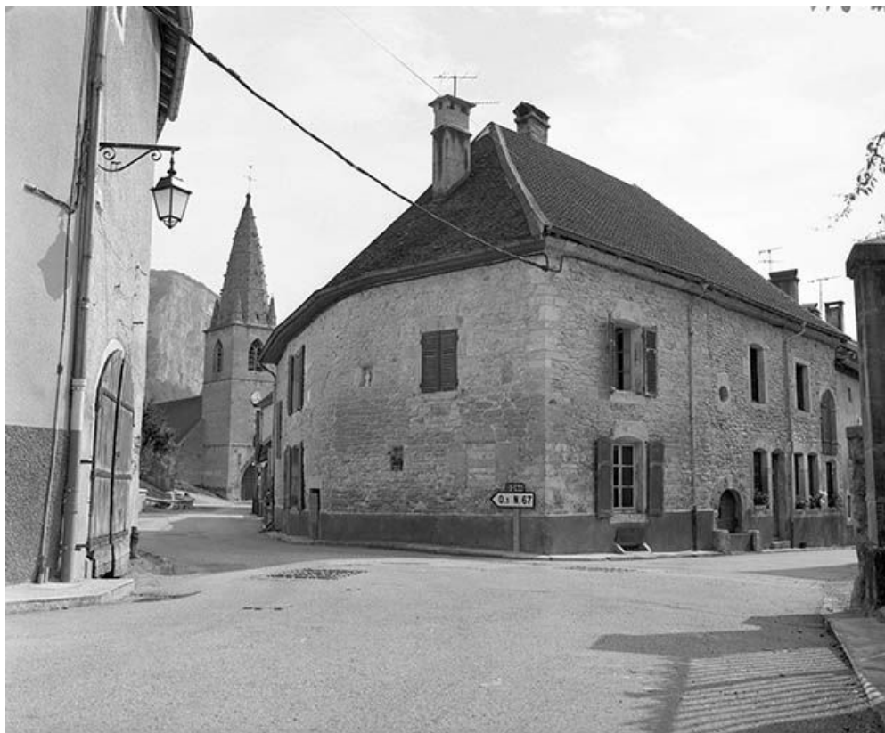
Maison située 3 rue Pavée. 25, Mouthier-Haute-Pierre