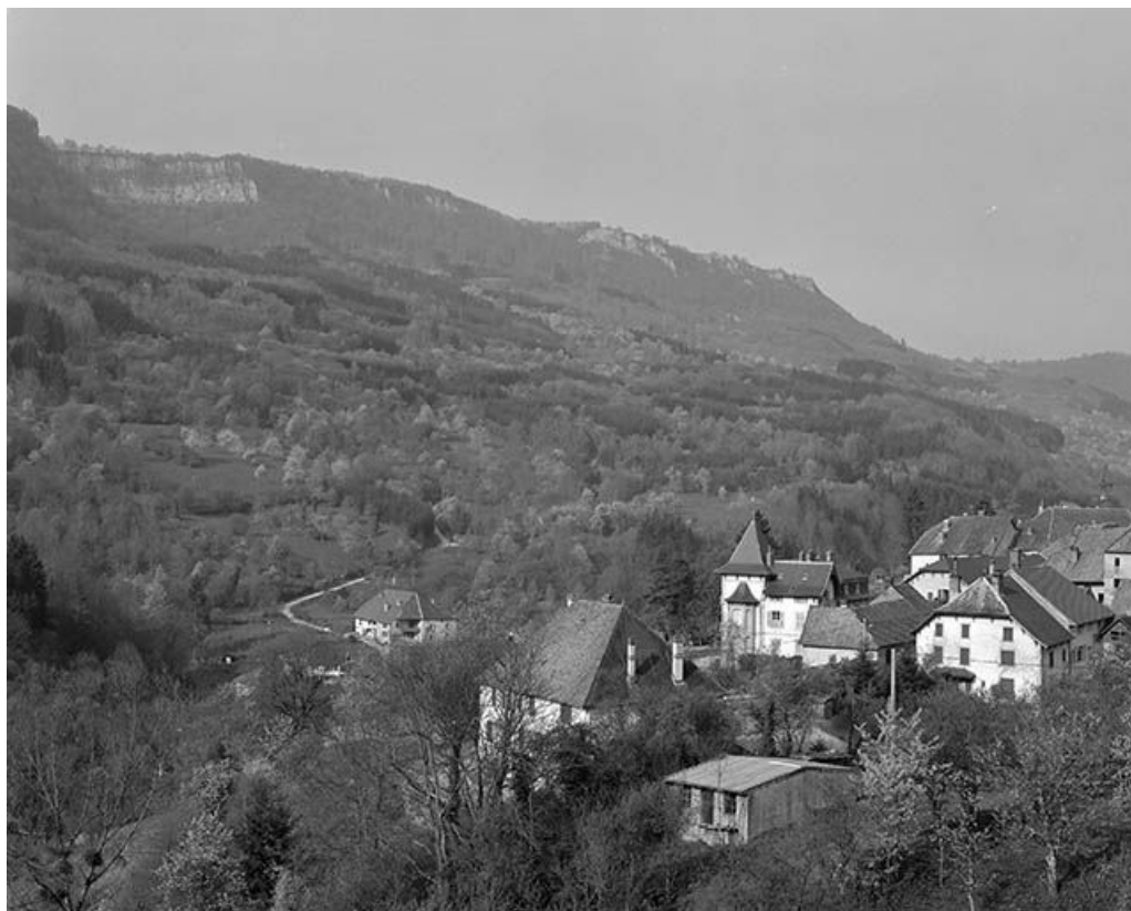
Vue générale depuis le haut de la rue Ernest Reyer. 25, Mouthier-Haute-Pierre