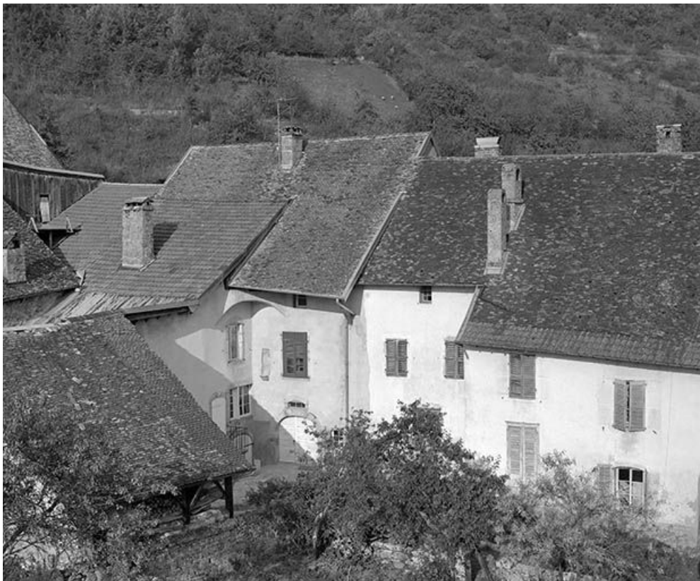
Façades postérieures des maisons cadastrées 1971 AB 380 à 381 de la rue Robert Dame. 25, Mouthier-Haute-Pierre