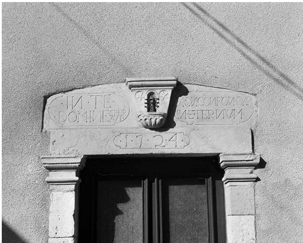
Maison située rue de la croix de Sompré, cadastrée 1971 AB 278 : linteau de la porte d'entrée. 25, Mouthier-Haute-Pierre