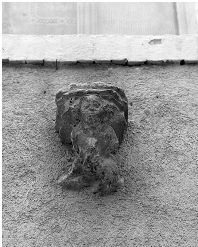
Maison cadastrée 1971 AB 348 : détail de la console (ange portant un écusson). 25, Mouthier-Haute-Pierre