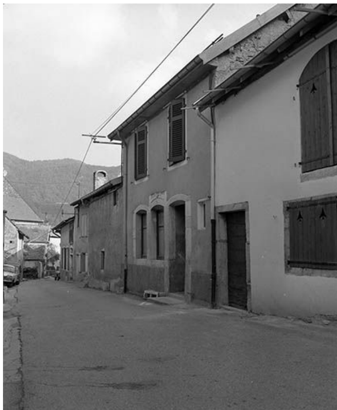
Maisons situées rue Robert Dame.