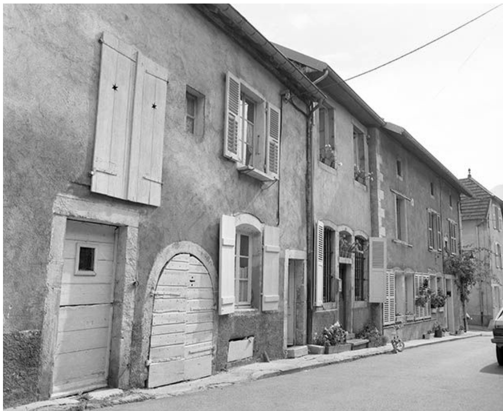
Maisons de la Grande Rue jusqu'à l'angle de la rue de l'Eglise.