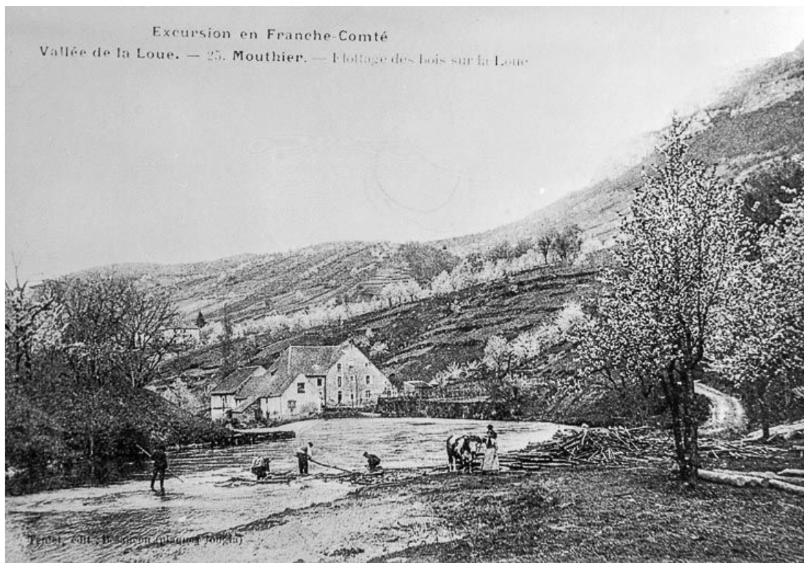
Vallée de la Loue. - 25. MOUTHIER. - Flottage des bois sur la Loue 25, Mouthier-Haute-Pierre