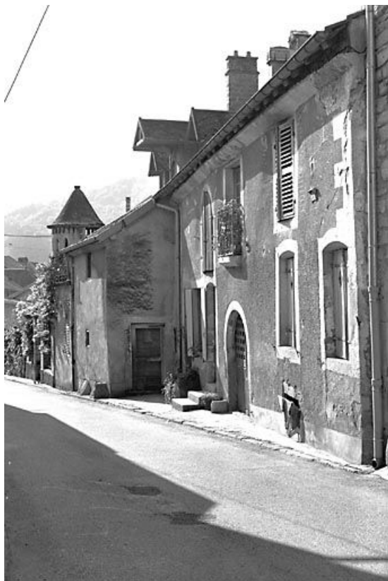
Façade antérieure vue de trois quarts droit. 25, Mouthier-Haute-Pierre