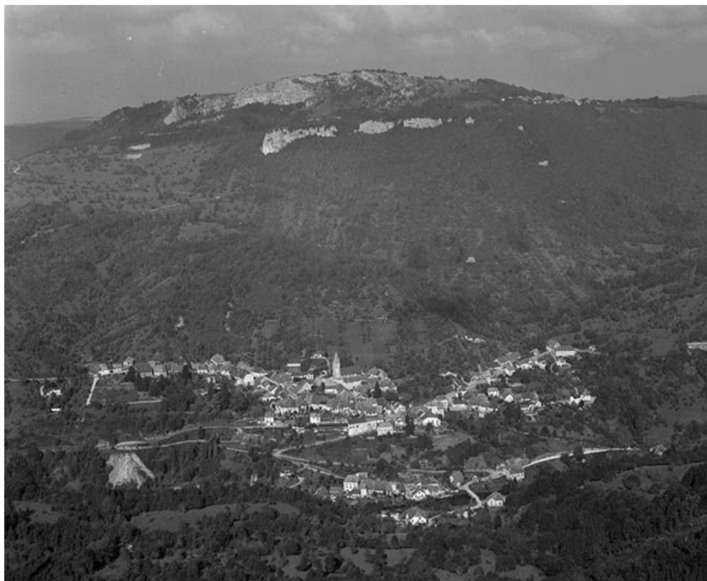
Vue générale depuis le point de vue du Moine de la Vallée. 25, Mouthier-Haute-Pierre