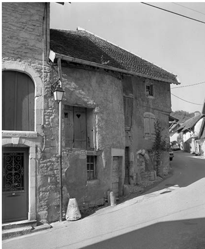
Maison située rue Robert Dame, cadastrée 1971 AB 377. 25, Mouthier-Haute-Pierre