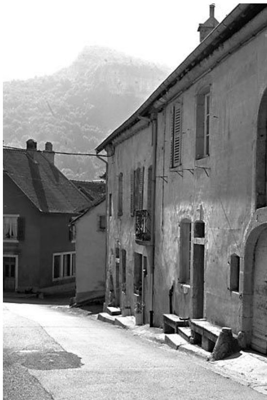
Façade antérieure vue de trois quarts droit. 25, Mouthier-Haute-Pierre