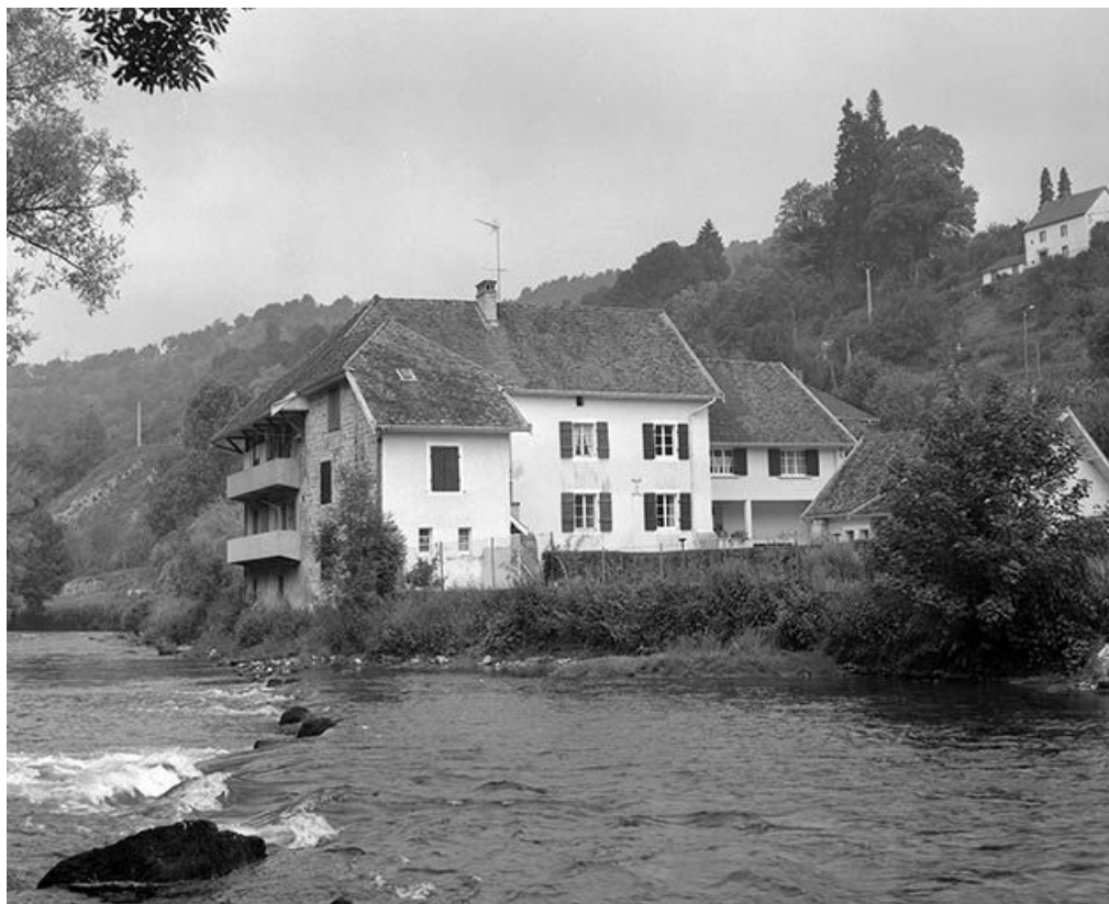
Vue générale de l'ancienne tannerie transformée en logement.