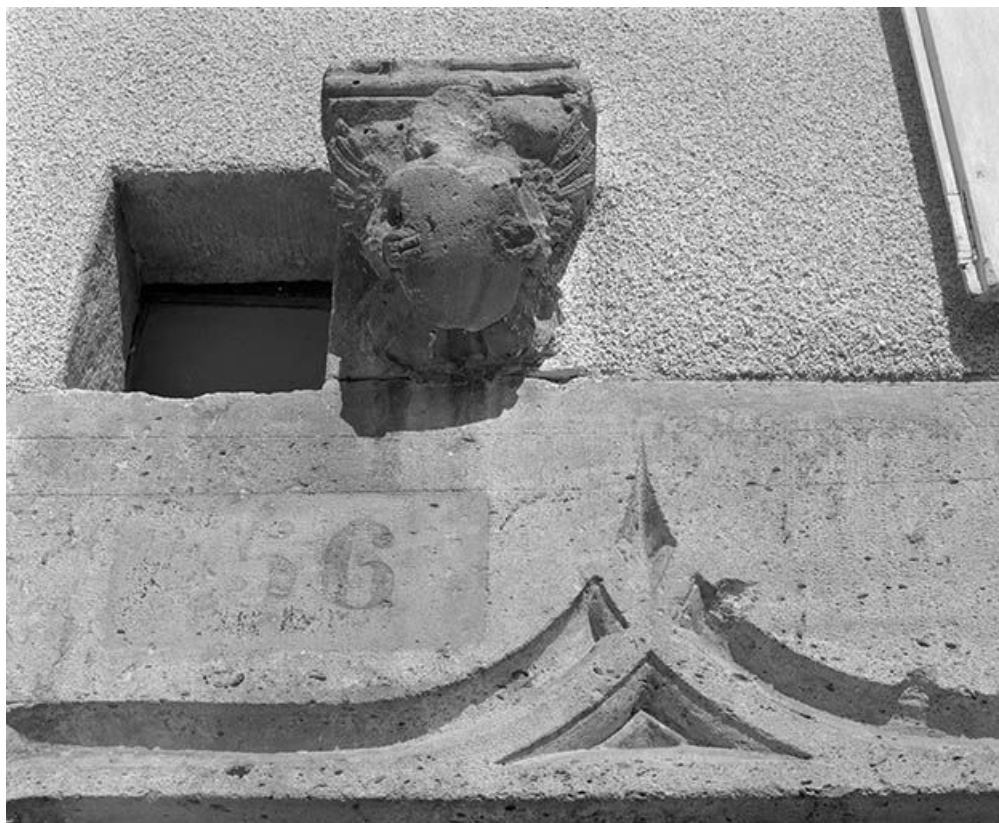
Maison située route d'HautePierre, cadastrée 1971 AB 529 : console au-dessus de la porte piétonne. 25, Mouthier-Haute-Pierre