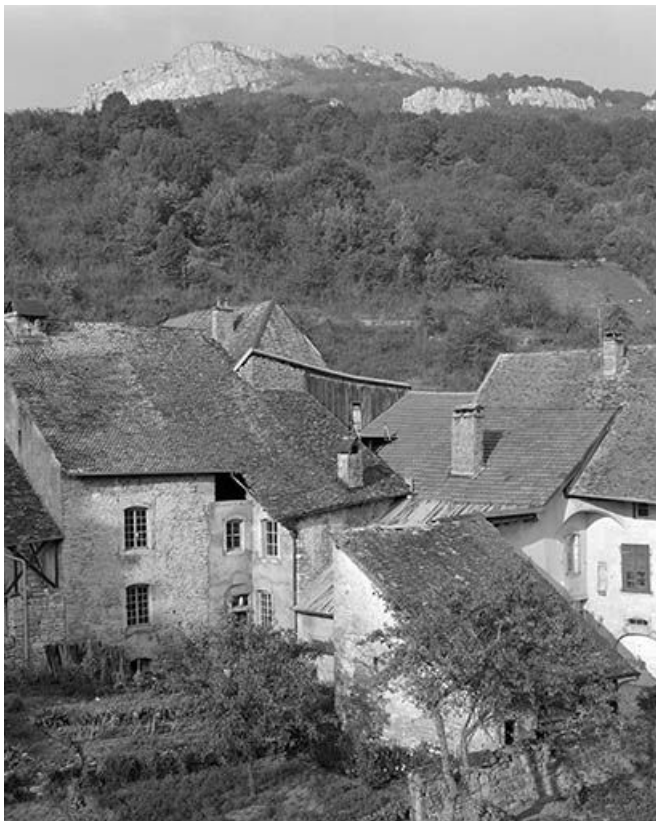
Façades postérieures des maisons cadastrées 1971 AB 376 à 380 de la rue Robert Dame. 25, Mouthier-Haute-Pierre