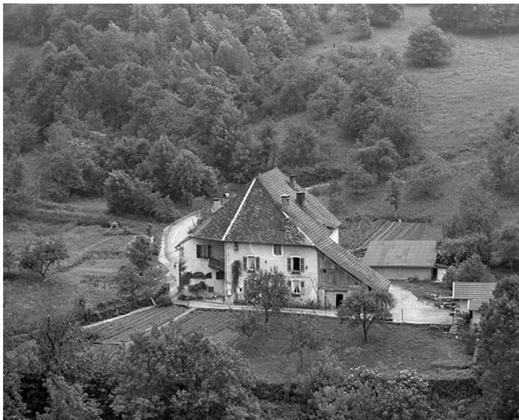
Maison située rue de Longeville. 25, Mouthier-Haute-Pierre