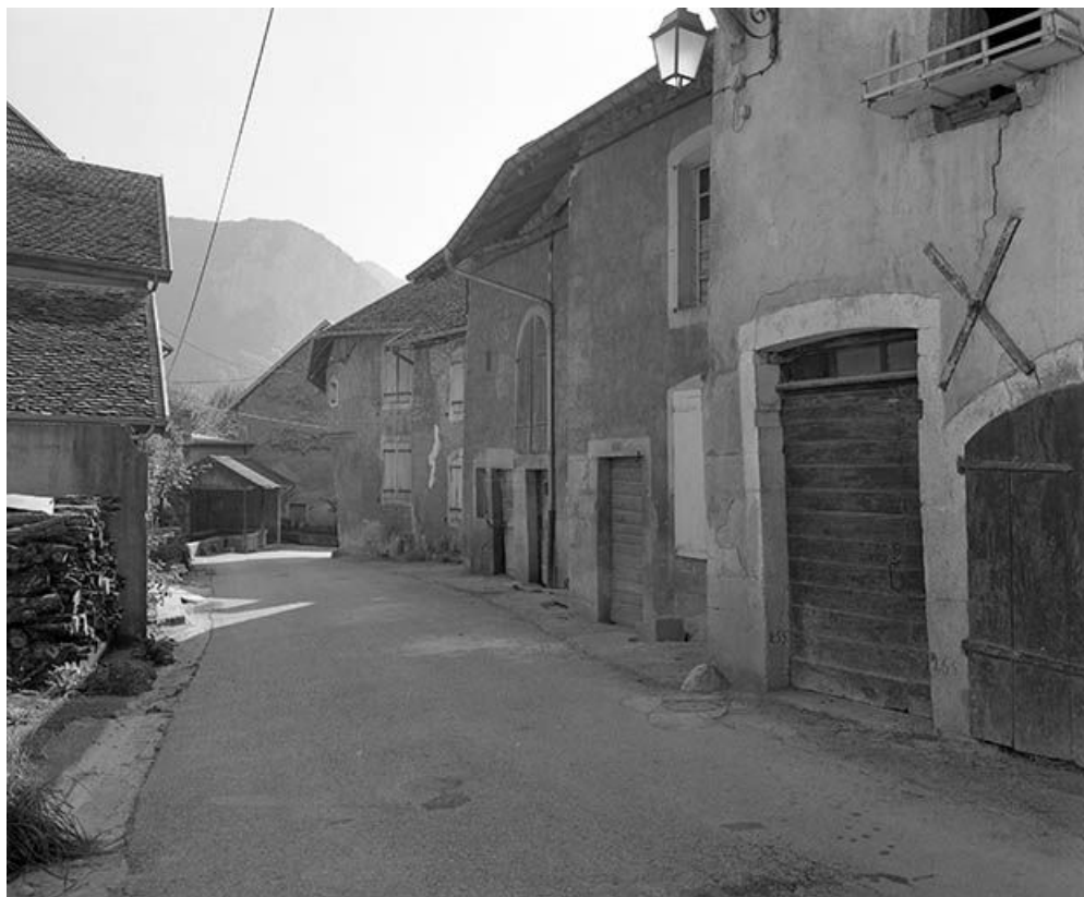
Maisons situées du côté impair de la rue Robert Dame. 25, Mouthier-Haute-Pierre