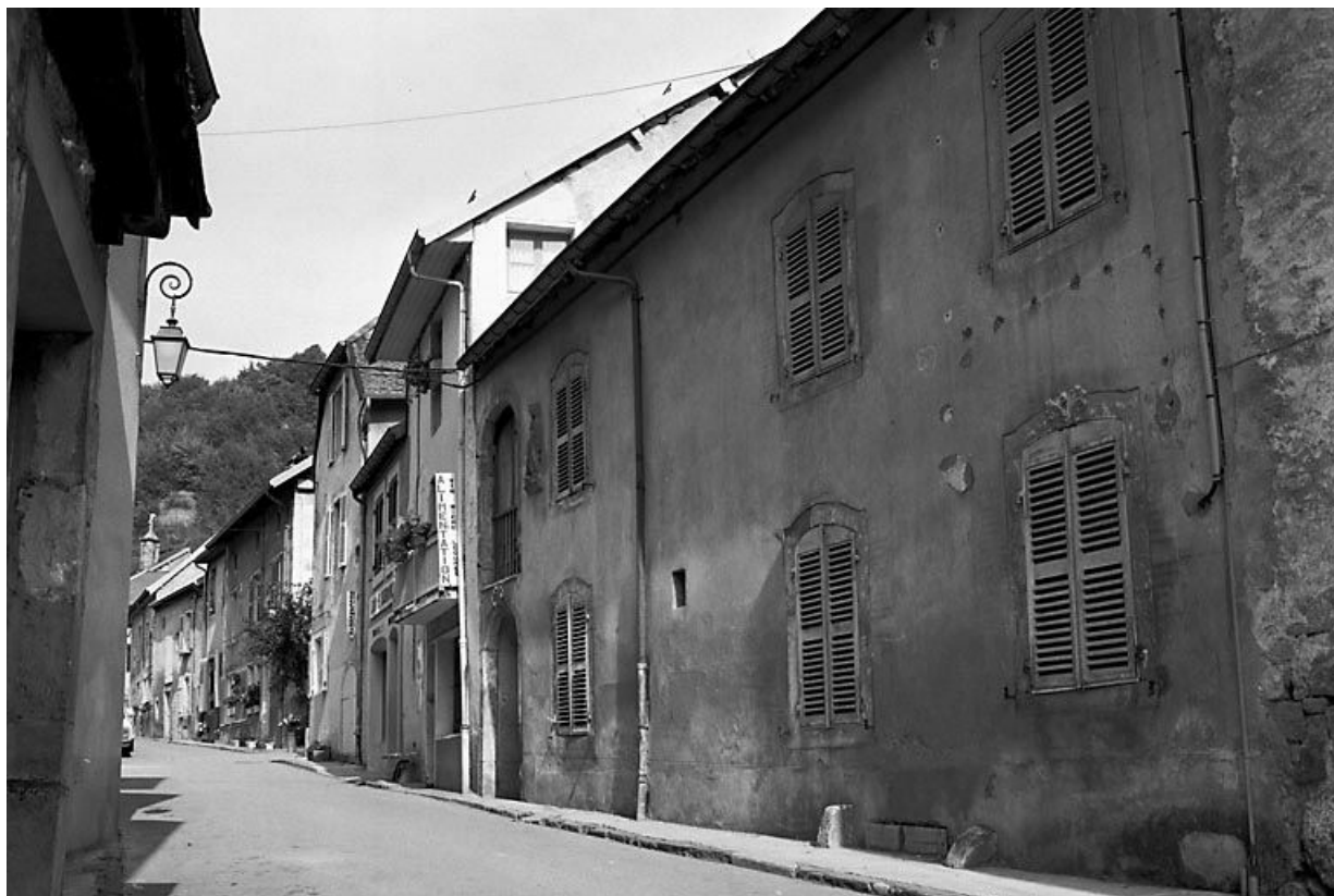
Façade antérieure vue de trois quarts droit. 25, Mouthier-Haute-Pierre