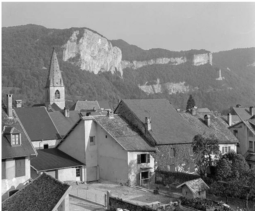
Façades postérieures des maisons de la rue Robert Dame. 25, Mouthier-Haute-Pierre