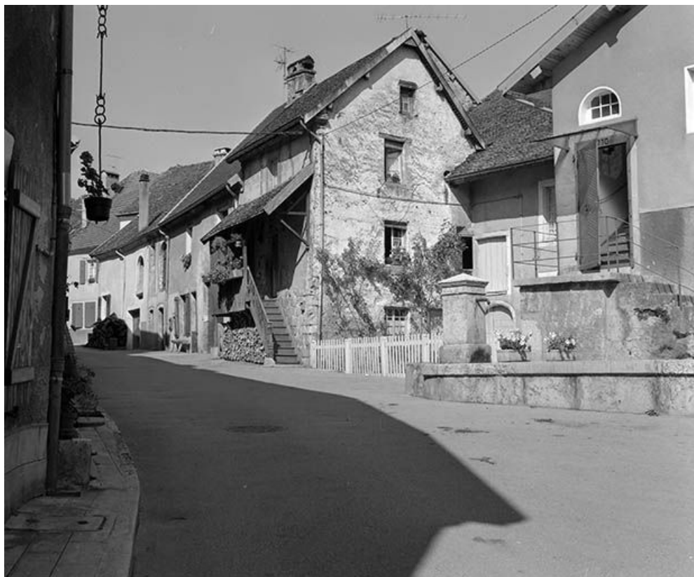
Maisons situées du côté pair de la Grande Rue. 25, Mouthier-Haute-Pierre