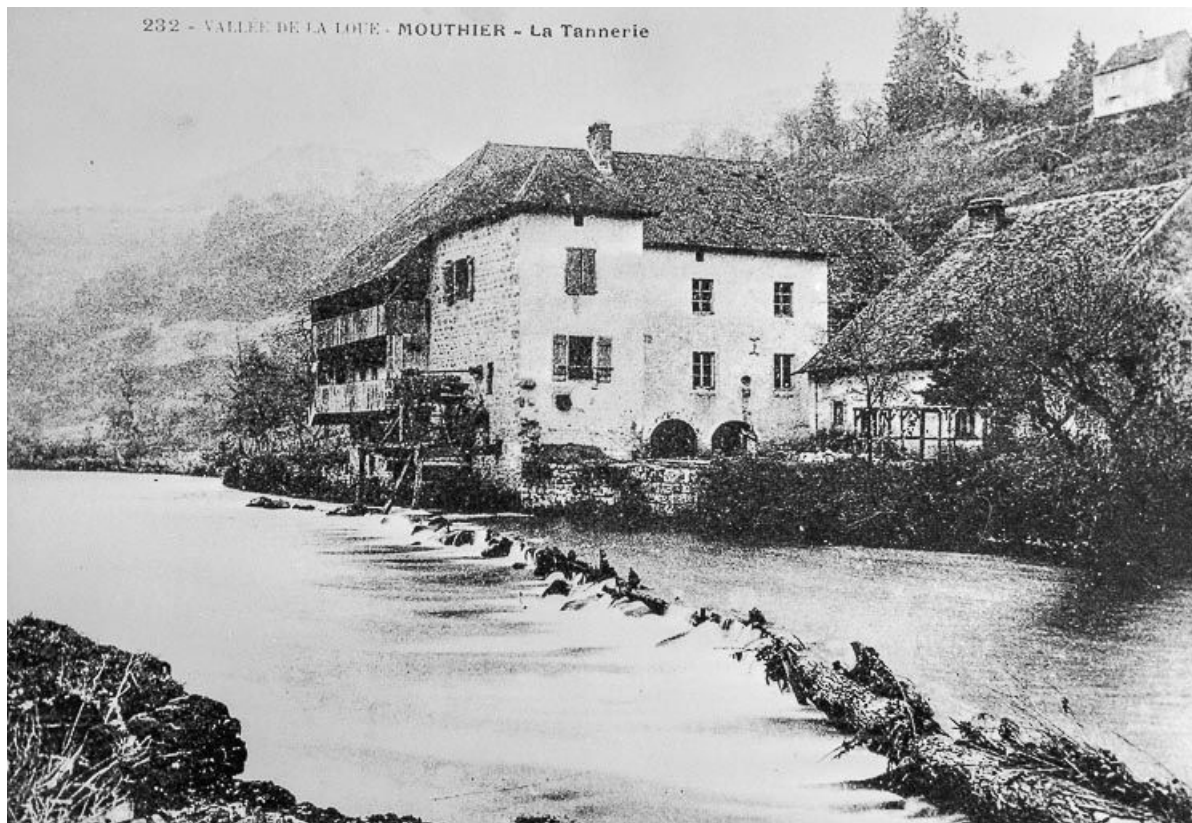
232. Vallée de la Loue. - MOUTHIER. - La Tannerie. 25, Mouthier-Haute-Pierre