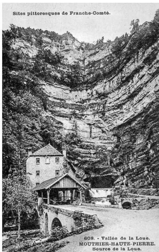
Sites pittoresques de Franche-Comté. 608. - Vallée de la Loue. MOUTHIER-HAUTE-PIERRE. Sources de la Loue. 25, Mouthier-Haute-Pierre