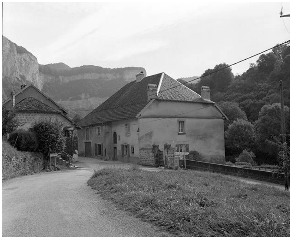
Maison située rue des Guenebard, cadastrée 1971 AB 131. 25, Mouthier-Haute-Pierre