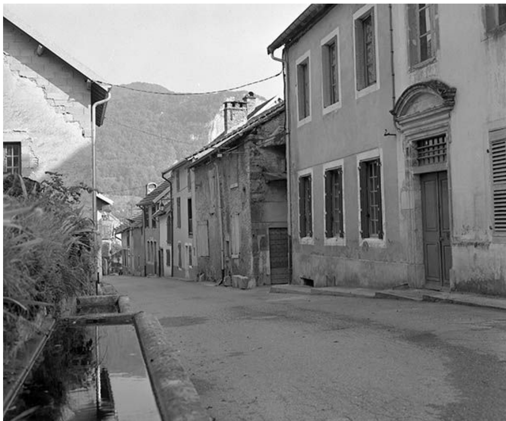
Les maisons en haut de la rue Robert Dame. 25, Mouthier-Haute-Pierre