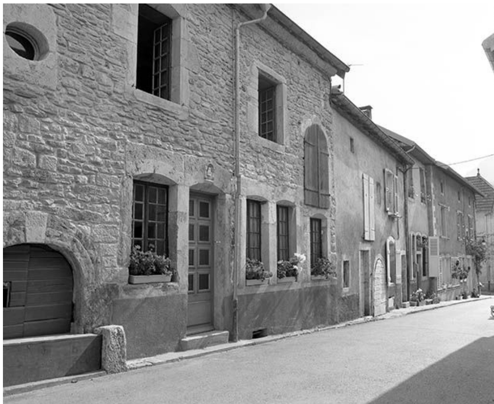
Maisons de la Grande Rue jusqu'à l'angle de la rue de l'Eglise.