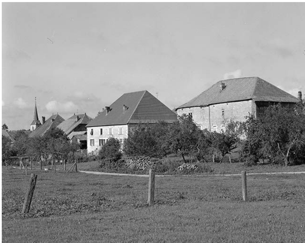
Vue générale du village depuis le sud-est. 25, Longeville