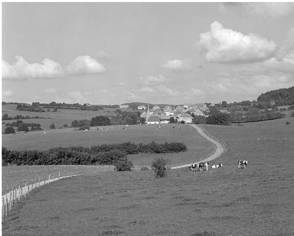
Vue générale du village depuis l'ouest. 25, Longeville