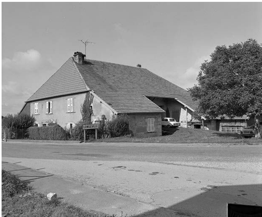
Façade antérieure et face latérale droite.