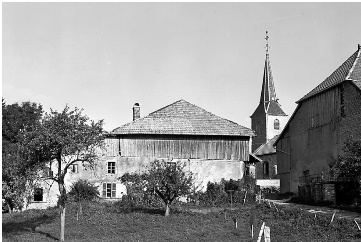
Vue générale. 25, Longeville