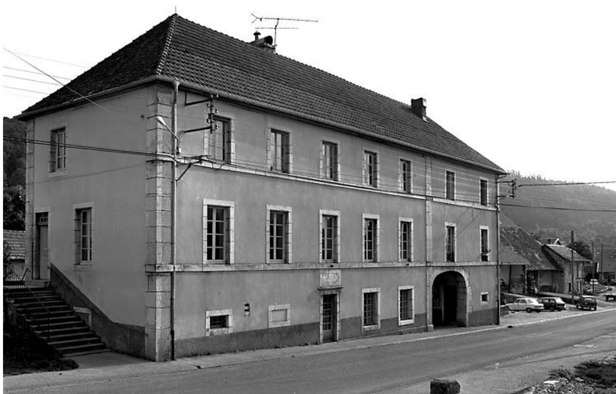
Façade antérieure et face latérale gauche. 25, Longeville