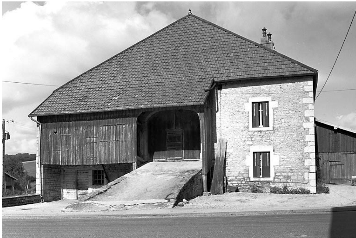
Façade antérieure. 25, Longeville