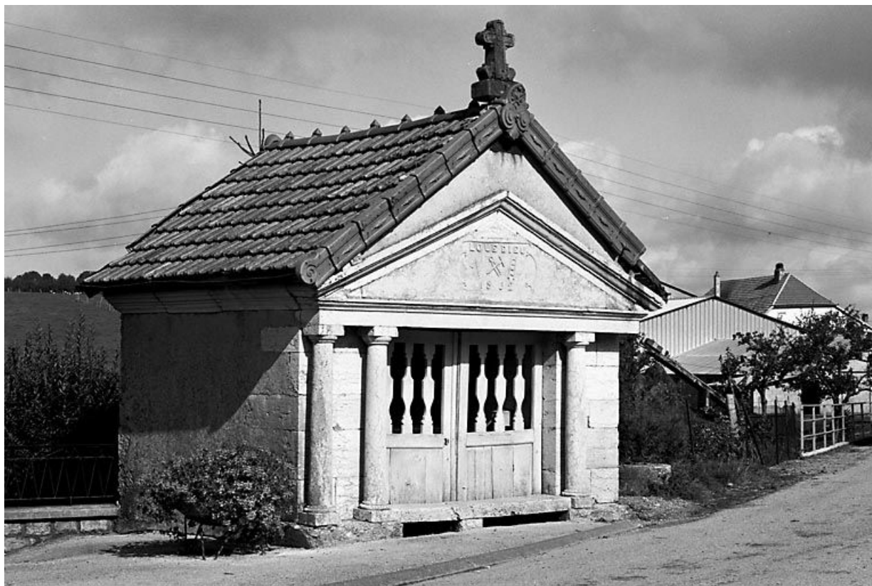
Façade antérieure et face latérale gauche. 25, Longeville