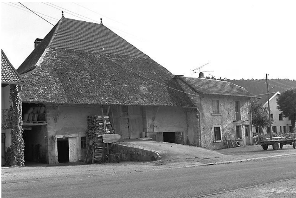
Façade antérieure vue de trois quarts gauche.