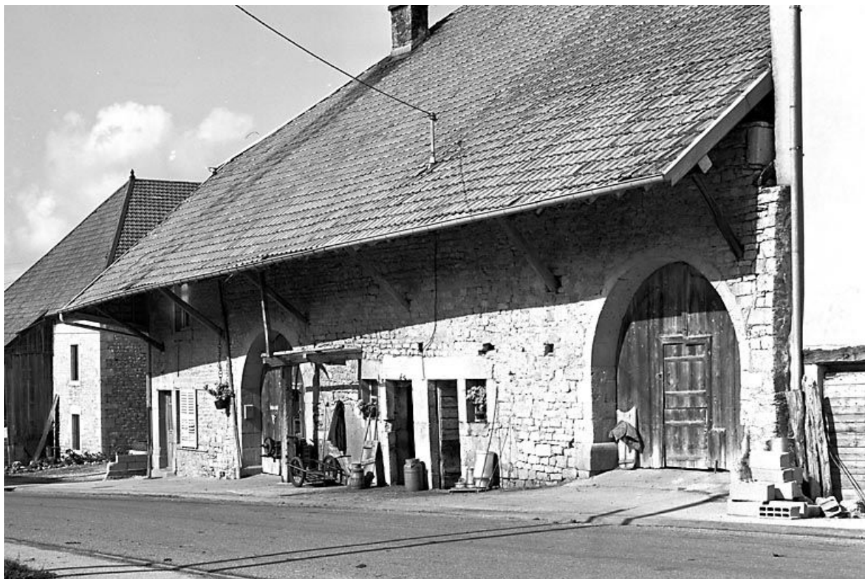
Façade antérieure vue de trois quarts droit. 25, Longeville