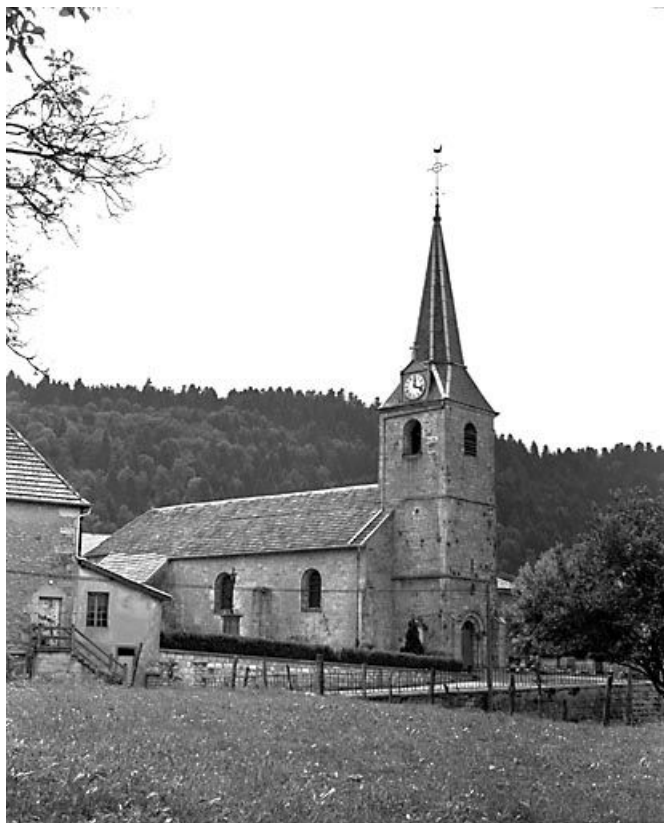
Façade antérieure et face latérale gauche. 25, Longeville