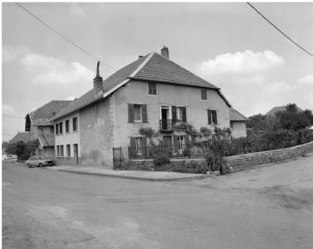
Façade antérieure et face latérale gauche. 25, Lavans-Vuillafans