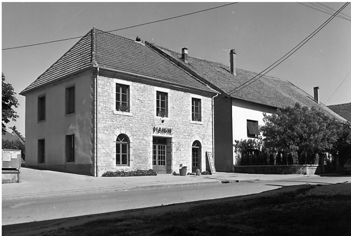
Façade antérieure et face latérale gauche. 25, Lavans-Vuillafans