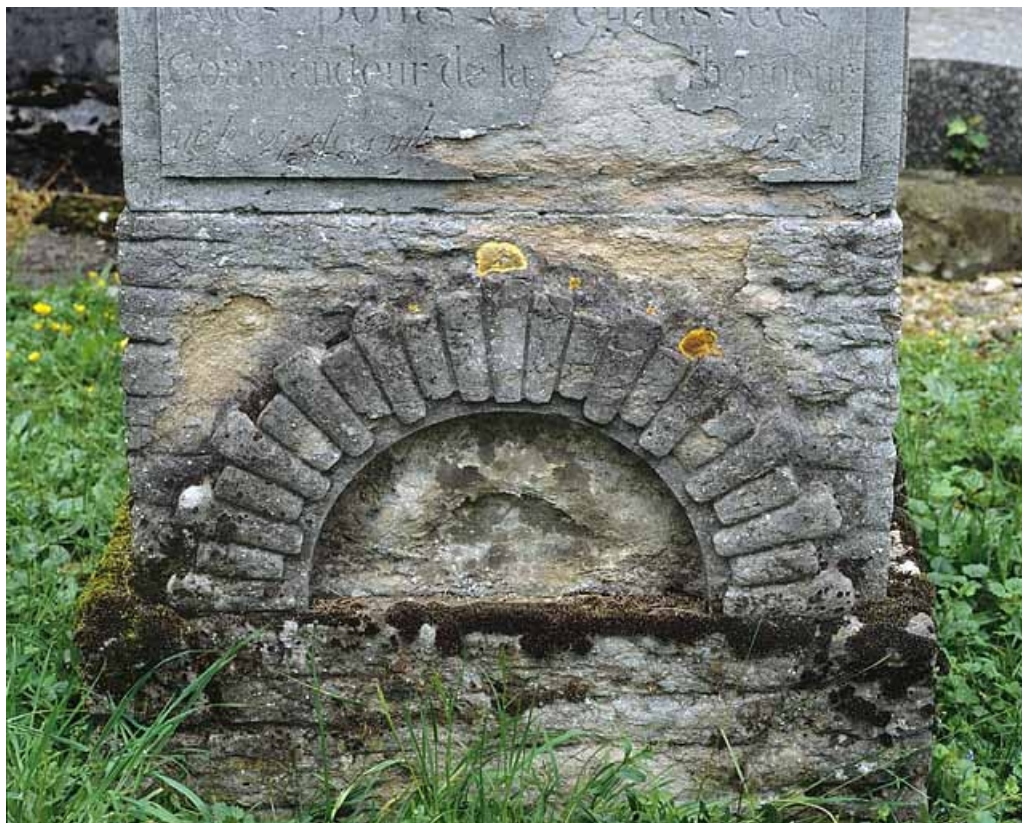
Détail du socle : face antérieure. L'arcade représente l'entrée du tunnel fluvial de Thoraise (Doubs). 25, Besançon rue de l' Eglise