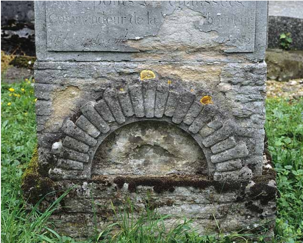
Détail du socle : face antérieure. L'arcade représente l'entrée du tunnel fluvial de Thoraise (Doubs). 25, Besançon rue de l' Eglise