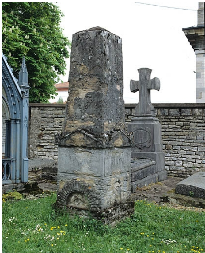
Vue de trois quarts droite.