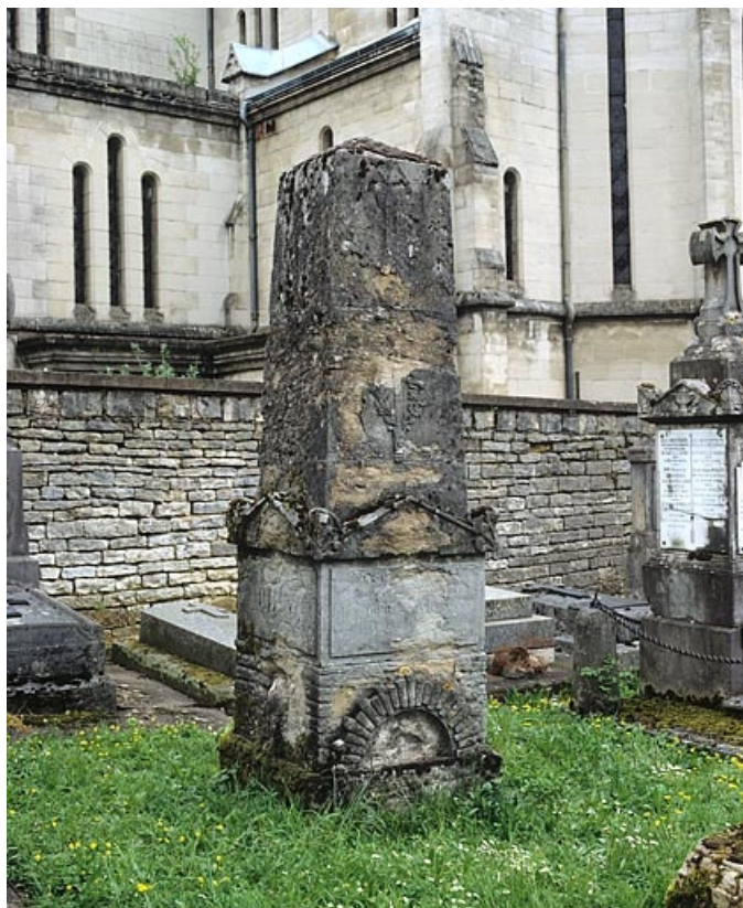
Vue de trois quarts gauche. 25, Besançon rue de l' Eglise