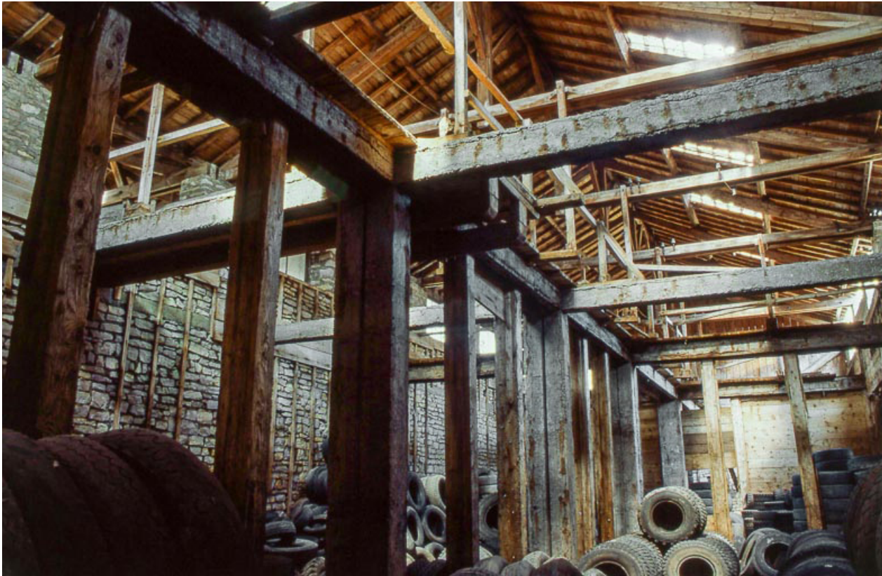
Intérieur d'un magasin industriel.

25, Miserey-Salines, lieudit : aux Salines