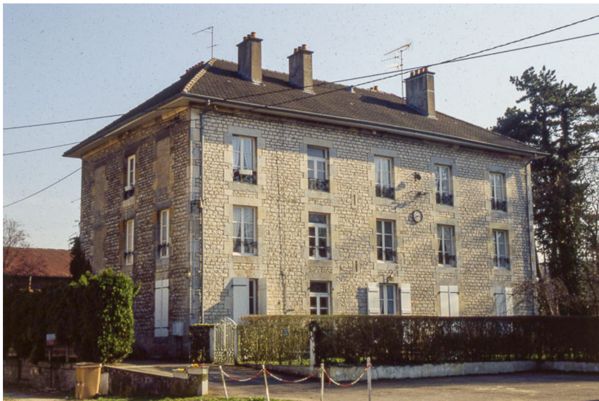
Logement (de contremaître ?) et bureaux vus de trois quarts.

25, Miserey-Salines, lieudit : aux Salines