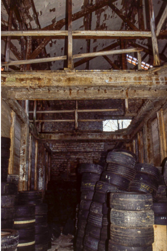
Intérieur d'un magasin industriel.

25, Miserey-Salines, lieudit : aux Salines