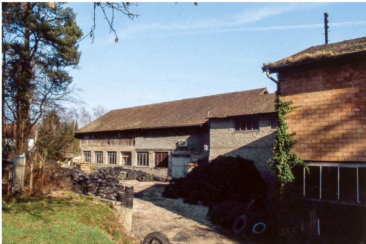
Façades occidentales des magasins industriels.

25, Miserey-Salines, lieudit : aux Salines