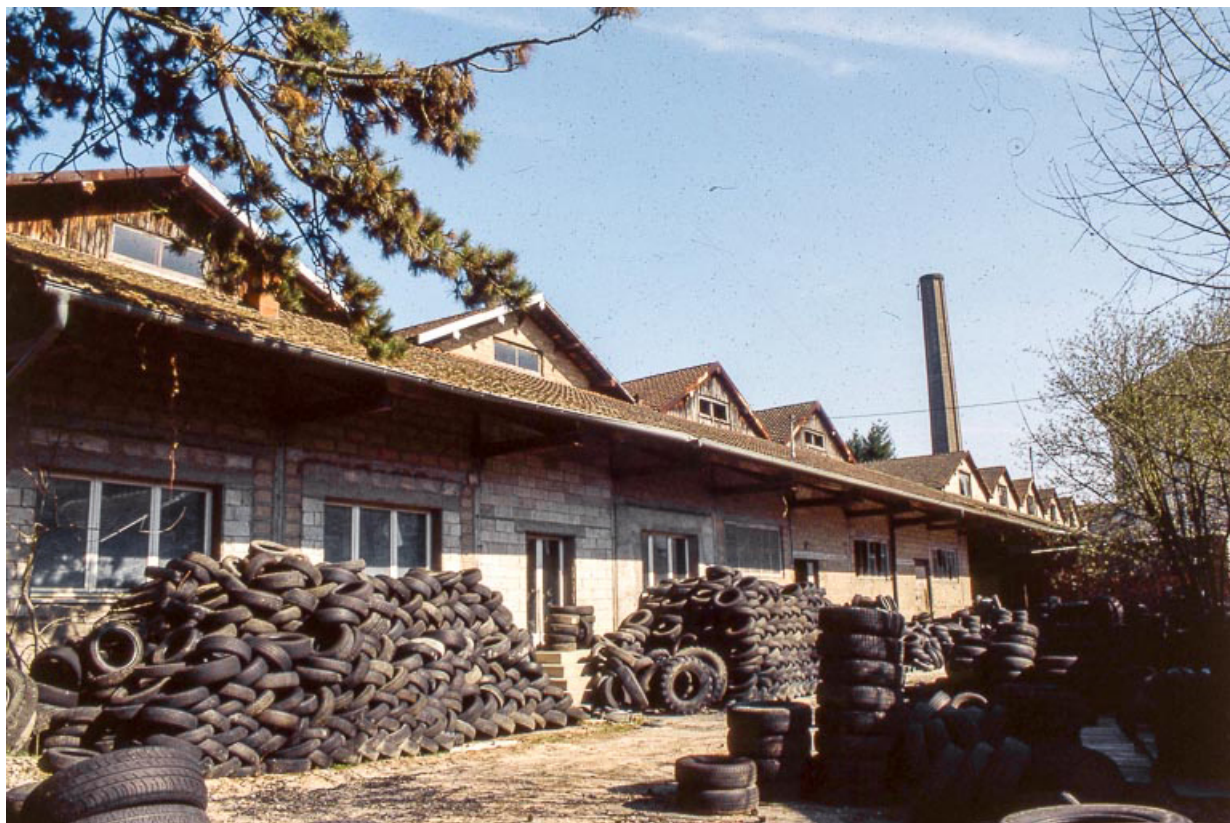
Quai couvert et magasins industriels depuis l'ouest.