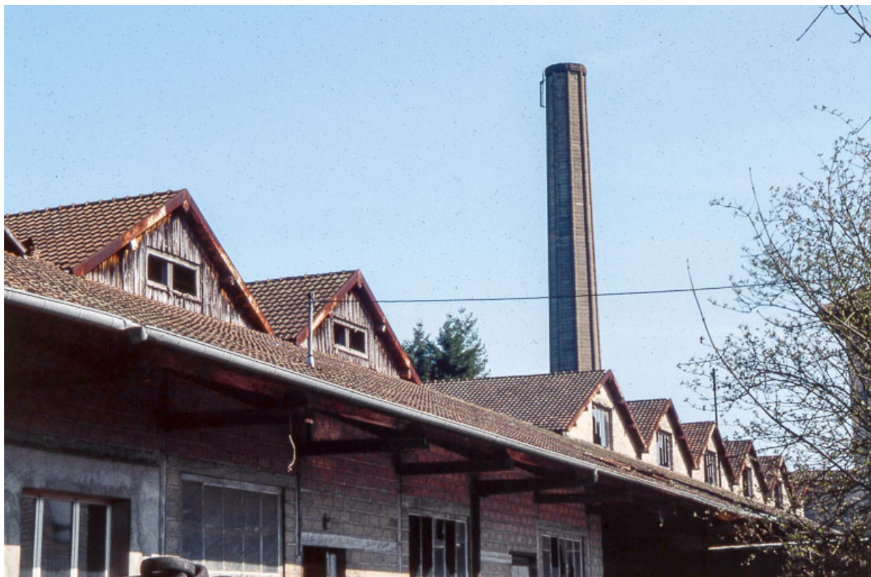
Magasins industriels et quai couvert depuis le sud-ouest.

25, Miserey-Salines, lieudit : aux Salines