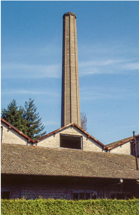
Quai couvert, magasins industriels et cheminée.

25, Miserey-Salines, lieudit : aux Salines