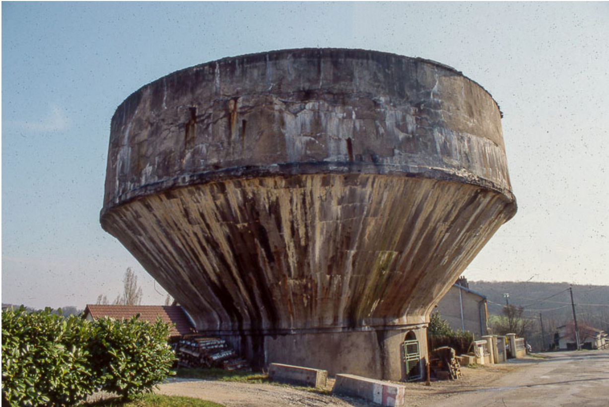
Réservoir industriel (depuis le nord).

25, Miserey-Salines, lieudit : aux Salines