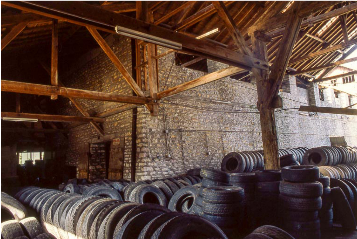
Charpente du quai et magasin industriel.

25, Miserey-Salines, lieudit : aux Salines