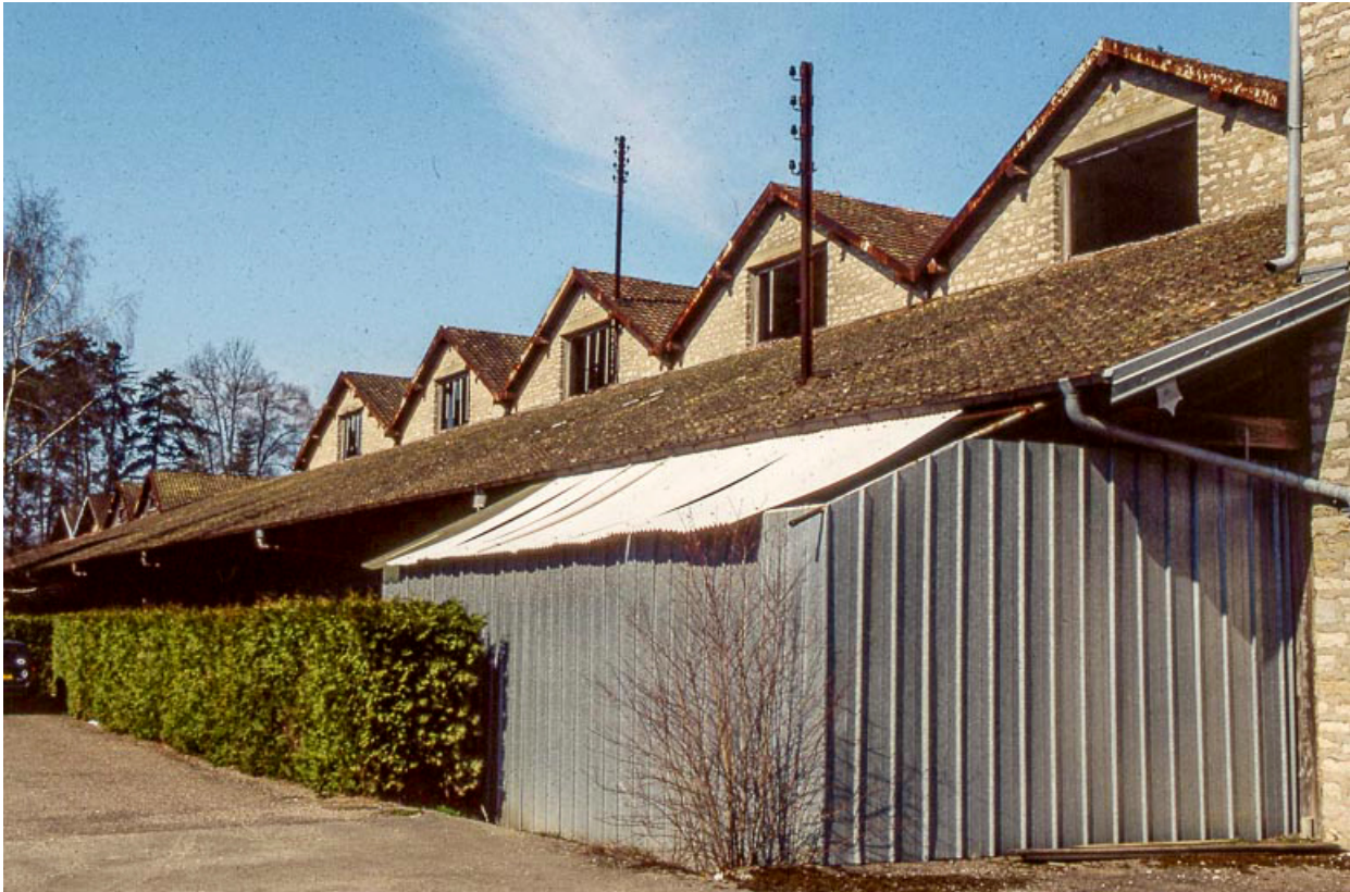
Quai couvert et magasins industriels depuis le sud.

25, Miserey-Salines, lieudit : aux Salines