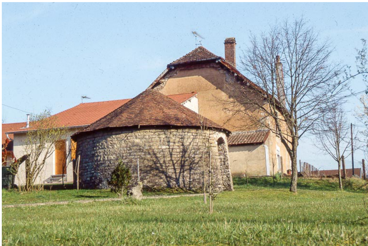
Soubassement en moellon calcaire d'un réservoir à saumure.

25, Miserey-Salines, lieudit : aux Salines