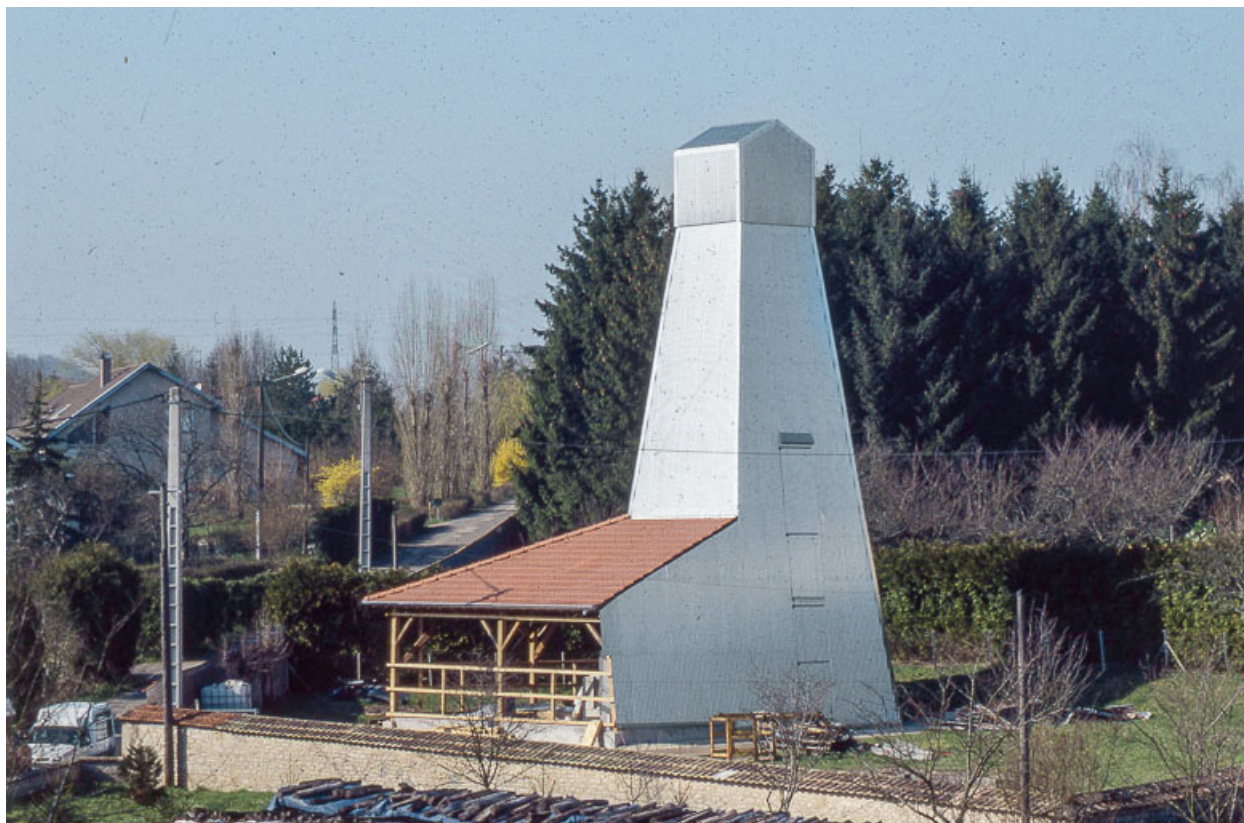
Puits de sondage sud : vue de trois quarts.

25, Miserey-Salines, lieudit : aux Salines