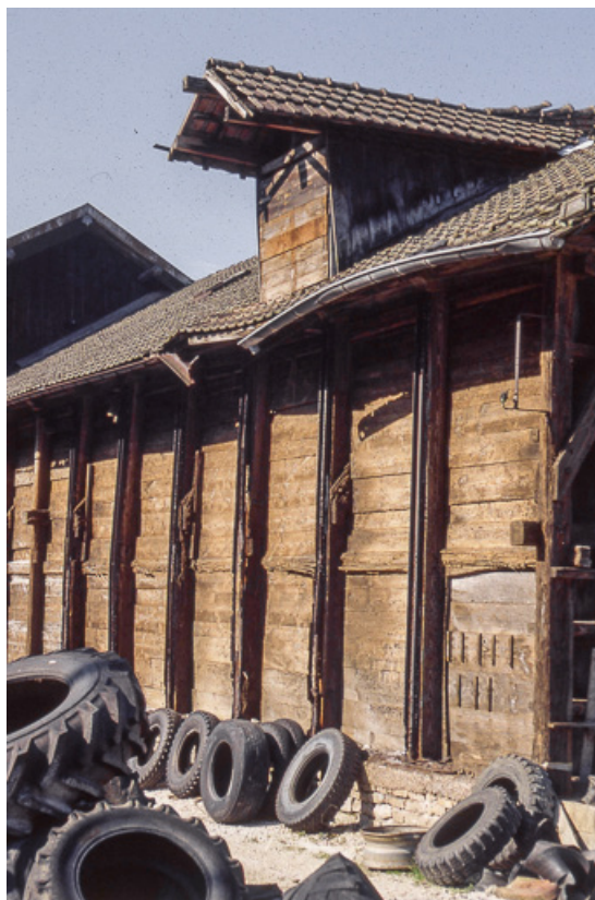
Détail de façade d'un magasin industriel.

25, Miserey-Salines, lieudit : aux Salines