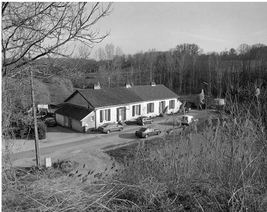
Logement d'ouvriers (19 rue des Saulniers). 25, Miserey-Salines, lieudit : aux Salines