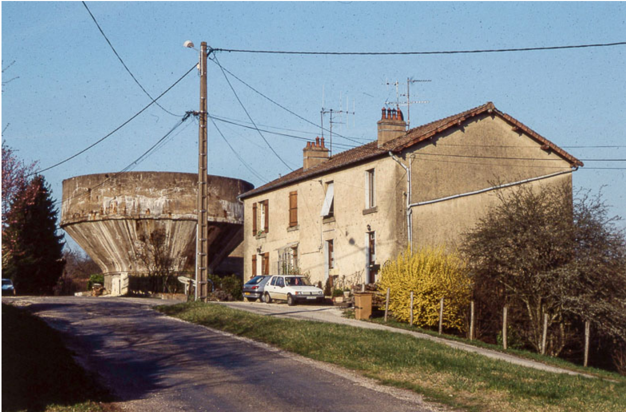
Réservoir industriel (saumure) et logement d'ouvriers.

25, Miserey-Salines, lieudit : aux Salines