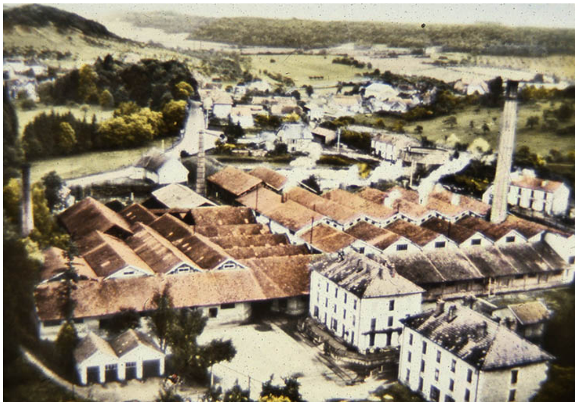
En avion au-dessus de... Miserey-Salines (Doubs). Les Salines.