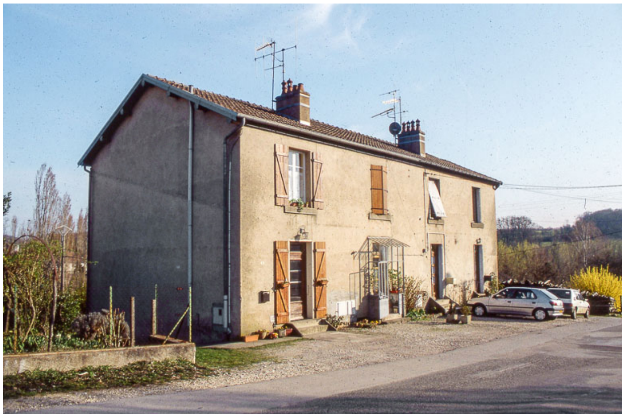
Logement d'ouvriers (9 rue des Saulniers).

25, Miserey-Salines, lieudit : aux Salines