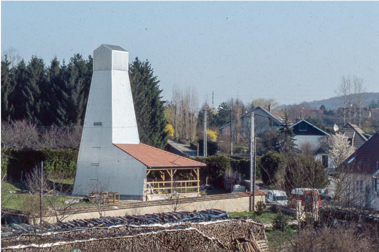
Puits de sondage nord (en service) depuis l'entrée.

25, Miserey-Salines, lieudit : aux Salines