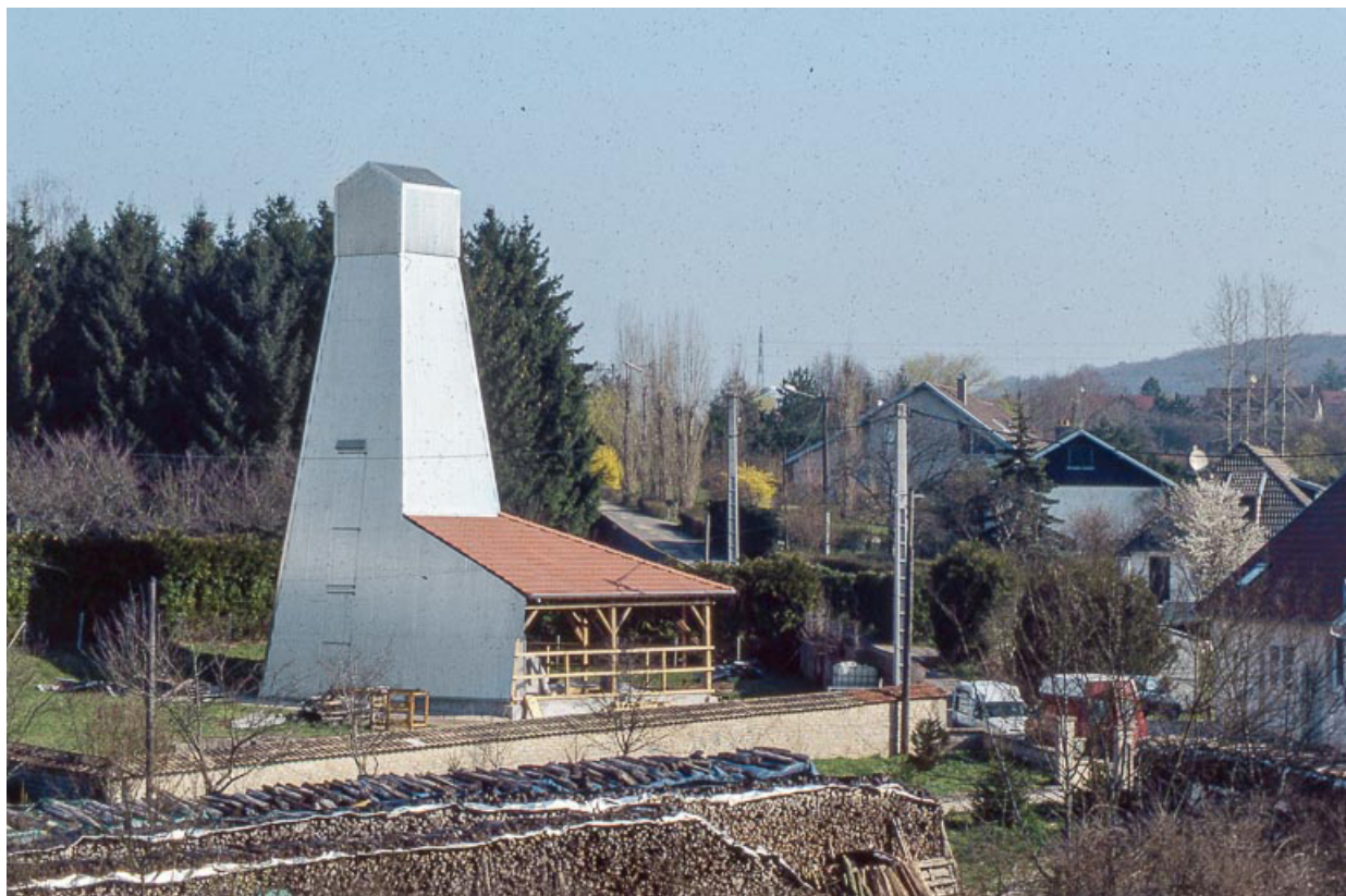
Puits de sondage nord (en service) depuis l'entrée.

25, Miserey-Salines, lieudit : aux Salines