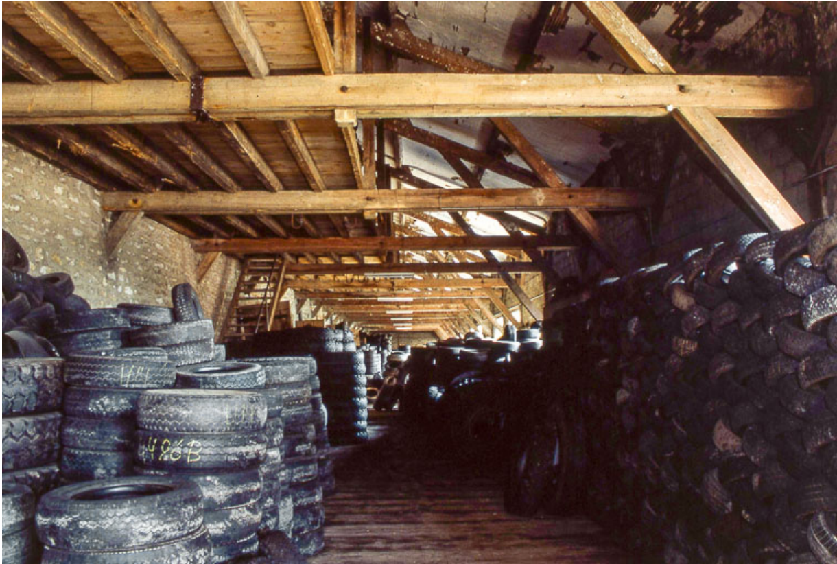
Intérieur d'un quai couvert.

25, Miserey-Salines, lieudit : aux Salines