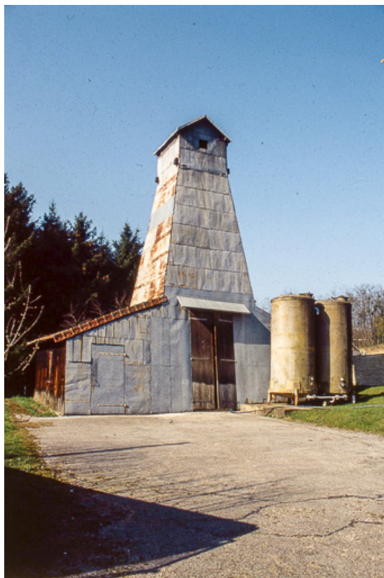
Puits de sondage nord (en service) depuis l'entrée. 25, Miserey-Salines, lieudit : aux Salines