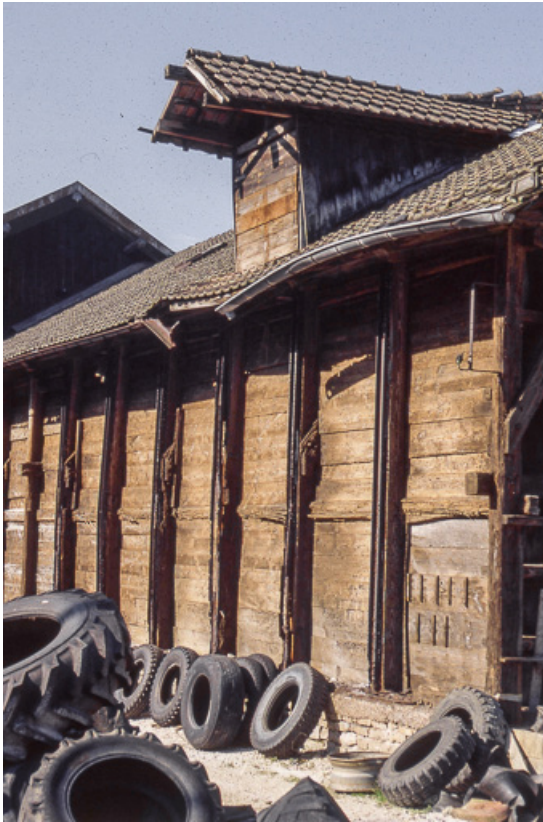
Détail de façade d'un magasin industriel.

25, Miserey-Salines, lieudit : aux Salines