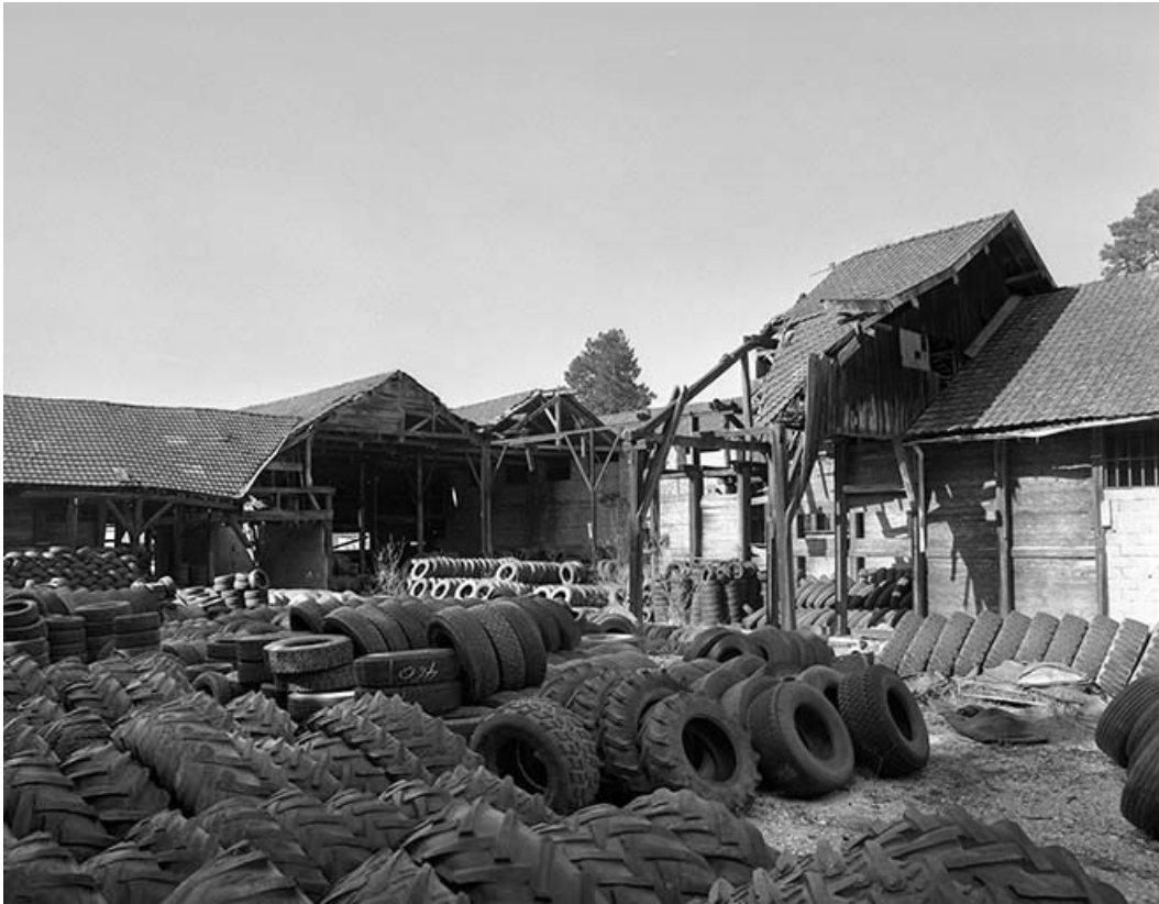
Magasins industriels depuis le nord.

25, Miserey-Salines, lieudit : aux Salines