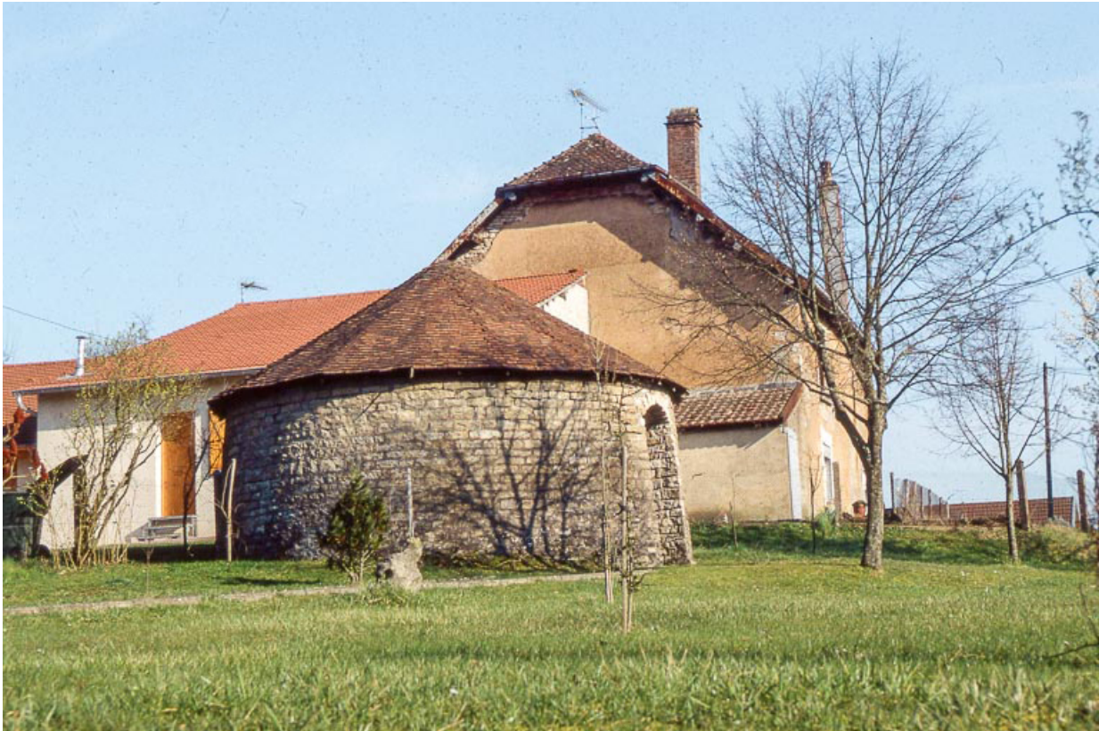
Soubassement en moellon calcaire d'un réservoir à saumure.

25, Miserey-Salines, lieudit : aux Salines