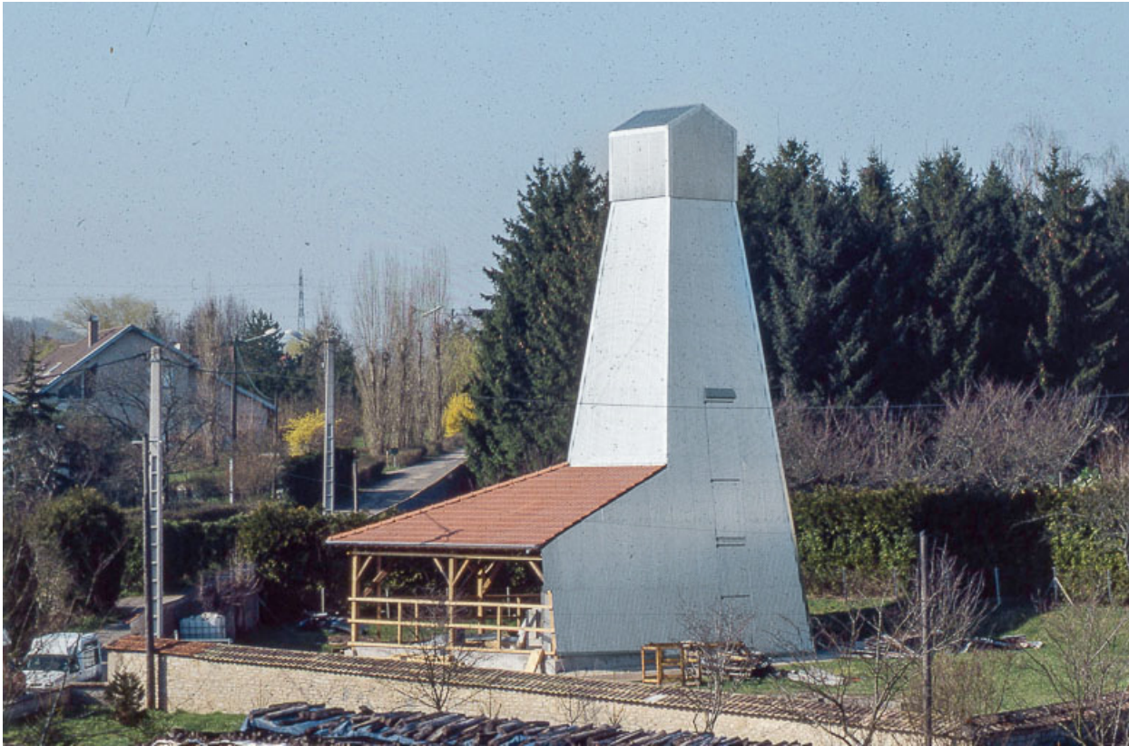
Puits de sondage sud : vue de trois quarts.

25, Miserey-Salines, lieudit : aux Salines