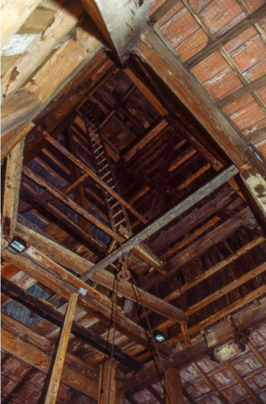
Puits de sondage nord : intérieur

25, Miserey-Salines, lieudit : aux Salines