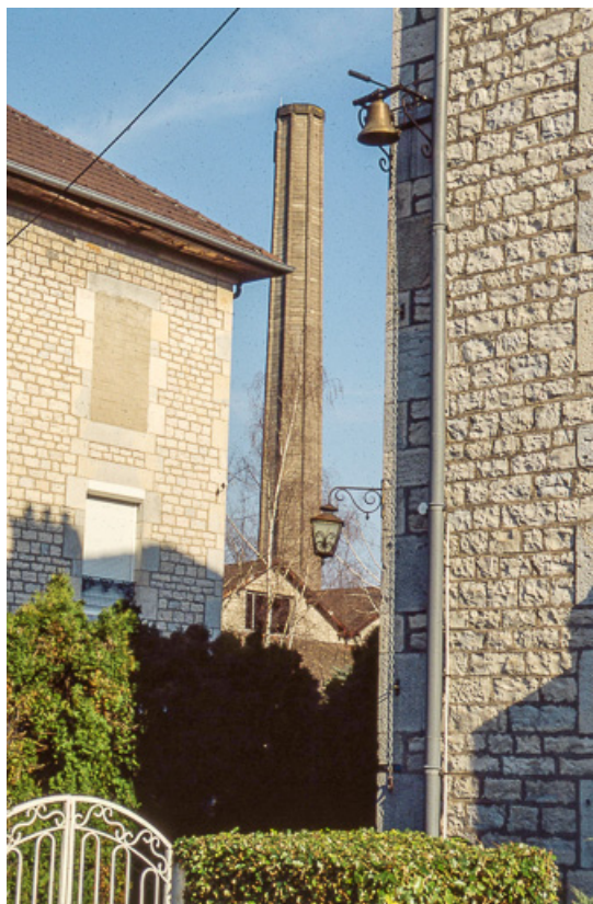
Bureaux, logements et cheminée.

25, Miserey-Salines, lieudit : aux Salines