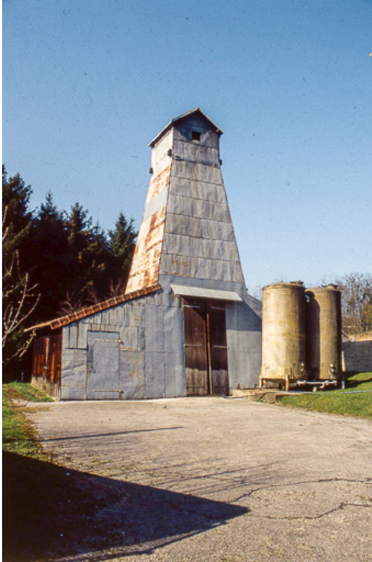
Puits de sondage nord (en service) depuis l'entrée.

25, Miserey-Salines, lieudit : aux Salines