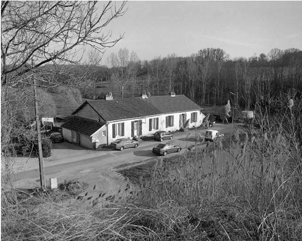
Logement d'ouvriers (19 rue des Saulniers).

25, Miserey-Salines, lieudit : aux Salines