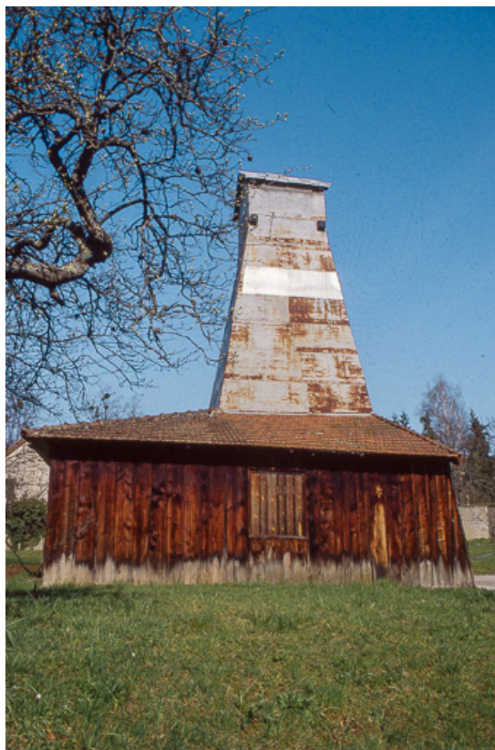
Puits de sondage nord : vue de côté.