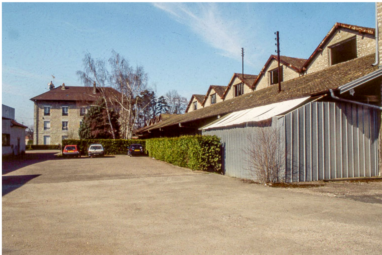
Logement patronal, quai couvert et magasins industriels.