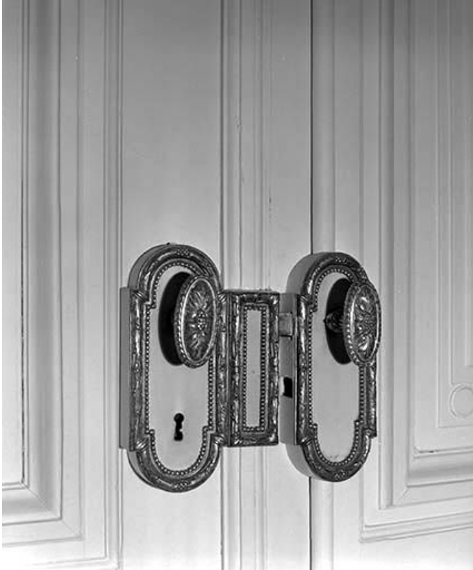
Détail d'une poignée de porte du salon d'angle.