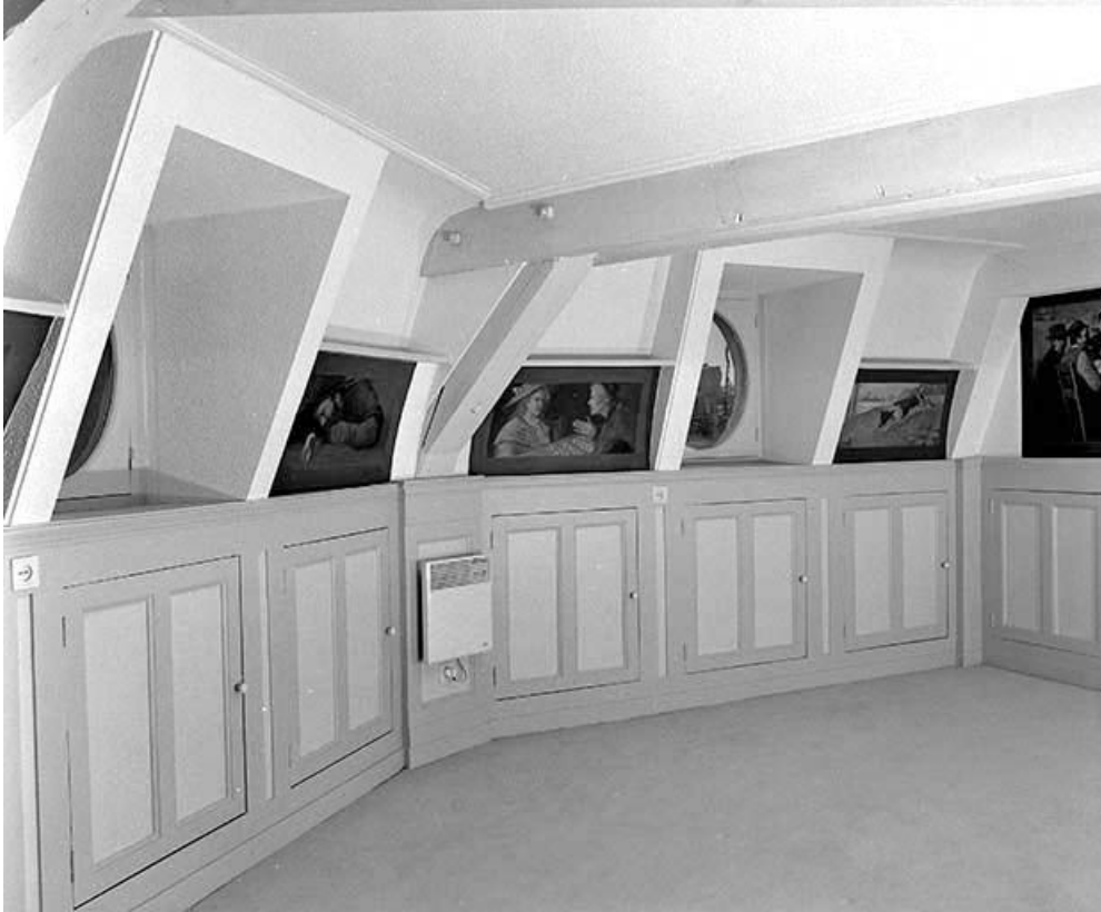
Salon situé à l'étage de comble, côté droit depuis l'entrée.