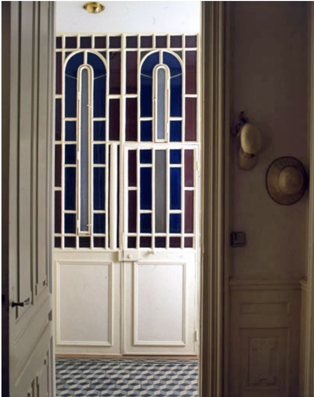
Porte ouvrant sur l'ascenseur au 4ème étage.