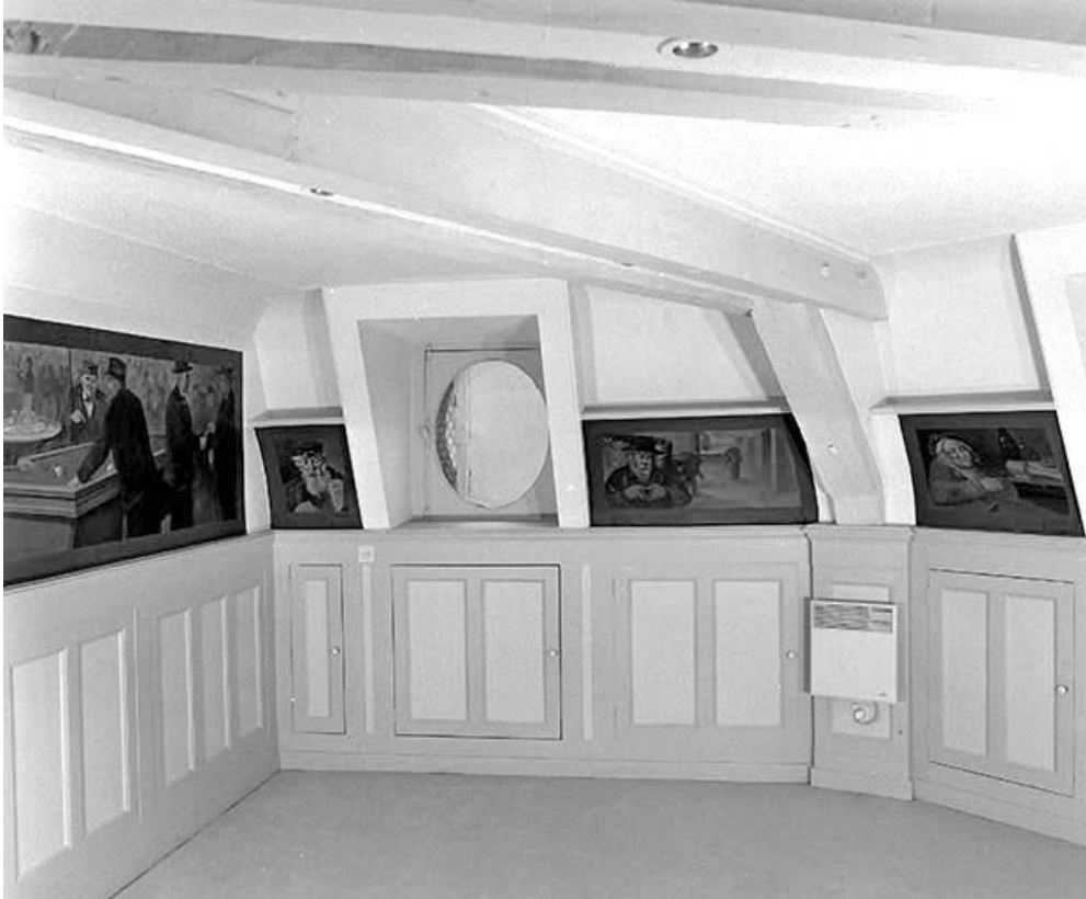
Salon situé à l'étage de comble, côté gauche depuis l'entrée.