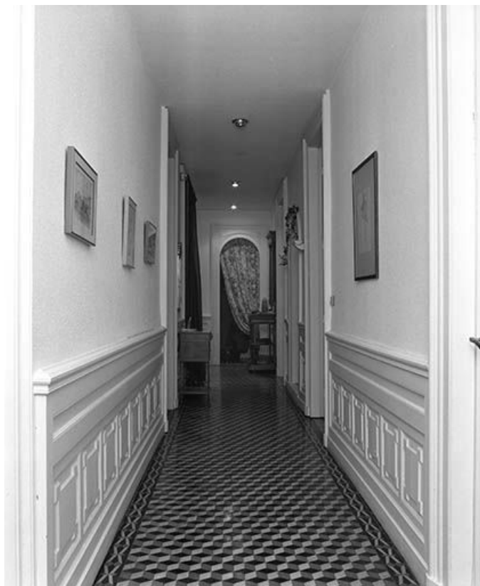
Vue générale du couloir du 4ème étage depuis le salon d'angle.