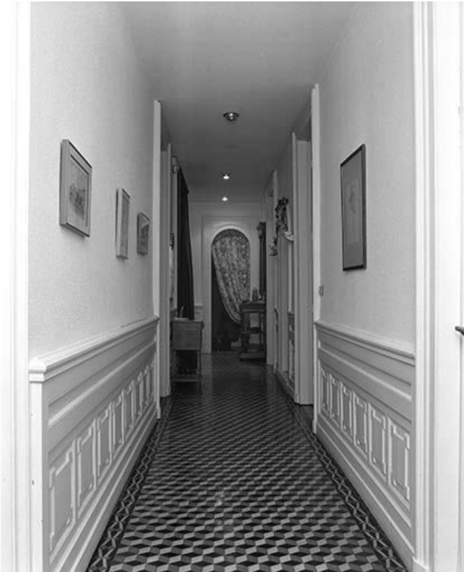
Vue générale du couloir du 4ème étage depuis le salon d'angle.