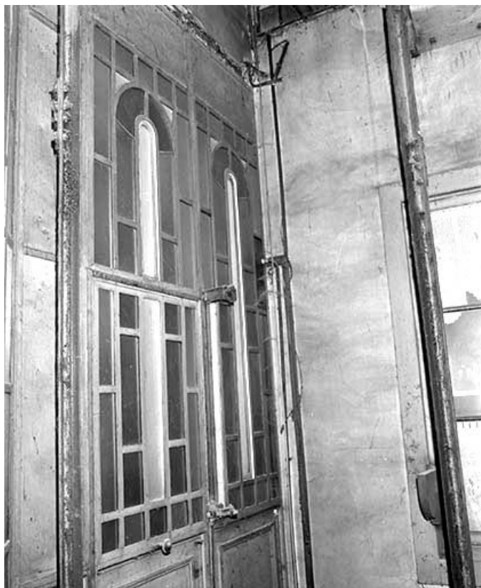
Intérieur de la cage de l'ascenseur, porte ouvrant sur le couloir du 4ème étage. 25, Besançon, 7 rue de la Mouillère