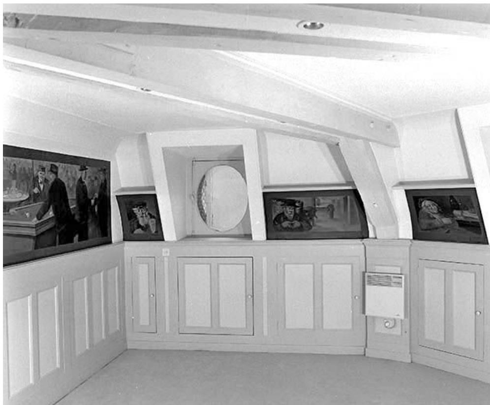
Salon situé à l'étage de comble, côté gauche depuis l'entrée.