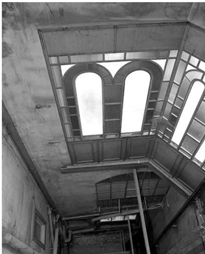
Intérieur de la cage de l'ascenseur vu en plongée depuis le 4ème étage. 25, Besançon, 7 rue de la Mouillère