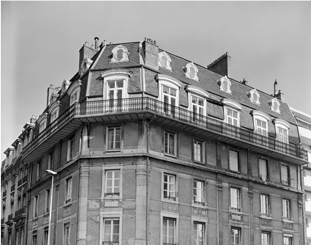
Vue générale des étages supérieurs.