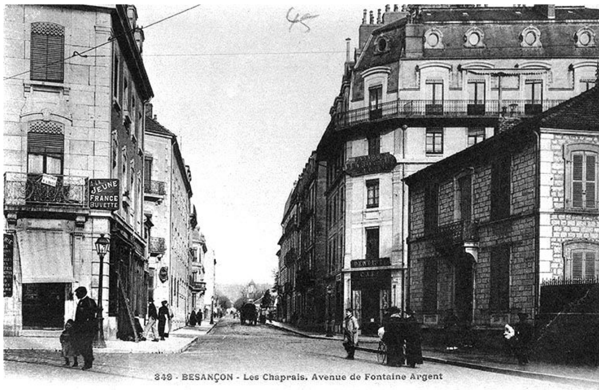
BESANÇON - Les Chaprais. Avenue Fontaine Argent, carte postale, s.d. [vers 1910] 25, Besançon, 7 rue de la Mouillère