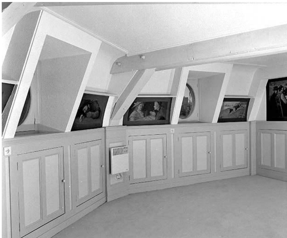
Salon situé à l'étage de comble, côté droit depuis l'entrée.