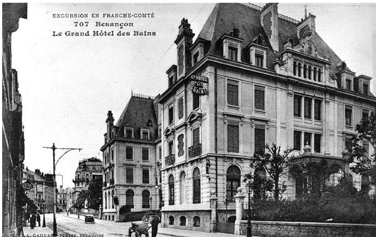
BESANÇON - Le Grand Hôtel des Bains, carte postale, s.d. [vers 1900] 25, Besançon, 7 rue de la Mouillère

Carte postale, s.d. [vers 1900], par Gaillard-Prêtre, L. (éditeur)