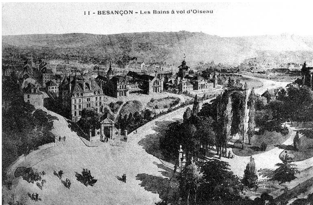
BESANÇON - Les Bains à vol d'oiseau, carte postale, s.d. [vers 1900]