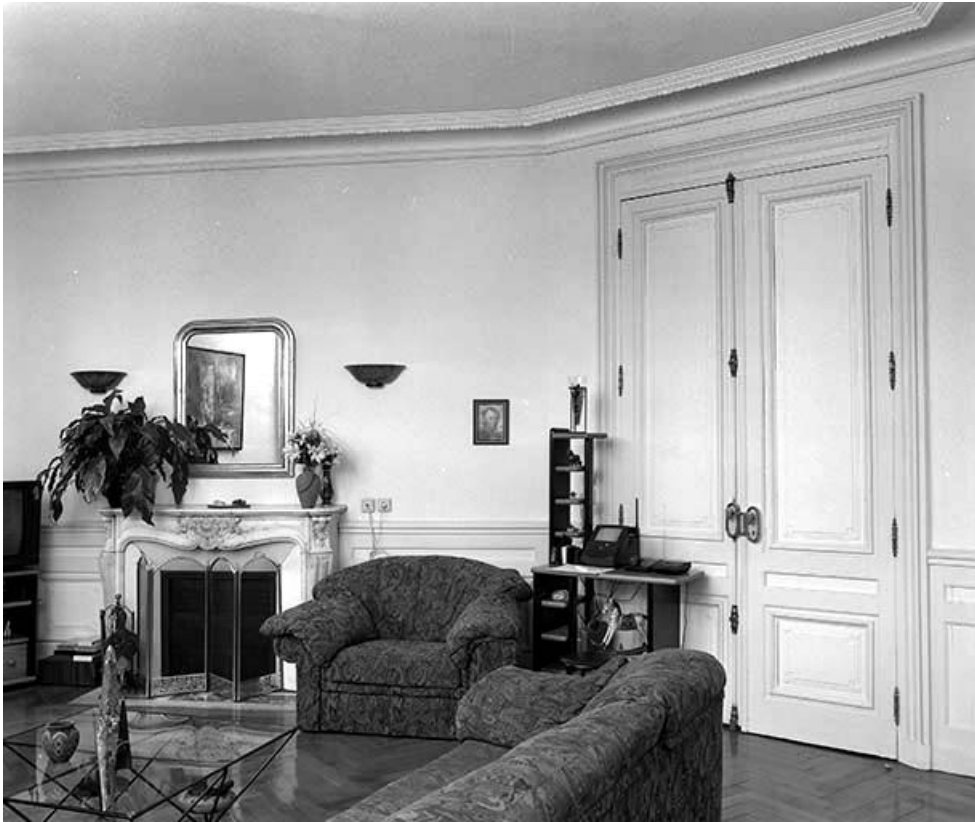
Vue générale du salon au 4ème étage, à l'angle de la rue Fontaine Argent et de la rue de la Mouillère. 25, Besançon, 7 rue de la Mouillère