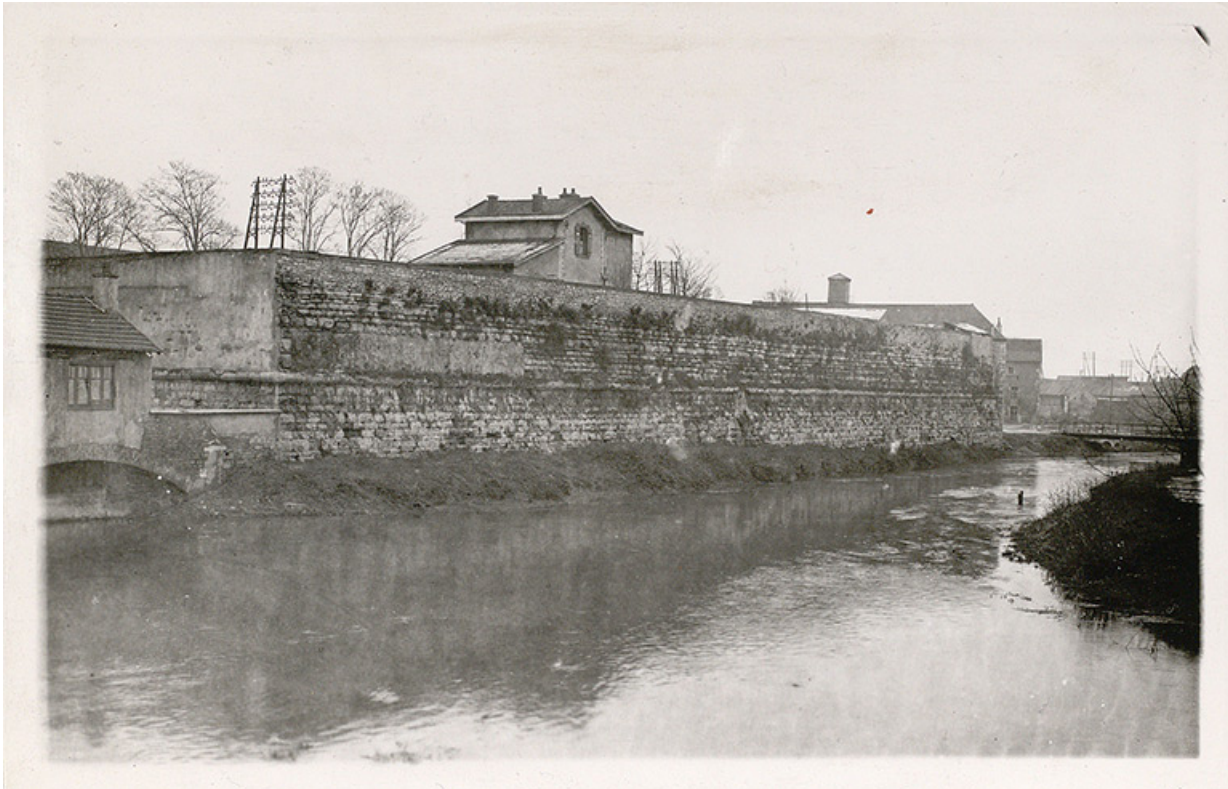
Bastion de Guise surplombant le bief de l'Ouche. 1944. 21, Dijon