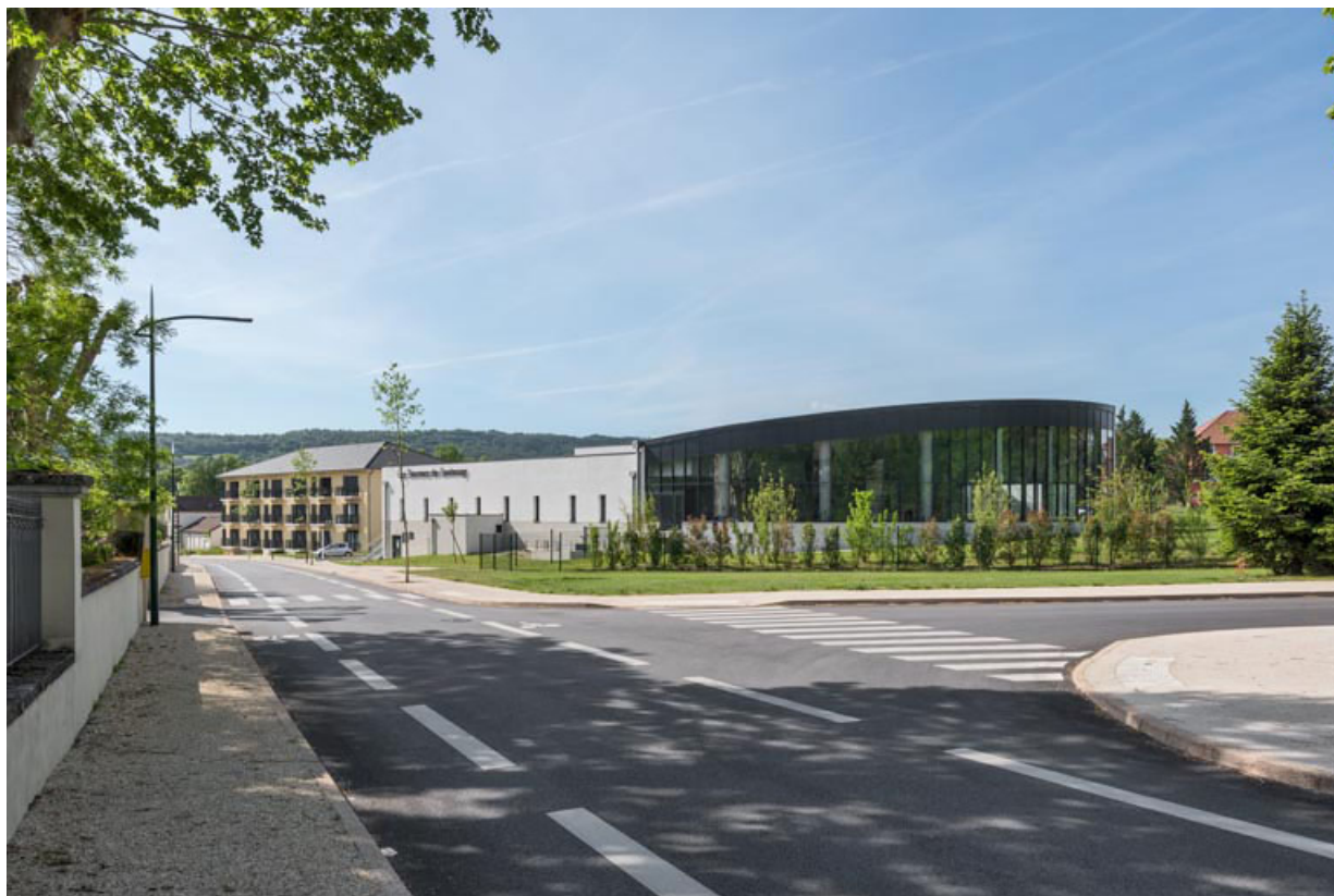
Vue de l'établissement thermal de 2021.