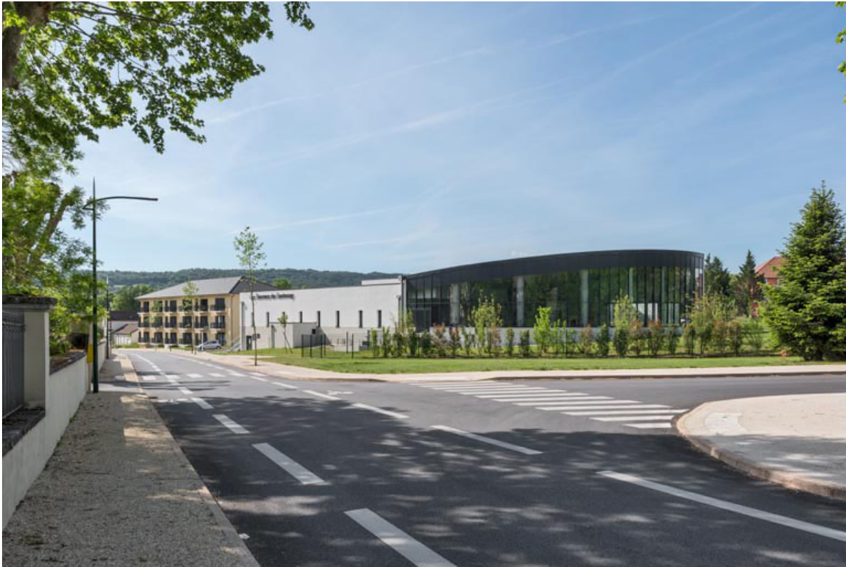
Vue de l'établissement thermal de 2021. 21, Santenay avenue des Sources