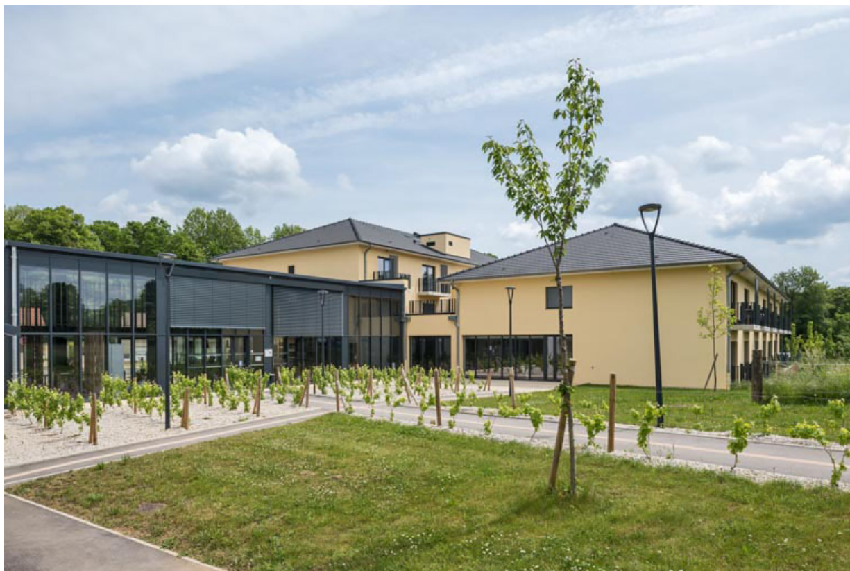
Vue de l'établissement thermal de 2021.