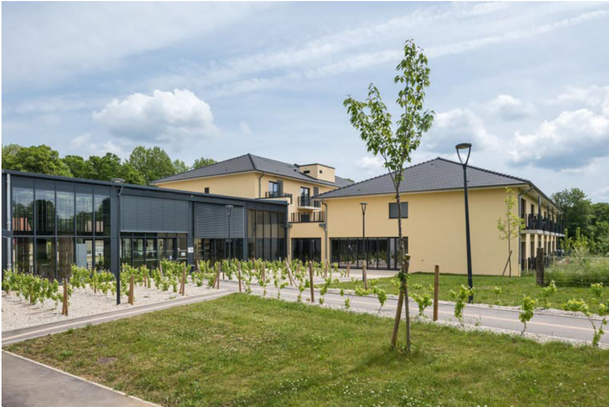
Vue de l'établissement thermal de 2021.