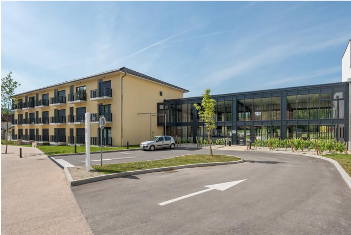
Vue de l'établissement thermal de 2021.