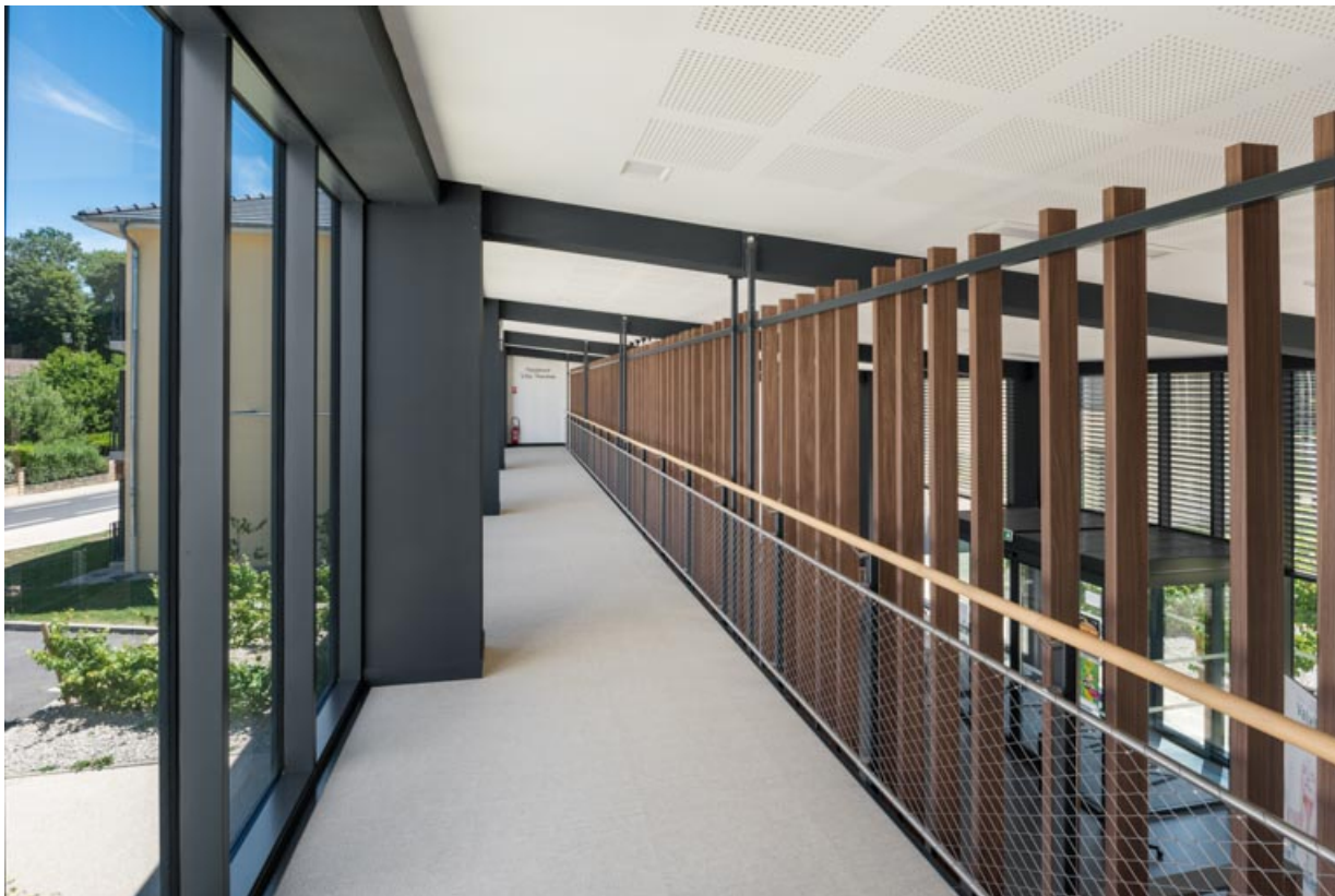
Passage reliant l'établissement thermal et l'hôtel.