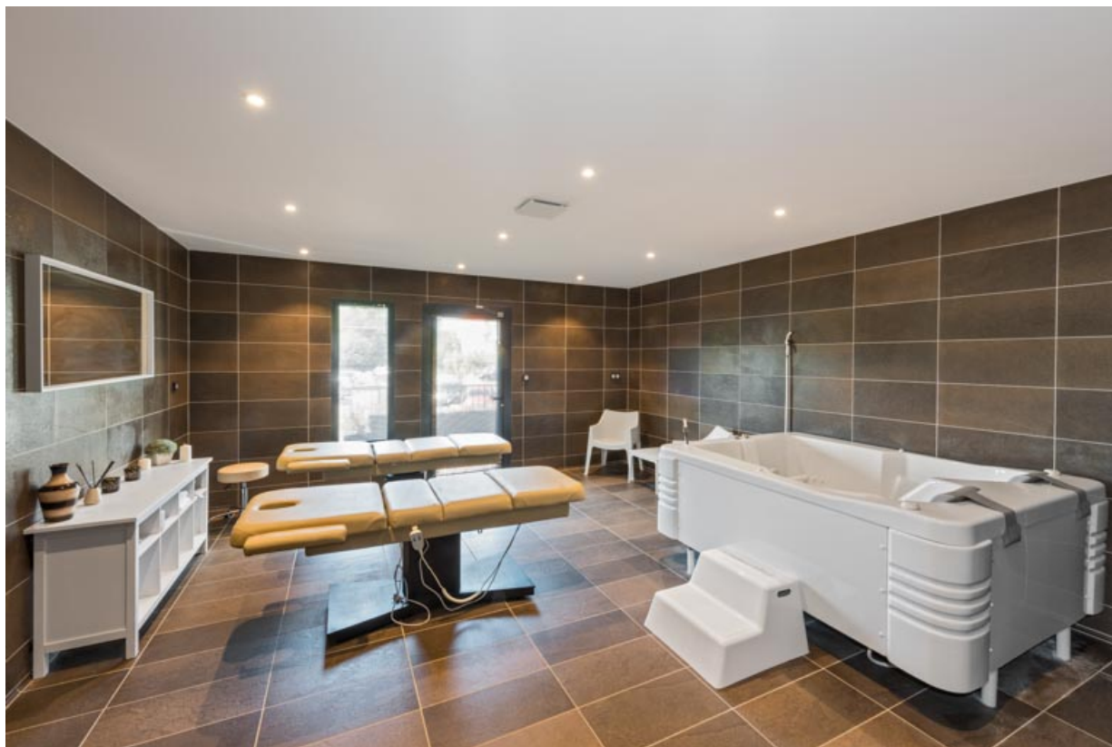
Spa thermoludique, cabine de soin double.