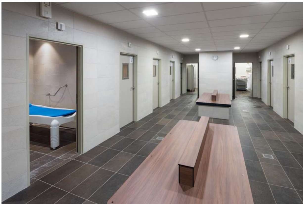
Cabines d'illutation (application de boue). 21, Santenay avenue des Sources