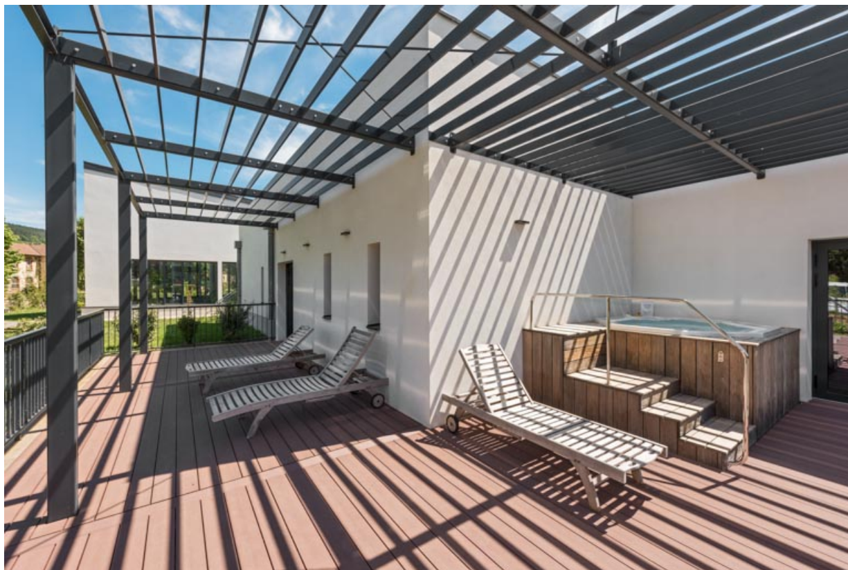
Spa thermoludique, terrasse extérieure.