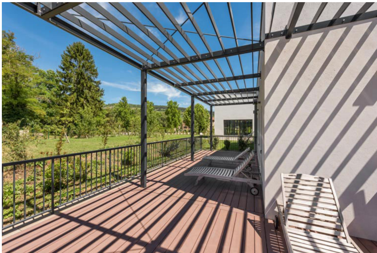
Spa thermoludique, terrasse extérieure.