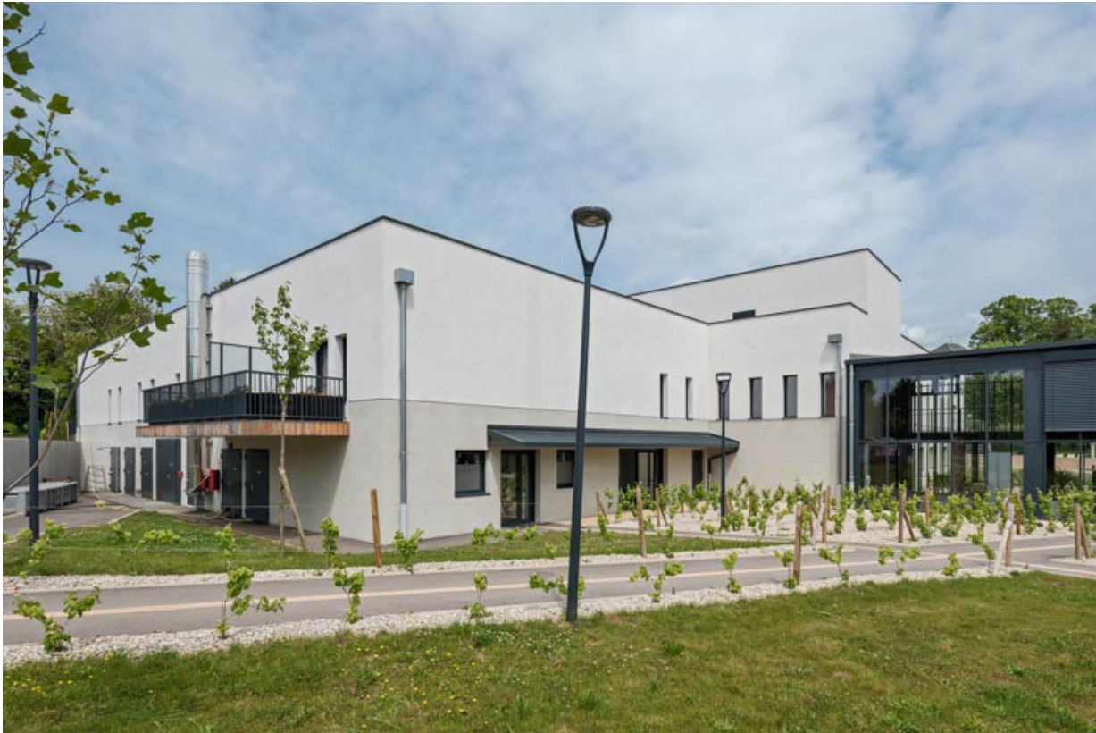
Vue de l'établissement thermal de 2021.