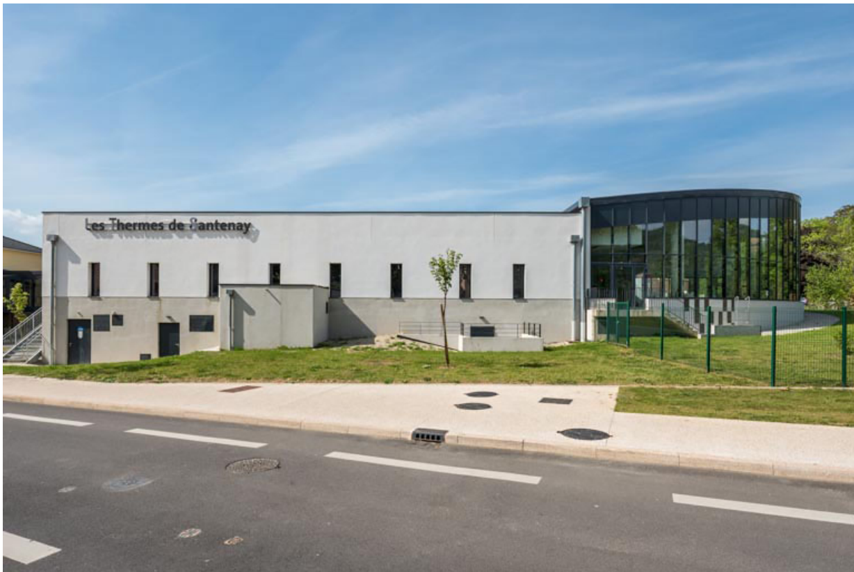
Vue de l'établissement thermal de 2021.