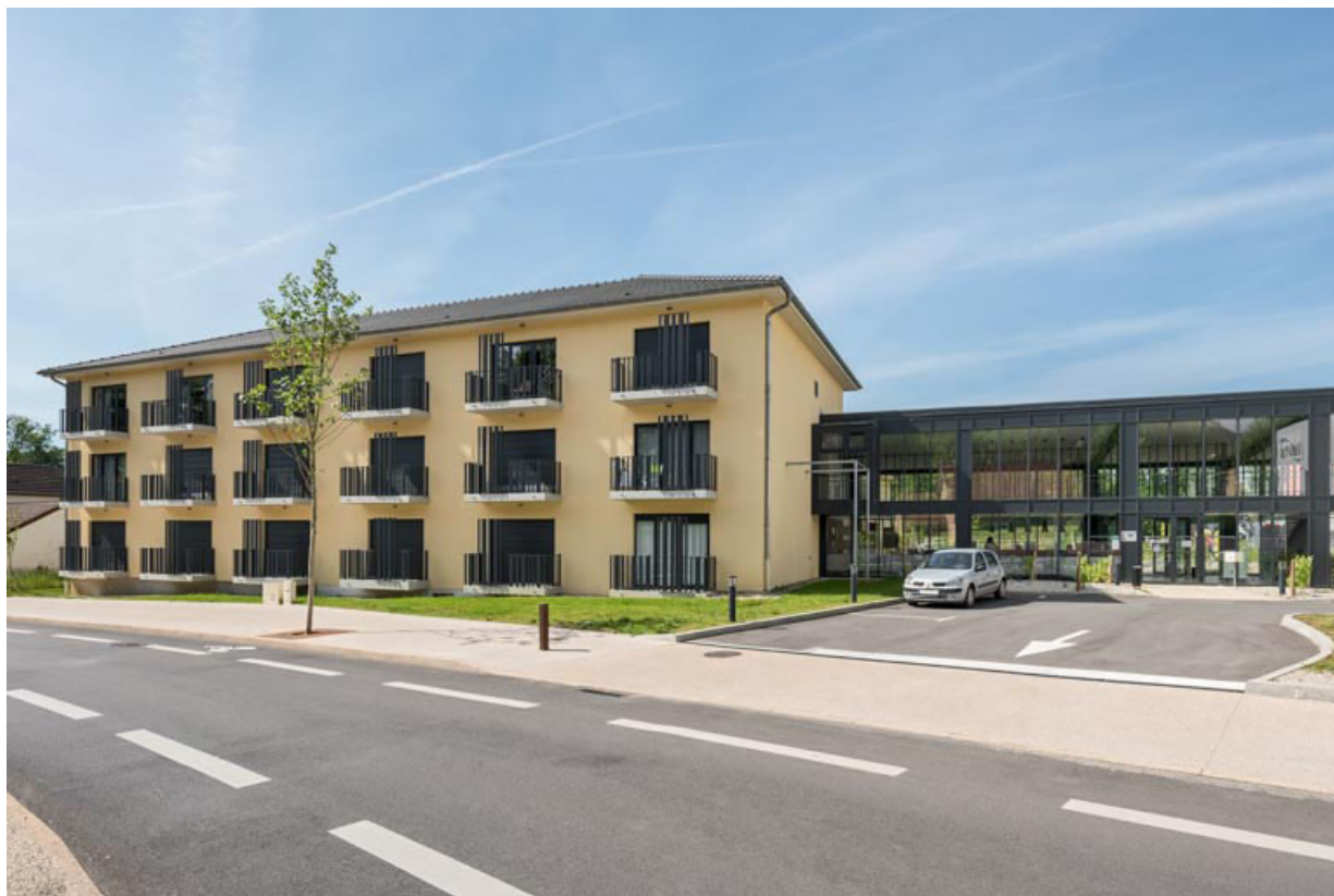
Vue de l'établissement thermal de 2021.