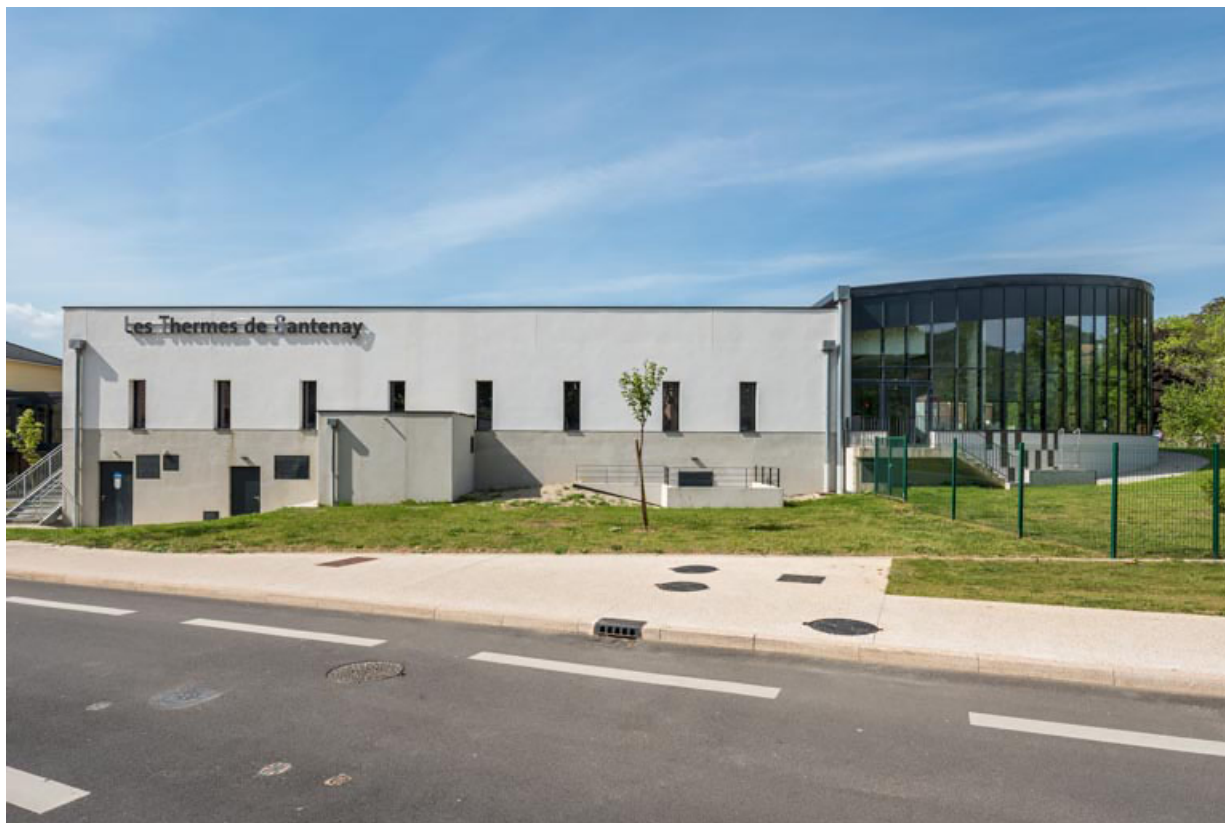
Vue de l'établissement thermal de 2021.