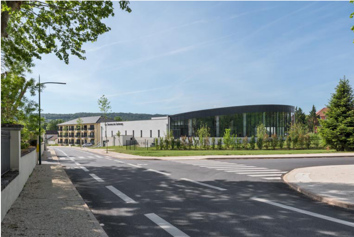
Vue de l'établissement thermal de 2021. 21, Santenay avenue des Sources