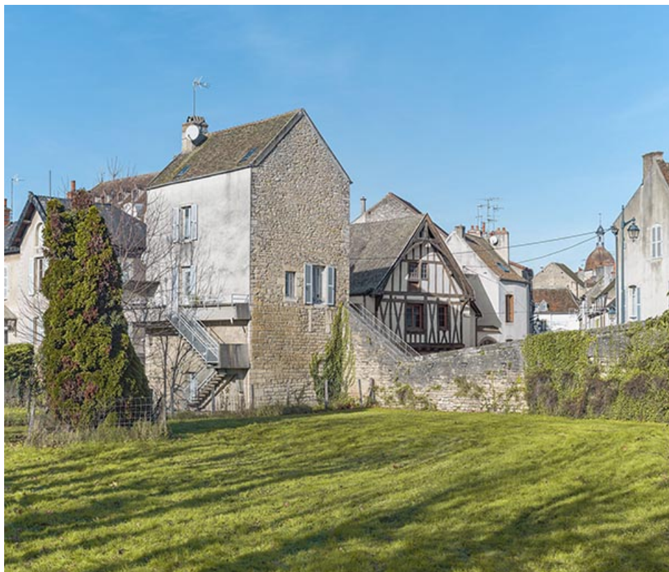
La tour, vue rapprochée.