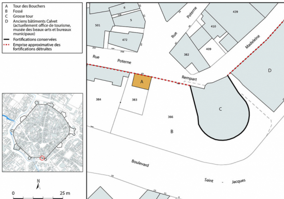
Plan-masse et de situation. Extrait du plan cadastral, 2024, 1/500.