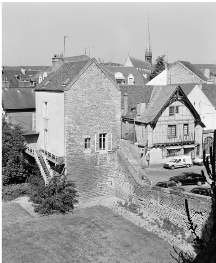
Tour des boucheries, depuis la "grosse tour" appelée aussi bastion Calvet 21, Beaune, 49 rue de la Poterne