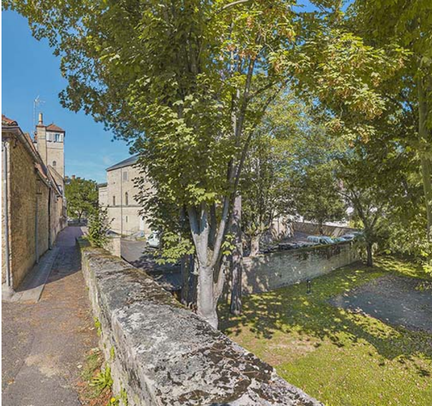
Rempart de la Comédie en direction de l'ancien bastion.