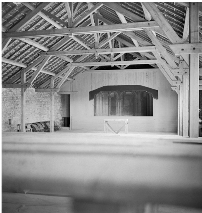
[La scène, vue de la salle]. 1937. 21, Alise-Sainte-Reine, 4 impasse du Théâtre