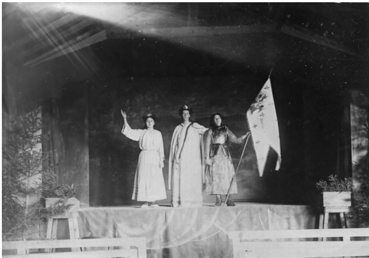
[Sainte Reine et deux personnages sur la scène du théâtre]. S.d. [fin 19e ou début 20e siècle].

21, Alise-Sainte-Reine, 4 impasse du Théâtre