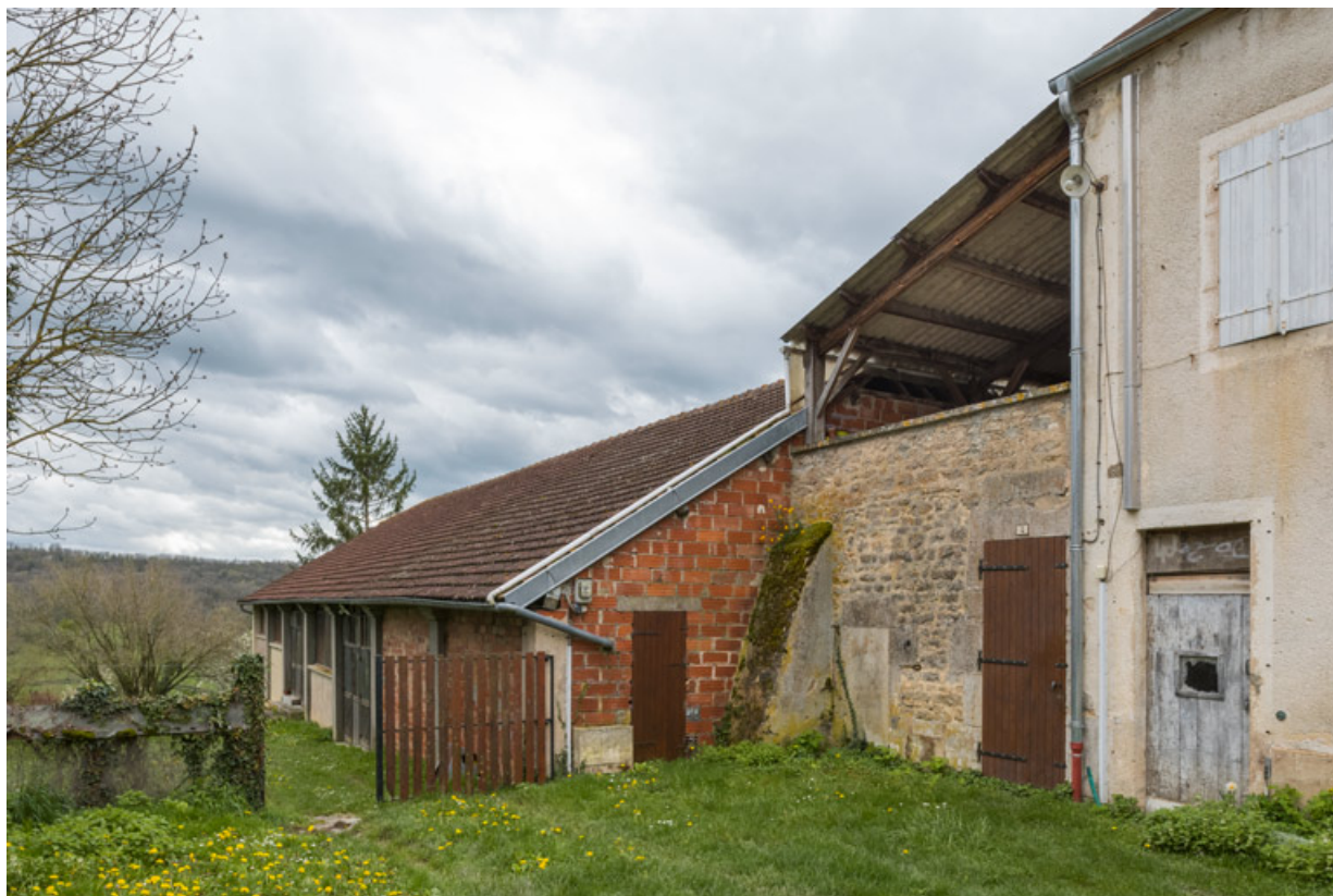
Vue d'ensemble, depuis le nord : théâtre à gauche, "ouvroir" à droite.

21, Alise-Sainte-Reine, 4 impasse du Théâtre