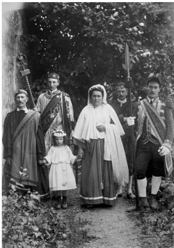
Sainte Reine enfant. 1886.

21, Alise-Sainte-Reine, 4 impasse du Théâtre