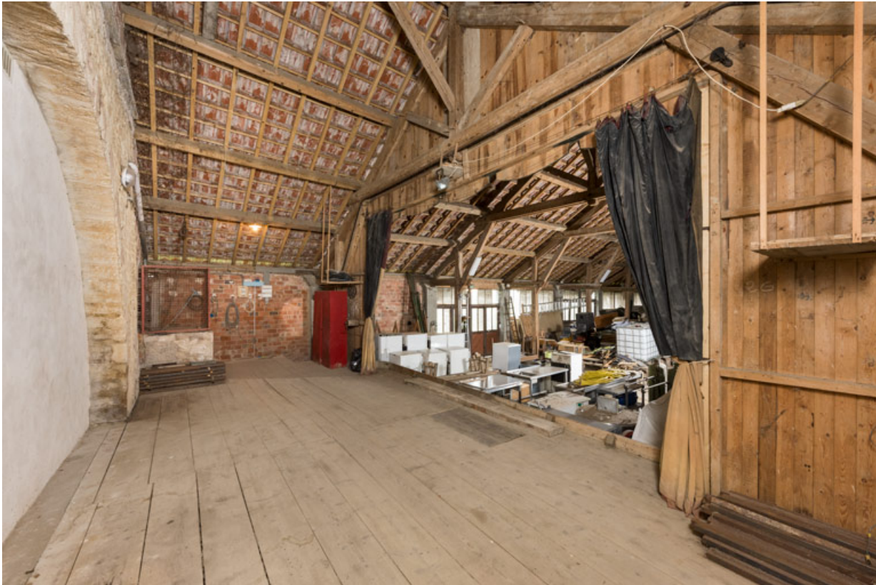
La scène, vue depuis le côté jardin (ouest). 21, Alise-Sainte-Reine, 4 impasse du Théâtre