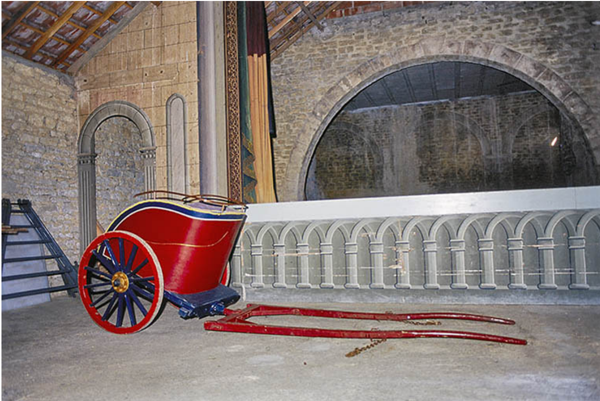
Intérieur du théâtre en 2002, avec char romain.

21, Alise-Sainte-Reine, 4 impasse du Théâtre