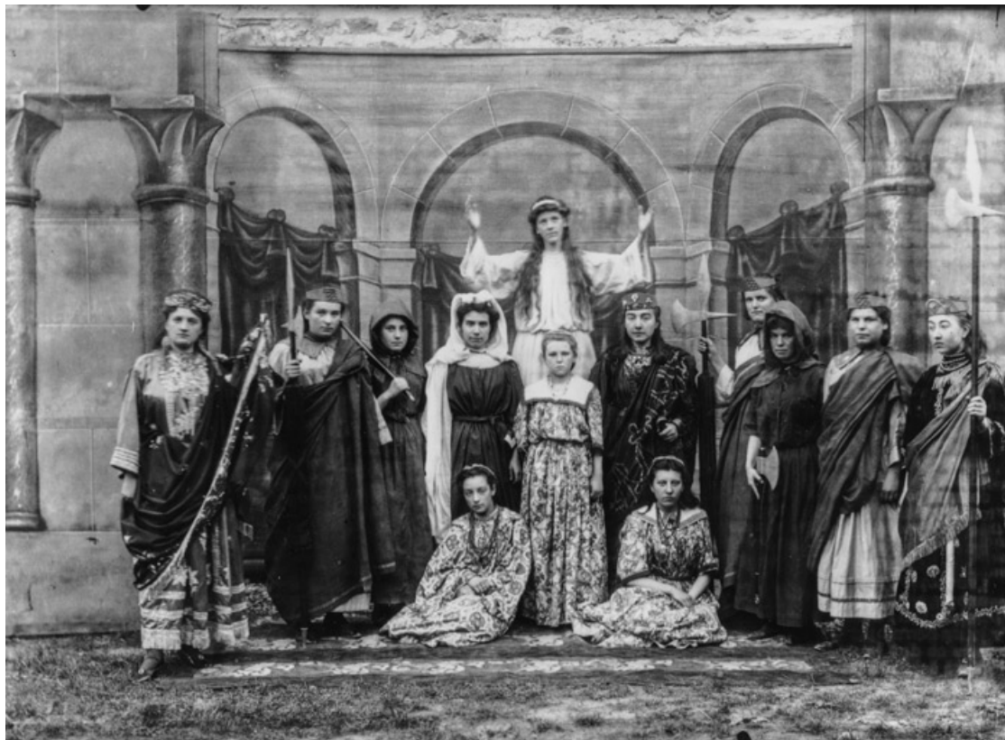
[Deux scènes du Martyre de sainte Reine : la tragédie]. S.d. [entre 1897 et 1904].

21, Alise-Sainte-Reine, 4 impasse du Théâtre