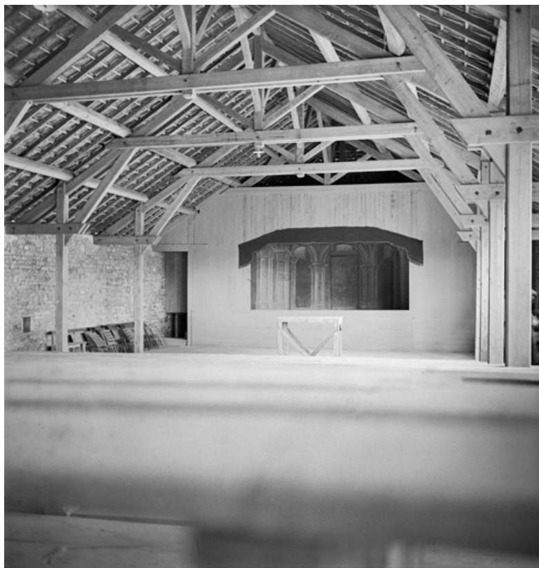
[La scène, vue de la salle]. 1937. 21, Alise-Sainte-Reine, 4 impasse du Théâtre

[Deux vues intérieures du théâtre]. 1937.