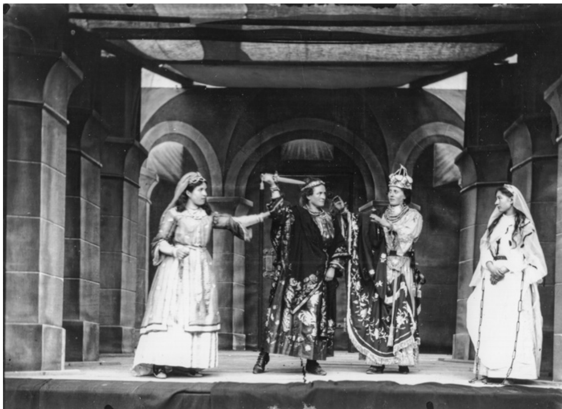
[Scène du Martyre de sainte Reine : Clément veut poignarder sa fille, Olibrius et Léonice arrêtent sa main (5e tableau, 3e acte)]. S.d. [fin 19e ou début 20e siècle].

21, Alise-Sainte-Reine, 4 impasse du Théâtre