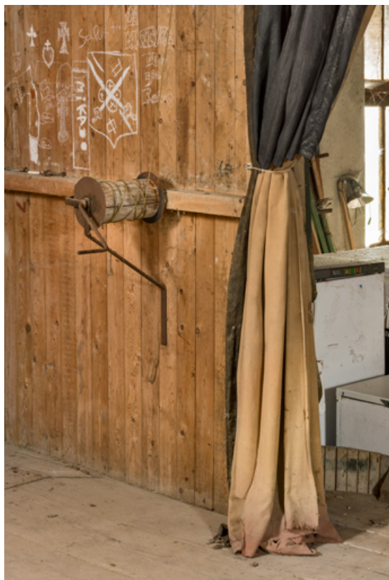
Treuil pour la manoeuvre du rideau de scène.

21, Alise-Sainte-Reine, 4 impasse du Théâtre