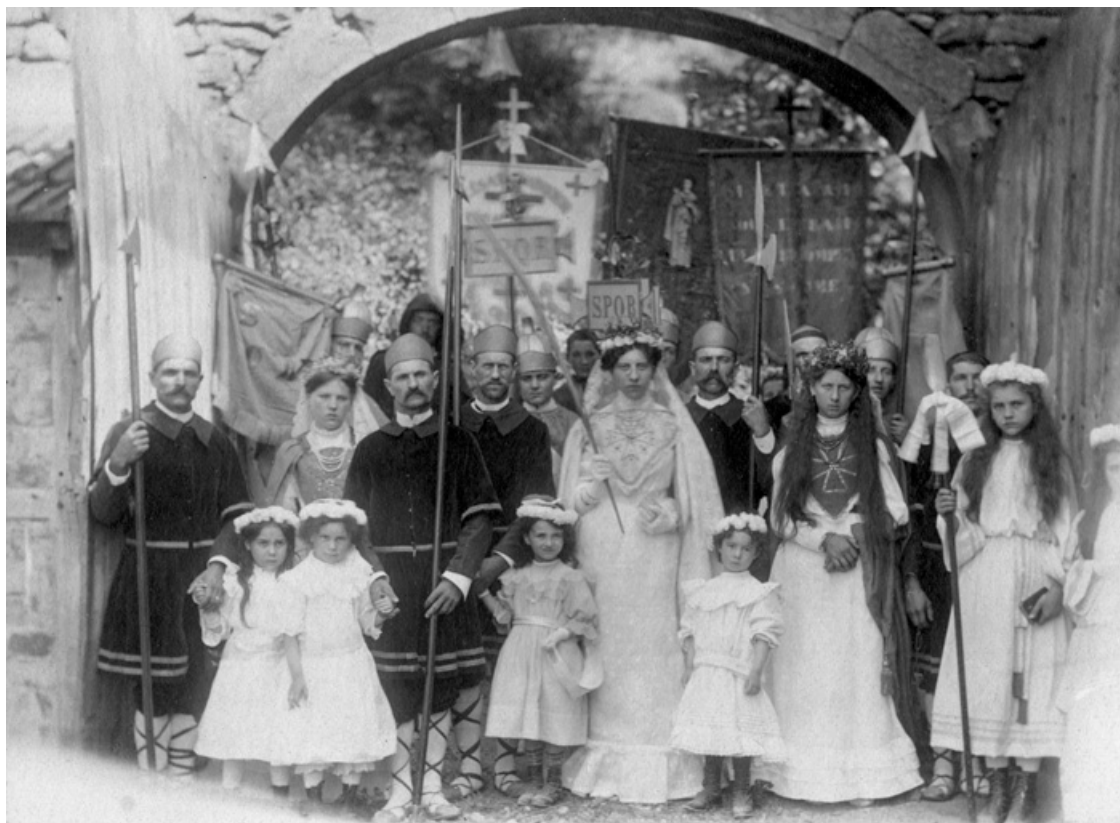
Les Sainte Reine réunies. S.d. [fin 19e ou début 20e siècle].

21, Alise-Sainte-Reine, 4 impasse du Théâtre