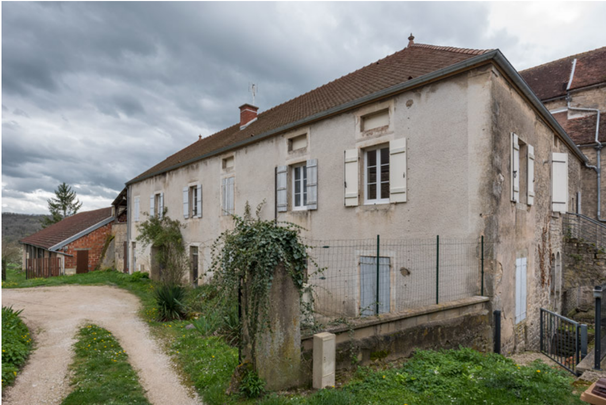
Vue d'ensemble depuis l'entrée du site, au nord. Le mur de briques du théâtre est visible à l'arrière-plan.

21, Alise-Sainte-Reine, 4 impasse du Théâtre