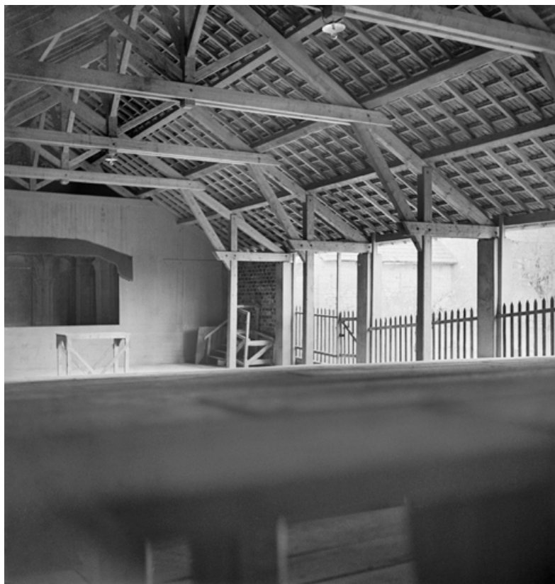
[La scène et le côté est, vus de la salle]. 1937. (Musée des civilisations de l'Europe et de la Méditerranée : phw-1937-55). 21, Alise-Sainte-Reine, 4 impasse du Théâtre

[Deux vues intérieures du théâtre]. 1937.