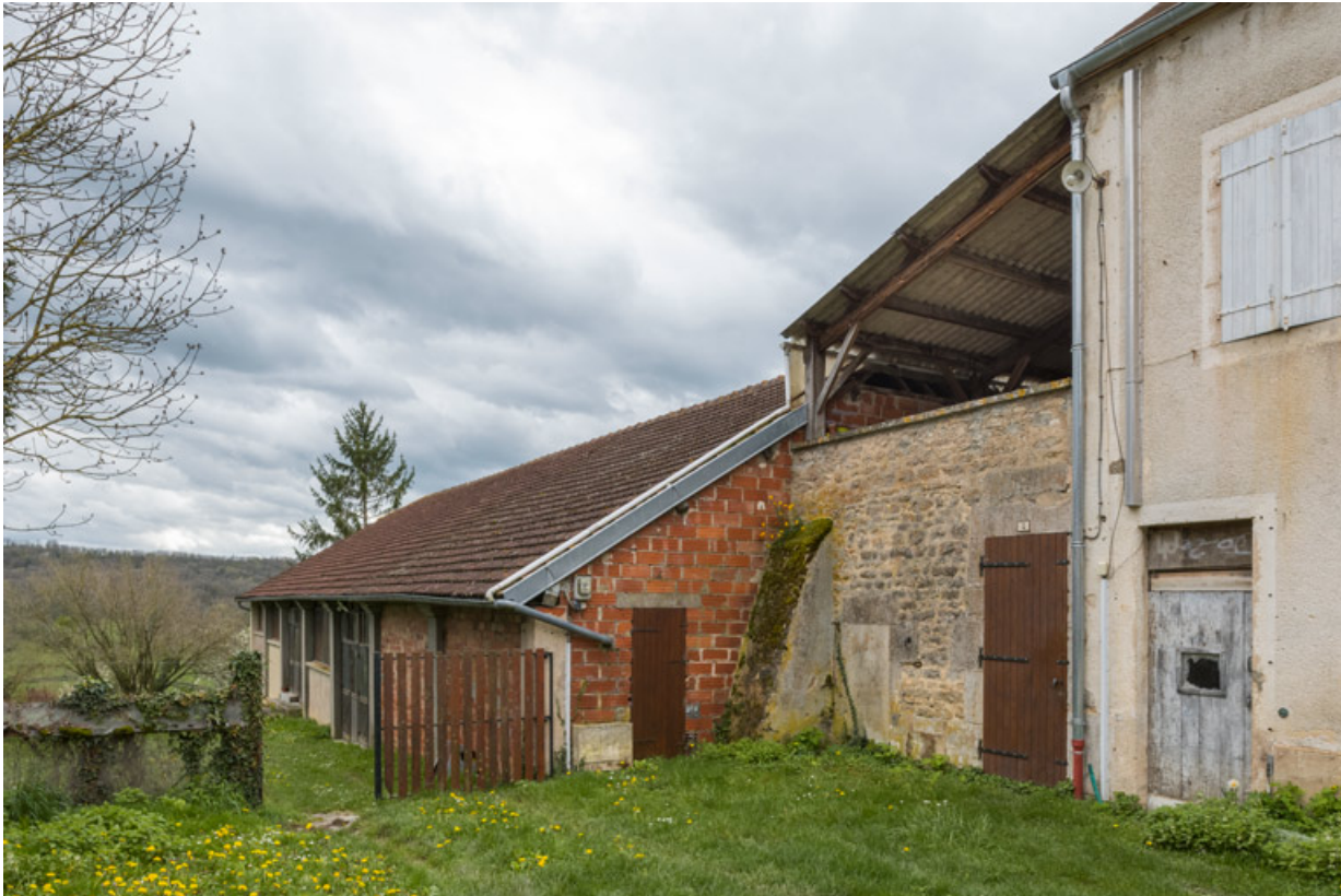
Vue d'ensemble, depuis le nord : théâtre à gauche, "ouvroir" à droite.

21, Alise-Sainte-Reine, 4 impasse du Théâtre