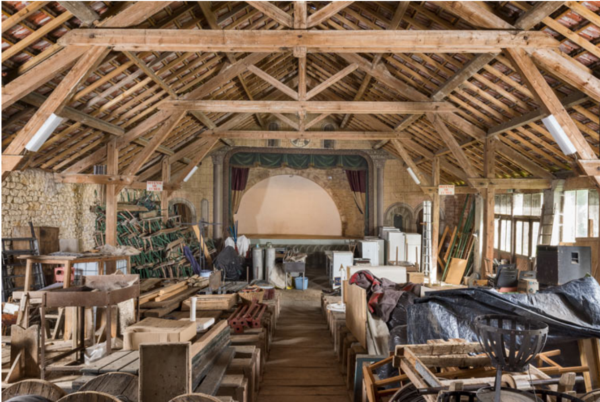
La scène, vue de la salle.

21, Alise-Sainte-Reine, 4 impasse du Théâtre