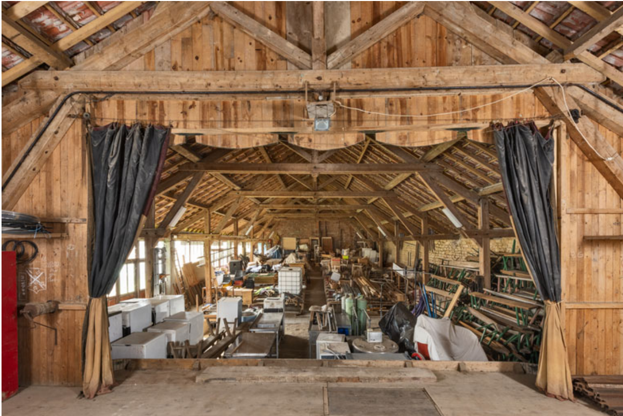
La salle, vue de la scène.

21, Alise-Sainte-Reine, 4 impasse du Théâtre