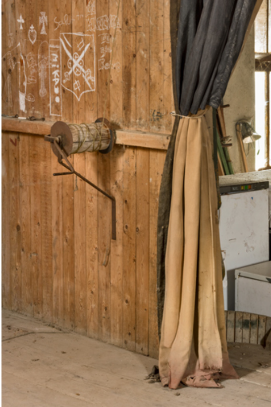
Treuil pour la manoeuvre du rideau de scène.

21, Alise-Sainte-Reine, 4 impasse du Théâtre