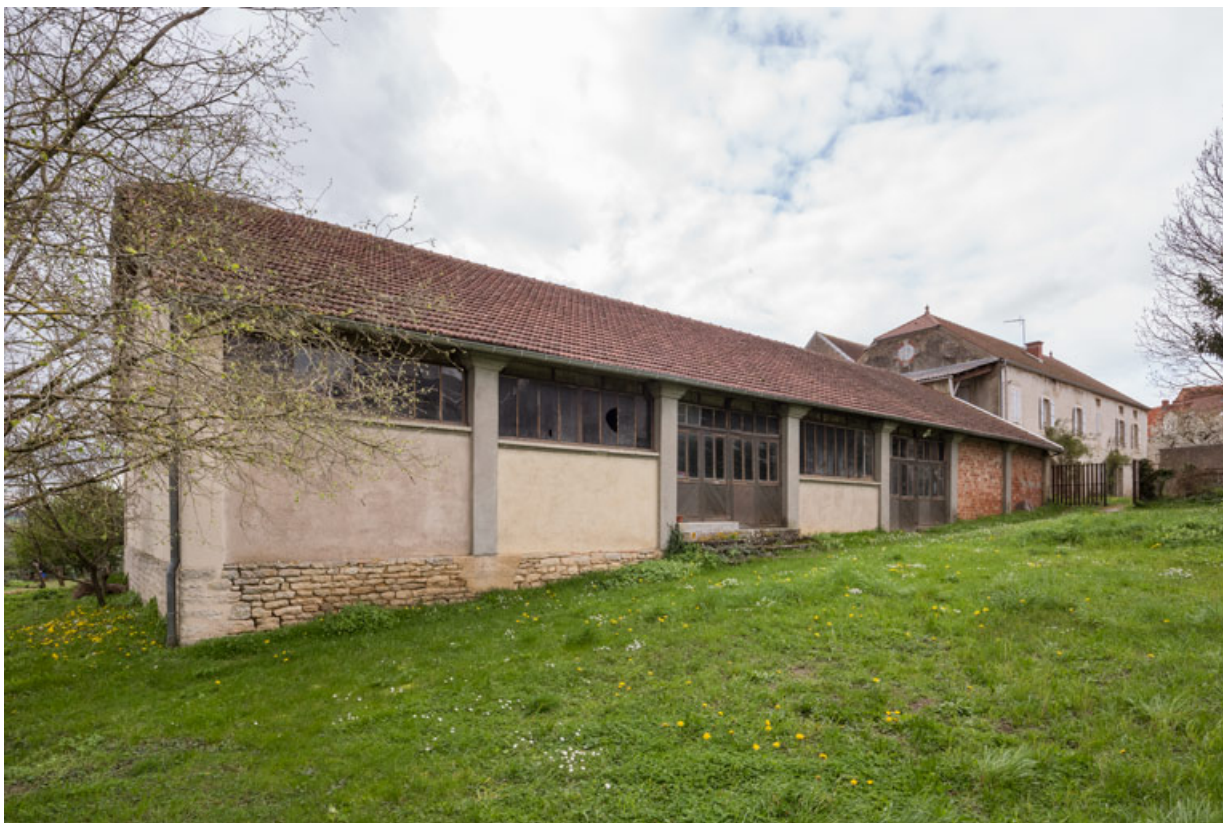
Façade antérieure, de trois quarts gauche. 21, Alise-Sainte-Reine, 4 impasse du Théâtre