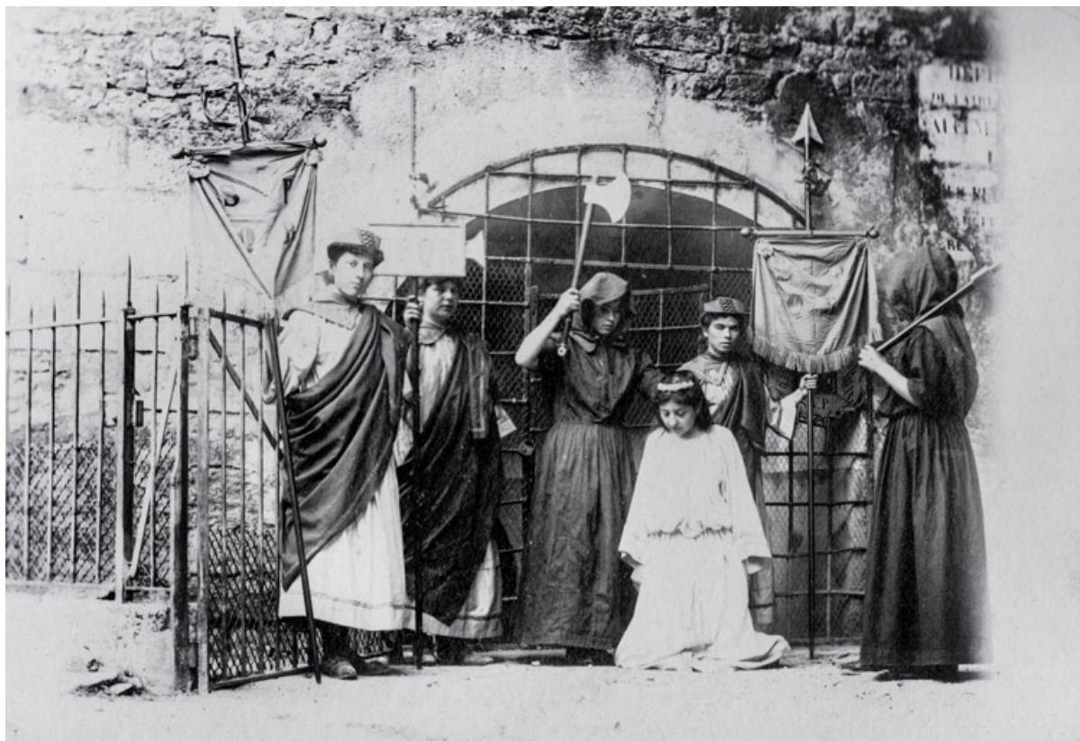
[Sainte Reine devant la fontaine]. S.d. [fin 19e ou début 20e siècle].

21, Alise-Sainte-Reine, 4 impasse du Théâtre