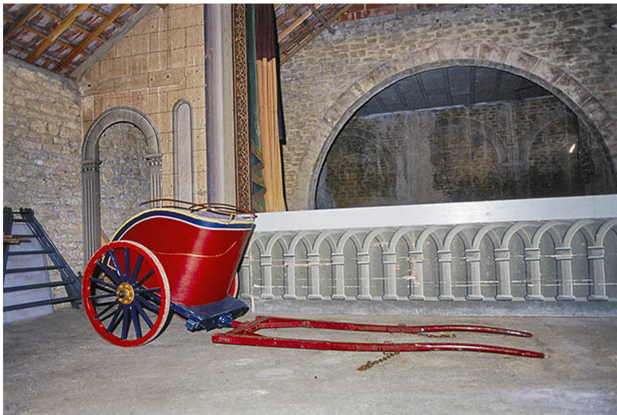
Intérieur du théâtre en 2002, avec char romain.

21, Alise-Sainte-Reine, 4 impasse du Théâtre