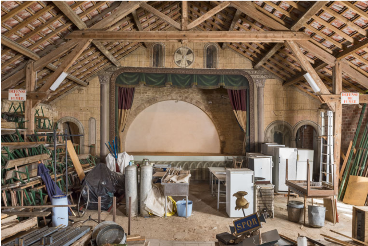
La scène, vue de la salle (vue rapprochée).

21, Alise-Sainte-Reine, 4 impasse du Théâtre