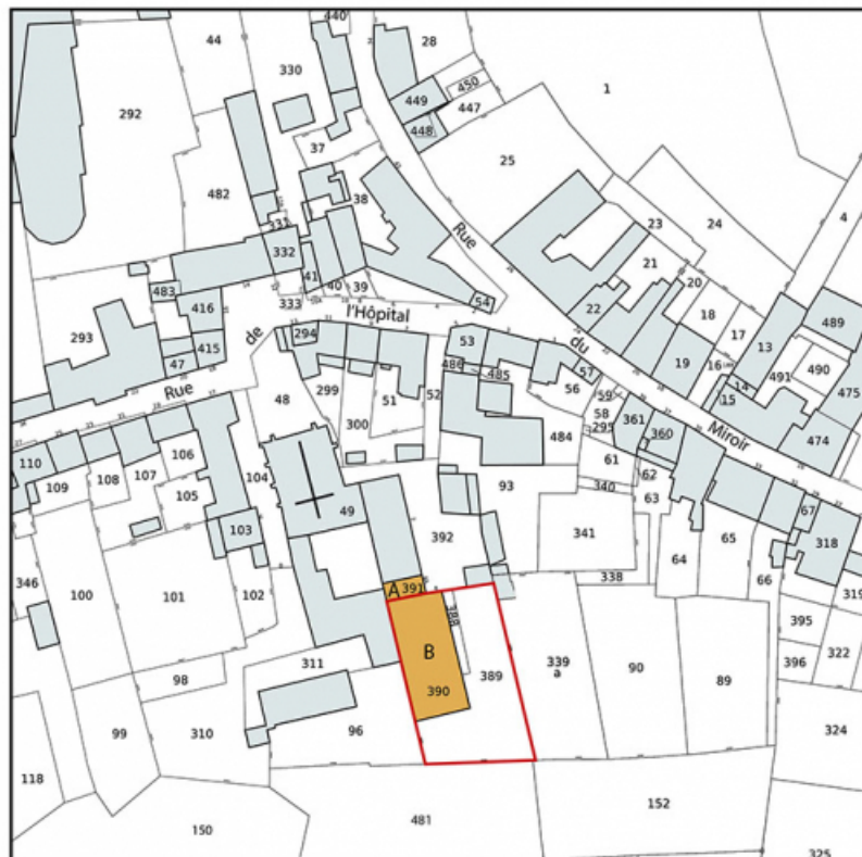
Plan-masse et de situation. 21, Alise-Sainte-Reine, 4 impasse du Théâtre