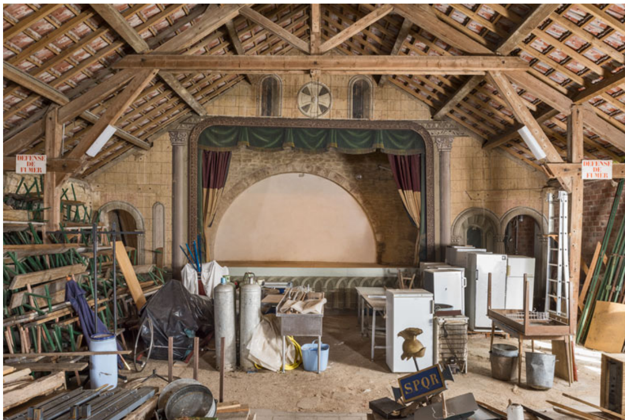
La scène, vue de la salle (vue rapprochée). 21, Alise-Sainte-Reine, 4 impasse du Théâtre