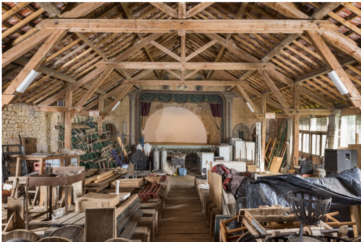
La scène, vue de la salle.

21, Alise-Sainte-Reine, 4 impasse du Théâtre