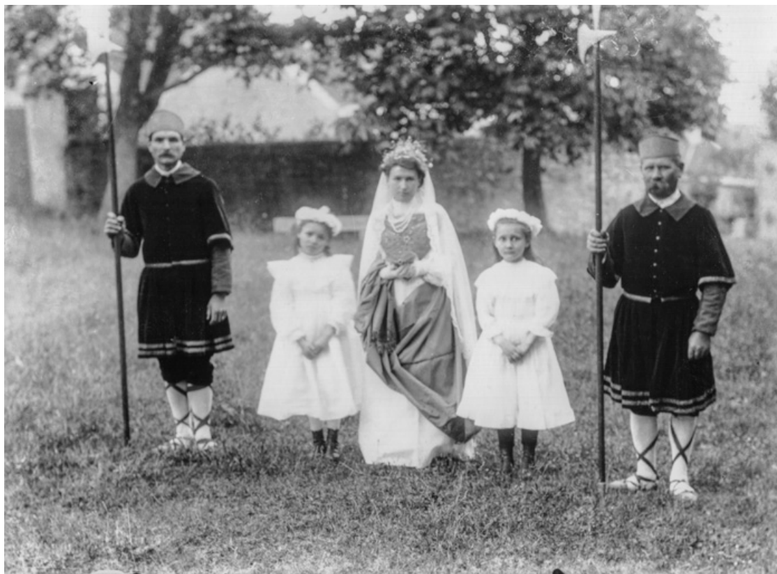
[Scène du Martyre de sainte Reine]. S.d. [fin 19e ou début 20e siècle].

21, Alise-Sainte-Reine, 4 impasse du Théâtre