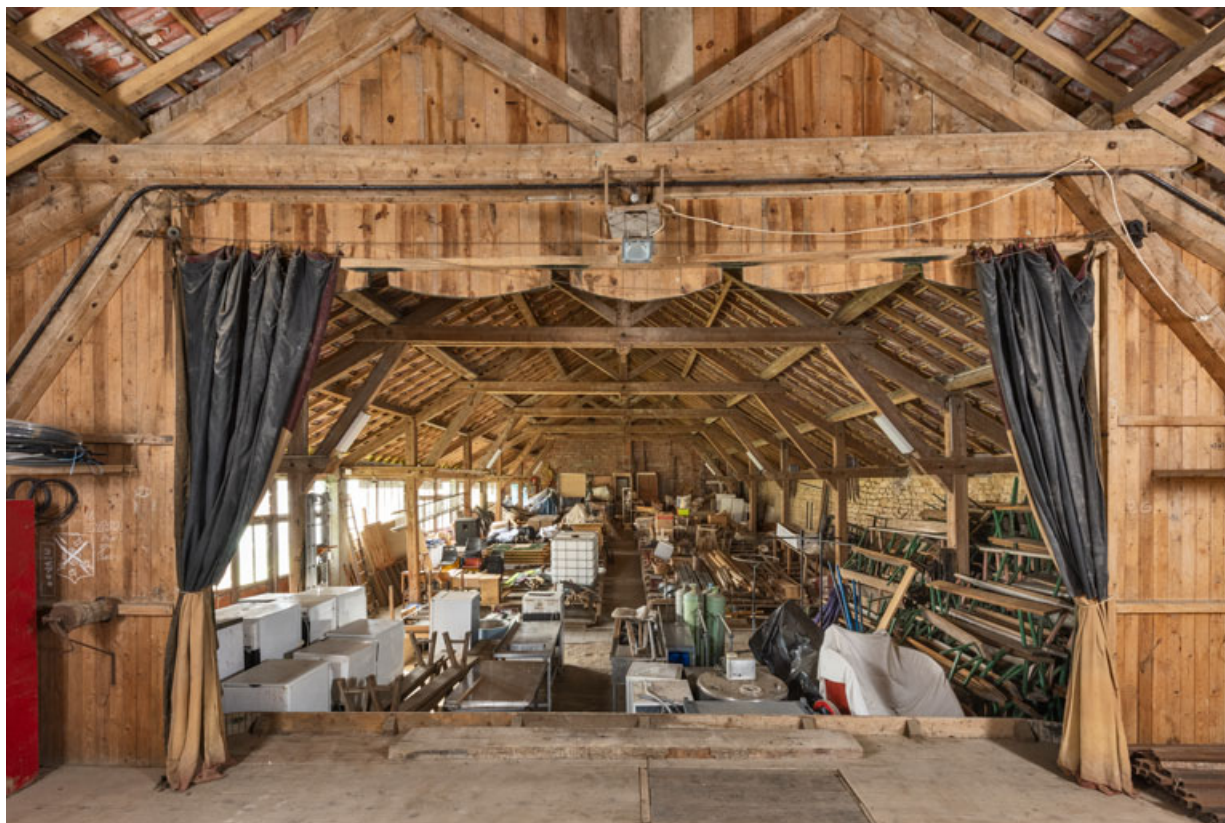
La salle, vue de la scène.

21, Alise-Sainte-Reine, 4 impasse du Théâtre