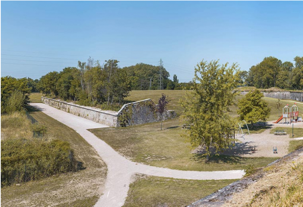
Face est de l'ouvrage.