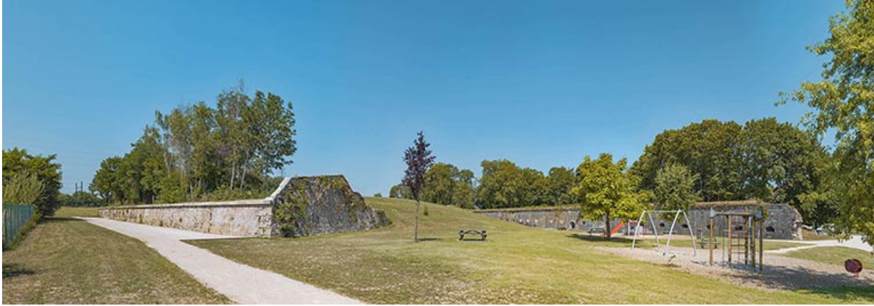
La demi-lune et la courtine casematée en arrière plan. 21, Auxonne