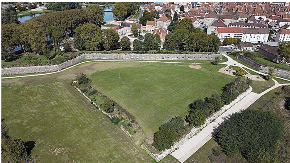
Vue aérienne de la demi-lune.