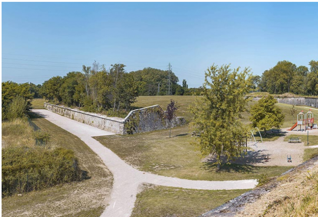
Face est de l'ouvrage.