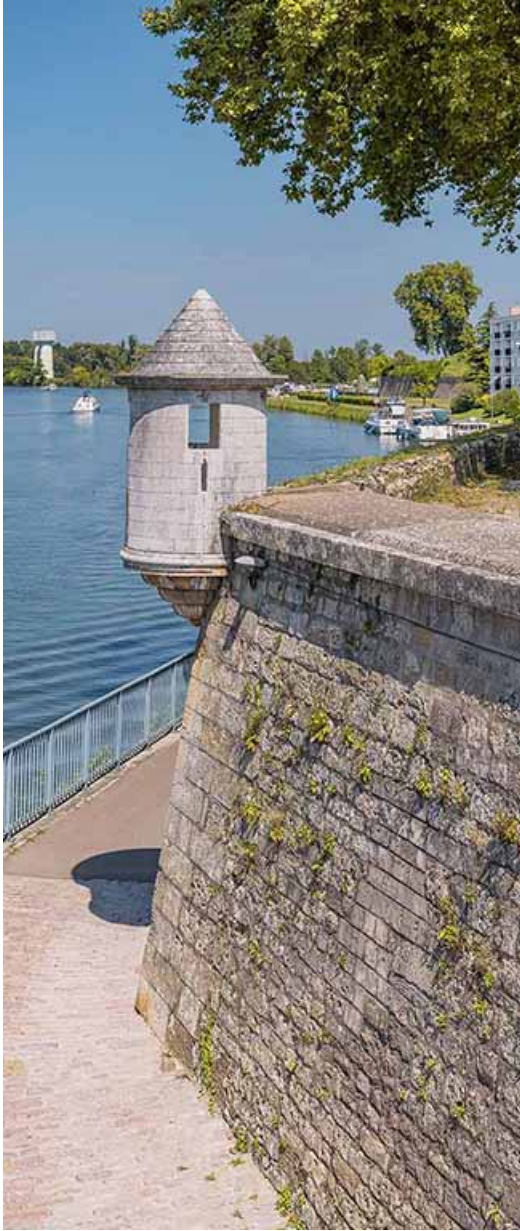
Le bastion prenant appui sur le chemin de halage. 21, Auxonne quai des Remparts