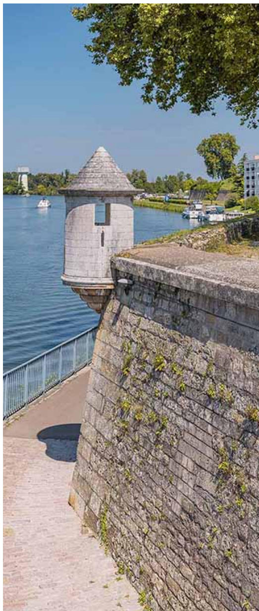
Le bastion prenant appui sur le chemin de halage. 21, Auxonne quai des Remparts