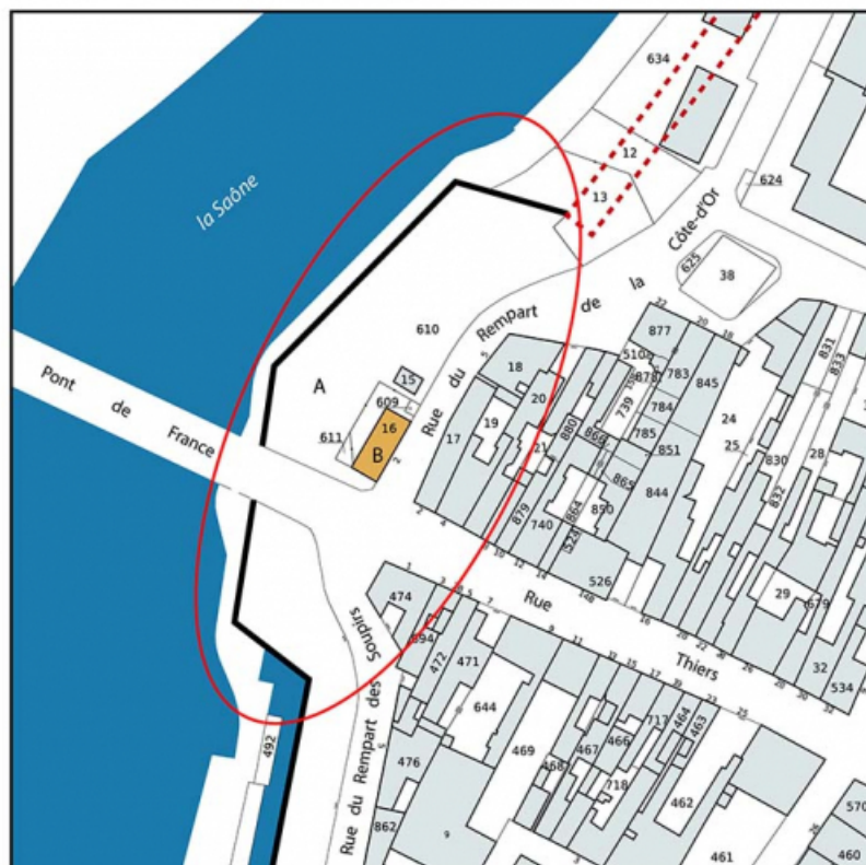
Plan-masse et de situation. Extrait du plan cadastral, 2023, 1/1 000.