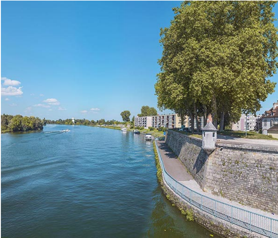
Vue du bastion en amont du pont.