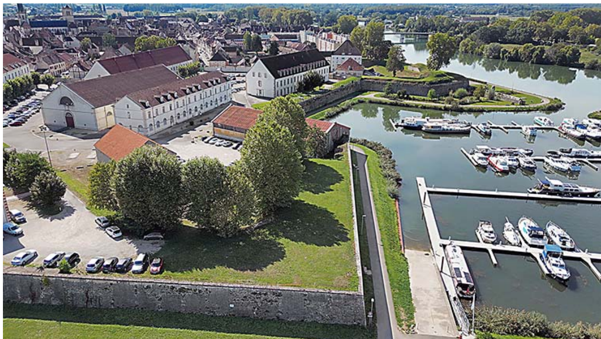
Vue aérienne du bastion et de celui du Bechaux.