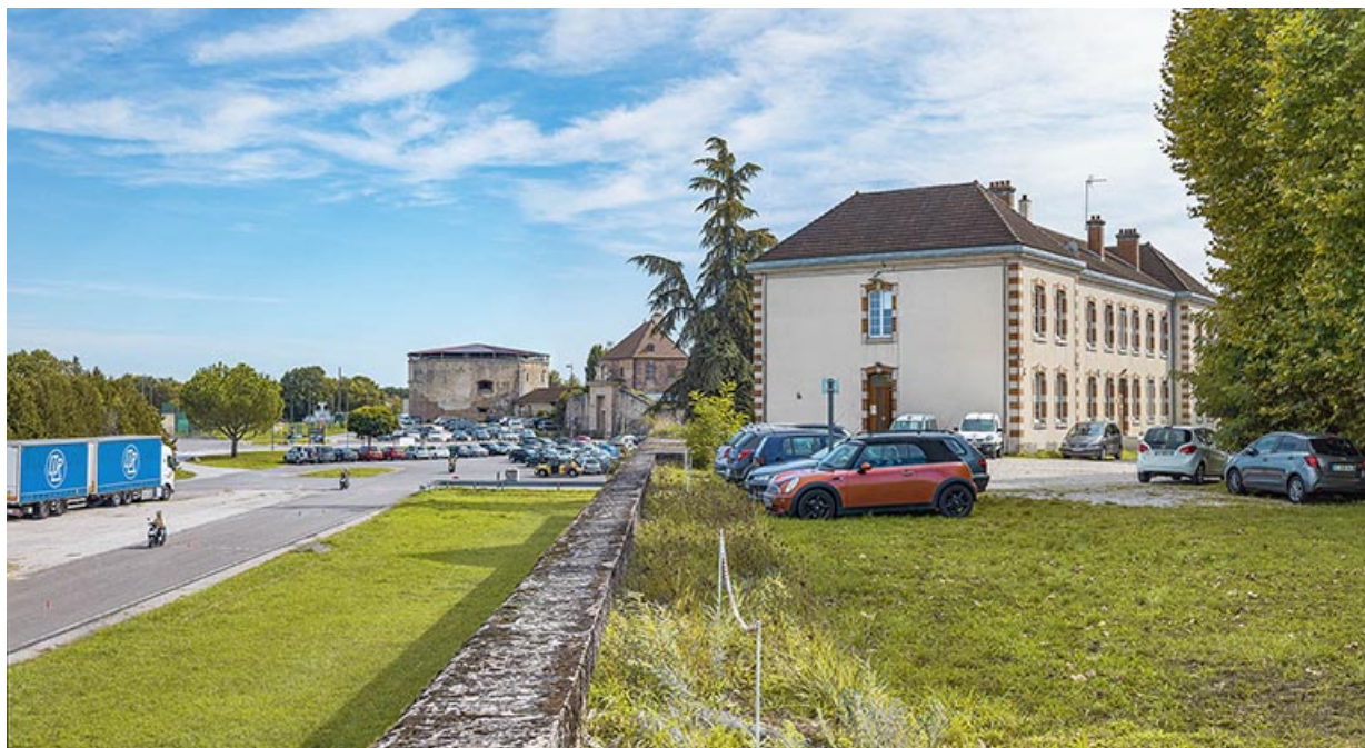
Parapet avec en arrière-plan la tour du Cygne.