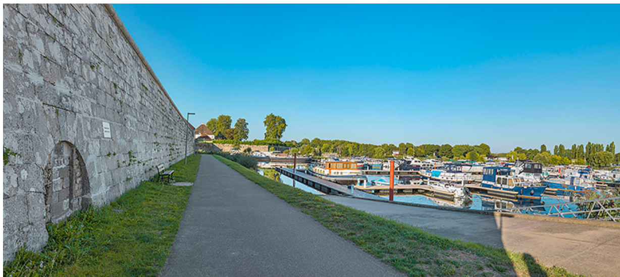
La face du bastion vers le port de plaisance.