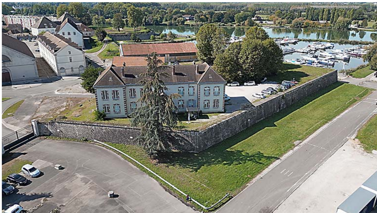
Vue aérienne du bastion.