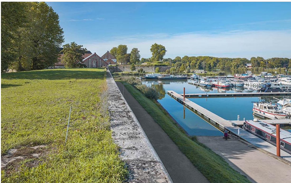
Terre-plein, parapet (face ouest).