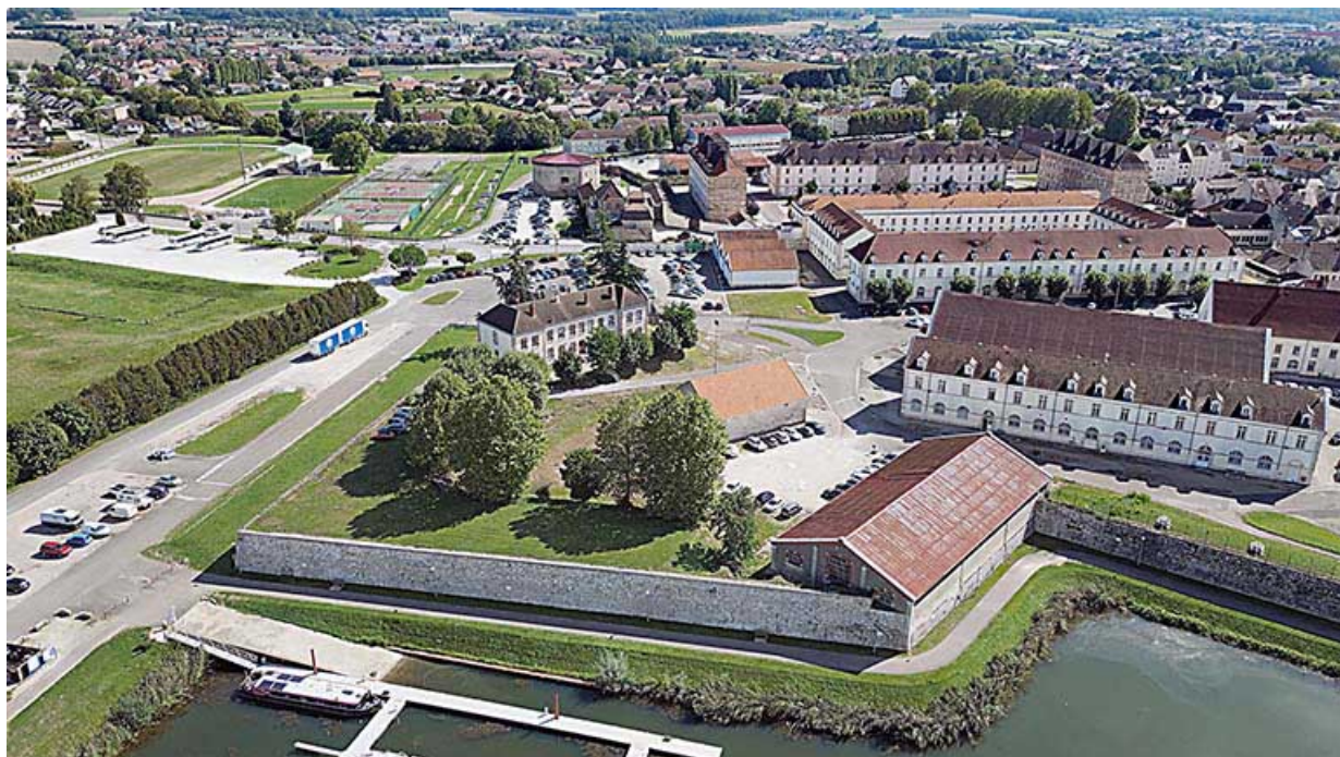
Vue aérienne : face et flanc ouest du bastion.