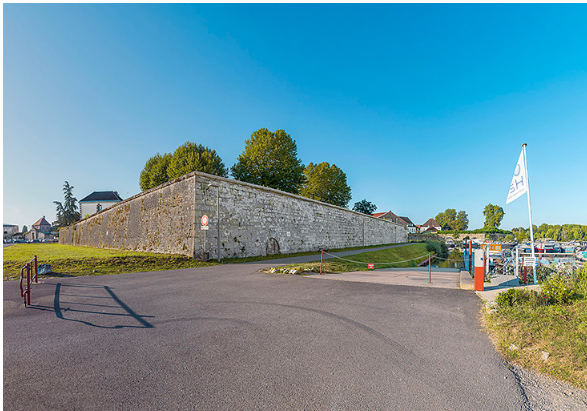
Vue générale du bastion et de son angle flanqué.