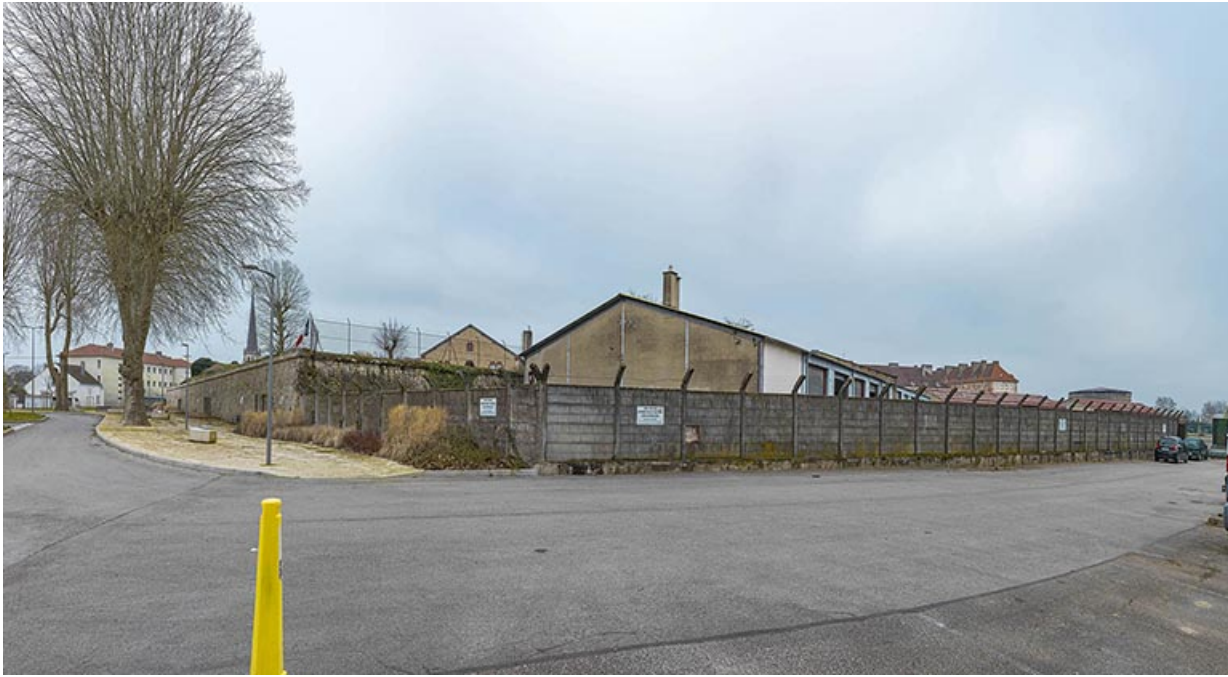
Vue sur la partie saillante du bastion.