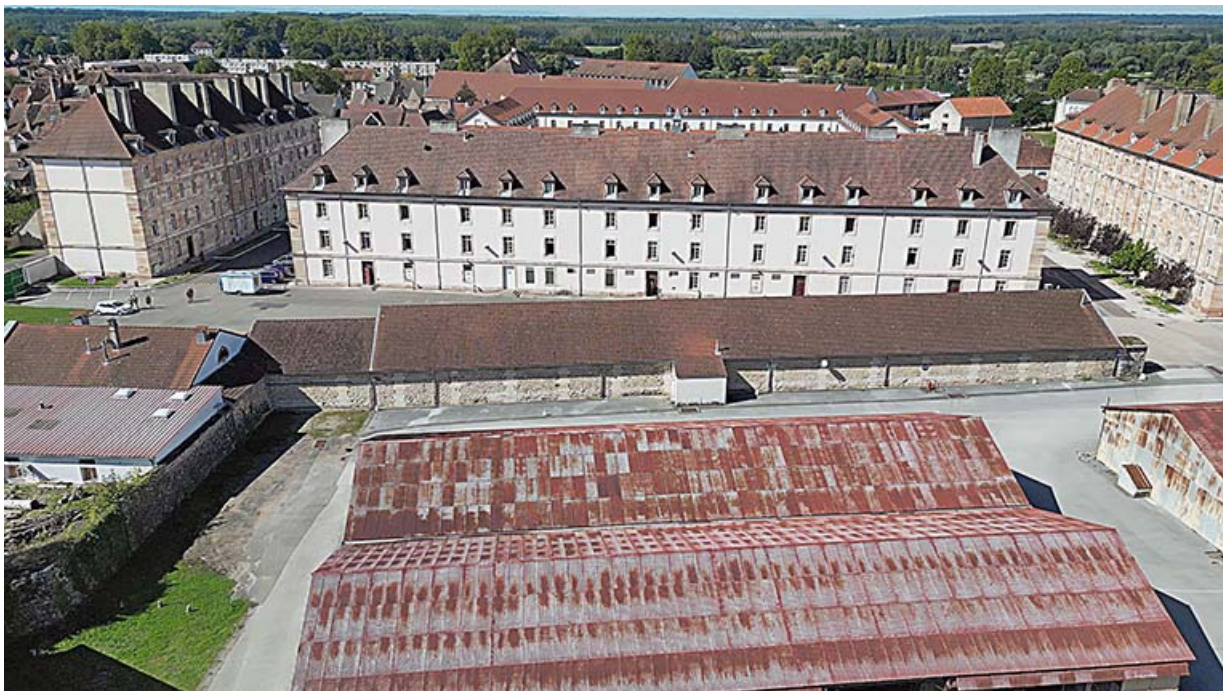
Vue aérienne du rempart reliant les bastions du Gouverneur et du Cygne.