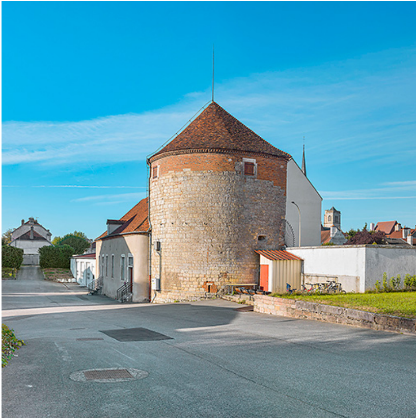
La tour Belvoir : face externe.