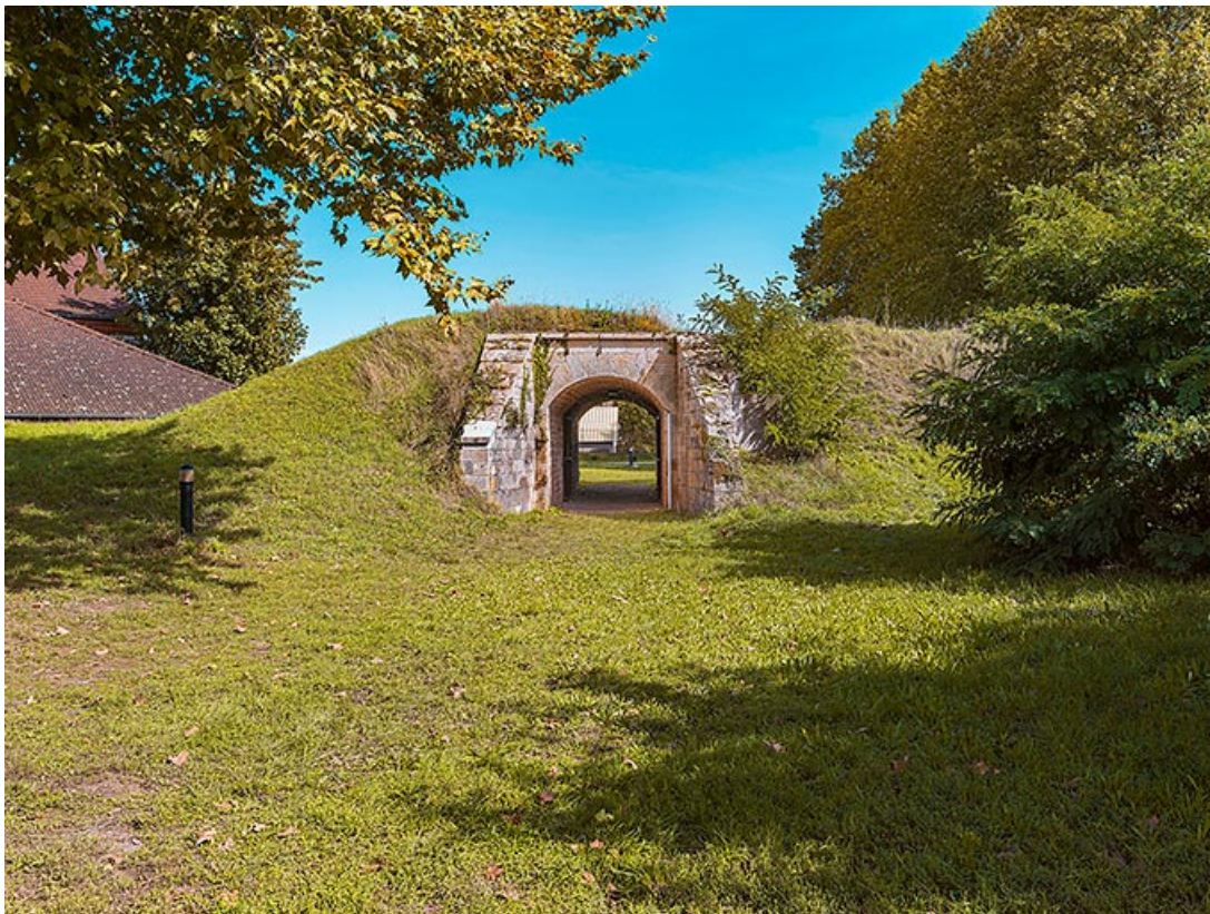
Passage entre le terre-plein du bastion et sa gorge.