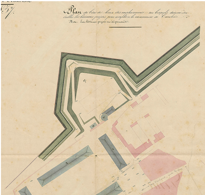
Bastion du Gouverneur [détail du bastion]. 1836.