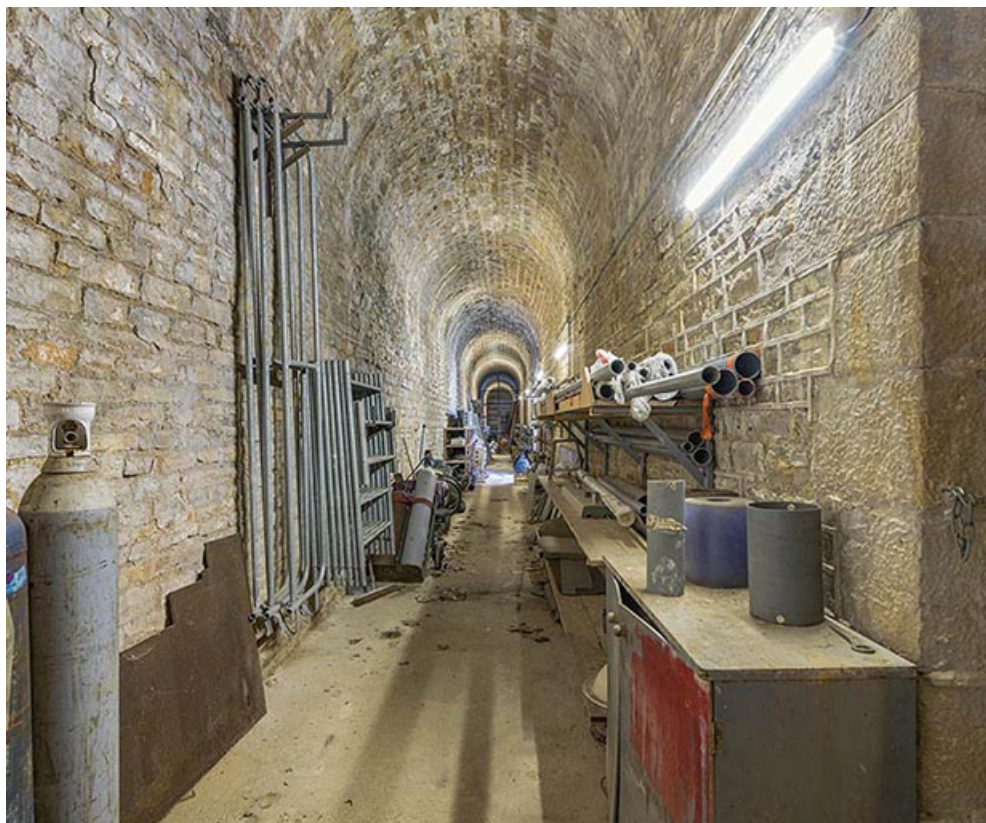
Passage voûté dans un des trois bâtiments de la caserne comprise au sein du bastion. 21, Auxonne rue du Capitaine Coignet