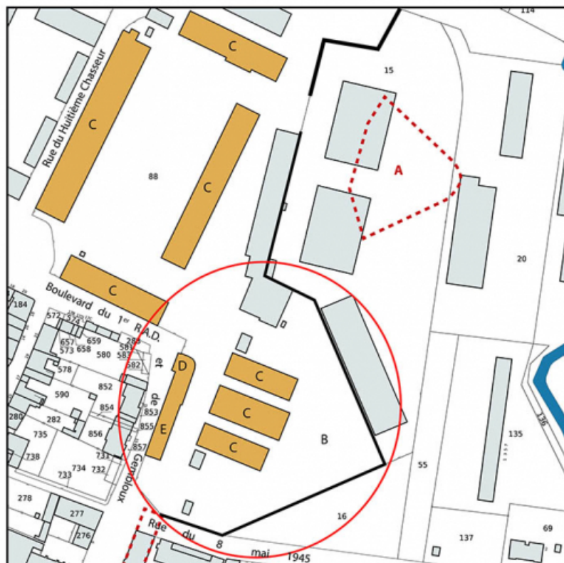
Plan-masse et de situation. Extrait du plan cadastral, 2023, 1/1 500.