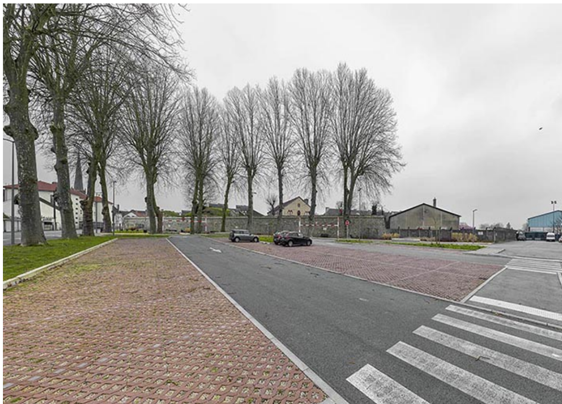
Vue d'ensemble du bastion depuis le parking Bonaparte.