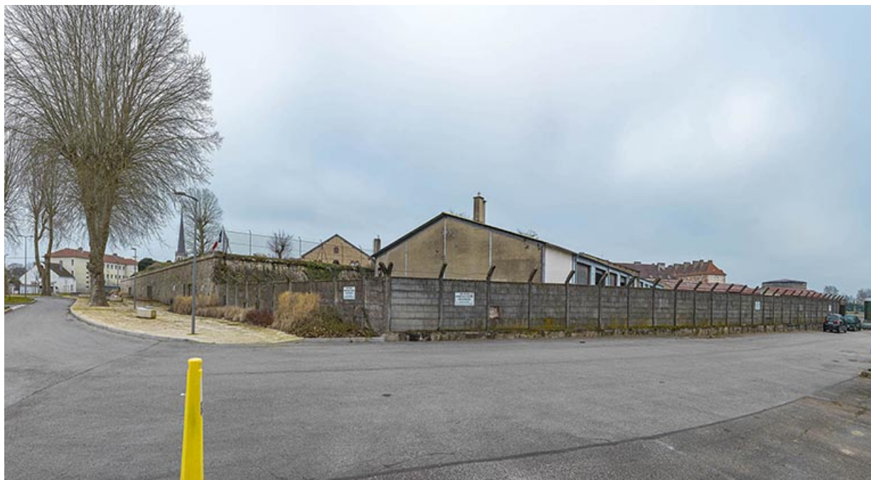
Vue sur la partie saillante du bastion.