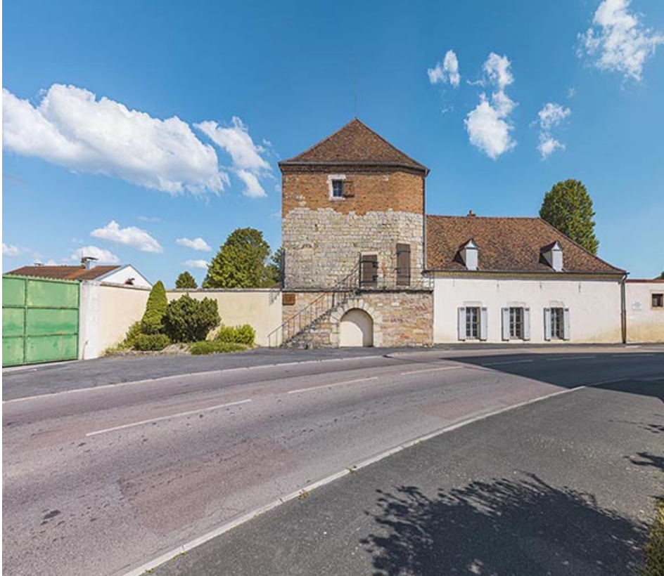
La tour Belvoir, face côté gorge.