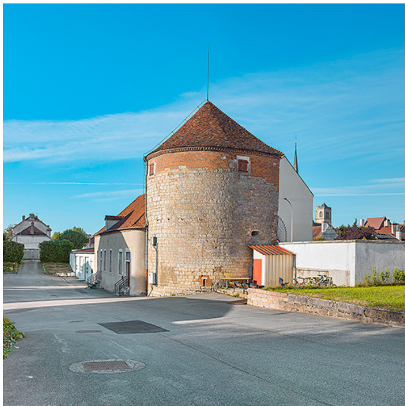
La tour Belvoir : face externe.