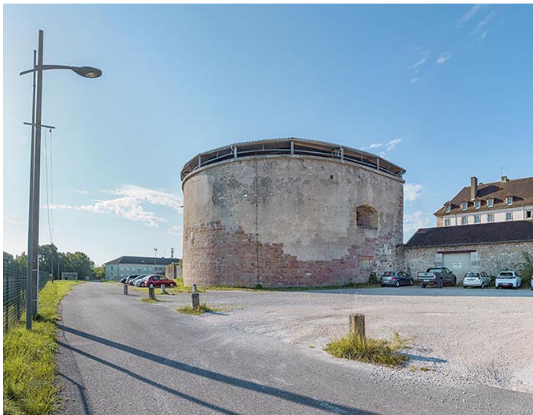
La tour, vue de trois quarts droit.