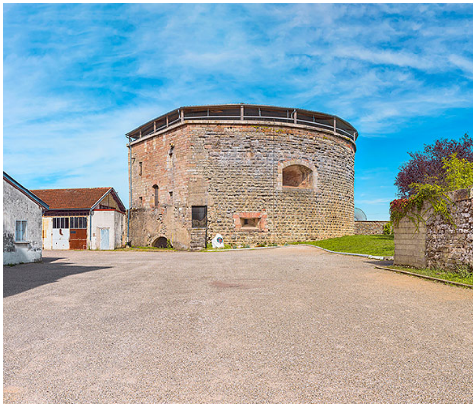
La tour du Cygne. 21, Auxonne