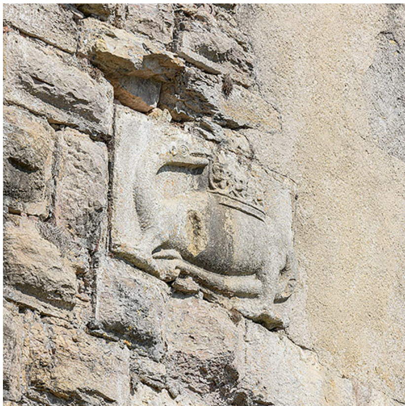
La salamandre, vue de trois quarts gauche. 21, Auxonne