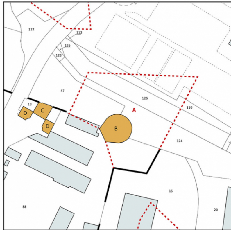
Plan-masse et de situation. Extrait du plan cadastral, 2023, 1/1 000. 21, Auxonne