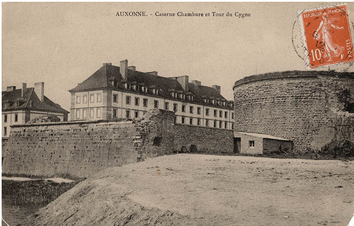
Auxonne. - Caserne Chambure et Tour du Cygne. S.d [1er quart 20e siècle]. 21, Auxonne