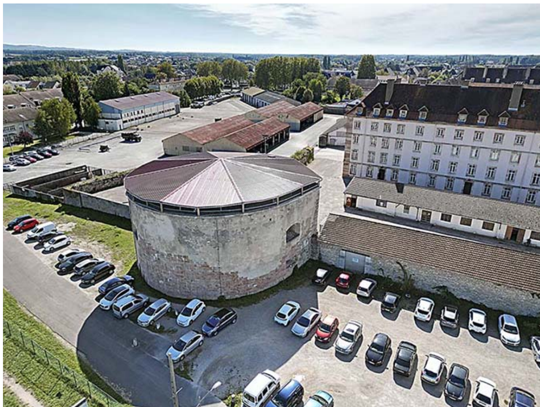
Vue aérienne de la tour. 21, Auxonne