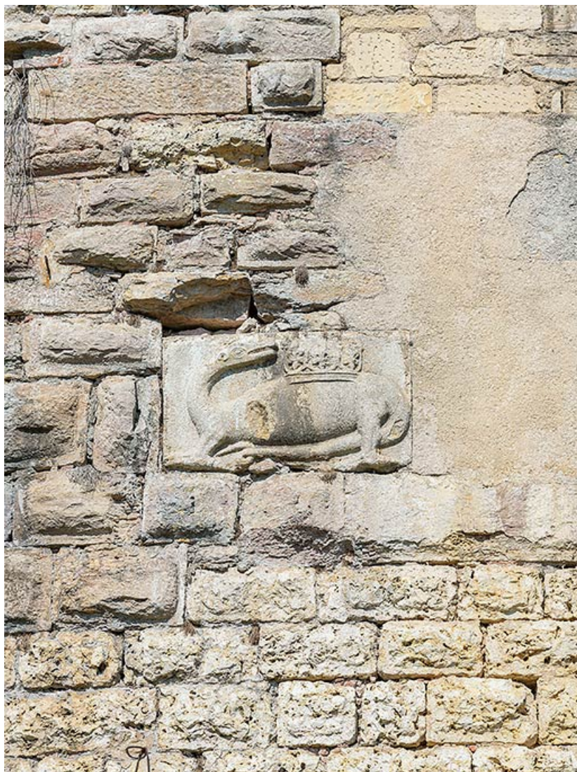
Salamandre sculptée sur la tour.