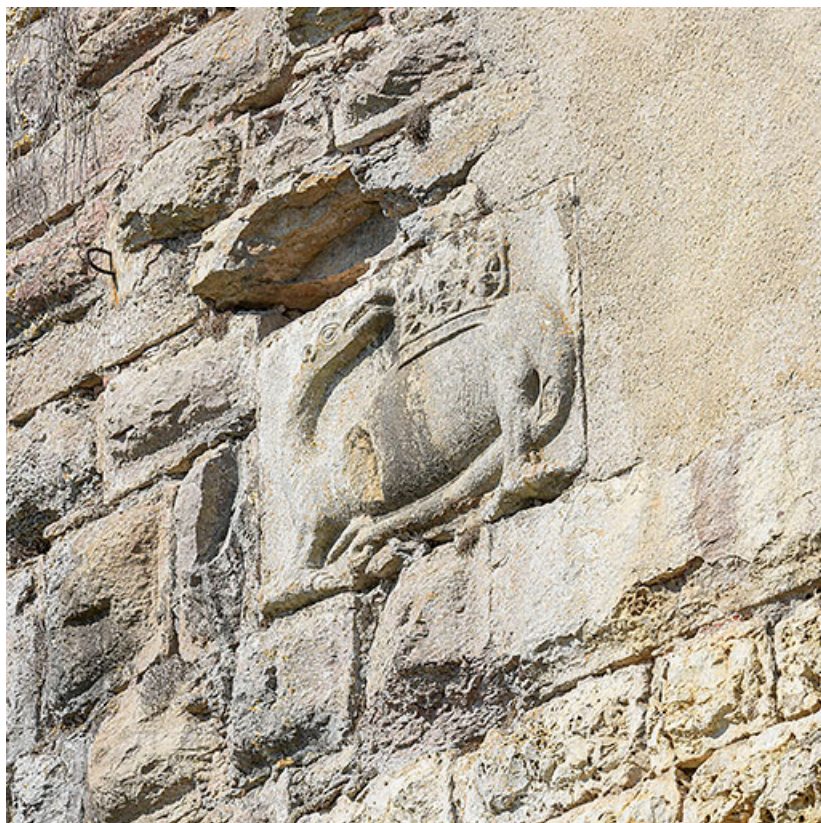
La salamandre, vue de trois quarts droite. 21, Auxonne