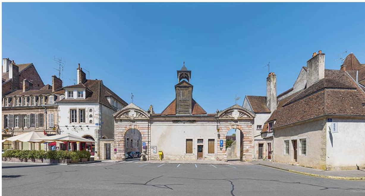
Vue d'ensemble depuis la rue Carnot.