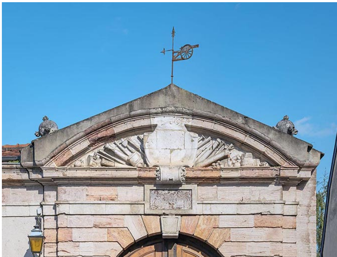
Fronton et son décor (de la rue du Capitaine Landolphe).