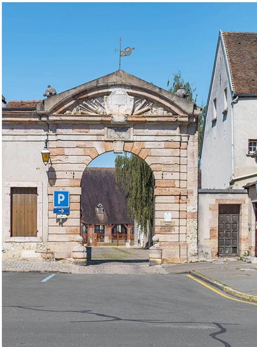
Portail ouvrant sur la rue du Capitaine Landolphe.