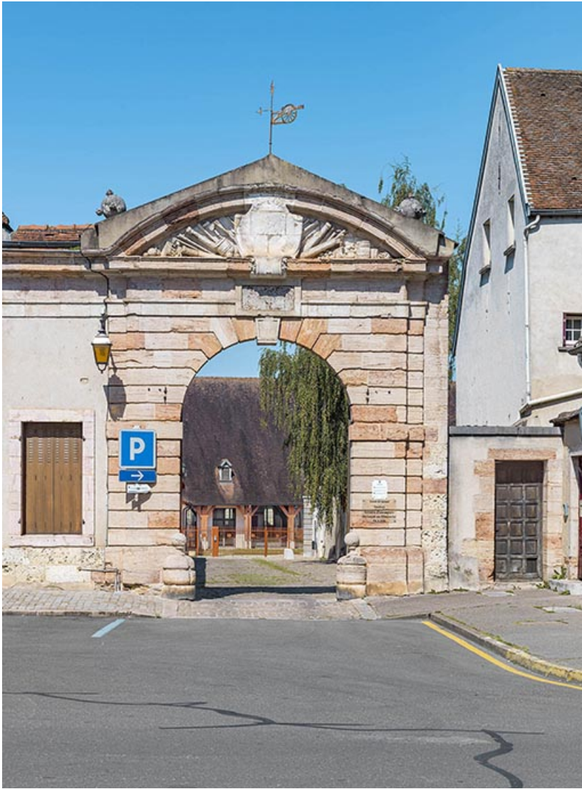
Portail ouvrant sur la rue du Capitaine Landolphe. 21, Auxonne rue Carnot