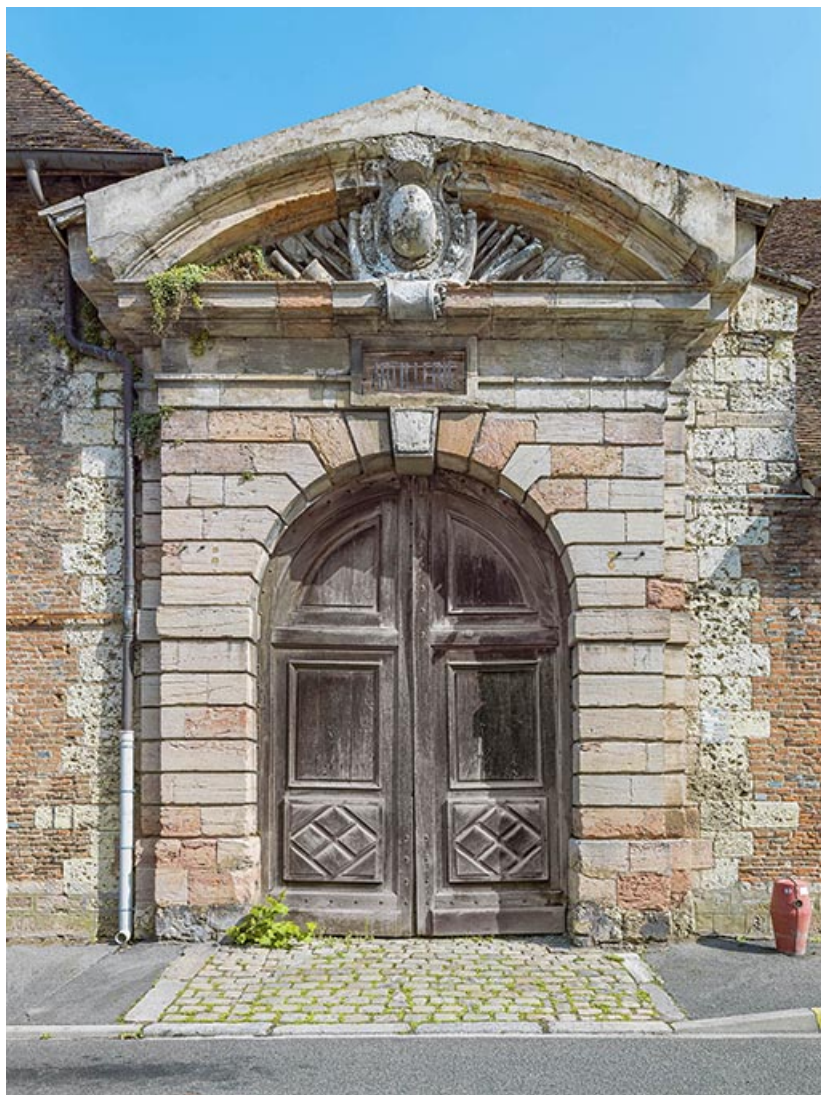
Portes d'entrée de l'arsenal, rue Vauban.