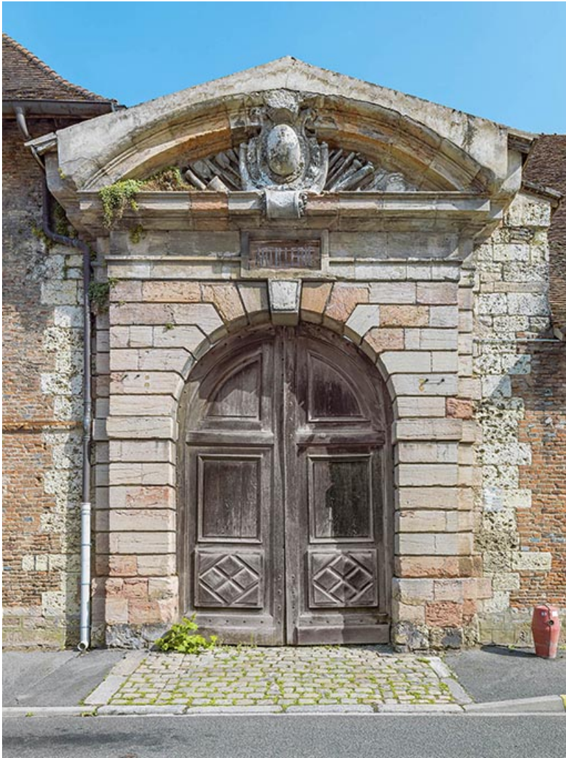
Portes d'entrée de l'arsenal, rue Vauban.