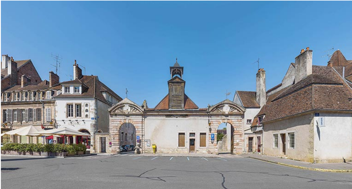
Vue d'ensemble depuis la rue Carnot.