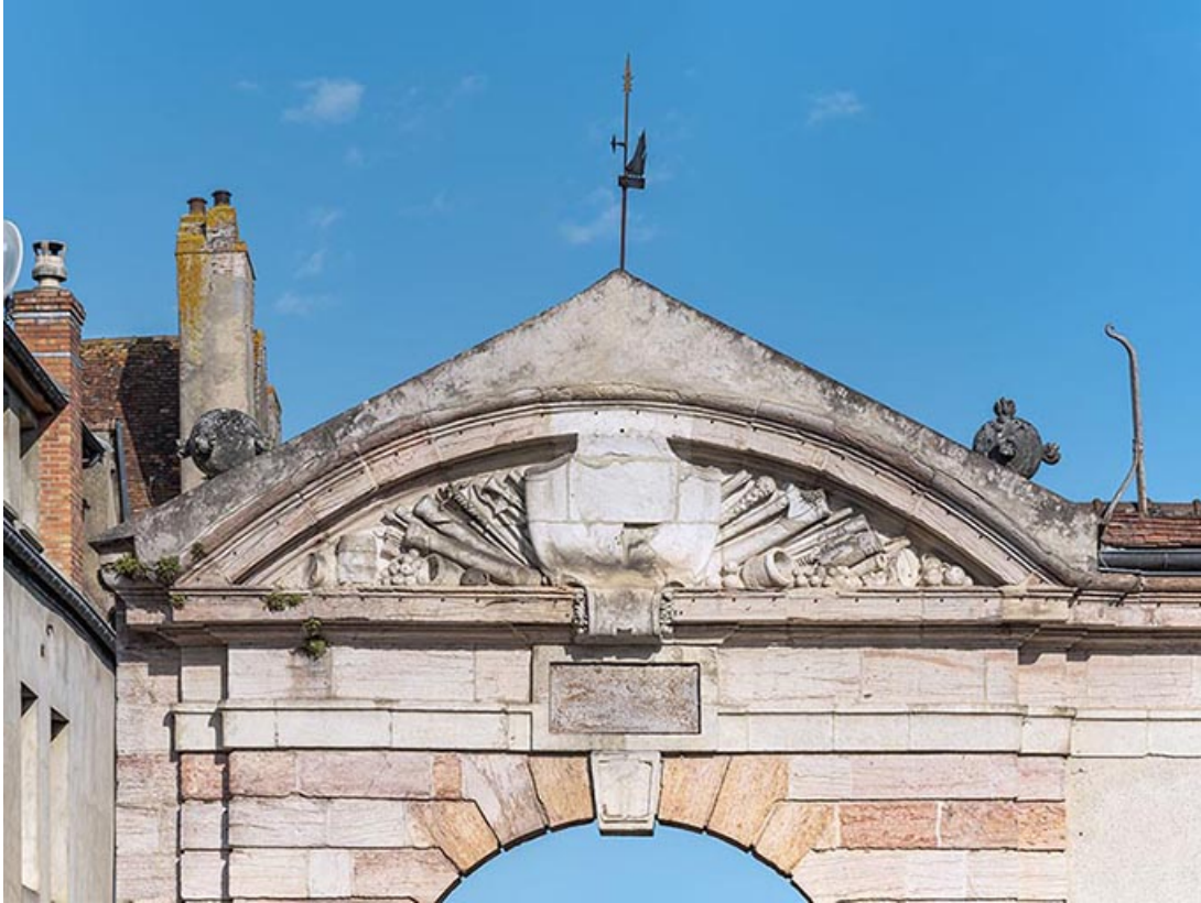
Fronton et son décor (de la rue des Halles). 21, Auxonne rue Carnot