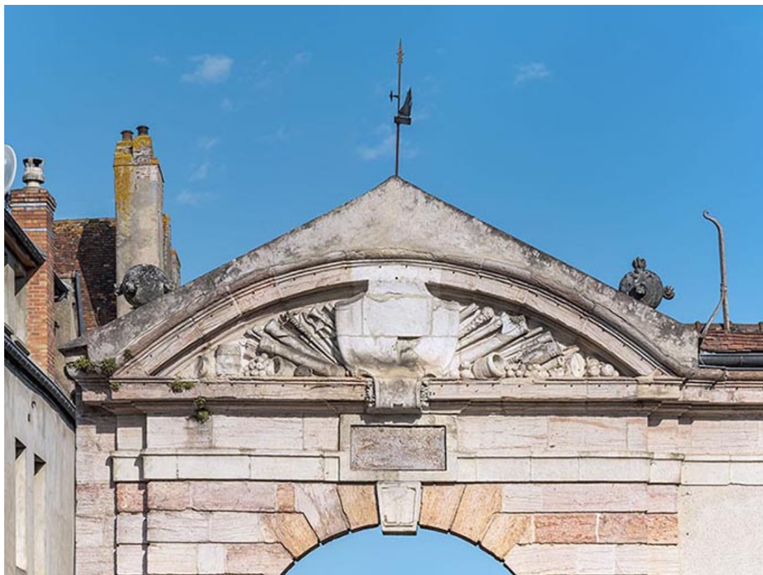
Fronton et son décor (de la rue des Halles).