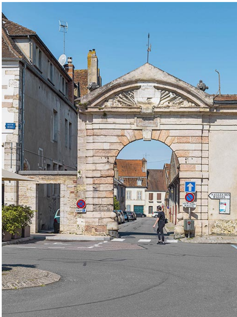
Portail de la rue des Halles.