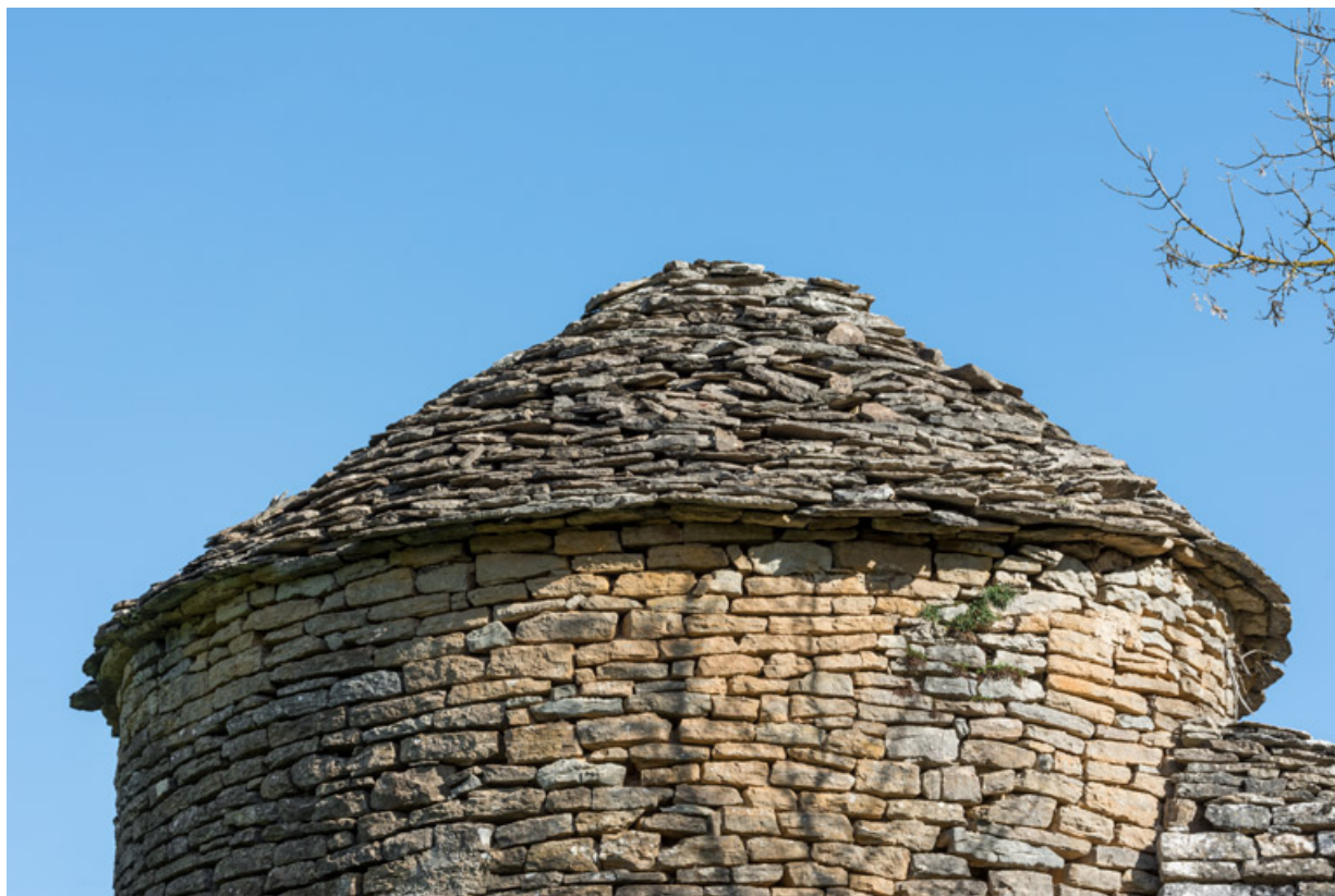
Détail de la toiture est. 21, Salives rue d' Amont