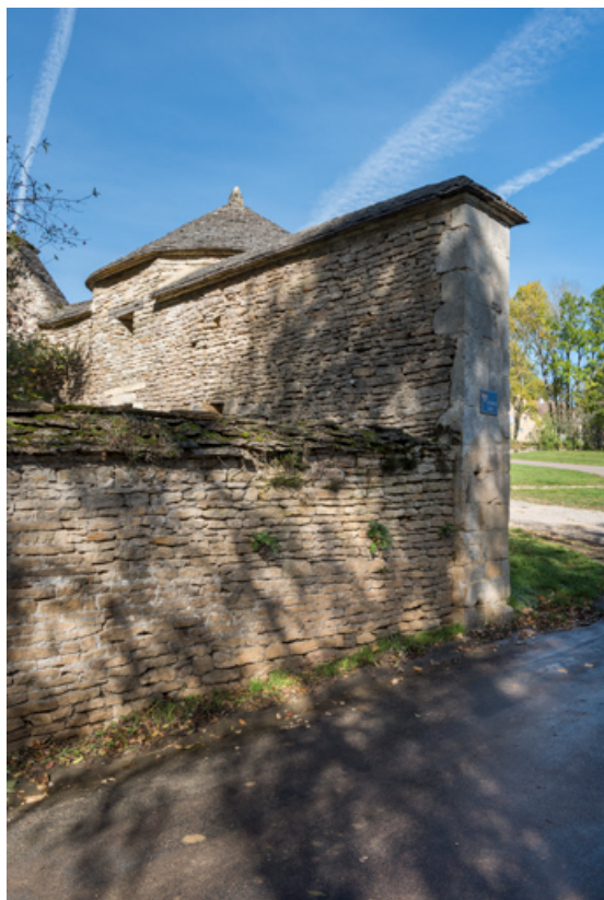
Rempart entrée ouest. 21, Salives rue d' Amont