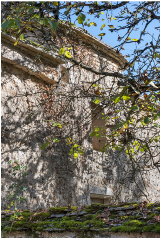
Rempart entrée ouest. 21, Salives rue d' Amont