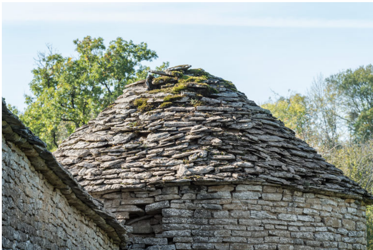
Détail de la toiture tour sud.