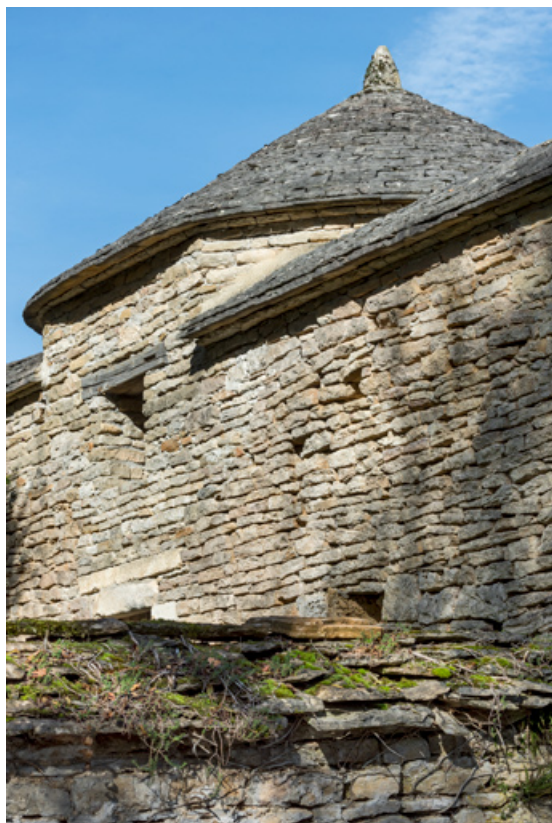
Rempart entrée ouest. 21, Salives rue d' Amont