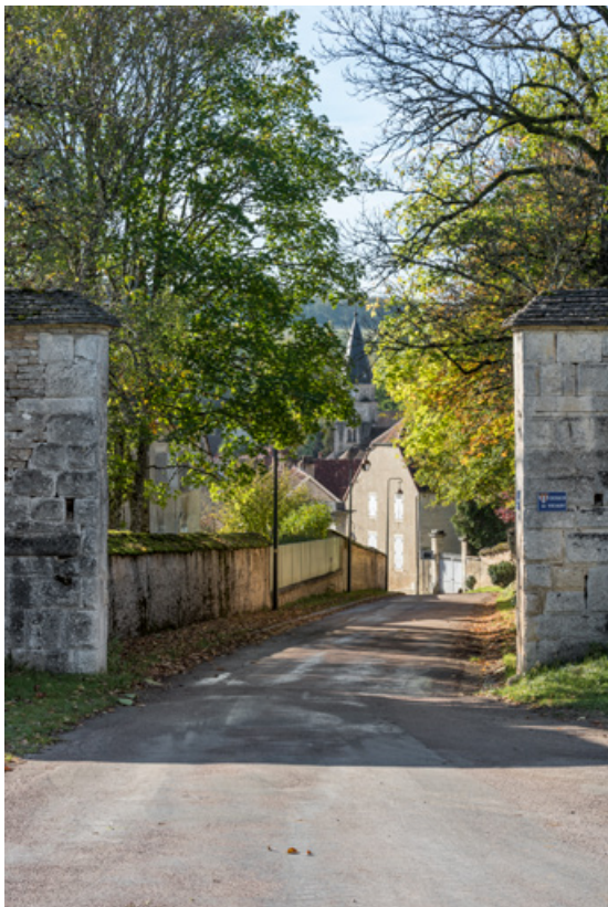
Rempart entrée ouest. 21, Salives rue d' Amont