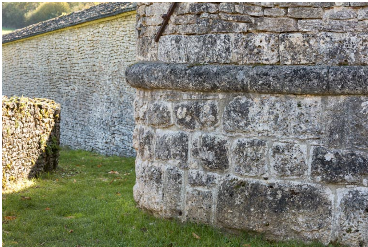
Détail du soubassement de la tour entrée ouest.