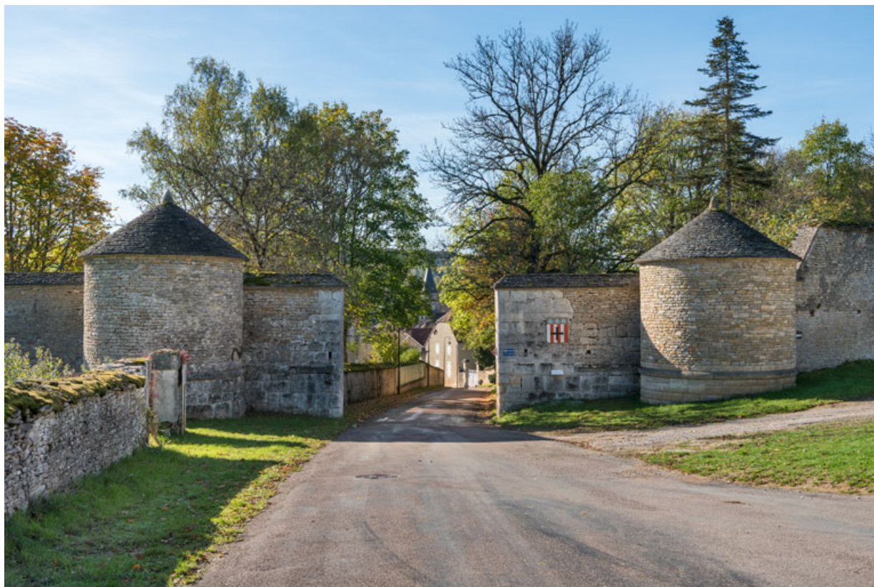
Vue d'ensemble des tours à l'entrée ouest.