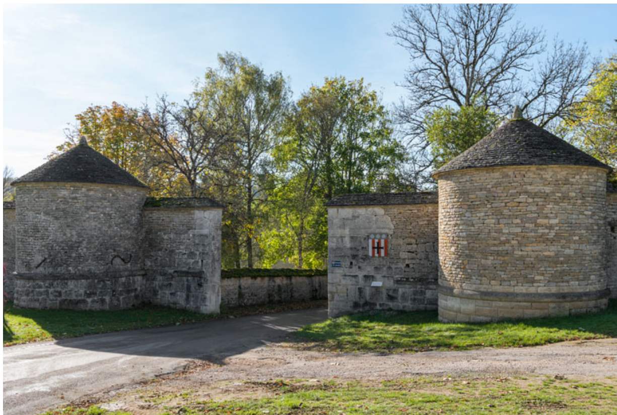
Vue d'ensemble des tours à l'entrée ouest.