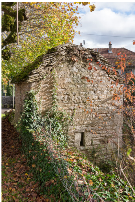
Vue de la façade ouest.