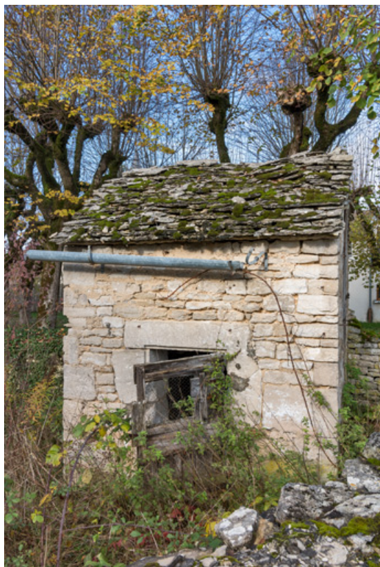
Vue de la façade sud.