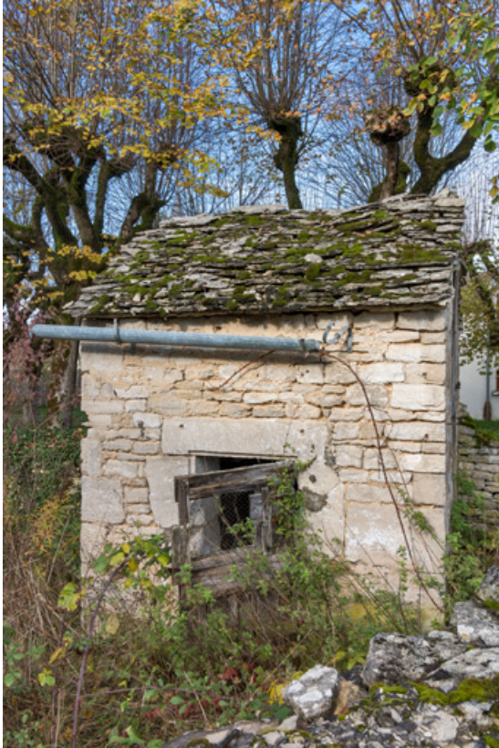
Vue de la façade sud.