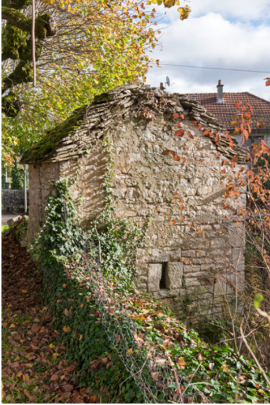
Vue de la façade ouest.