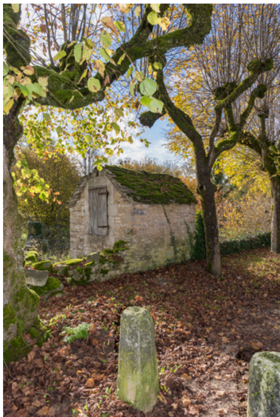
Vue d'ensemble depuis le nord-est.