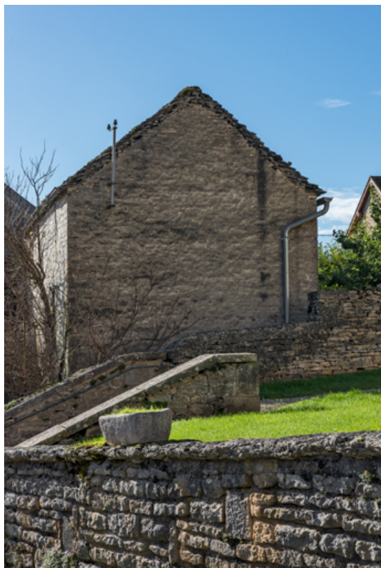
Vue du mur pignon nord.