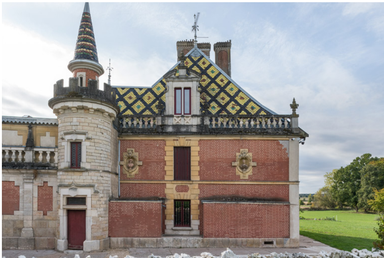
Bustes sur l'élévation nord de la maison.