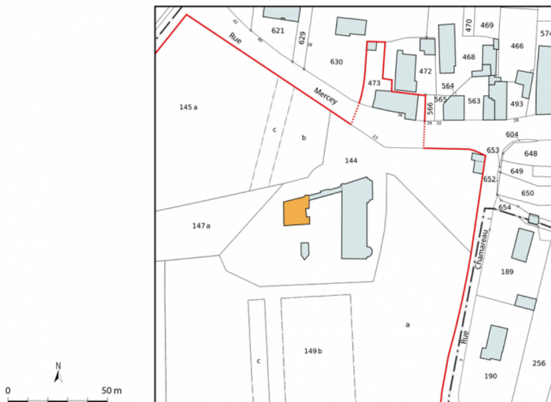
Plan-masse et de situation. Extrait du plan cadastral, 2021, section D, 1/1 250 agrandi à 1/1 000. 21, Chevigny-en-Valière, 2 rue Mercey