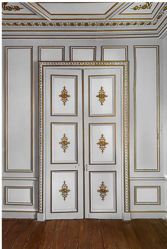
Bureau à l'étage : porte du palais des Tuileries, à Paris.