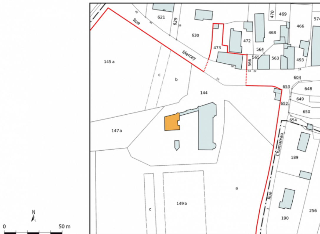
Plan-masse et de situation. Extrait du plan cadastral, 2021, section D, 1/1 250 agrandi à 1/1 000. 21, Chevigny-en-Valière, 2 rue Mercey