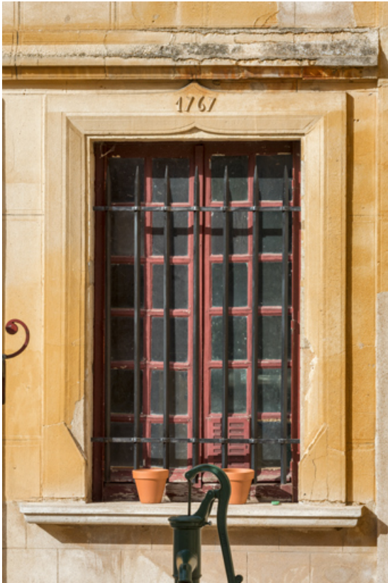
Élévation antérieure : fenêtre portant la date 1767.