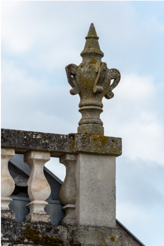
Elévation latérale droite : motif d'amortissement.