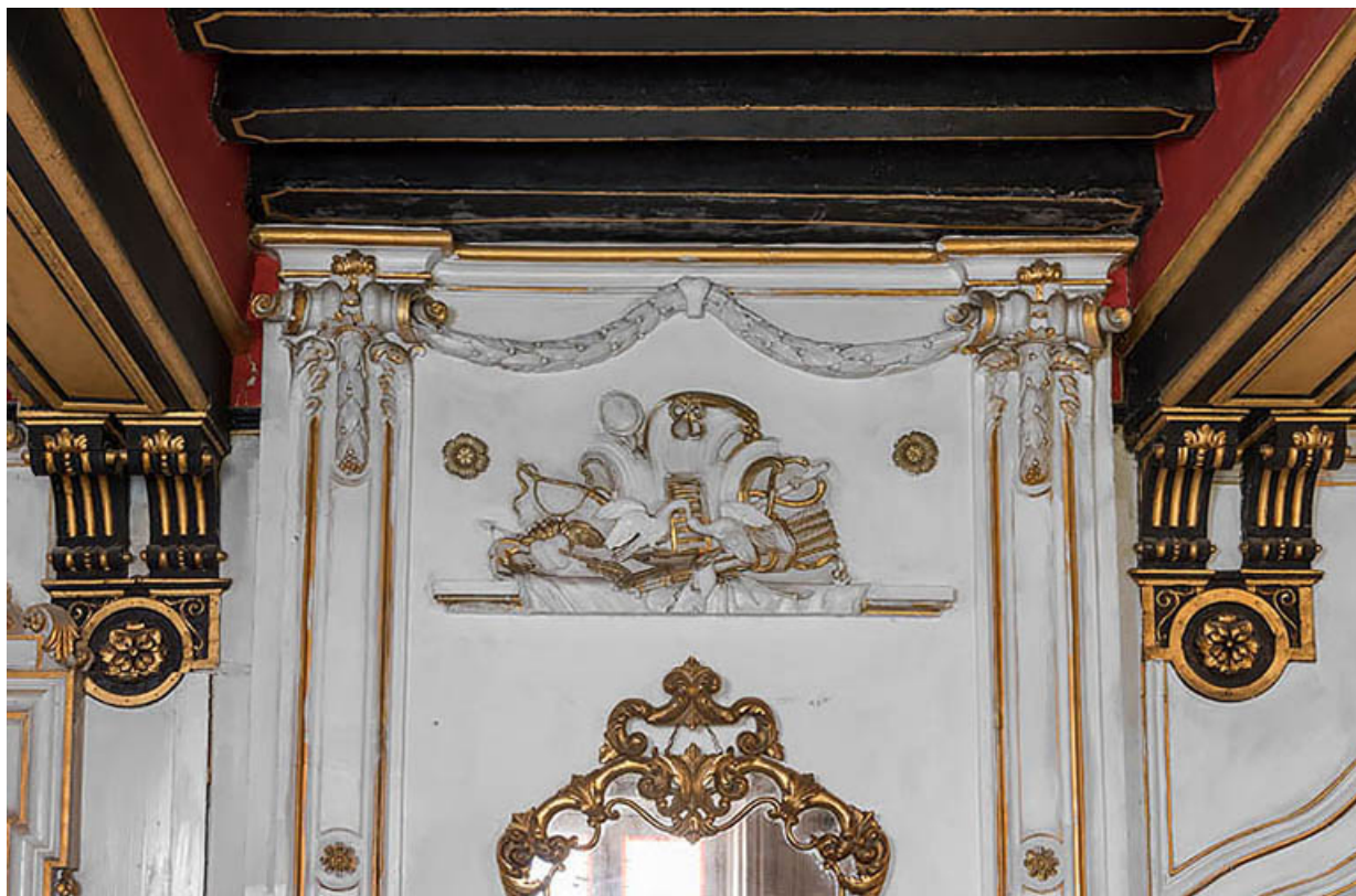
Salon : décor du trumeau de cheminée.