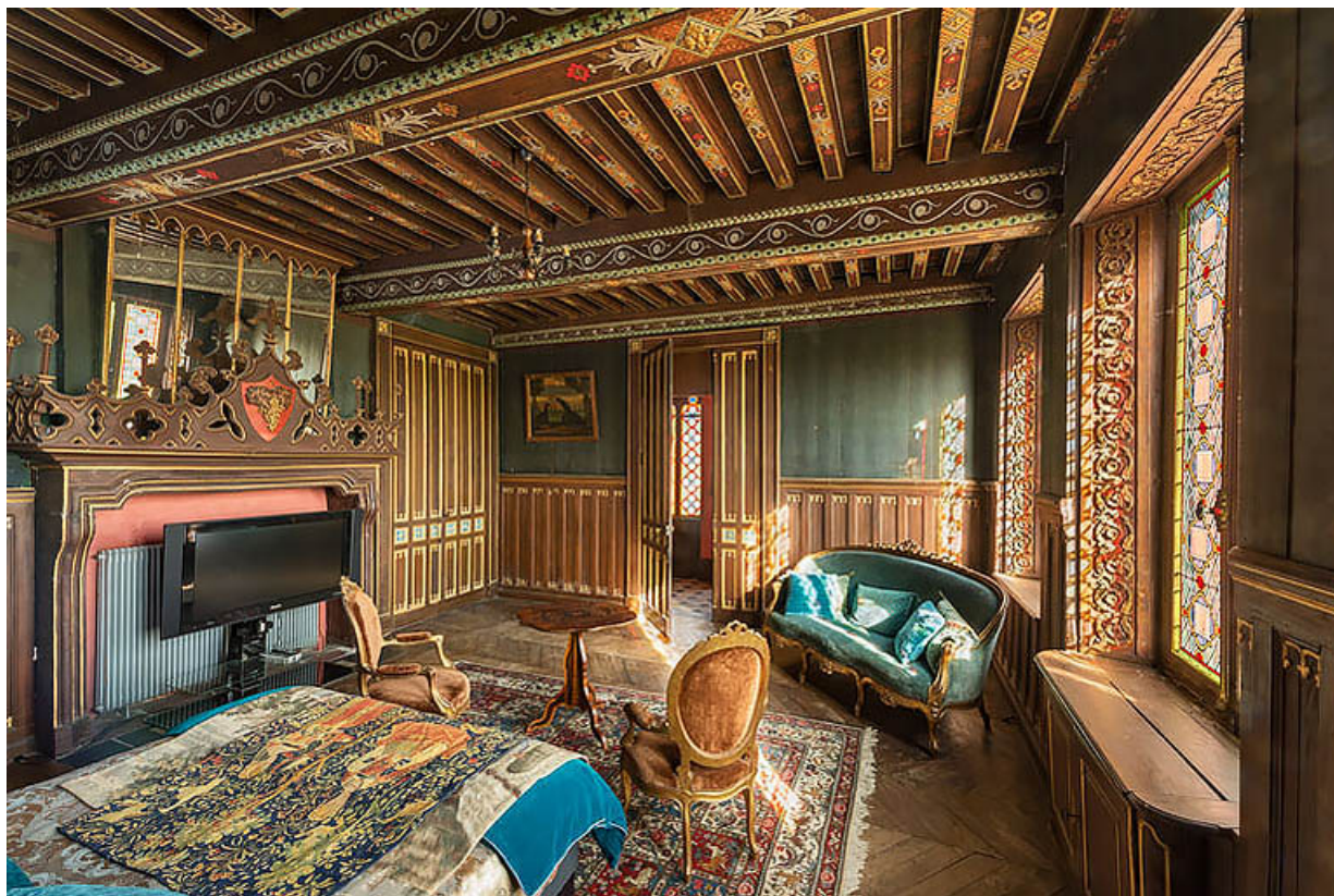
Salle à manger de l'étage (actuellement chambre à coucher), à décor d'inspiration gothique. 21, Chevigny-en-Vallière, 2 rue Mercey