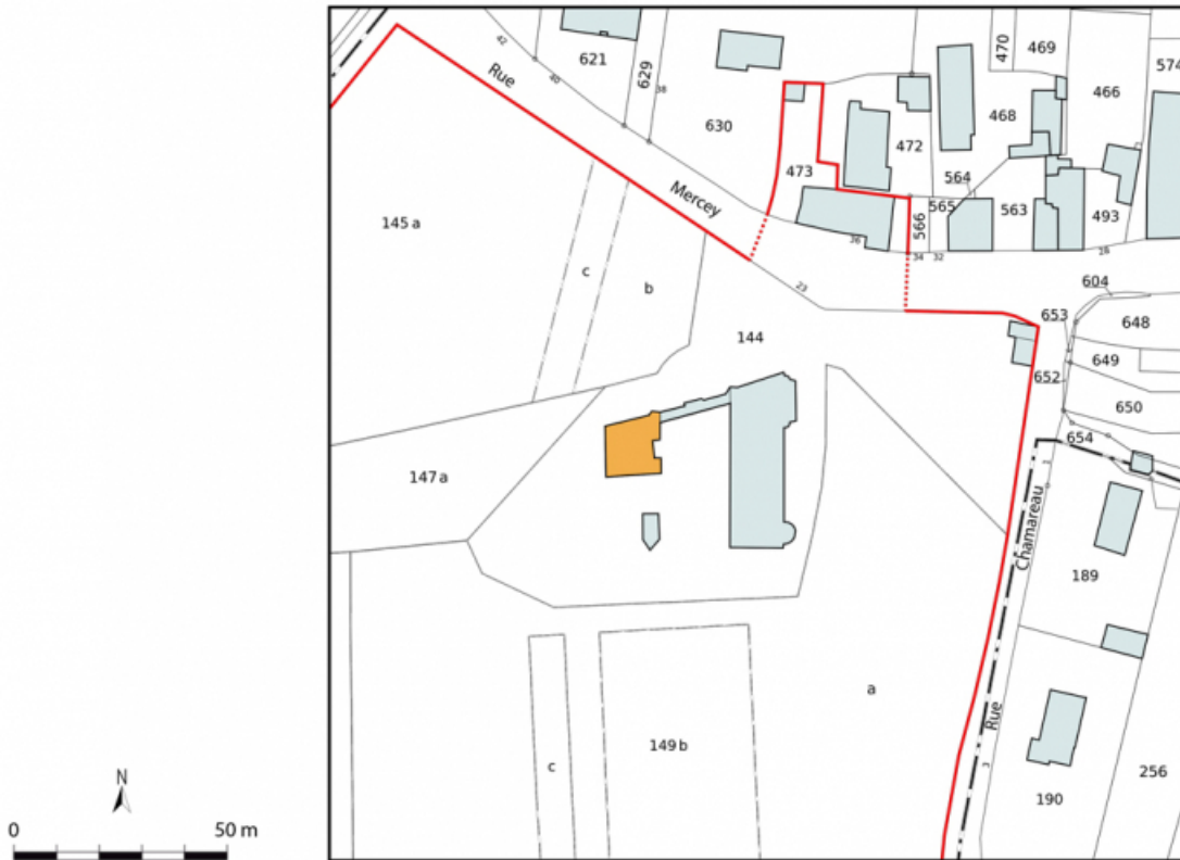
Plan-masse et de situation. Extrait du plan cadastral, 2021, section D, 1/1 250 agrandi à 1/1 000. 21, Chevigny-en-Valière, 2 rue Mercey