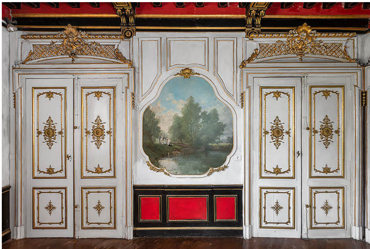
Salon : portes provenant de l'ambassade de Russie, rue du Faubourg Saint-Honoré à Paris.