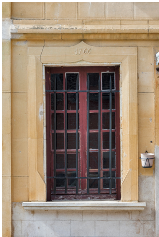
Elévation antérieure : fenêtre portant la date 1766.