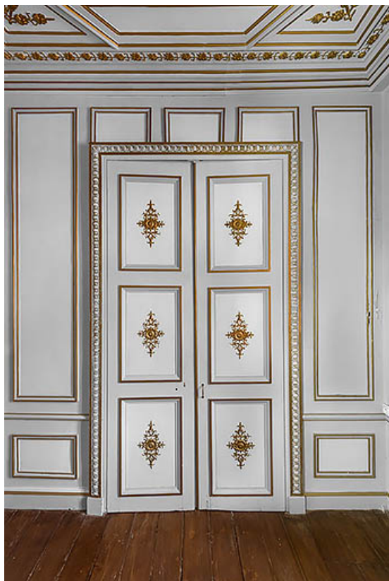
Bureau à l'étage : porte du palais des Tuileries, à Paris.