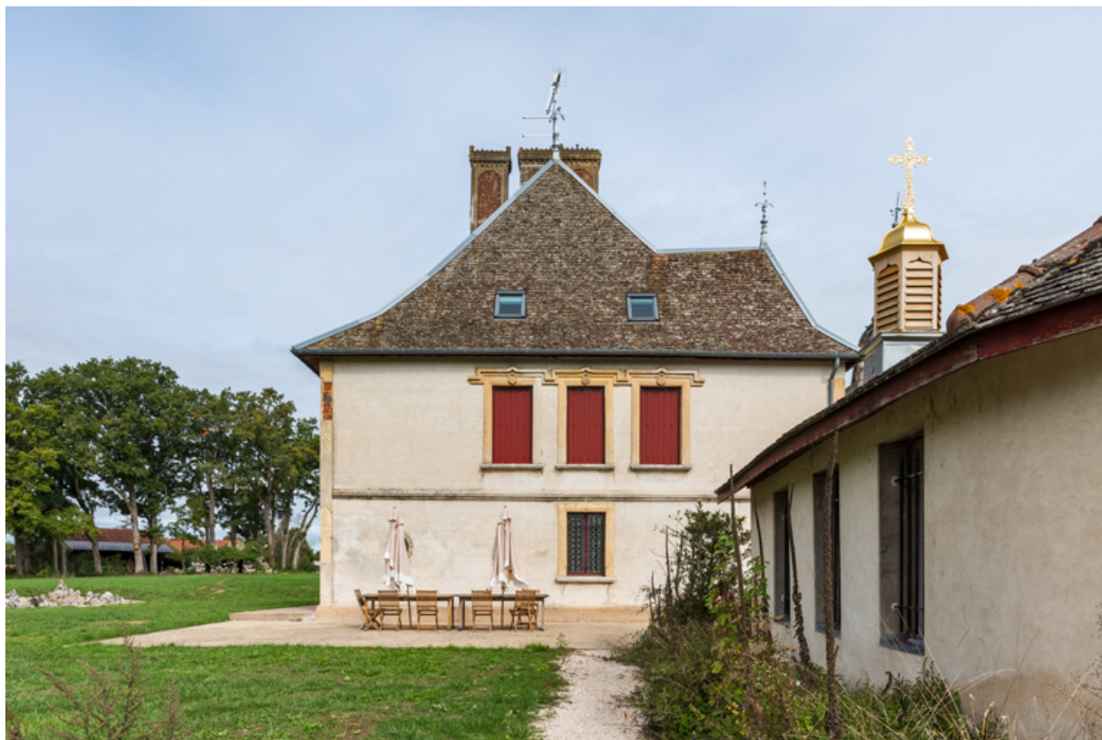
Elévation latérale gauche (sud).