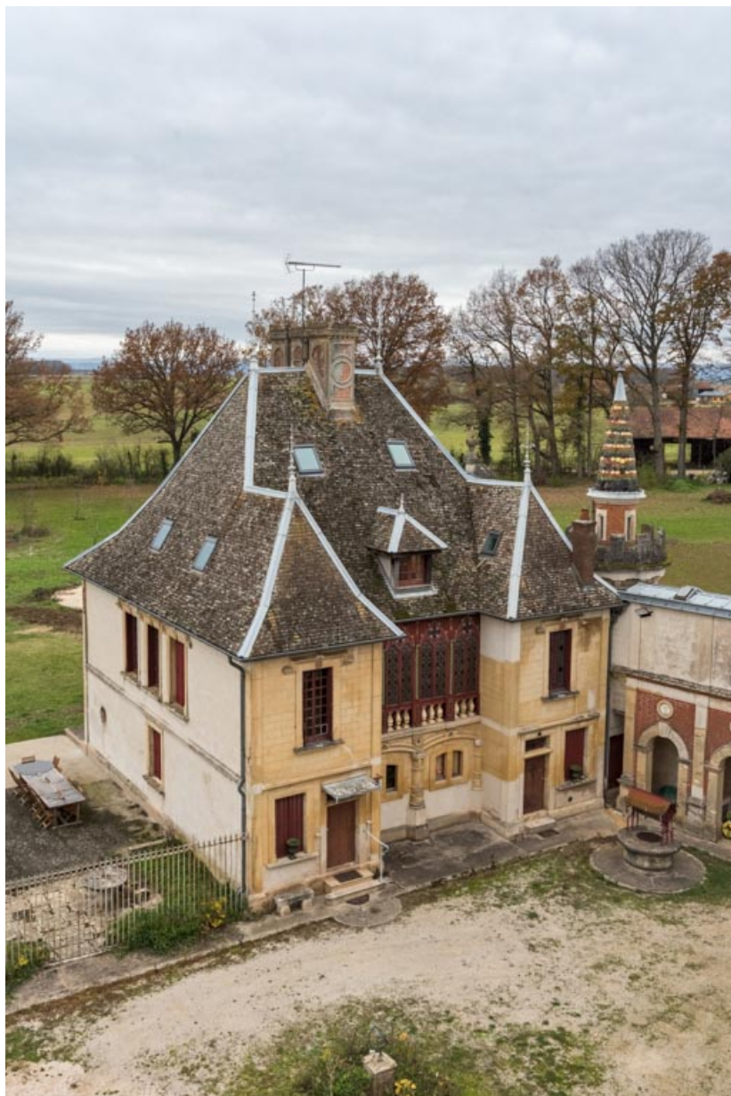
Vue plongeante depuis le "Donjon".