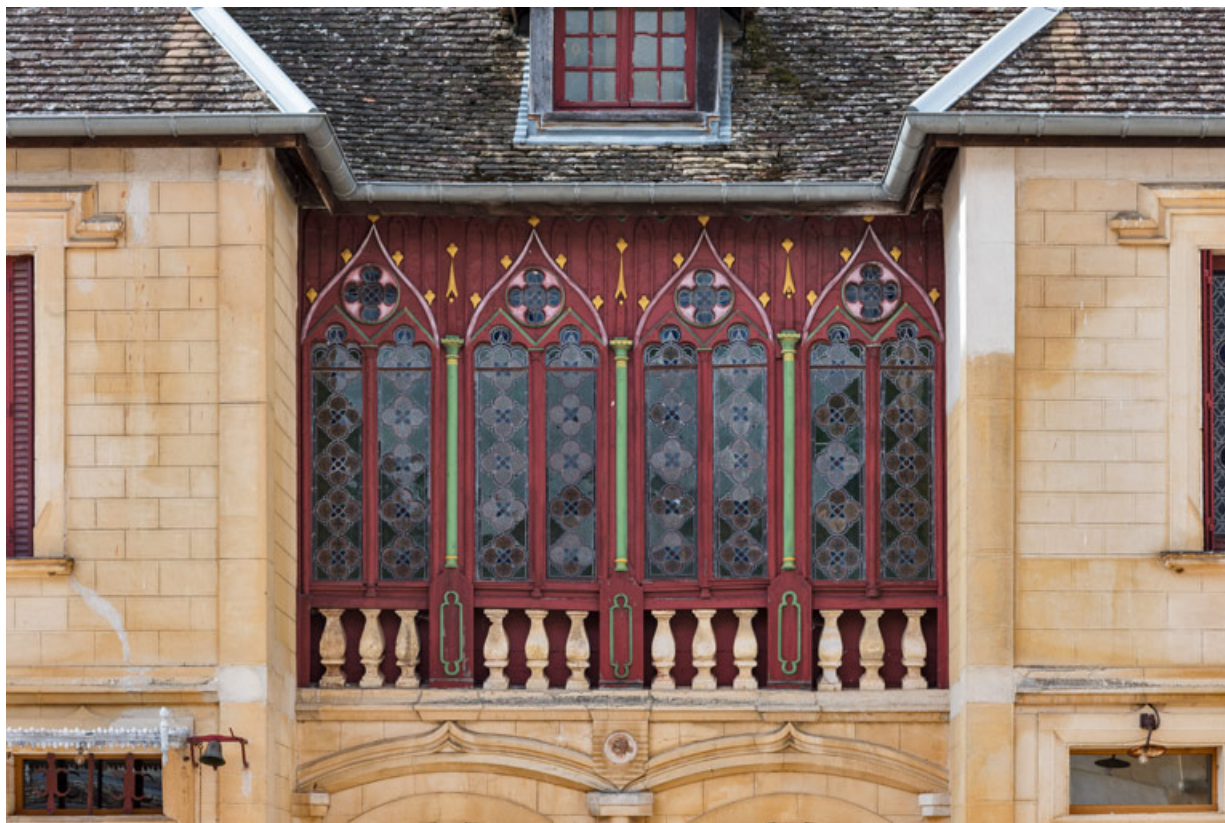
Elévation antérieure : galerie à l'étage.