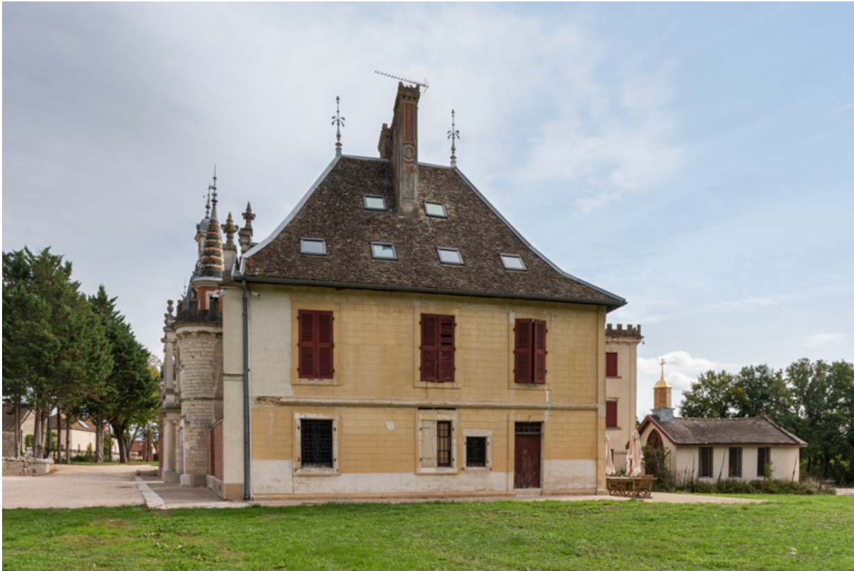
Elévation postérieure (ouest).