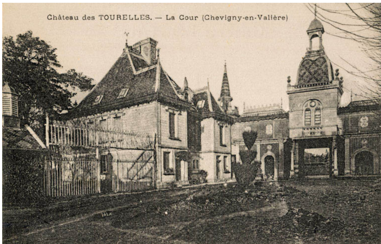
Château des Tourelles. - La Cour (Chevigny-en-Valière). S.d. [1re moitié 20e siècle].