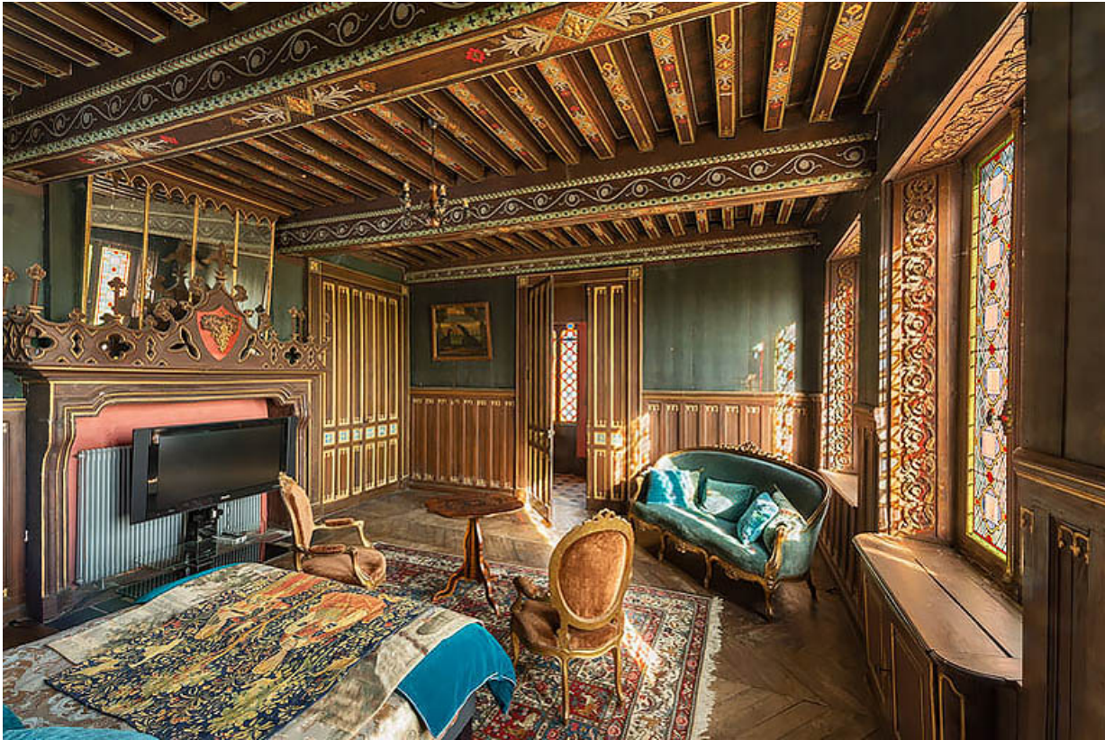
Salle à manger de l'étage (actuellement chambre à coucher), à décor d'inspiration gothique. 21, Chevigny-en-Valière, 2 rue Mercey