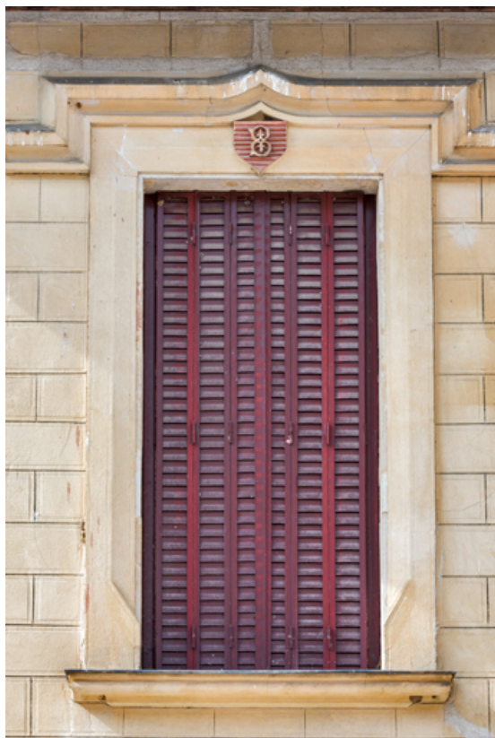
Élévation antérieure : fenêtre à l'étage avec la lettre B. 21, Chevigny-en-Valière, 2 rue Mercey