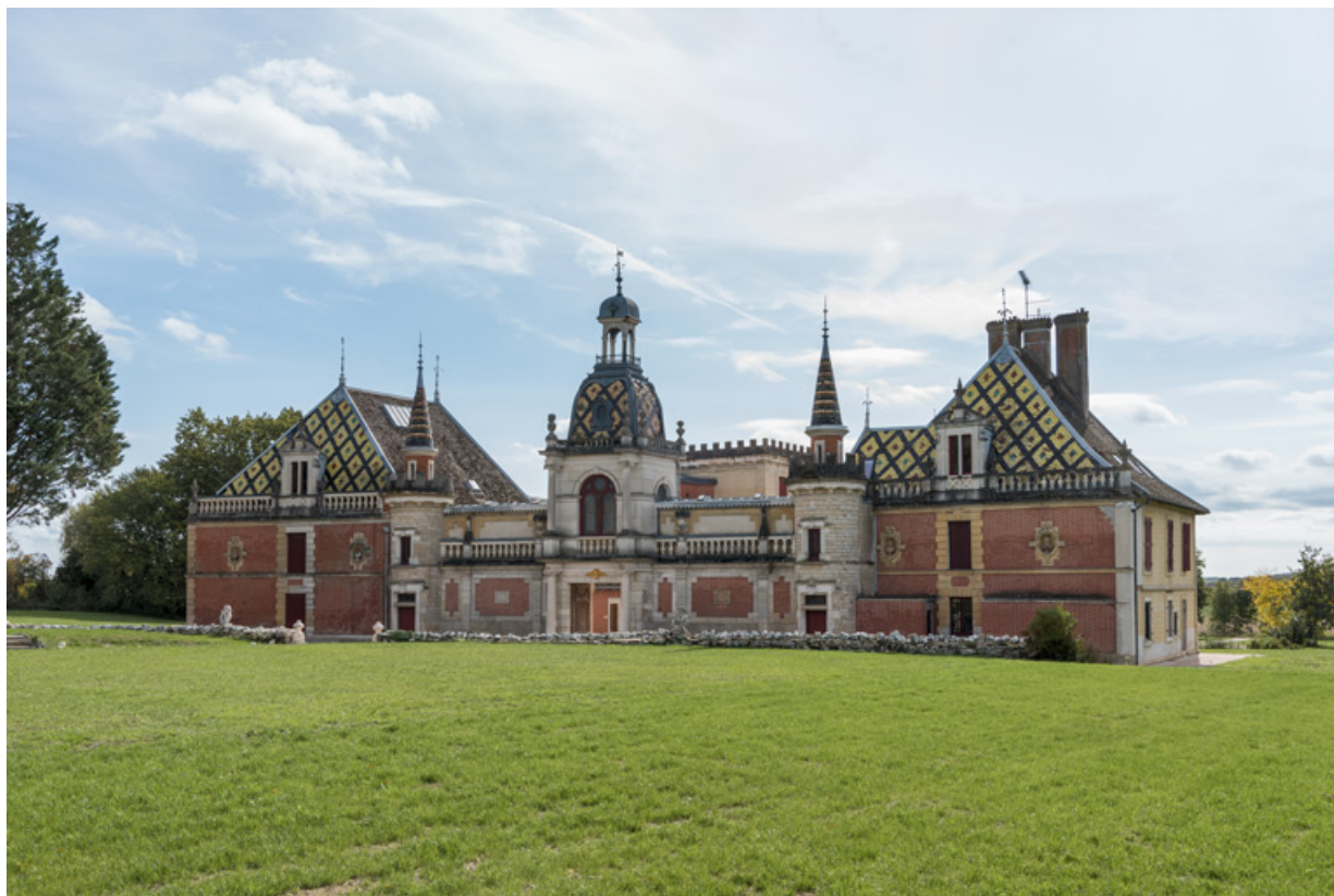
Vue d'ensemble, depuis le nord-ouest.