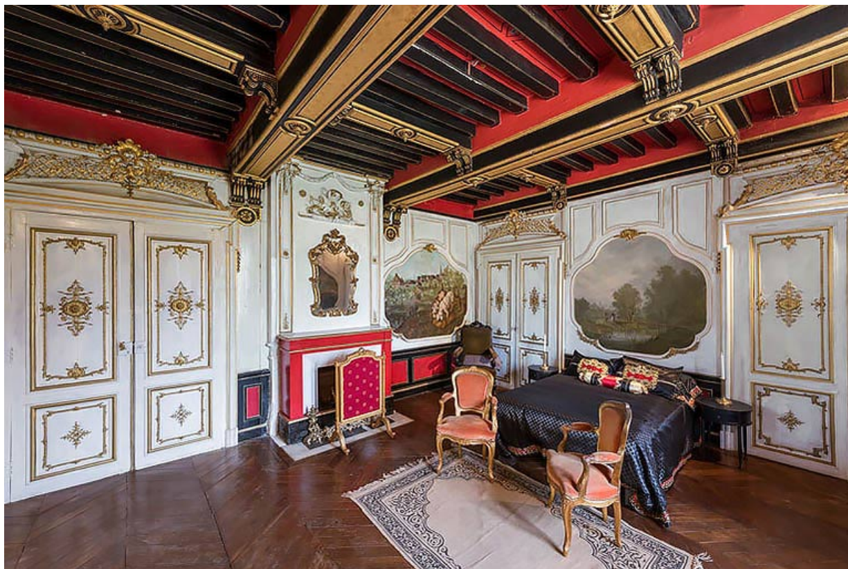
Demeure (salon à l'étage) : portes de l'ambassade de Russie et peintures de Druard et de Couturier. 21, Chevigny-en-Valière, 23 rue Mercey