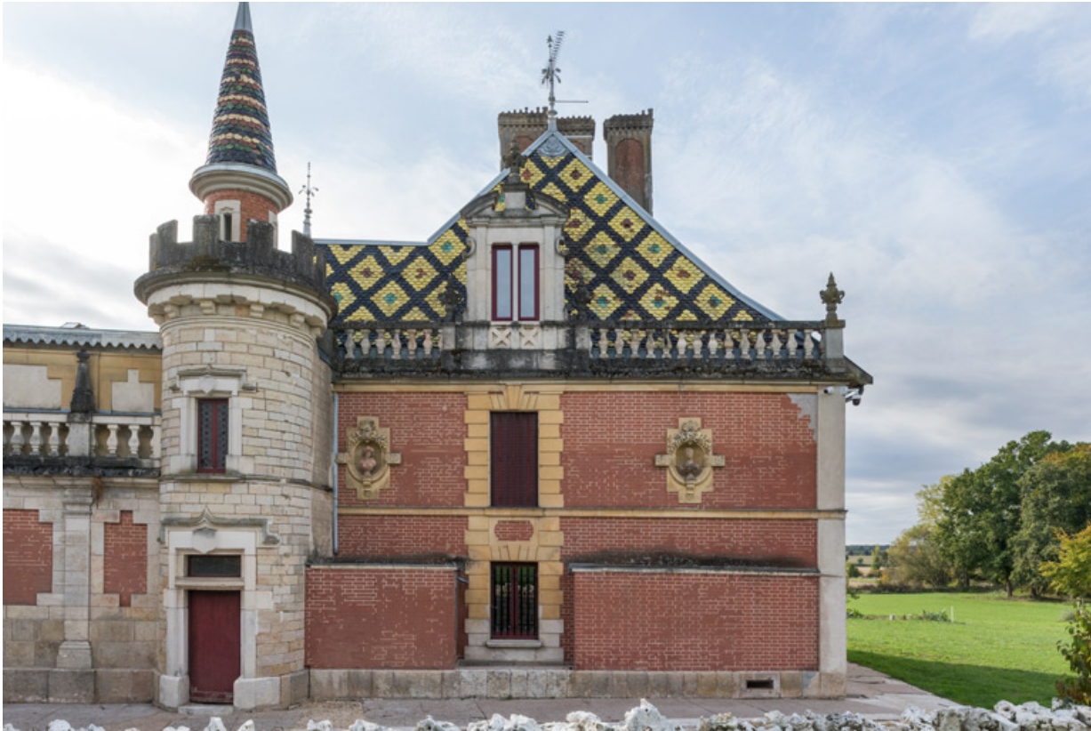
Bustes sur l'élévation nord de la maison.