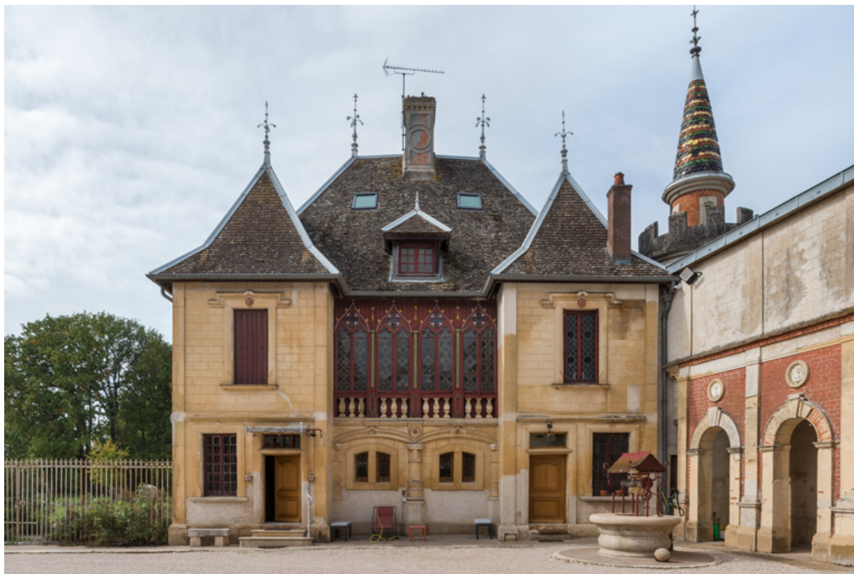
Elévation antérieure (est).