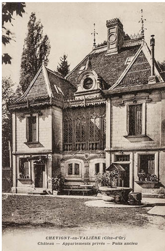
Chevigny-en-Valière (Côte-d'Or). Château - Appartements privés - Puits ancien. S.d. [1re moitié 20e siècle, avant 1942]. 21, Chevigny-en-Valière, 2 rue Mercey