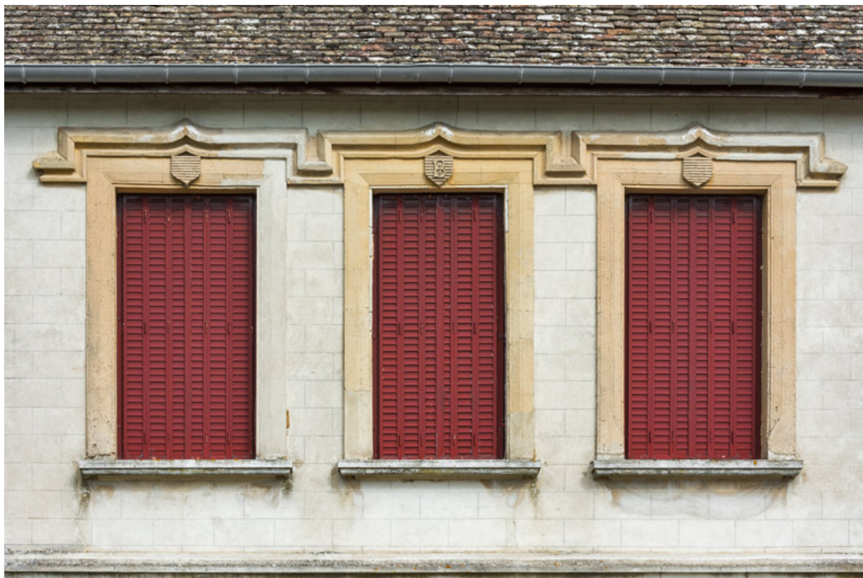
Elévation latérale gauche : baies de l'étage.