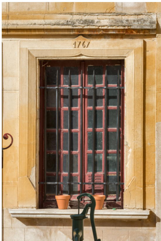
Élévation antérieure : fenêtre portant la date 1767.