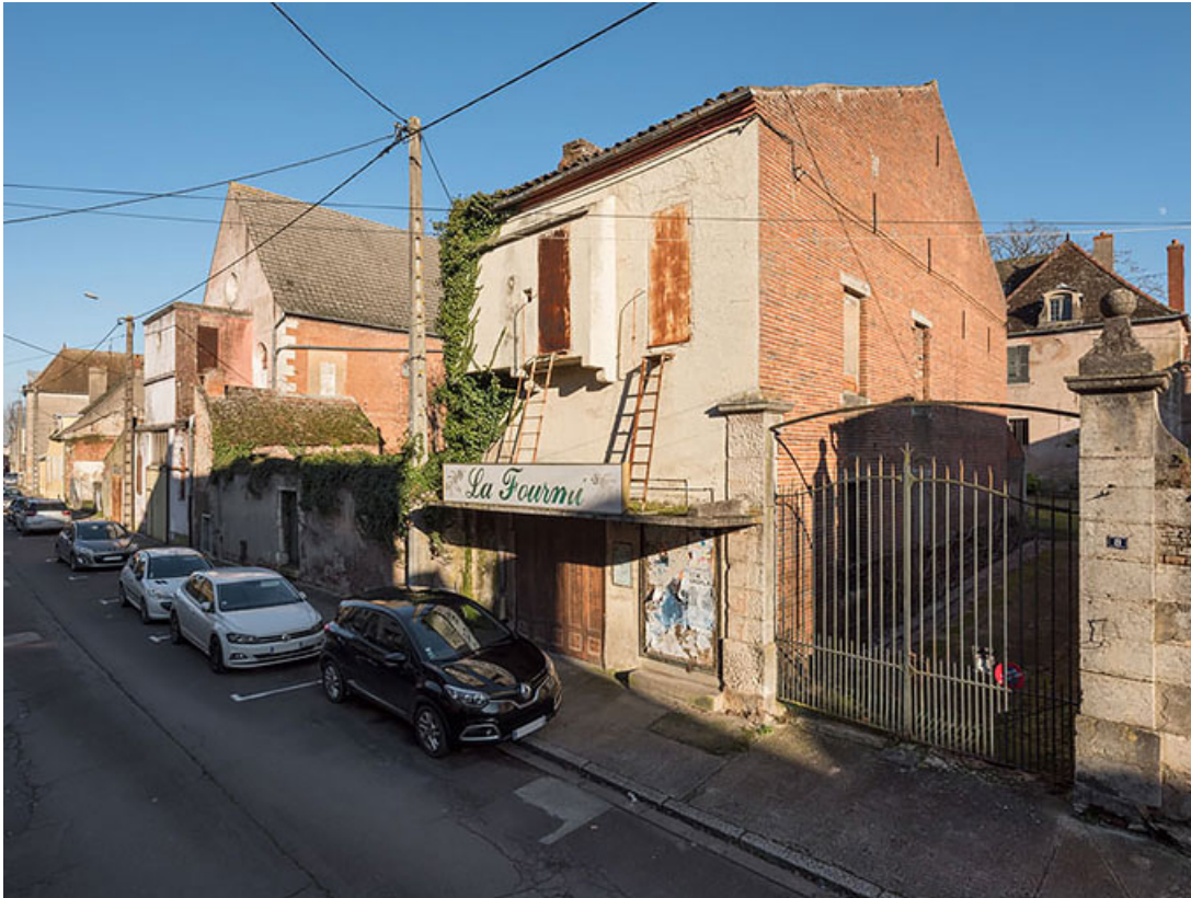
Vue d'ensemble, depuis le sud. La salle dite des Capucines est visible au second plan. 21, Seurre, 10 rue des Lombards