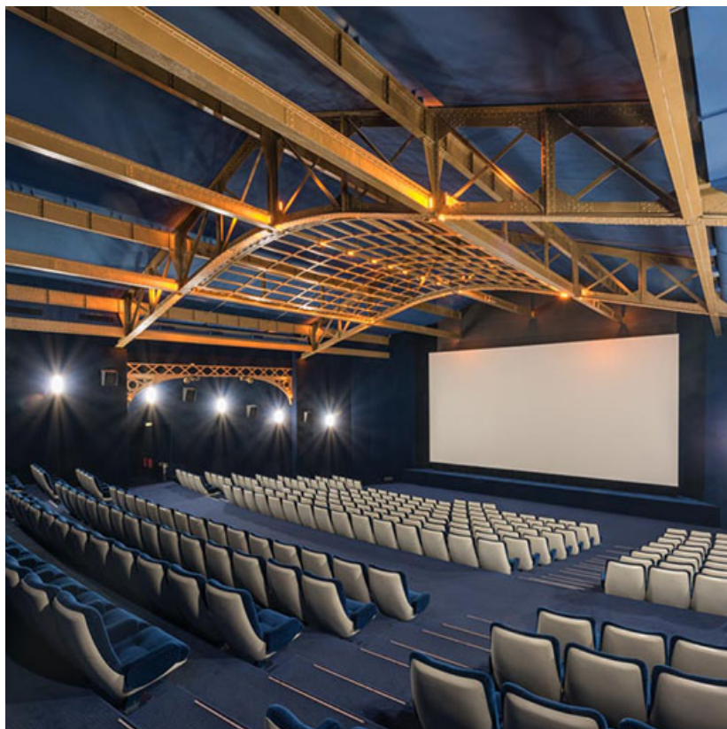
Grande Taverne : la grande salle. 21, Dijon