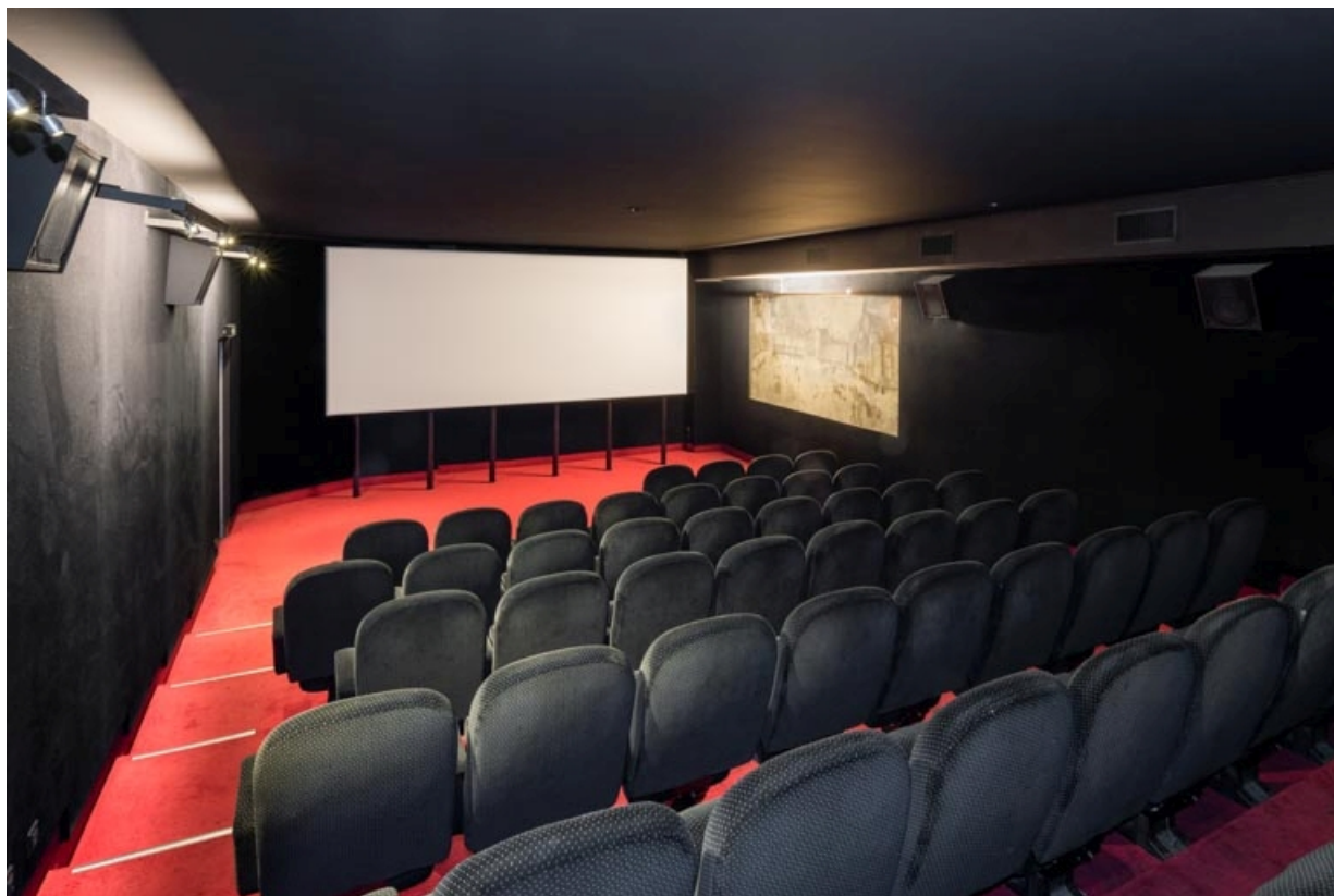
Salle 9 : vue d'ensemble vers l'écran, avec la peinture murale à droite.

21, Dijon, 16-26 avenue du Maréchal Foch