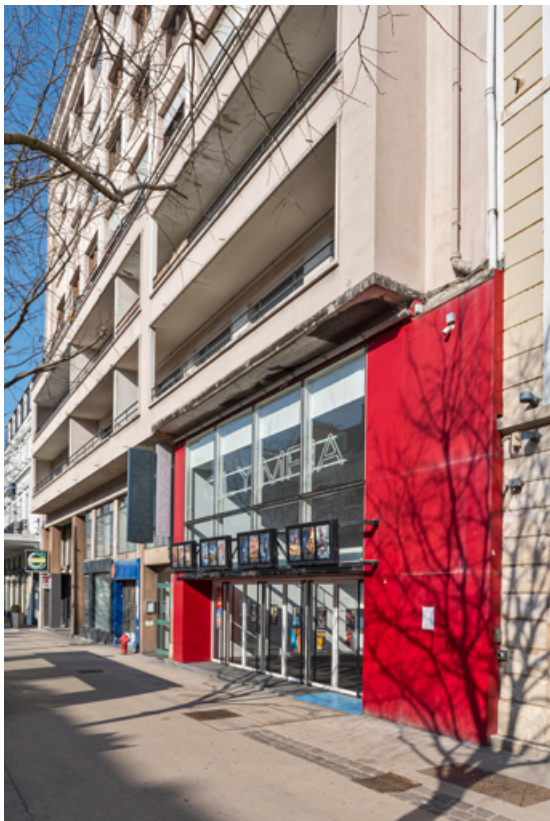
Immeuble rue Maréchal Foch, façade antérieure : entrée du cinéma. 21, Dijon, 16-26 avenue du Maréchal Foch