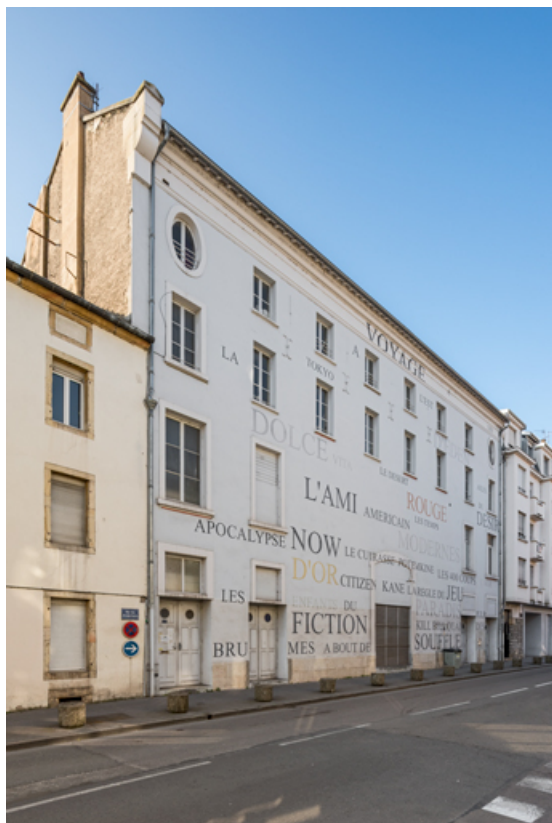
Batiment d'origine rue des Perrières : façade antérieure, de trois quarts gauche (vue rapprochée). 21, Dijon, 16-26 avenue du Maréchal Foch