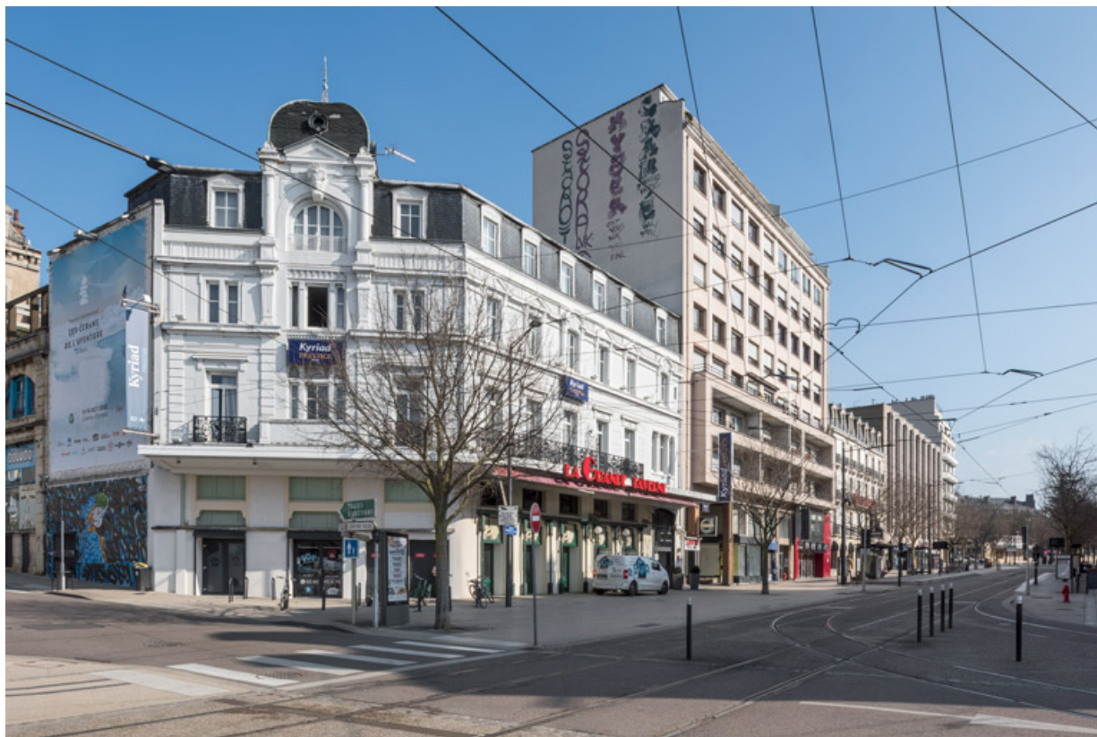
Salle de spectacle dite la Grande Taverne (à gauche) et cinéma Olympia (16-26 avenue du Maréchal Foch), 21, Dijon