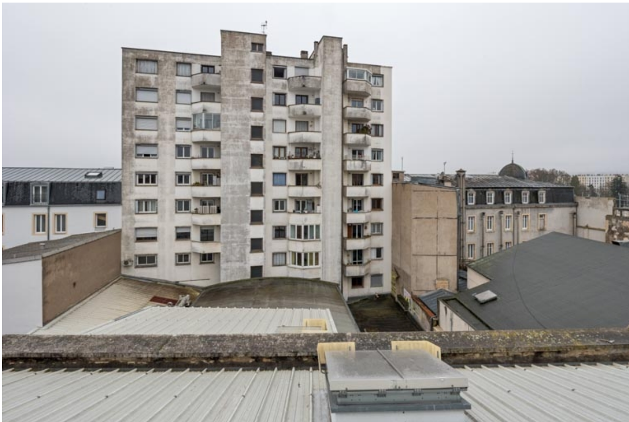
Immeuble rue Maréchal Foch : façade postérieure, vue depuis le bâtiment d'origine rue des Perrières. Entre les deux, la salle 3 à gauche et la salle 2 à droite.

21, Dijon, 16-26 avenue du Maréchal Foch