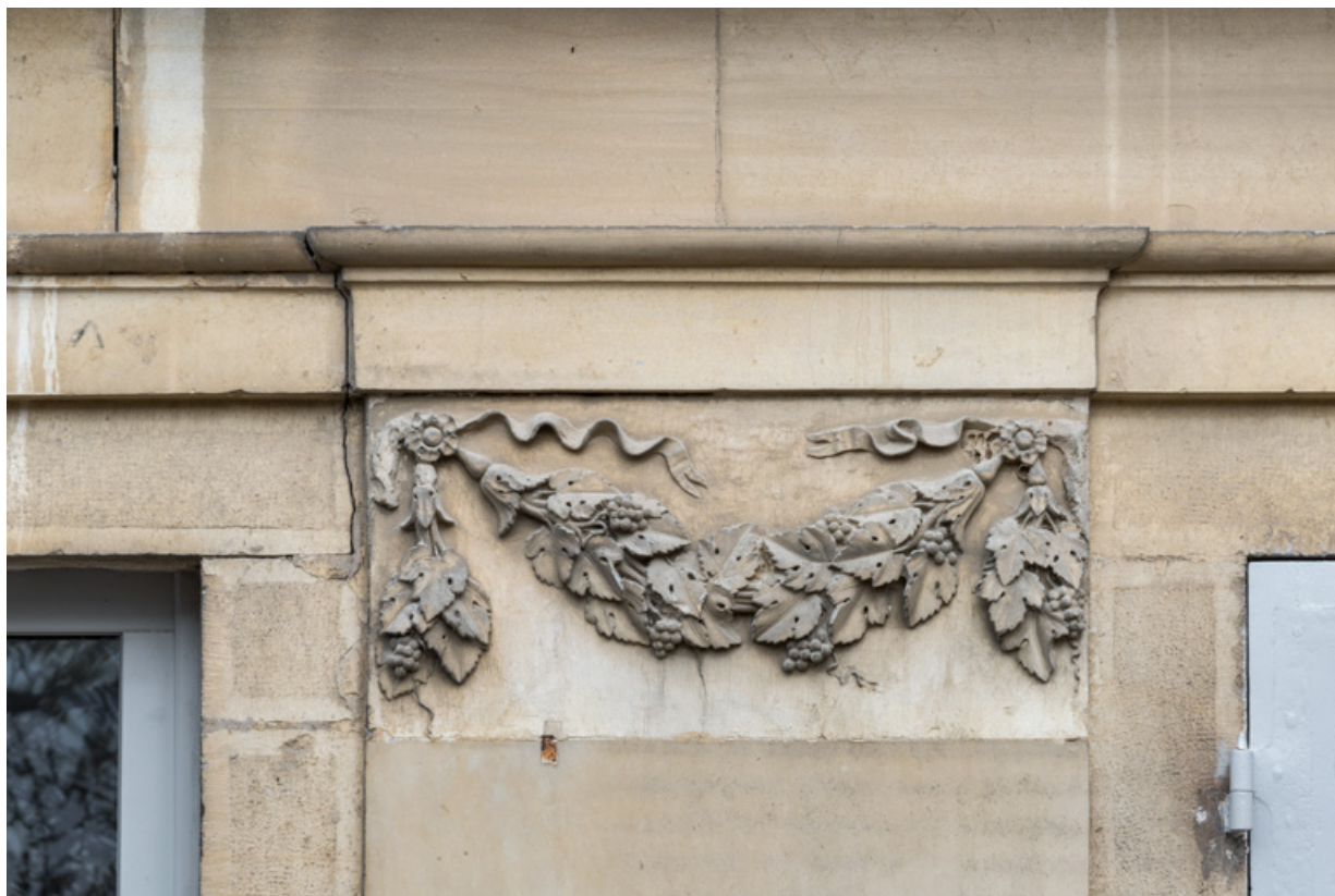
Façade latérale gauche, 3e pilastre (en partant de la gauche) : guirlande sculptée.

21, Semur-en-Auxois, 11 place de l' Ancienne Comédie