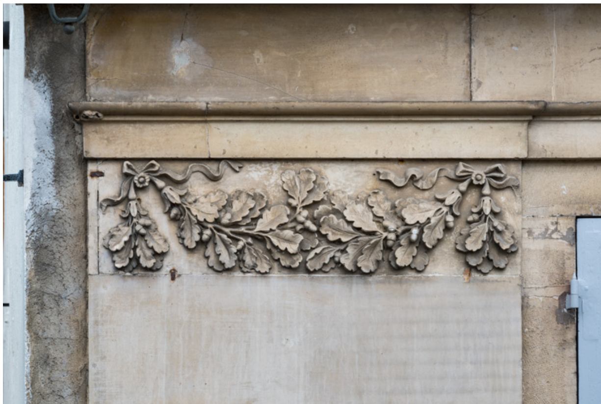
Façade latérale gauche, 1er pilastre (à gauche) : guirlande sculptée. 21, Semur-en-Auxois, 11 place de l' Ancienne Comédie