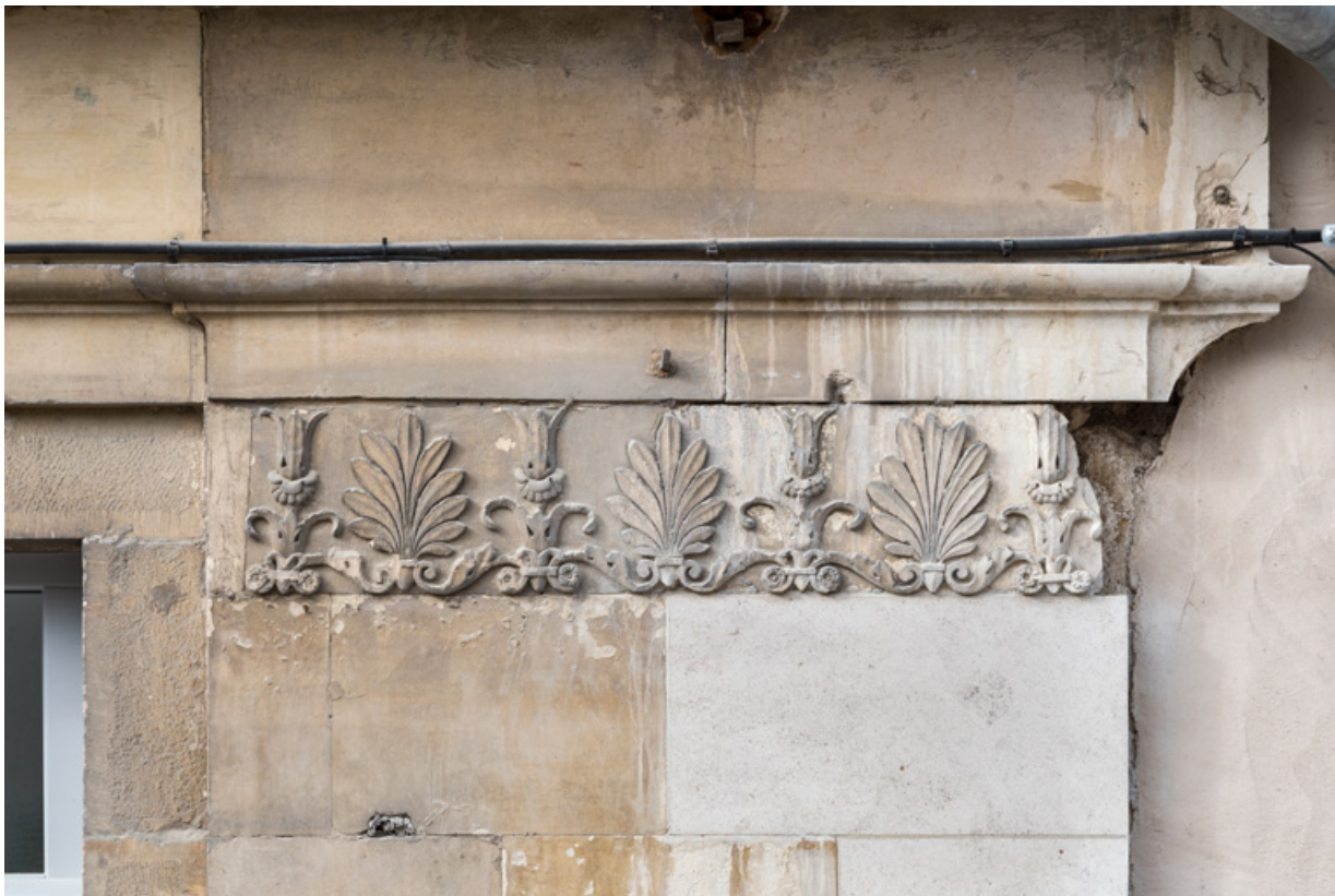
Façade antérieure, 7e et dernier pilastre (à droite) : guirlande sculptée.

21, Semur-en-Auxois, 11 place de l' Ancienne Comédie