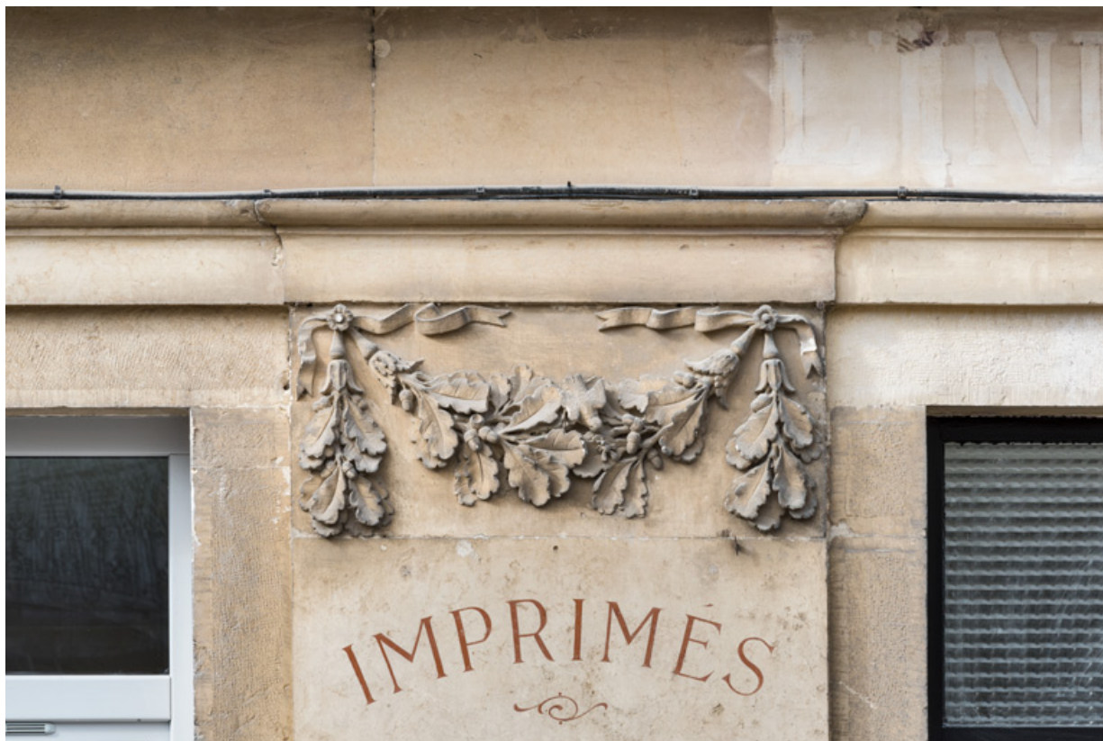
Façade antérieure, 3e pilastre (en partant de la gauche) : guirlande sculptée. 21, Semur-en-Auxois, 11 place de l' Ancienne Comédie