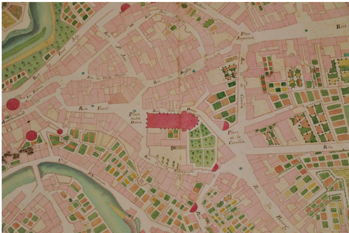
Plan de Semur-en-Auxois en 1812, montrant la place de la Comédie.

21, Semur-en-Auxois, 11 place de l' Ancienne Comédie