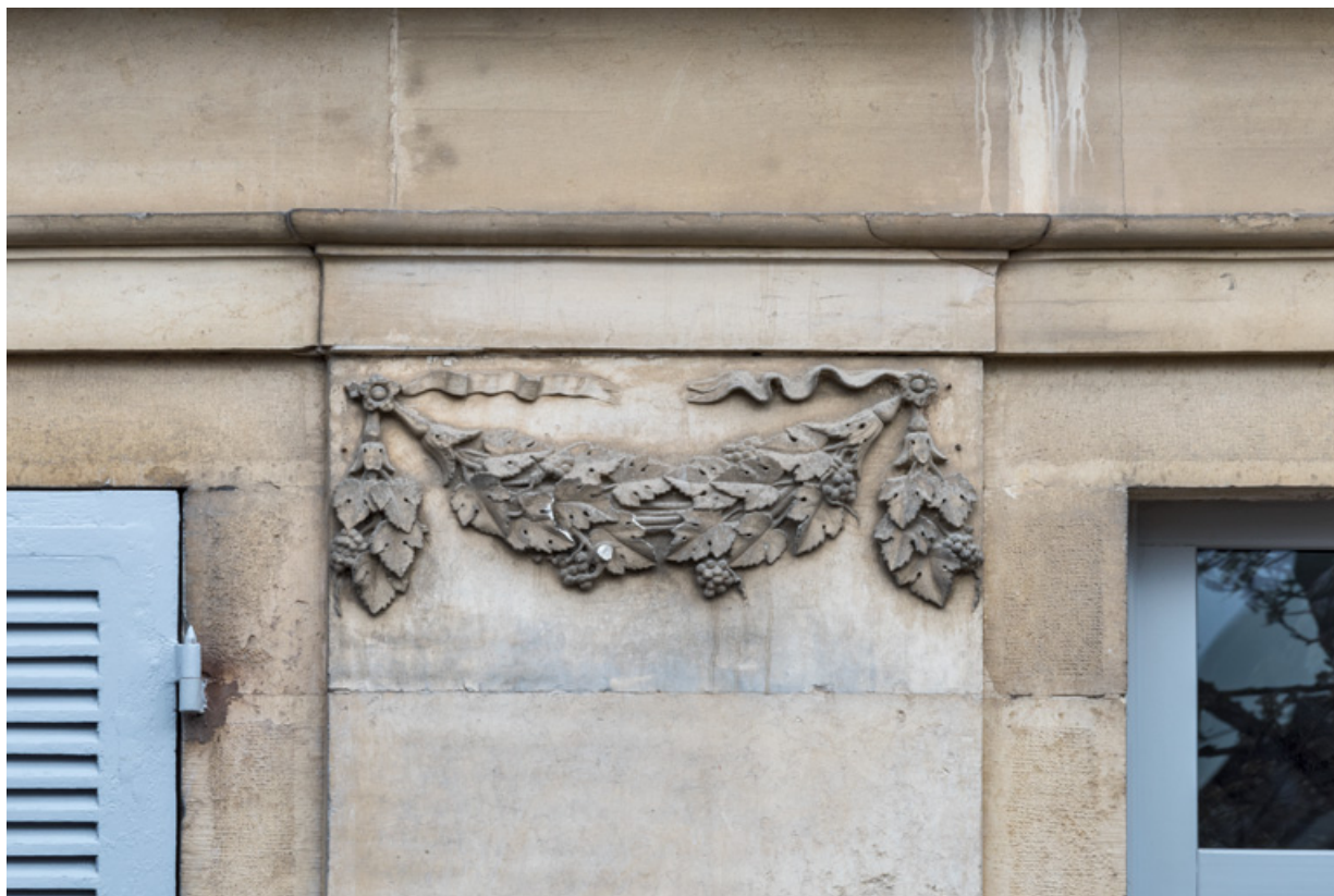
Façade latérale gauche, 2e pilastre (en partant de la gauche) : guirlande sculptée.

21, Semur-en-Auxois, 11 place de l' Ancienne Comédie