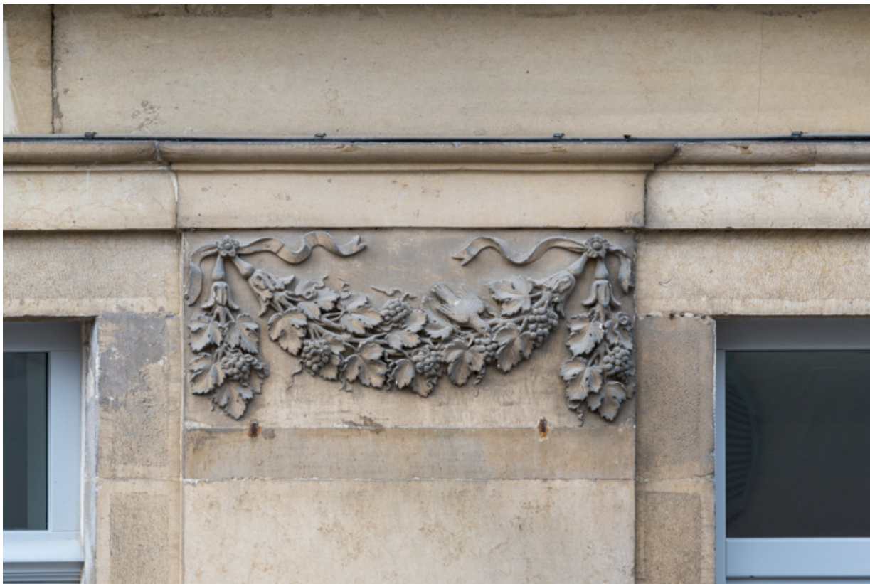
Façade antérieure, 2e pilastre (en partant de la gauche) : guirlande sculptée et oiseau picorant.

21, Semur-en-Auxois, 11 place de l' Ancienne Comédie