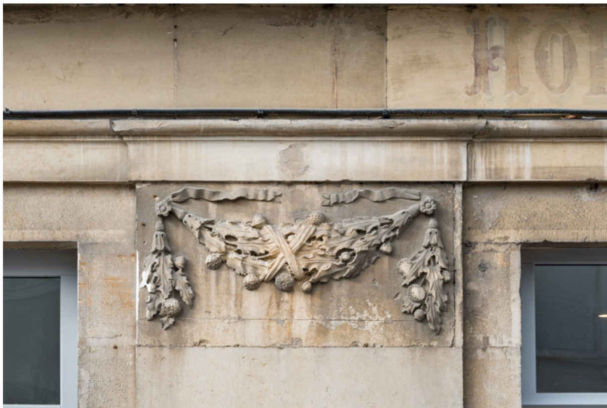
Façade antérieure, 6e pilastre (en partant de la gauche) : guirlande sculptée.

21, Semur-en-Auxois, 11 place de l' Ancienne Comédie