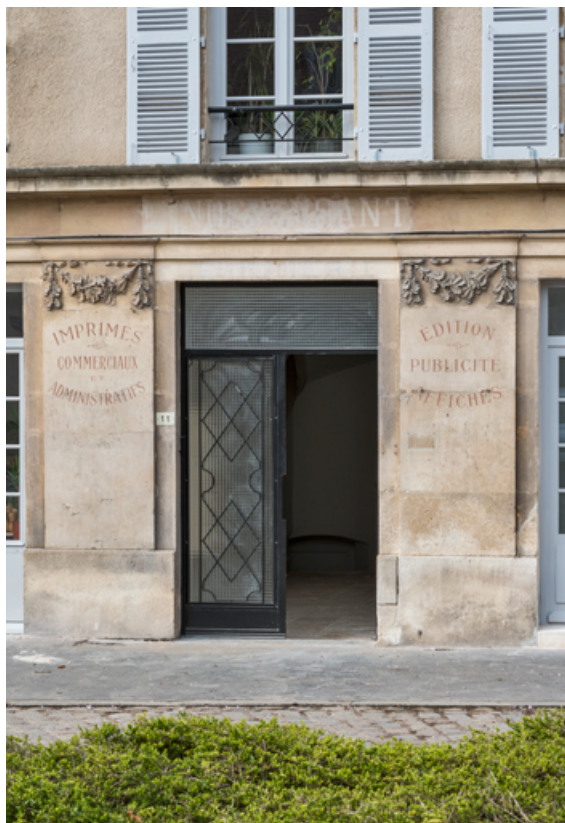
Façade antérieure : entrée.

21, Semur-en-Auxois, 11 place de l' Ancienne Comédie