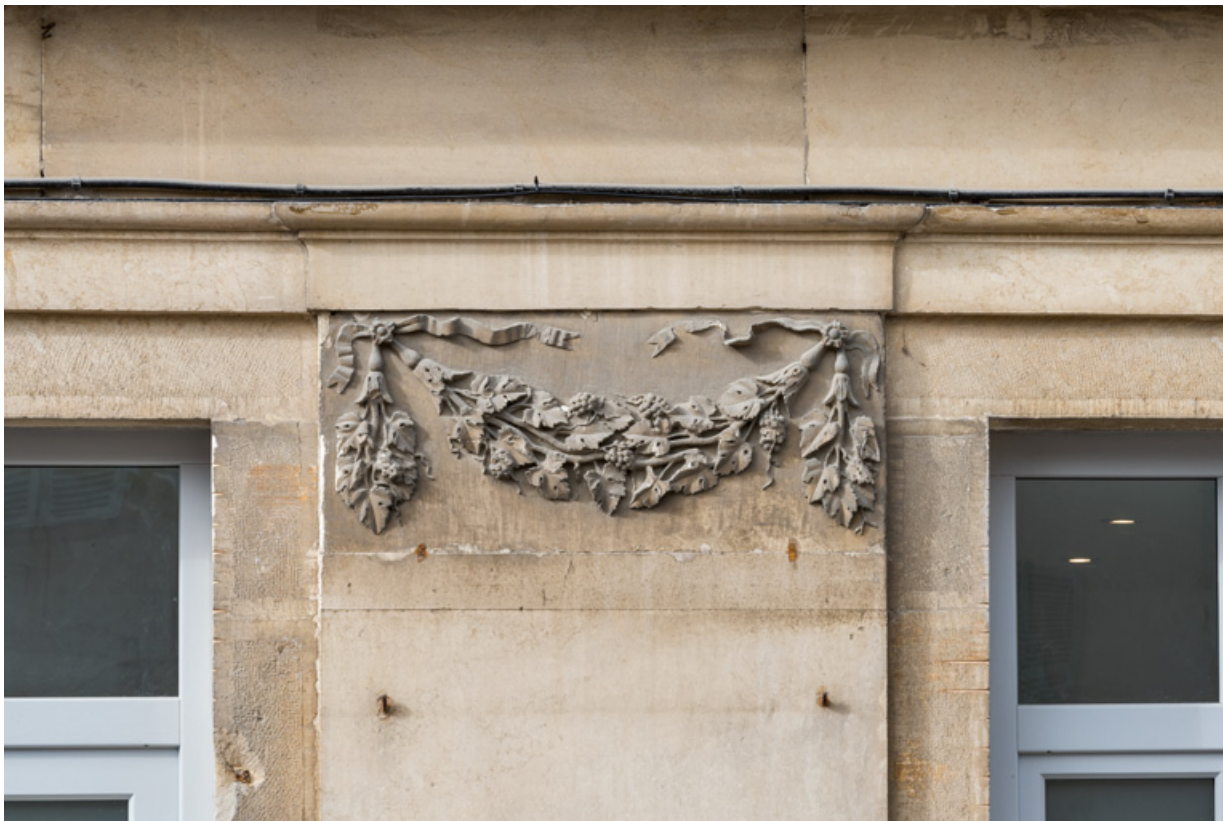
Façade antérieure, 5e pilastre (en partant de la gauche) : guirlande sculptée.

21, Semur-en-Auxois, 11 place de l' Ancienne Comédie