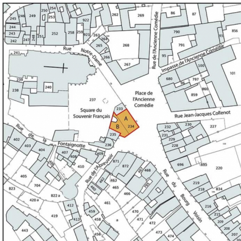
Plan-masse et de situation. 21, Semur-en-Auxois, 11 place de l' Ancienne Comédie