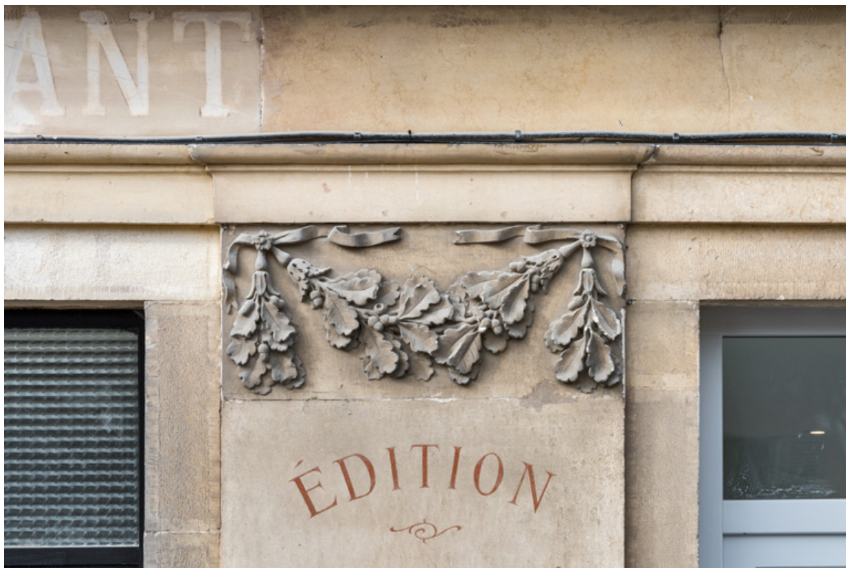
Façade antérieure, 4e pilastre (en partant de la gauche) : guirlande sculptée. 21, Semur-en-Auxois, 11 place de l' Ancienne Comédie