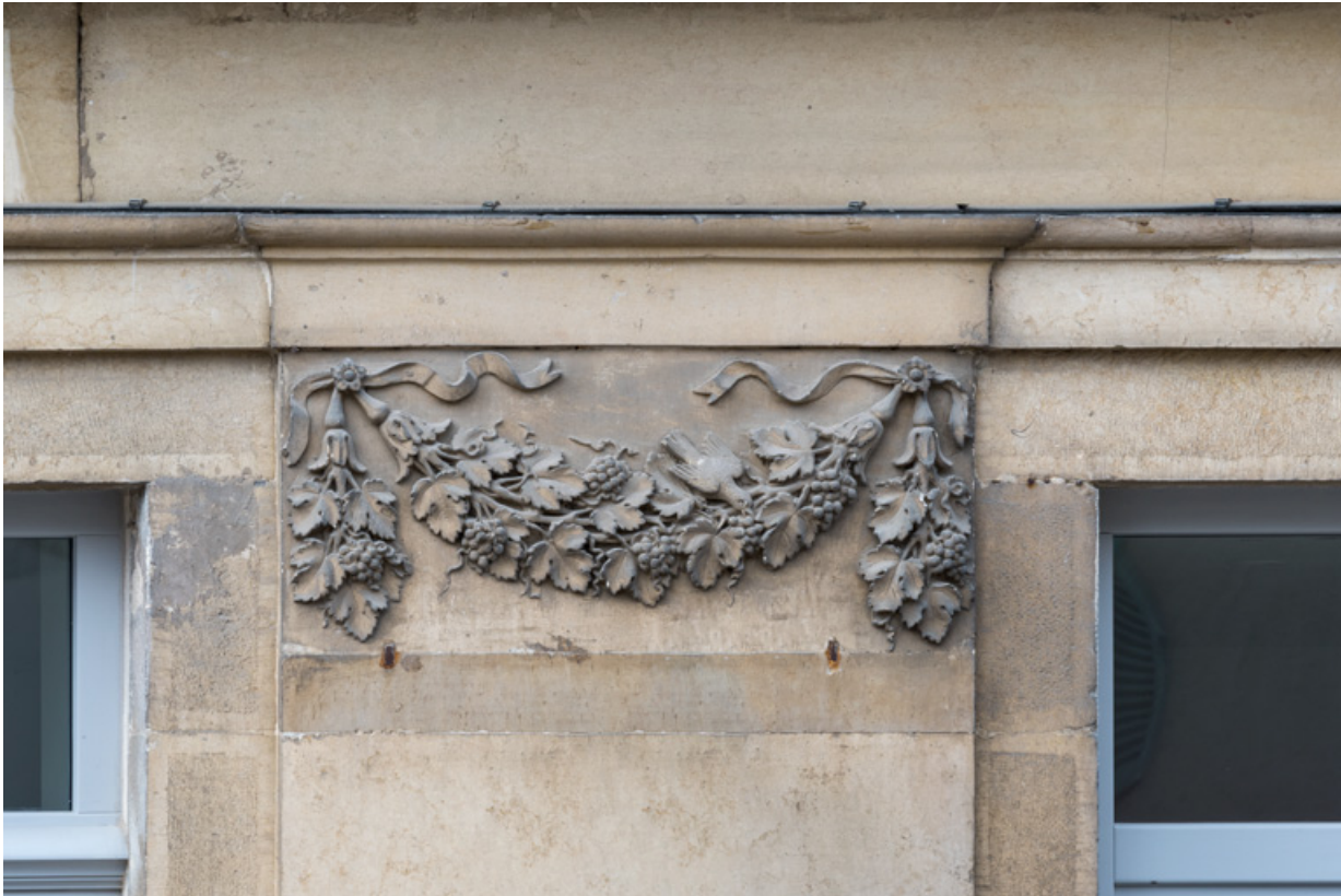
Façade antérieure, 2e pilastre (en partant de la gauche) : guirlande sculptée et oiseau picorant. 21, Semur-en-Auxois, 11 place de l' Ancienne Comédie