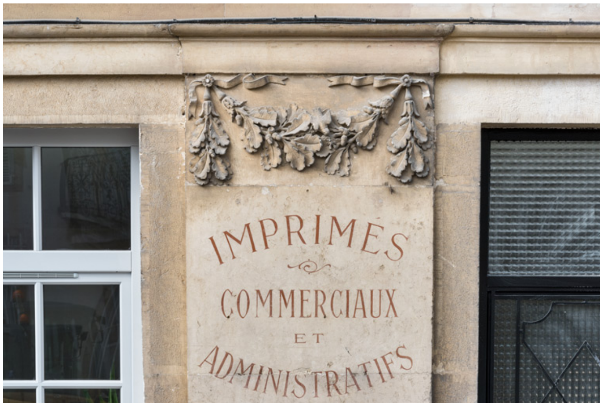
Façade antérieure, 3e pilastre (en partant de la gauche) : guirlande sculptée et inscriptions.

21, Semur-en-Auxois, 11 place de l' Ancienne Comédie