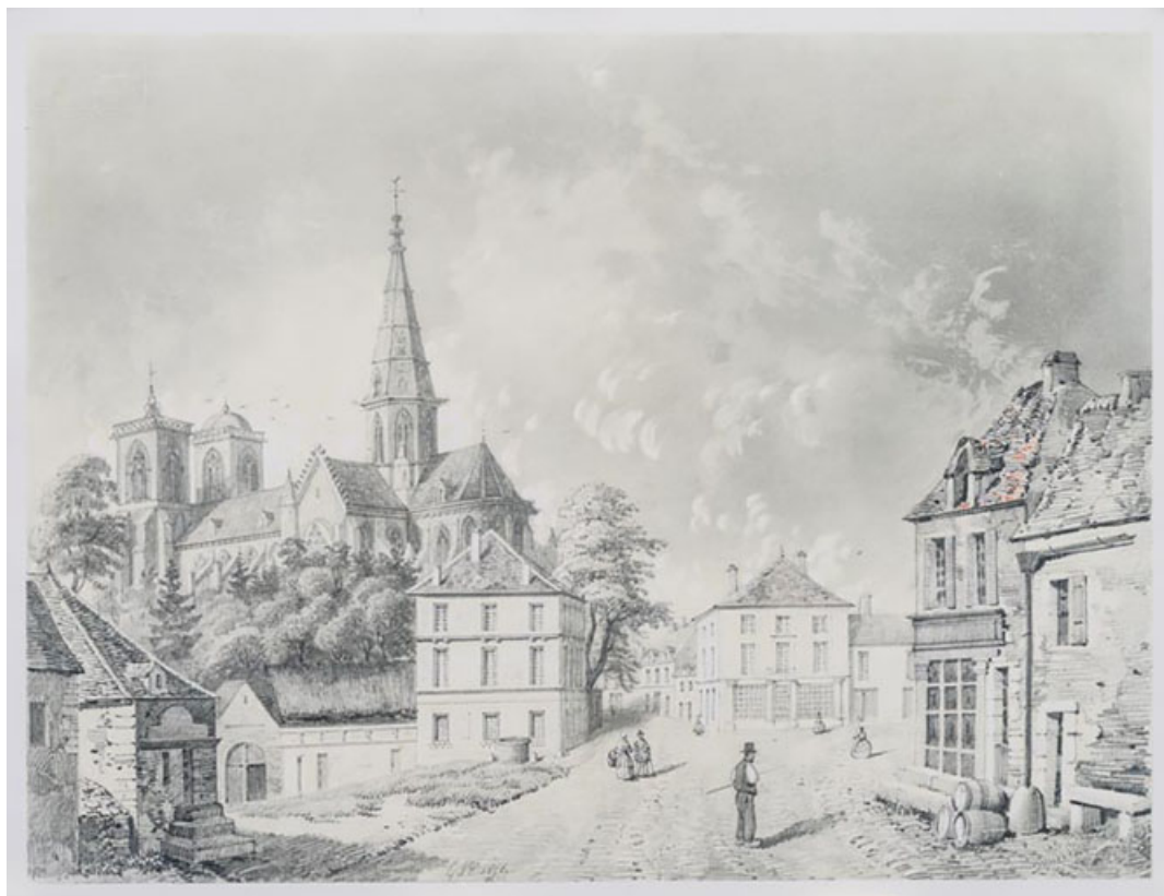
[Vue de l'ancienne Comédie et de l'église paroissiale]. 1858.

21, Semur-en-Auxois, 11 place de l' Ancienne Comédie