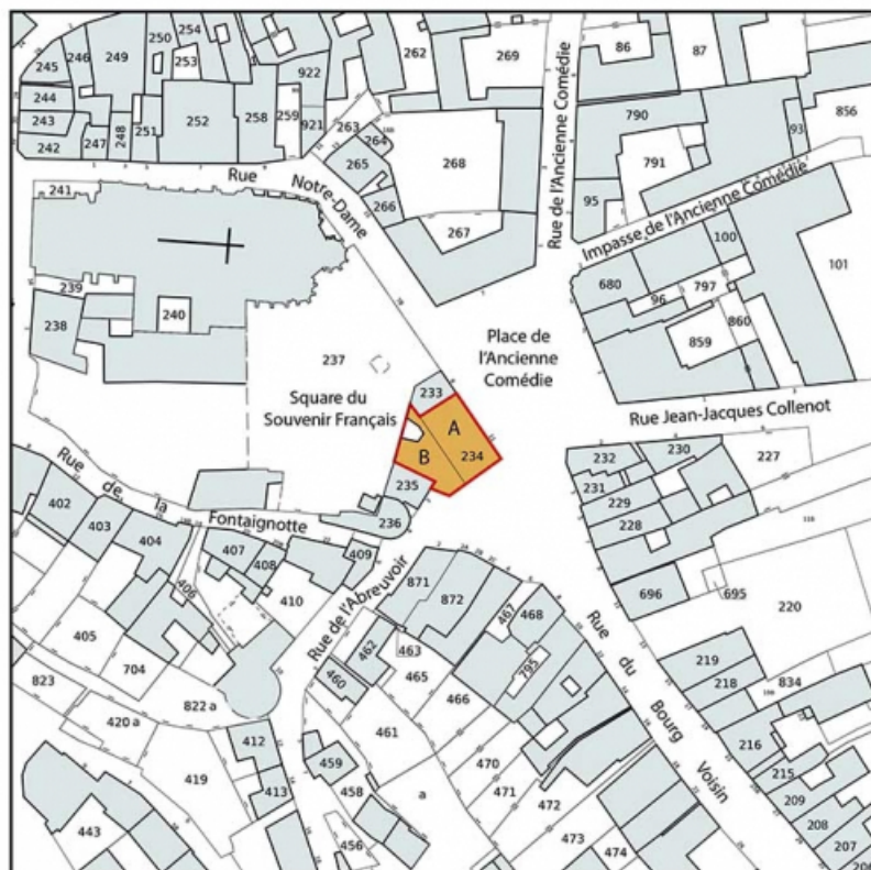
Plan-masse et de situation. 21, Semur-en-Auxois, 11 place de l' Ancienne Comédie