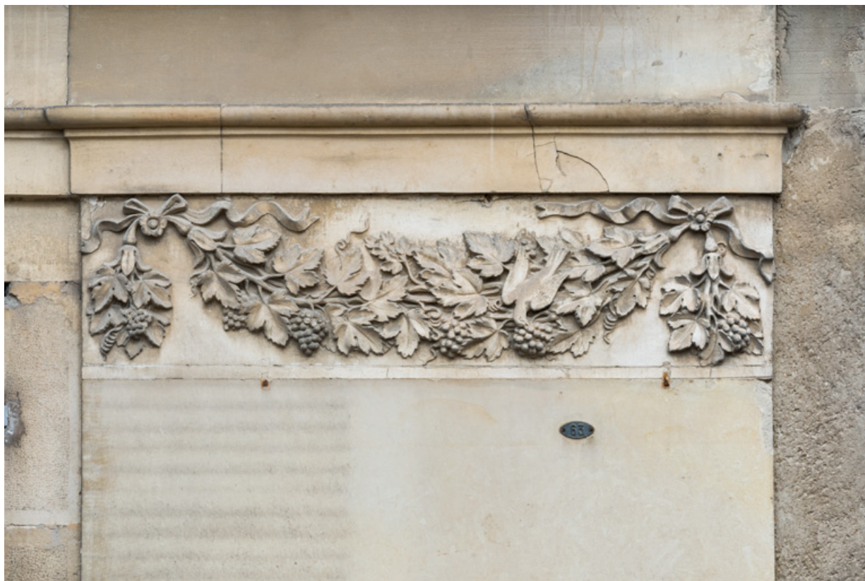
Façade latérale gauche, 4e et dernier pilastre (à droite) : guirlande sculptée et oiseau picorant. 21, Semur-en-Auxois, 11 place de l' Ancienne Comédie