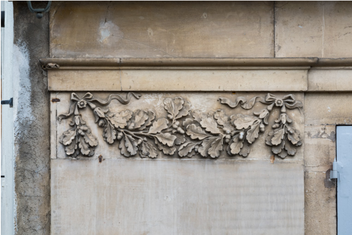
Façade latérale gauche, 1er pilastre (à gauche) : guirlande sculptée. 21, Semur-en-Auxois, 11 place de l' Ancienne Comédie