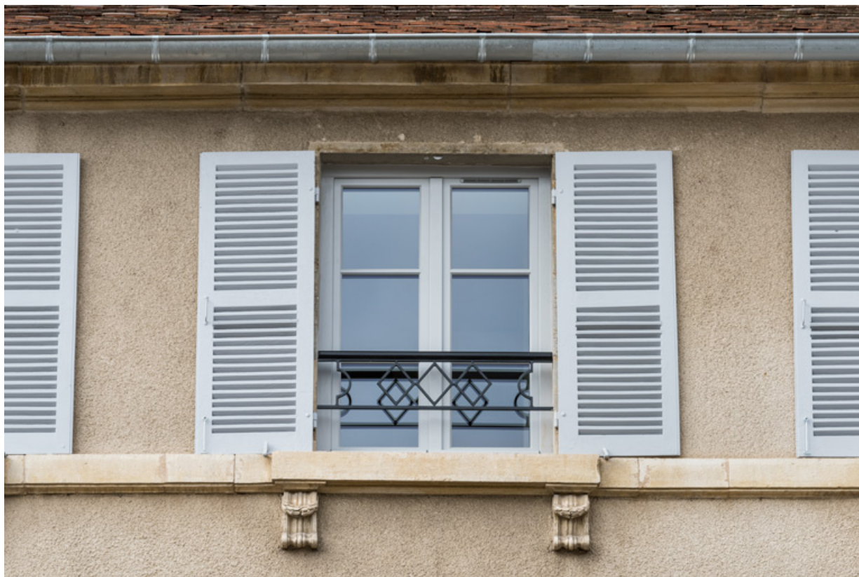
Façade antérieure : fenêtre du 2e étage.

21, Semur-en-Auxois, 11 place de l' Ancienne Comédie