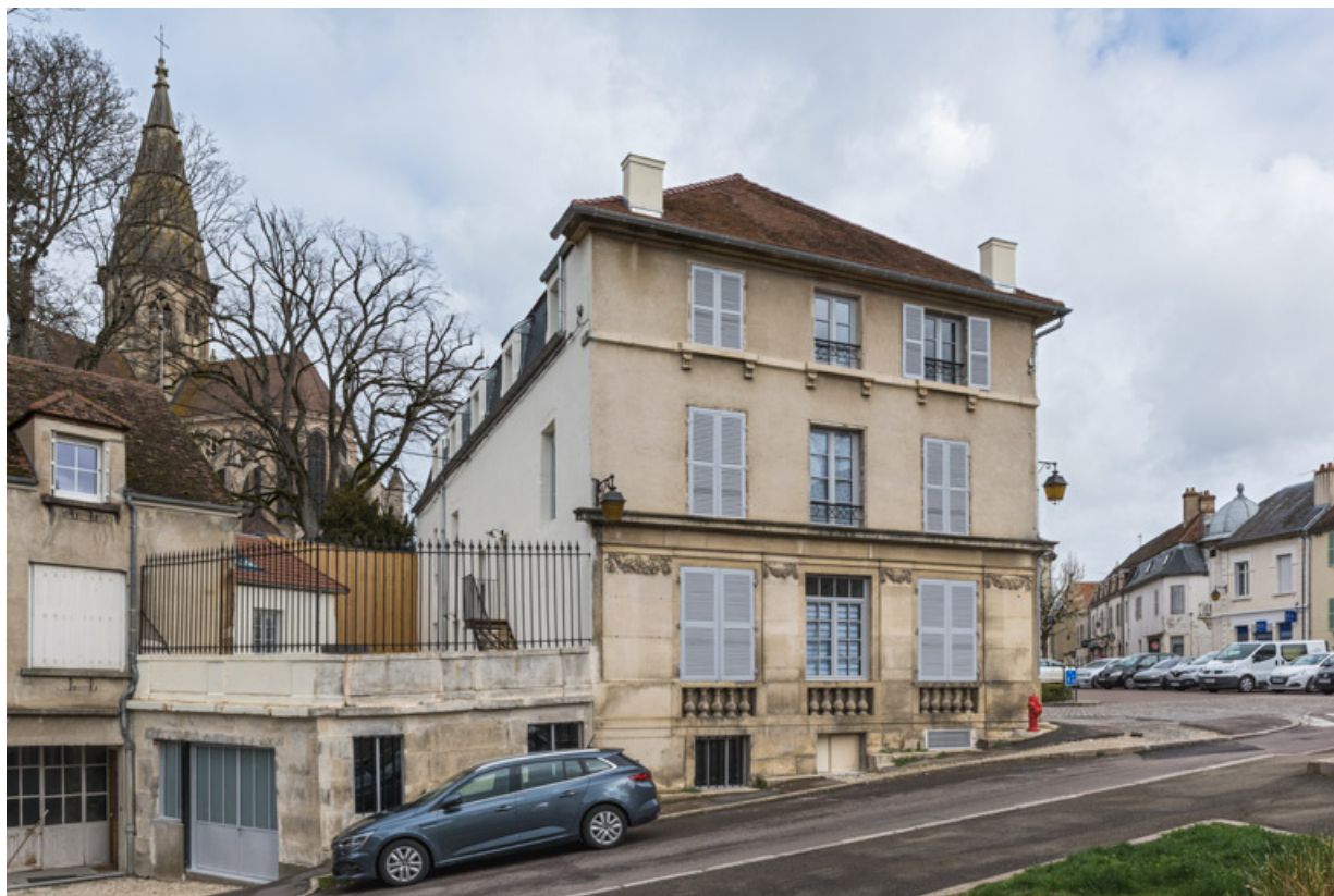
Façade latérale gauche.

21, Semur-en-Auxois, 11 place de l' Ancienne Comédie