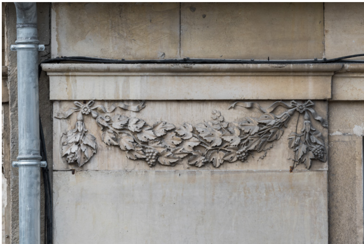
Façade antérieure, 1er pilastre (à gauche) : guirlande sculptée.

21, Semur-en-Auxois, 11 place de l' Ancienne Comédie