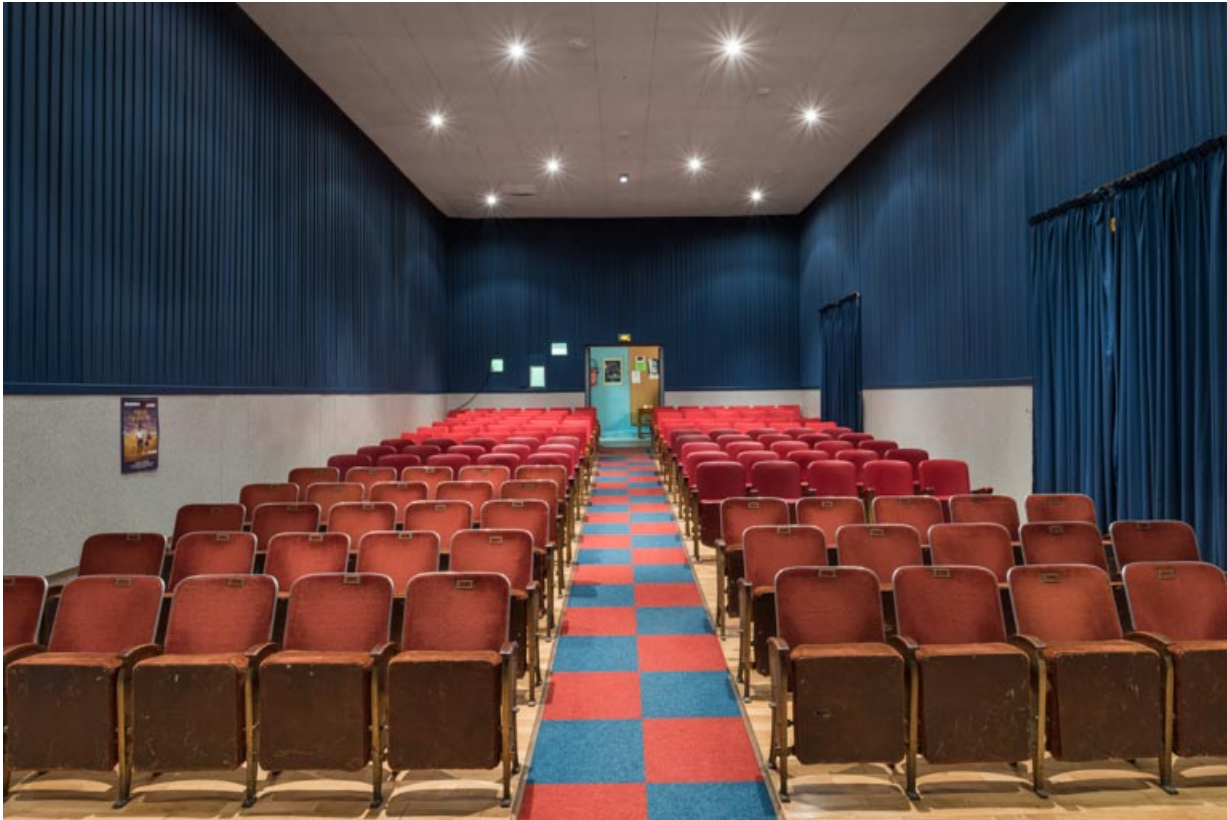
Salle : vue depuis l'écran.