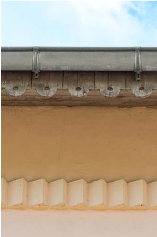
Façade antérieure : décor de briques et lambrequin. 21, Lacanhe rue de l' Église