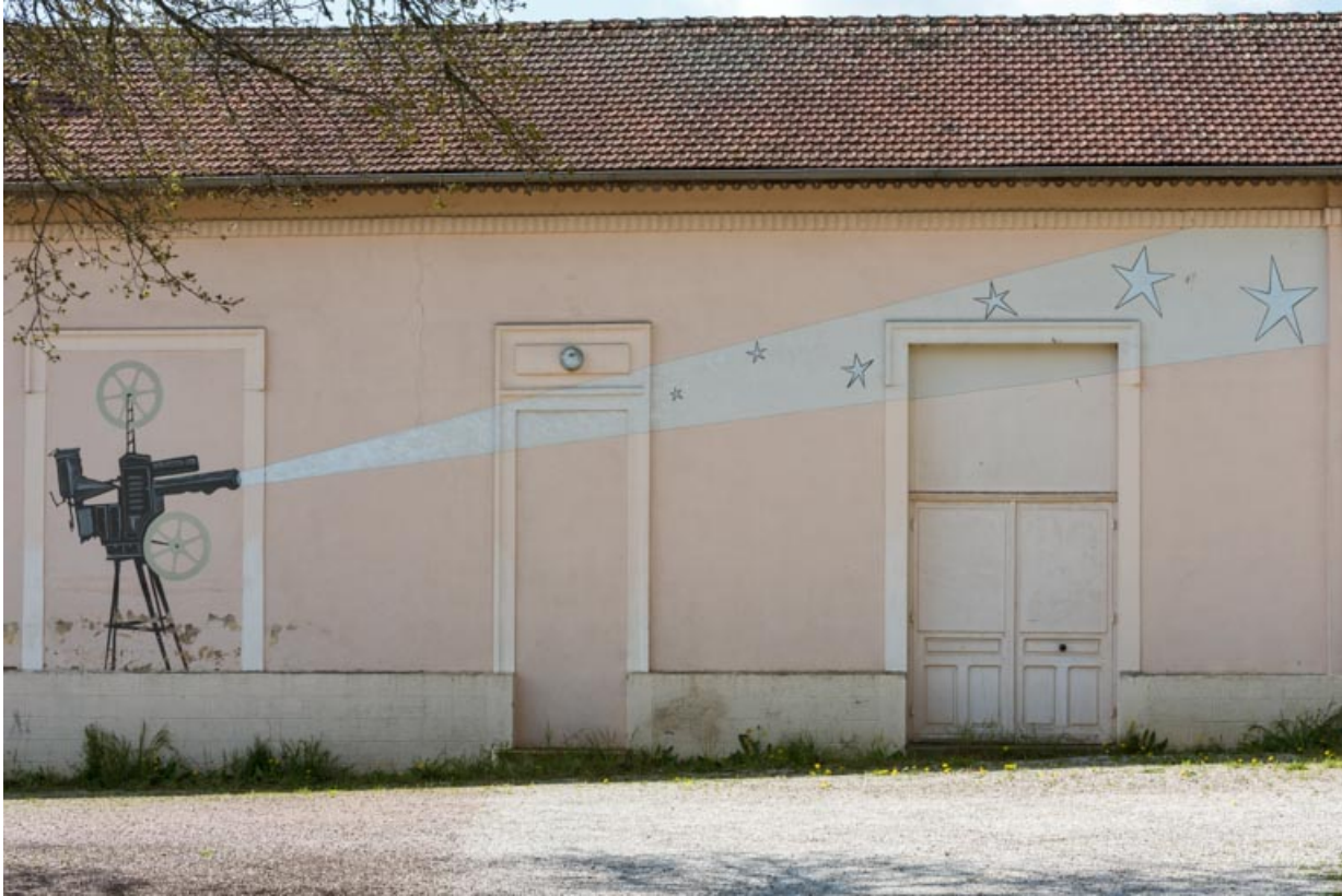
Façade antérieure : décor peint.