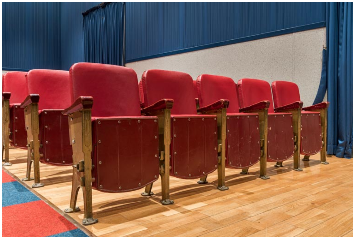
Salle : deuxième rangée de sièges. 21, Lacanhe rue de l' Église