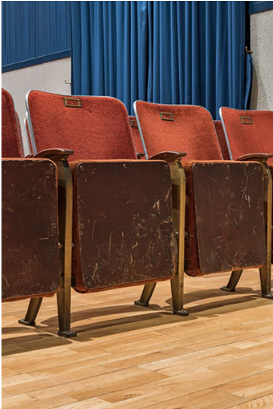
Salle, première rangée : siège assise fermée. 21, Lacanhe rue de l' Église