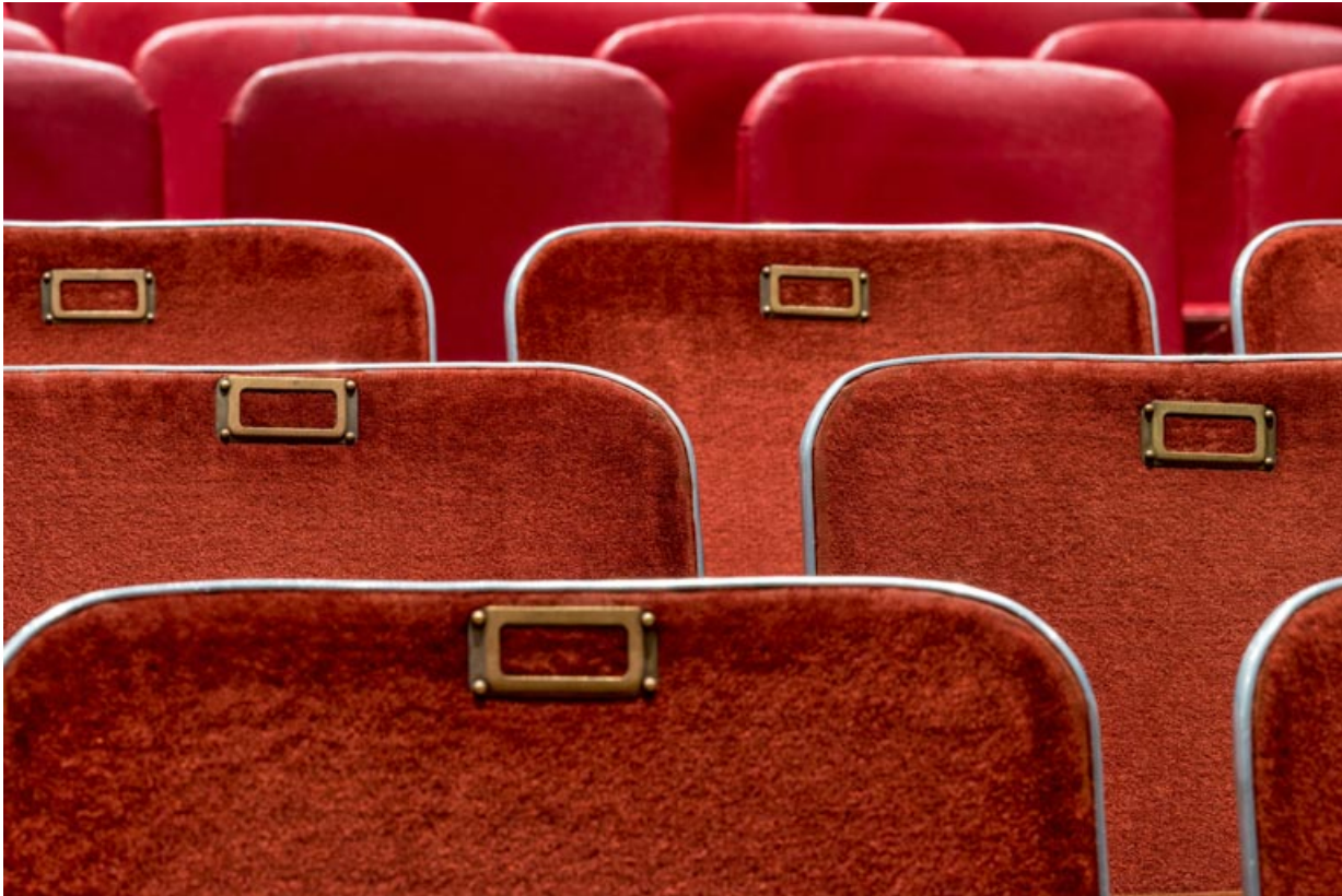
Salle, premières rangées de sièges : détail des dossiers.