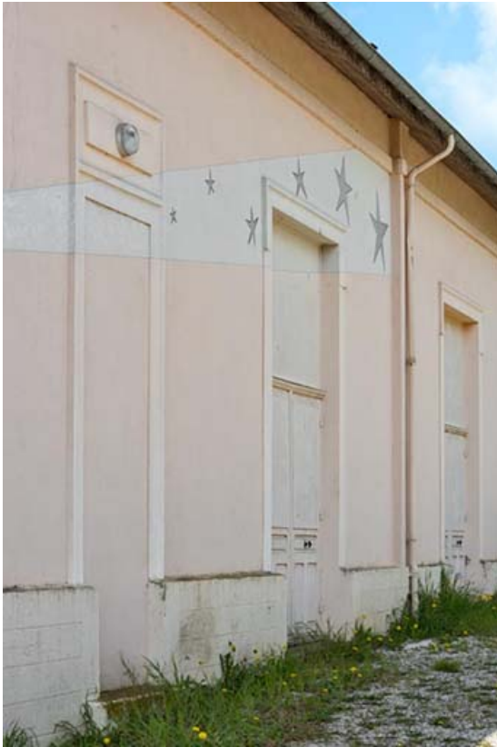
Façade antérieure : décor peint, vu en enfilade. 21, Lacanhe rue de l' Église