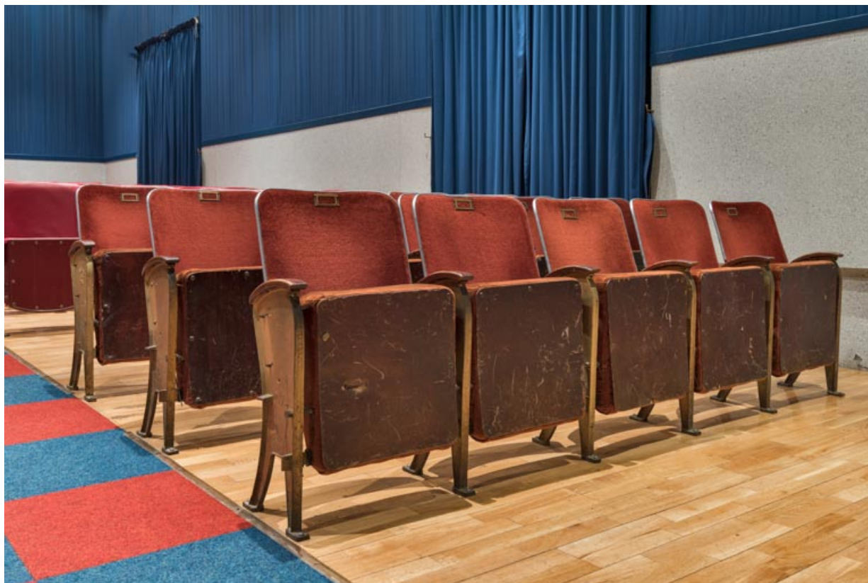
Salle : premières rangées de sièges.