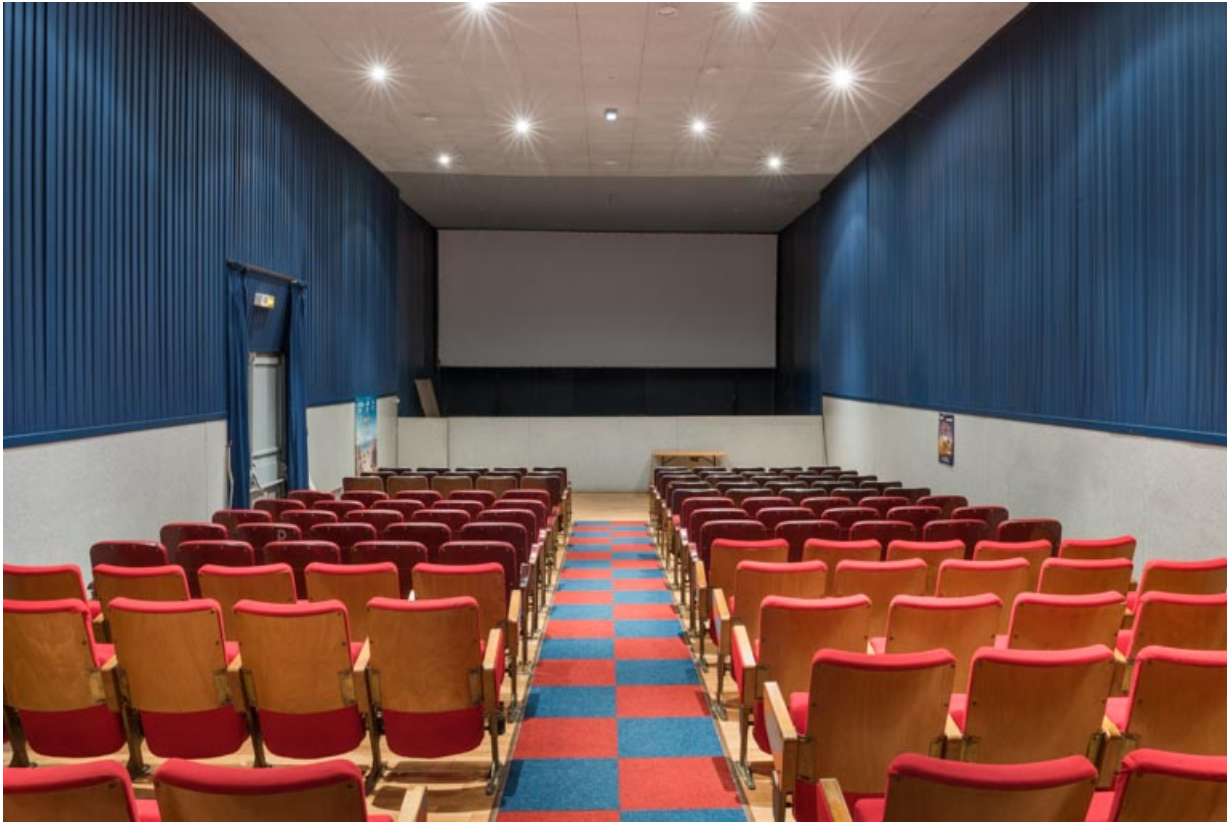
Salle : vue vers l'écran.