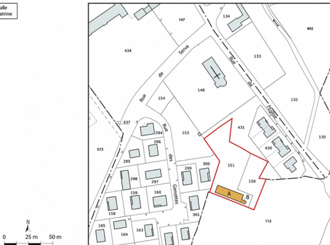
Plan-masse et de situation. Extrait du plan cadastral, 2021, section AC, 1/1 000 réduit à 1/1 250. 21, Lacanhe rue de l'Église