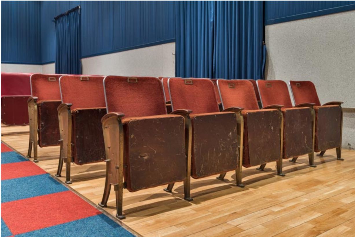
Salle : premières rangées de sièges.