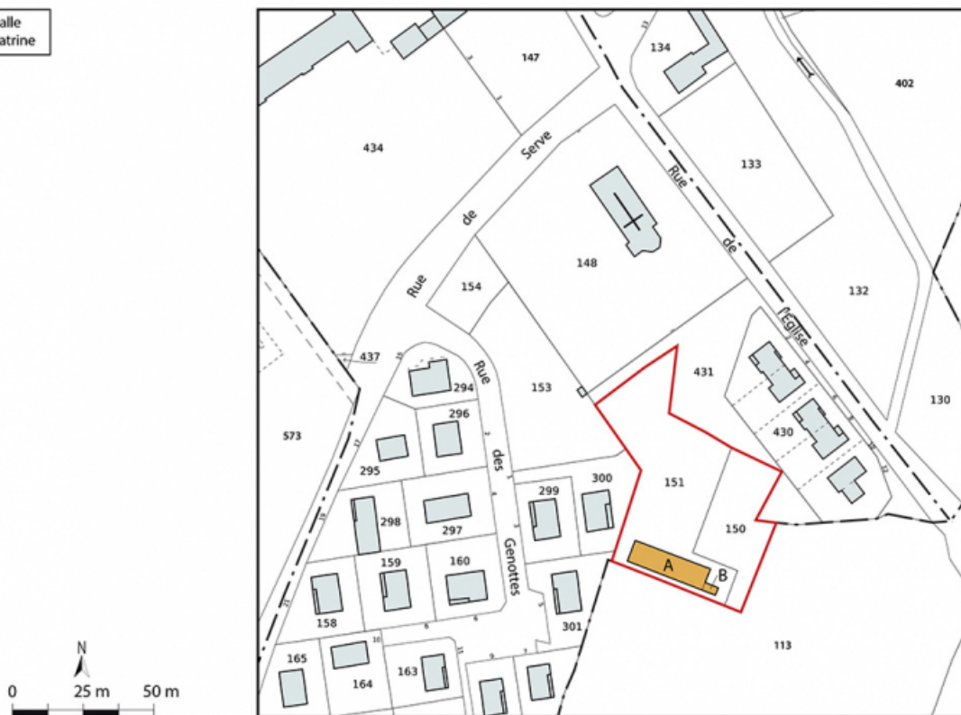
Plan-masse et de situation. Extrait du plan cadastral, 2021, section AC, 1/1 000 réduit à 1/1 250. 21, Lacanhe rue de l'Église