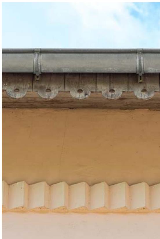
Façade antérieure : décor de briques et lambrequin. 21, Lacanche rue de l' Église