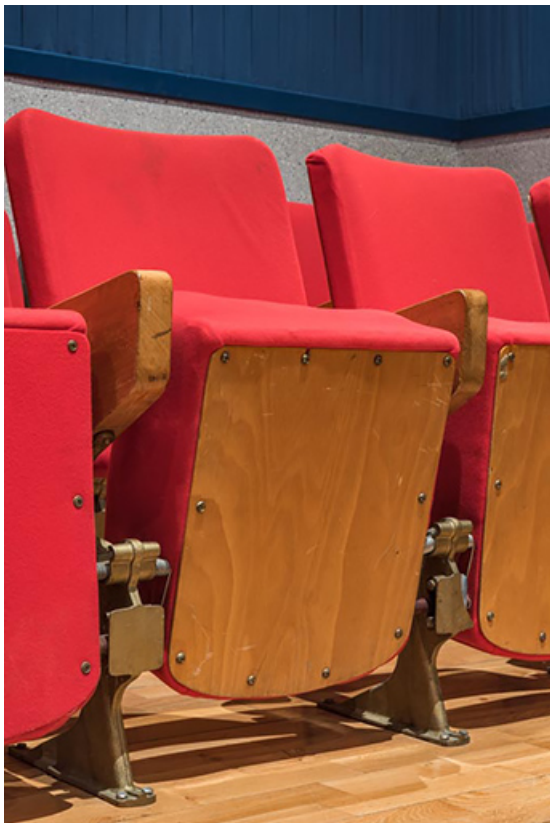
Salle, dernières rangées : siège assise fermée. 21, Lacanche rue de l' Église