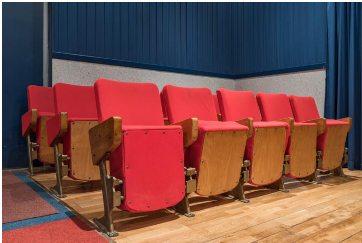
Salle : dernières rangées de sièges. 21, Lacanche rue de l' Église