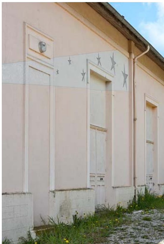
Façade antérieure : décor peint, vu en enfilade. 21, Lacanhe rue de l' Église