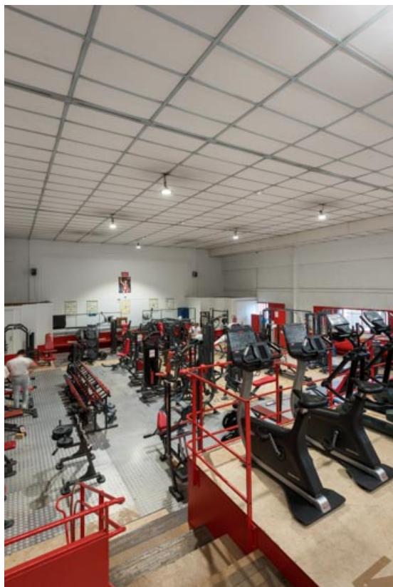
Salle de cinéma (actuellement salle de sport), depuis la galerie. 21, Auxonne rue du Colonel Redoutey