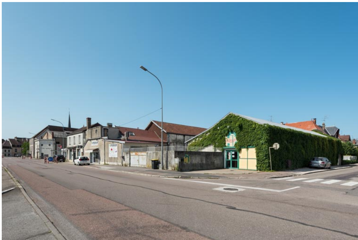
Vue d'ensemble éloignée depuis le sud-est. Au centre l'ancien cinéma Eden et à droite l'ancienne salle de bal le Trianon. 21, Auxonne rue du Colonel Redoutey