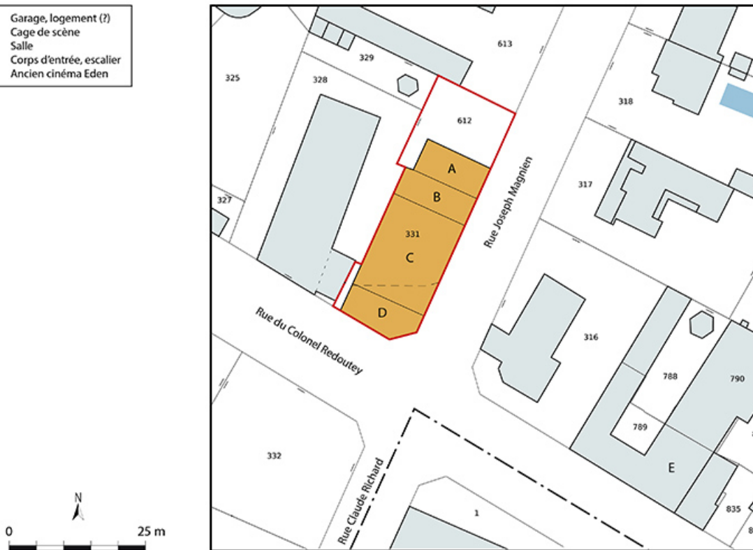
Plan-masse et de situation. Extrait du plan cadastral, 2021, section BL, 1/1 000 agrandi à 1/500. 21, Auxonne, 4 rue du Colonel Redoutey