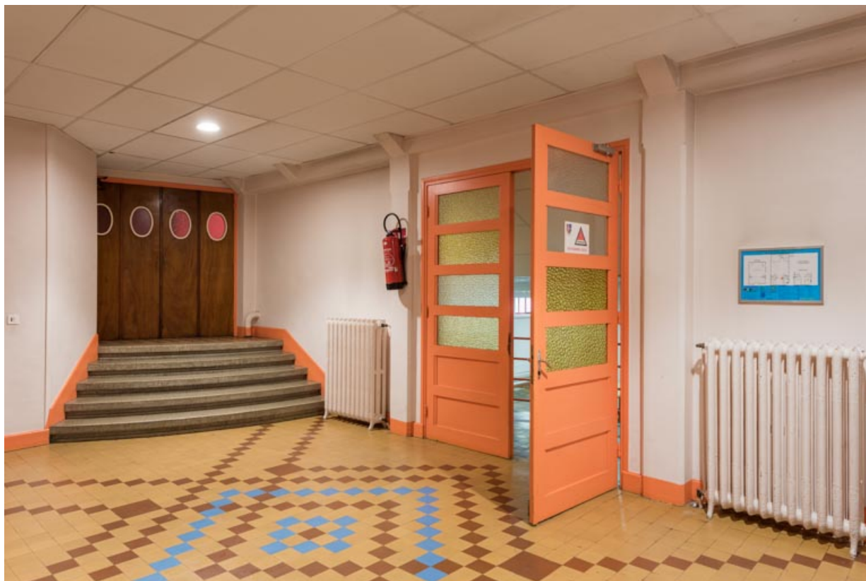
Vestibule, avec accès à la salle de cinéma à gauche et à la salle de réception au centre.