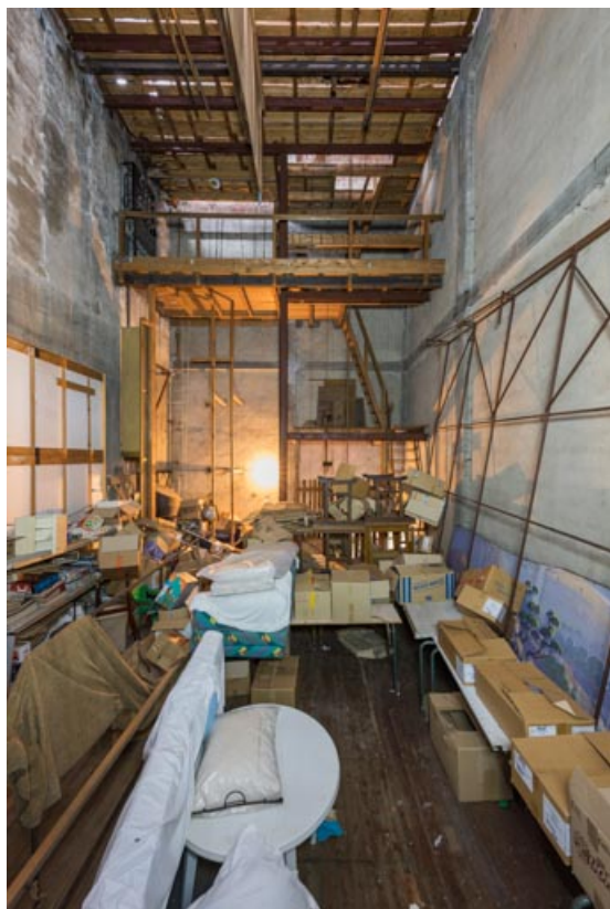
La scène. La salle de cinéma est à droite.