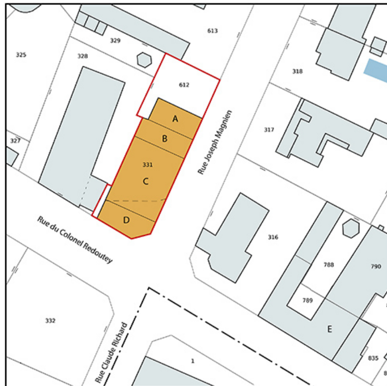
Plan-masse et de situation. Extrait du plan cadastral, 2021, section BL, 1/1 000 agrandi à 1/500. 21, Auxonne rue du Colonel Redoutey