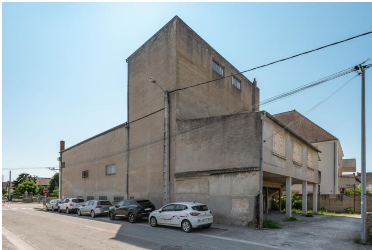
Façades postérieure et latérale droite. La cage de scène dépasse au centre. 21, Auxonne rue du Colonel Redoutey