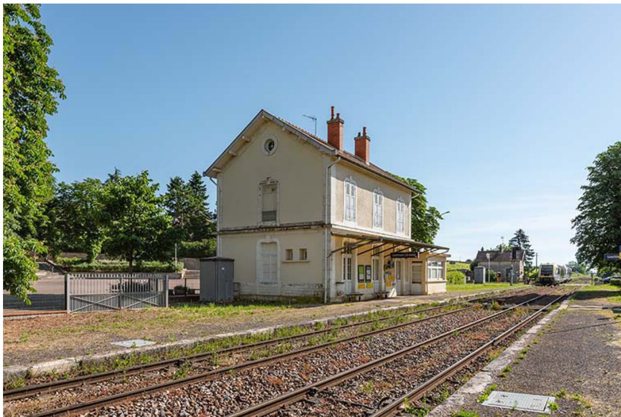
Vue de la voie ferrée en direction de Chagny.