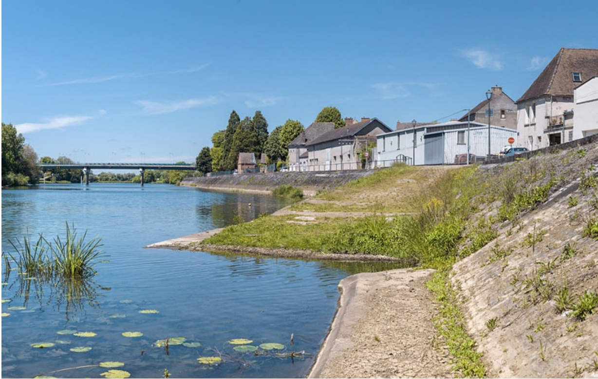
Les quais se poursuivent en aval du pont : rampe d'accès à la rivière.

21, Seurre quai du Midi, lieudit : PK 186,5