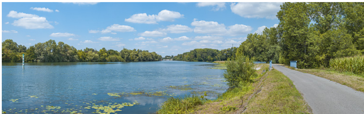
Vue d'ensemble des deux ponceaux, rive gauche.