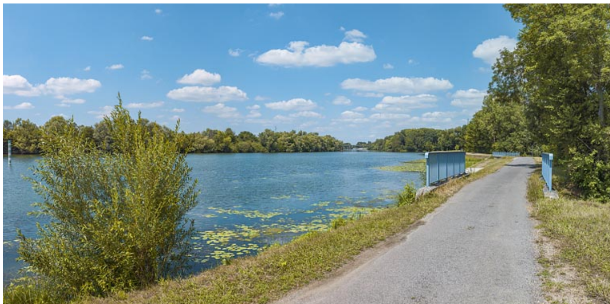
Vue d'ensemble des deux ponceaux, rive gauche.