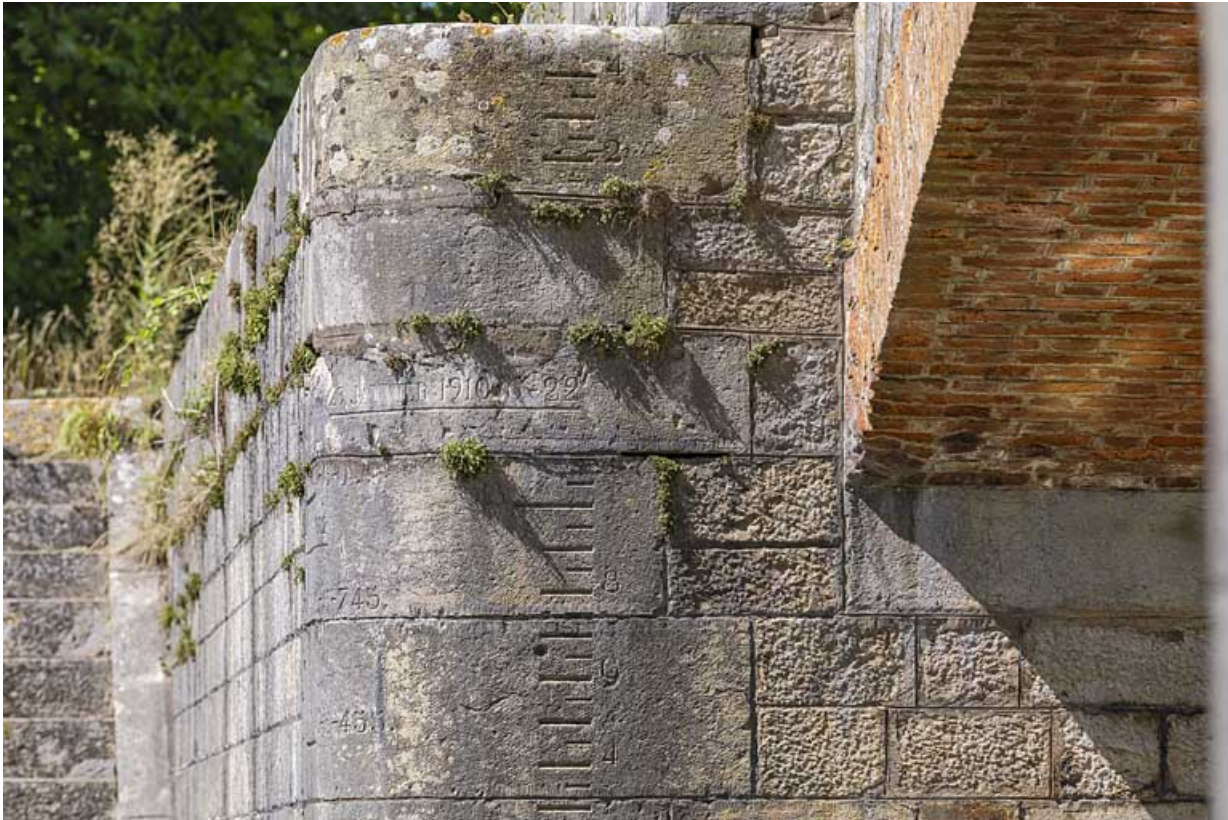
Détail de la voûte en brique et de l'échelle de crue sur la culée.