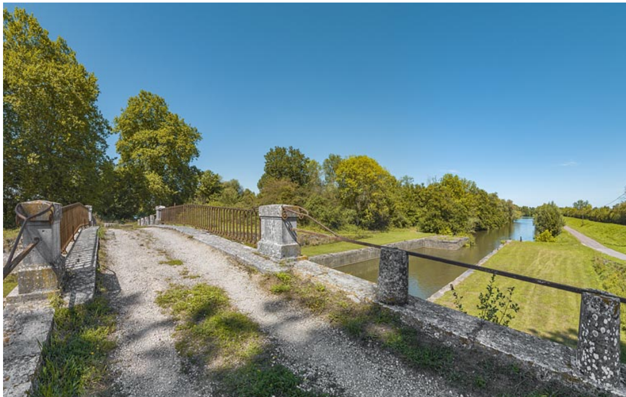
Vue d'ensemble du pont et de l'ancienne dérivation de Seurre.