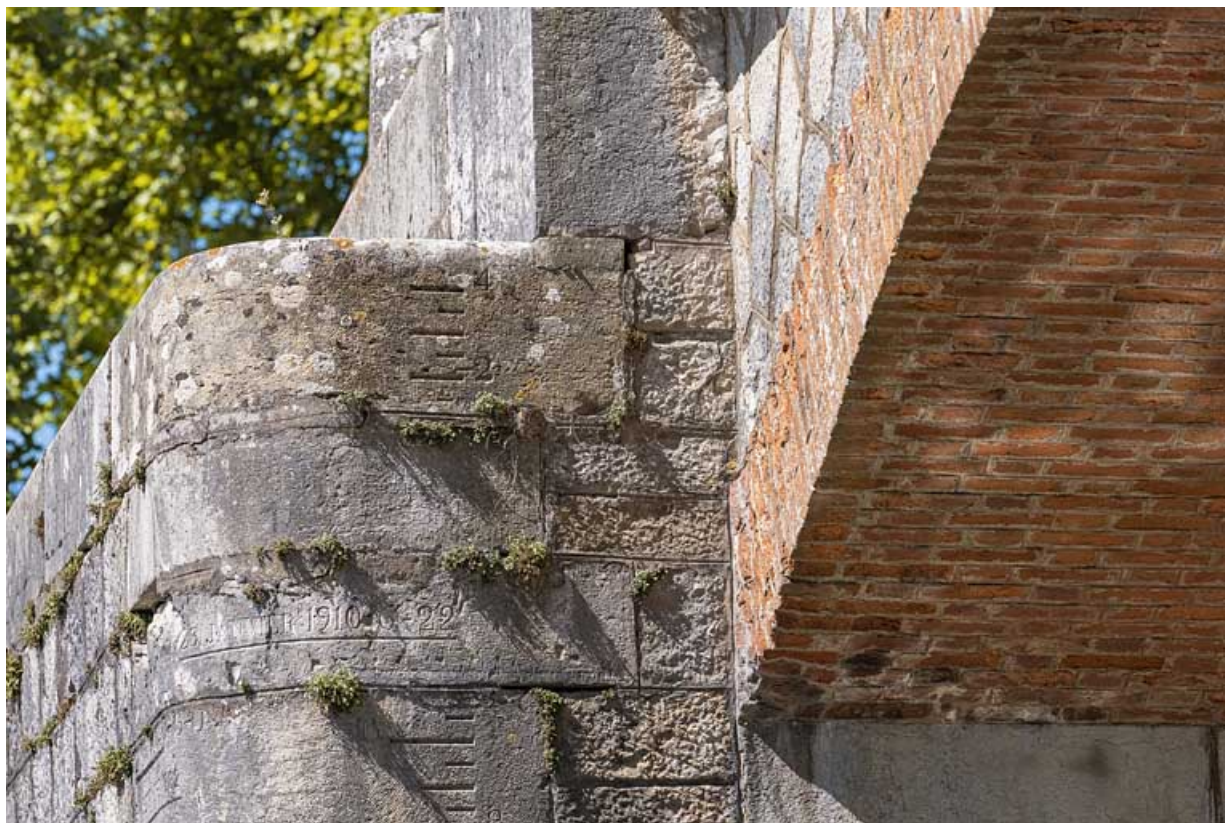
Détail de la voûte en brique et de l'échelle de crue sur la culée.