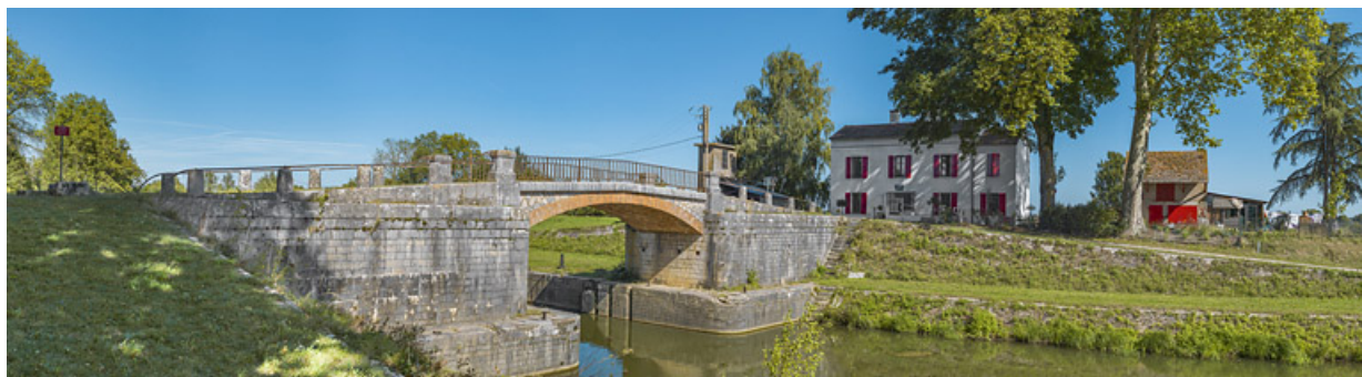
Vue d'ensemble du site avec le pont sur écluse vu d'aval.