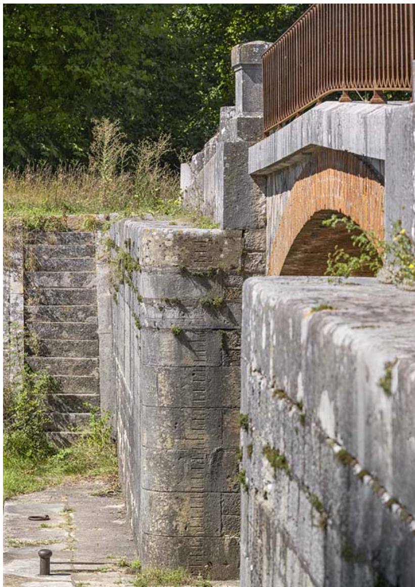
Détail de la voûte en brique, du garde-corps du pont et de l'échelle de crue sur la culée. 21, Trugny, lieudit : PK 184