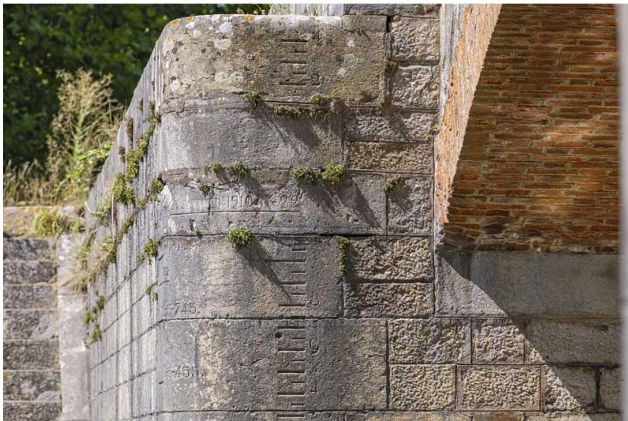
Détail de la voûte en brique et de l'échelle de crue sur la culée.