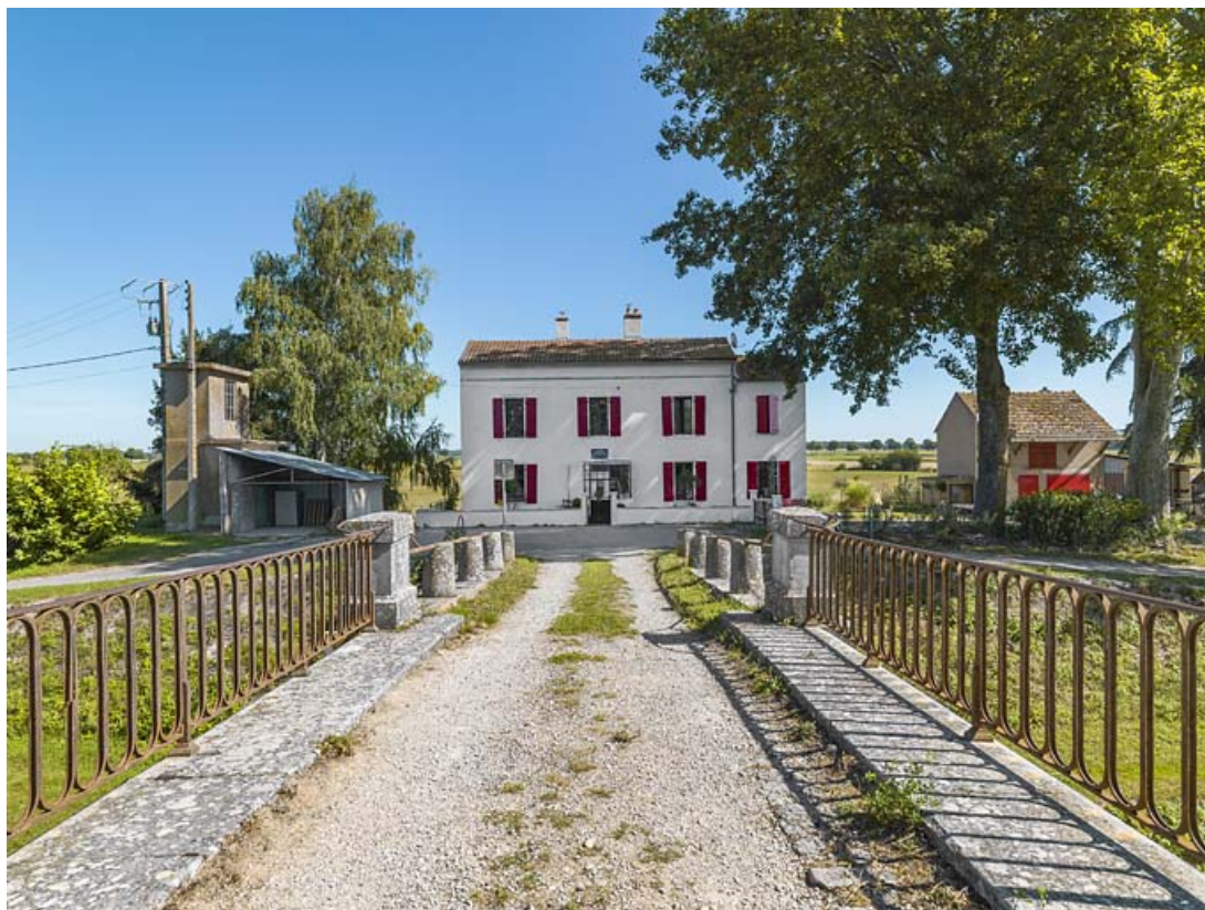
Le pont vu du dessus, au fond, la maison éclusière.