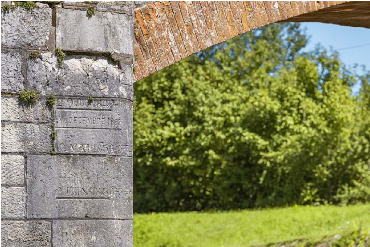
Détail de la voûte en brique et de l'échelle de crue sur la culée.