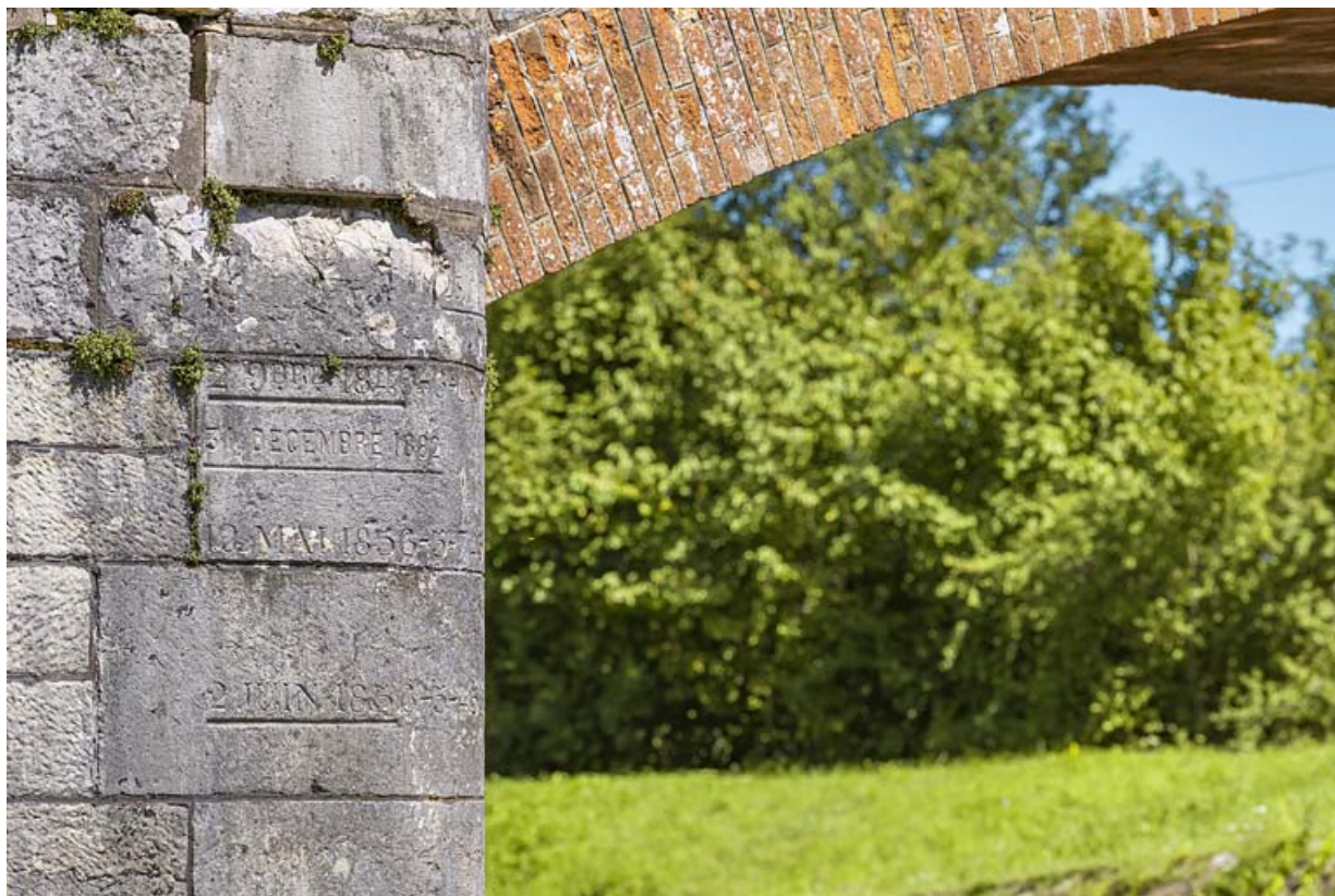
Détail de la voûte en brique et de l'échelle de crue sur la culée.