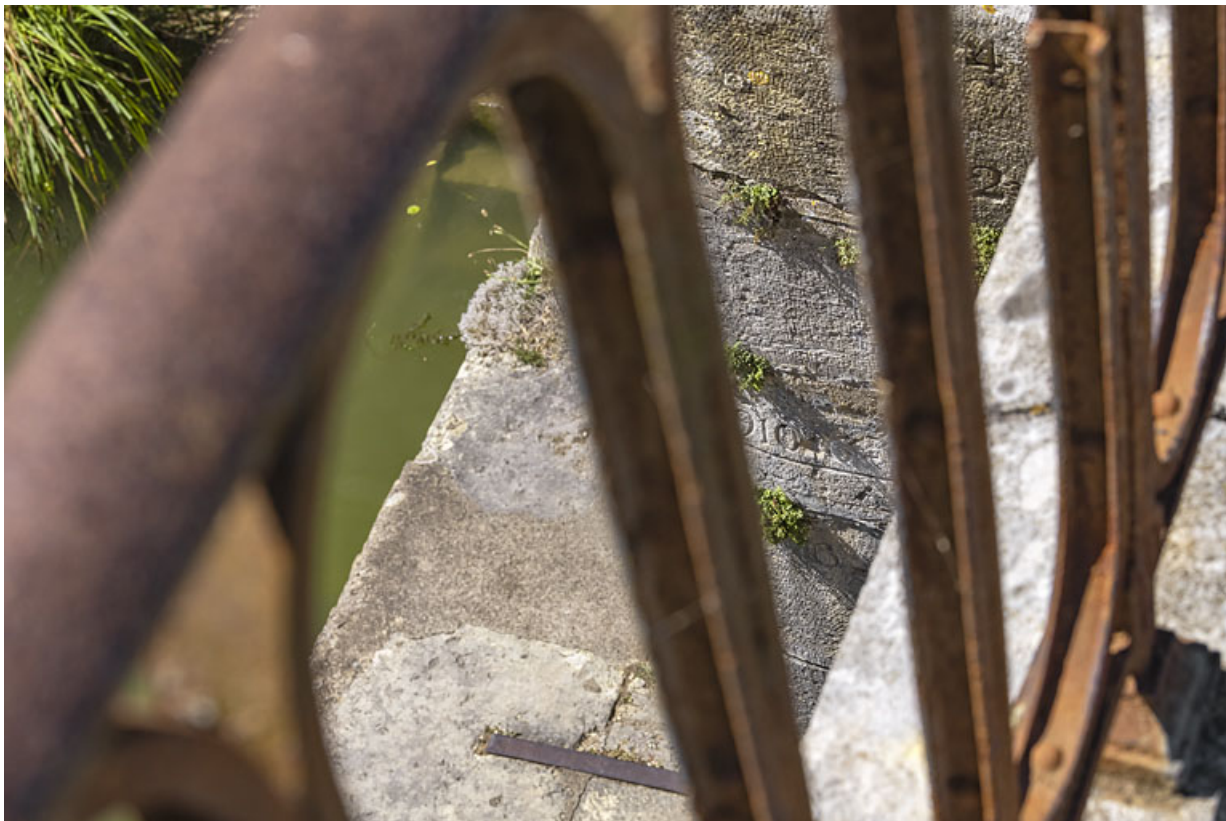
Détail de l'échelle de crue sur la culée du pont.