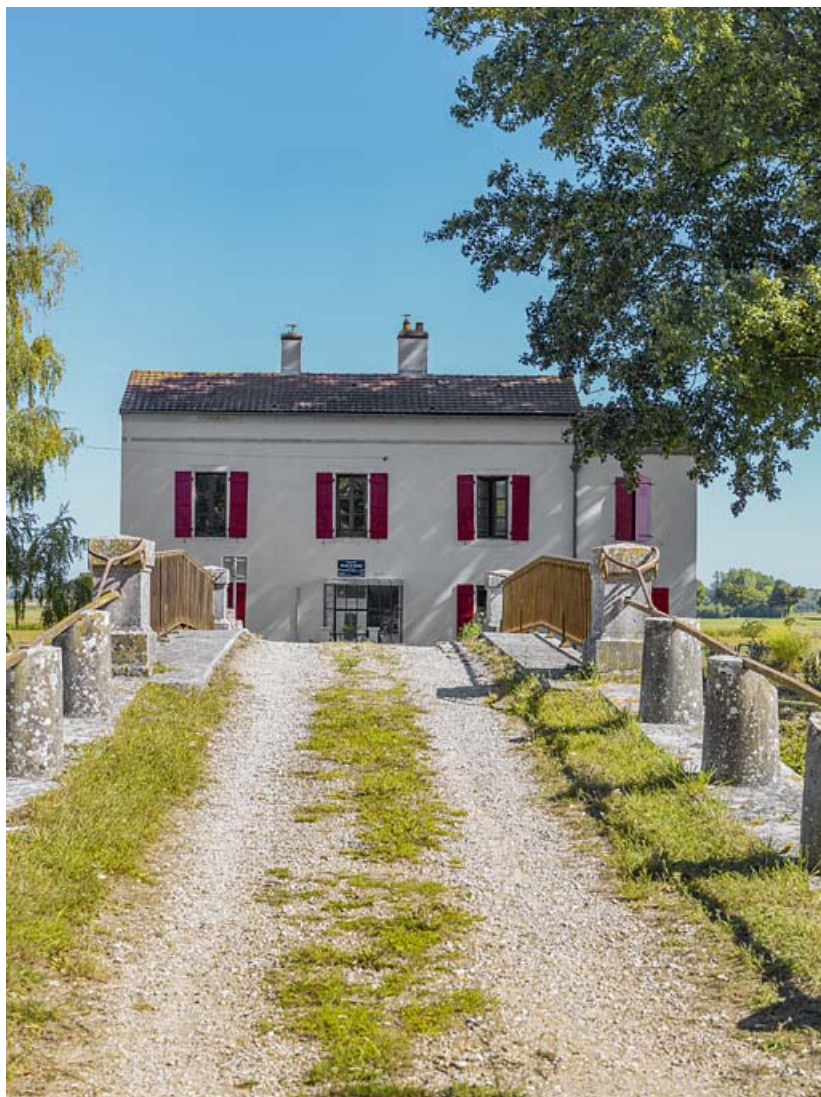
La maison éclésièrre : façade principale depuis le pont sur écluse. 21, Trugny, lieudit : PK 184