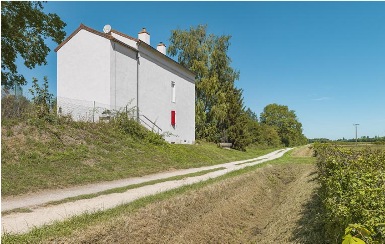
La maison éclusière de 3/4 : pignon de l'annexe latérale droite et face arrière. 21, Trugny, lieudit : PK 184