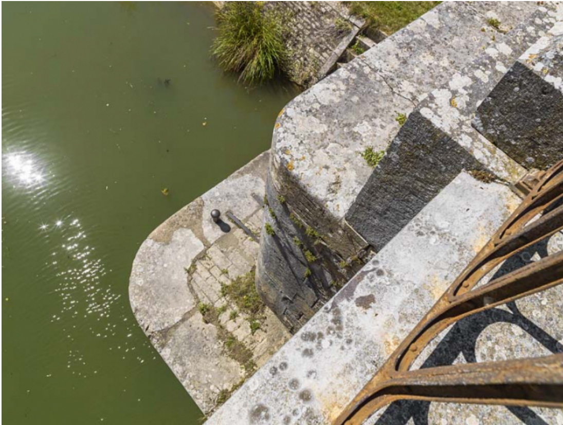
Détail de l'échelle de crue sur la culée du pont.