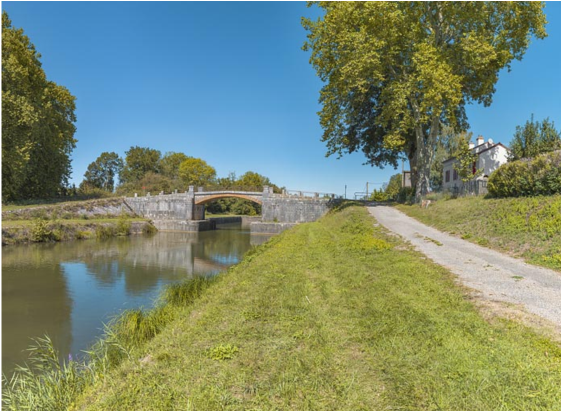
Vue d'ensemble du site, d'aval avec, à droite, la maison éclusière. 21, Trugny, lieudit : PK 184