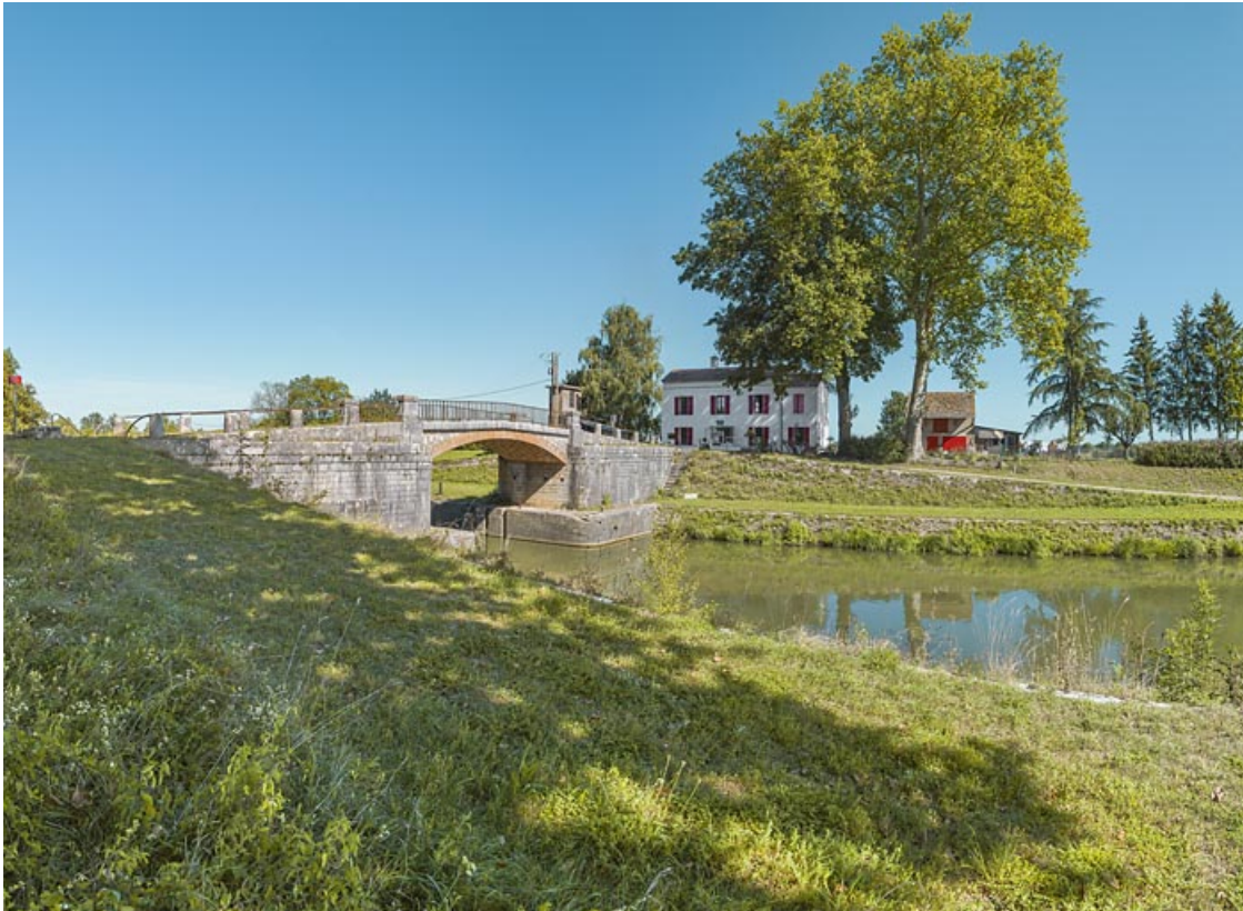
Vue d'ensemble du site, avec au centre, le pont sur écluse et à droite la maison éclusière et ses dépendances. 21, Trugny, lieudit : PK 184