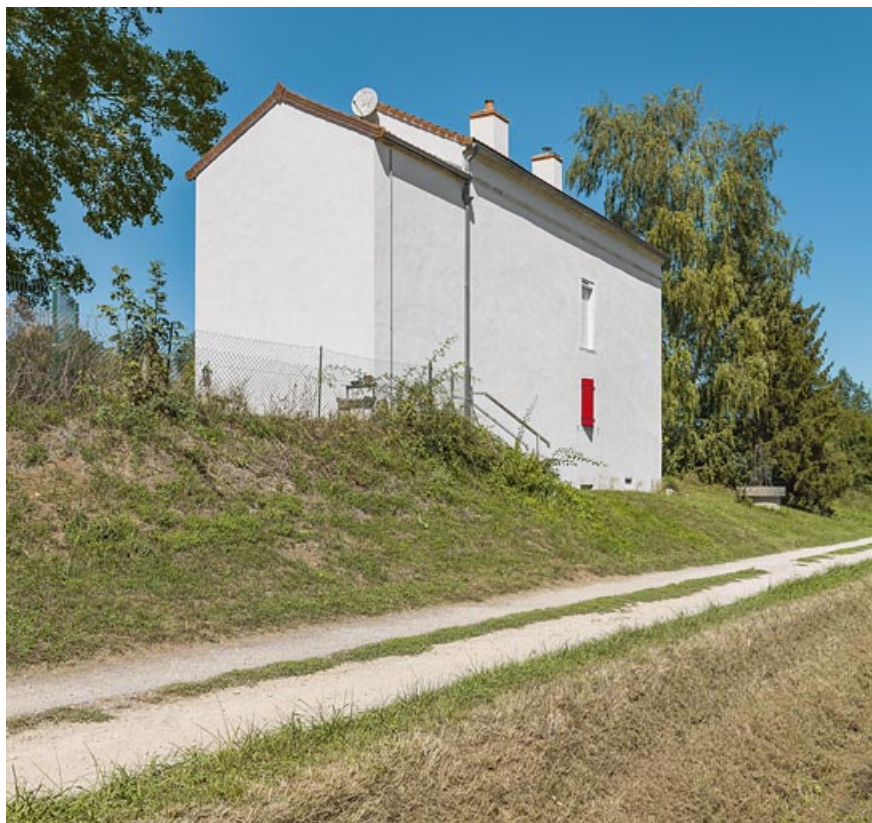
La maison éclusière de 3/4 : pignon de l'annexe latérale droite et face arrière. 21, Trugny, lieudit : PK 184