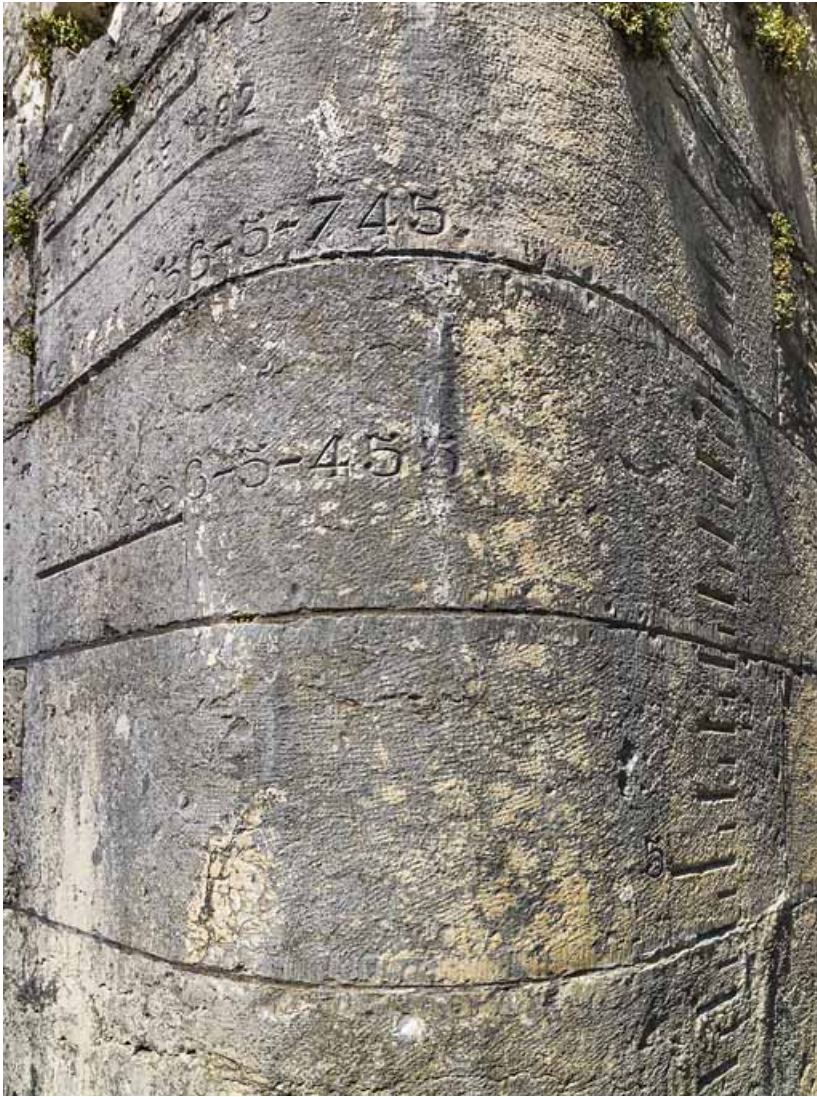
Détail de l'échelle de crue sur la culée du pont.