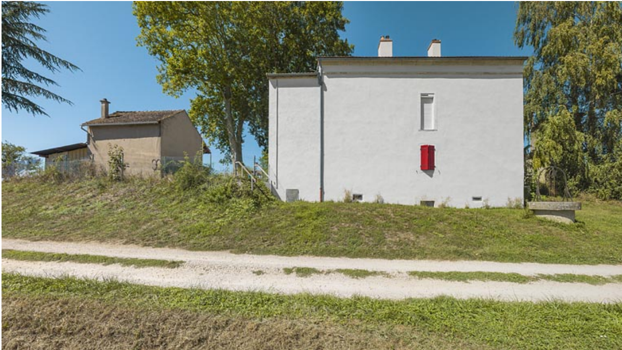
La maison éclusière : face arrière.