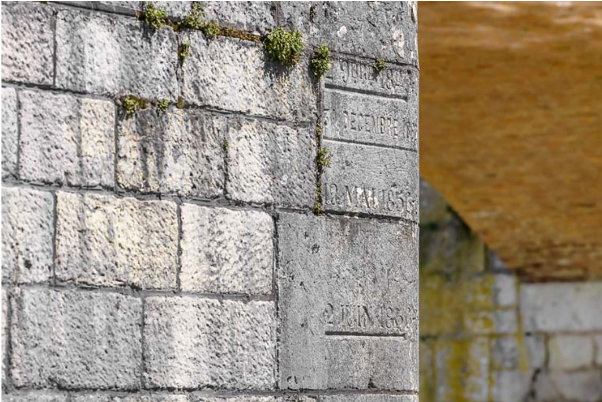
Détail de l'échelle de crue sur la culée du pont.