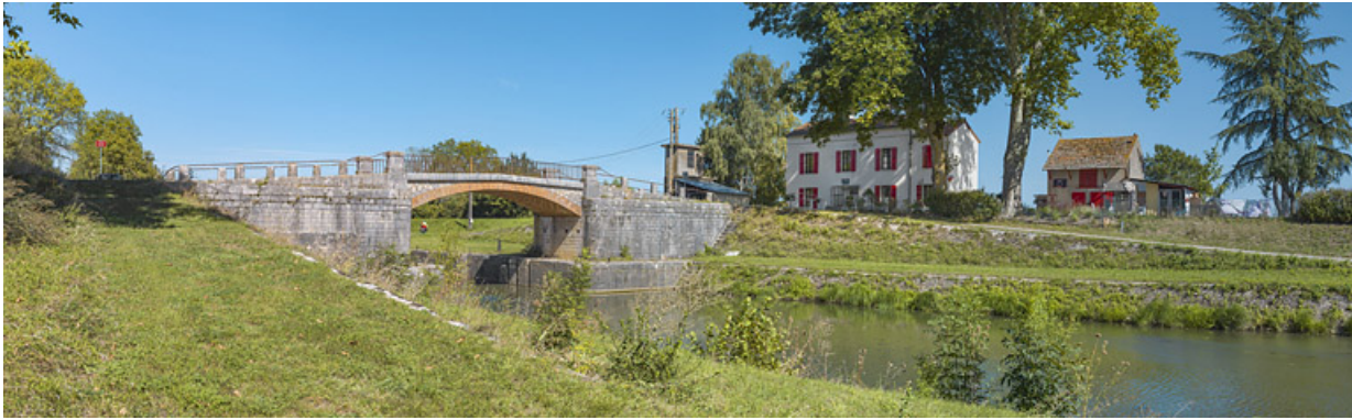
Vue d'ensemble du site, avec au centre, le pont sur écluse et à droite la maison éclusière et ses dépendances.