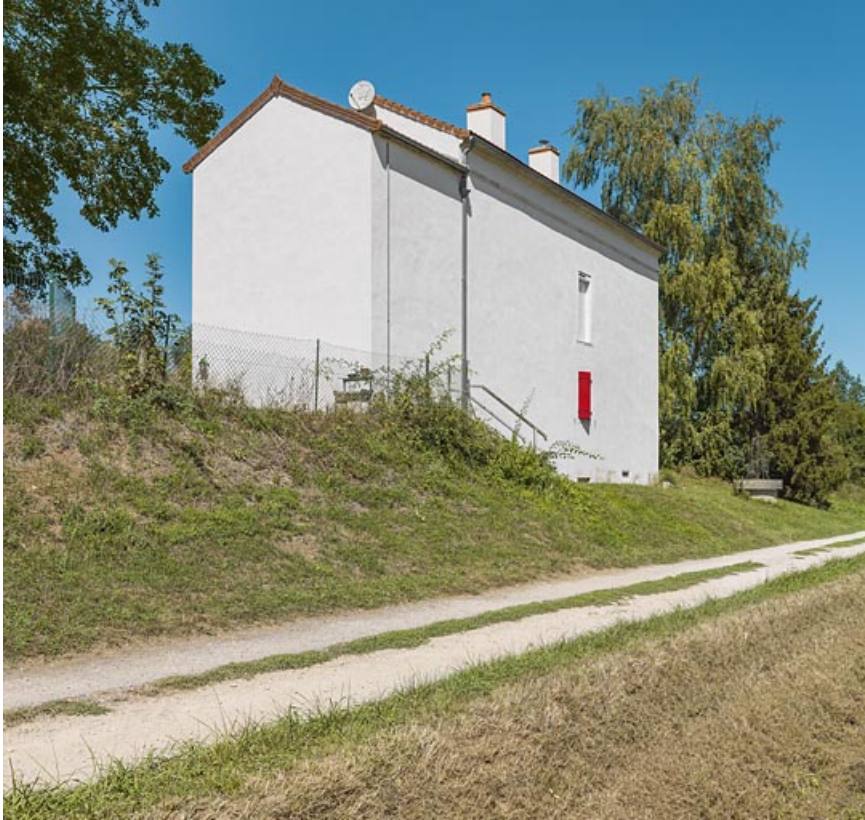
La maison éclusière de 3/4 : pignon de l'annexe latérale droite et face arrière. 21, Trugny, lieudit : PK 184