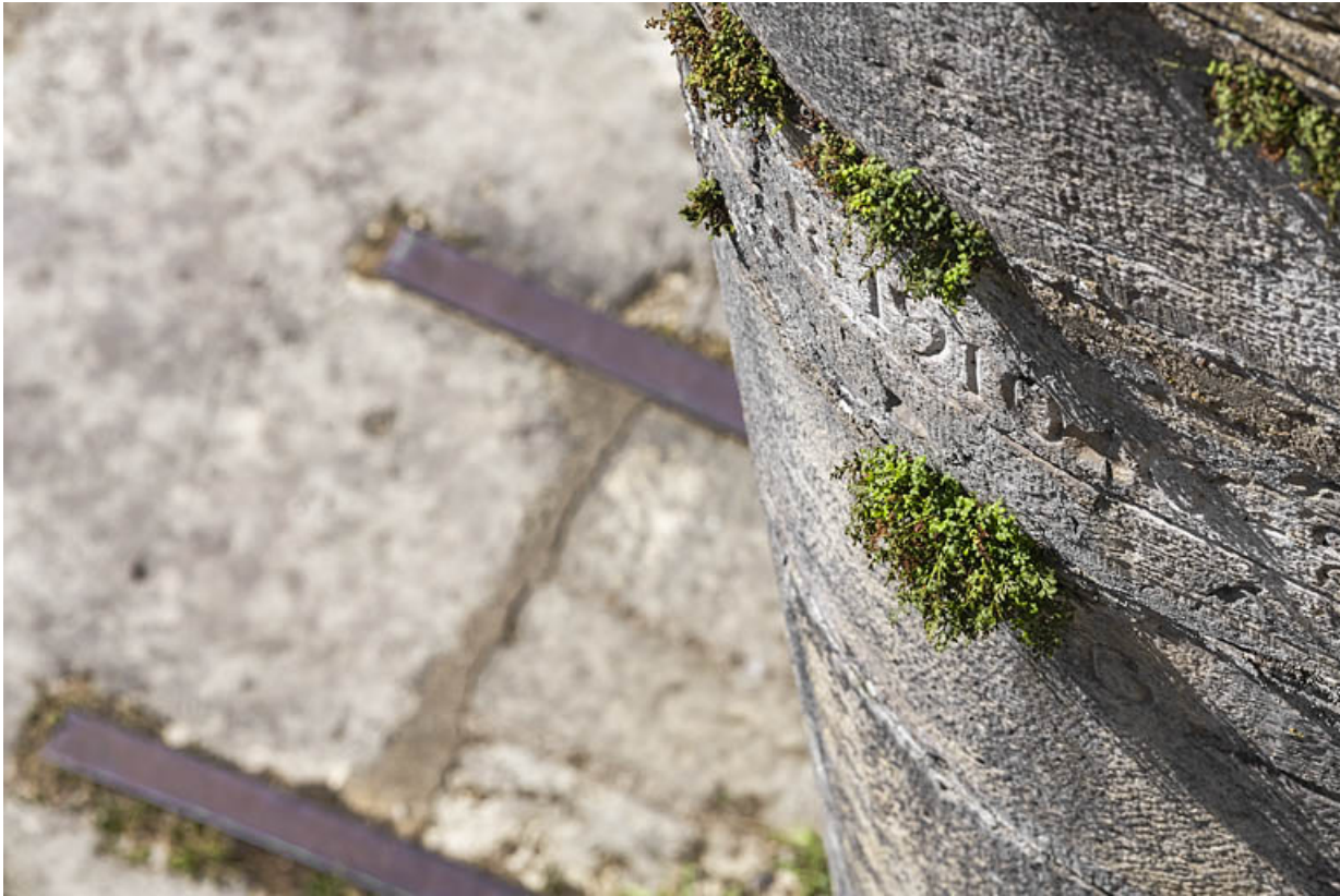
Détail de l'échelle de crue sur la culée du pont.