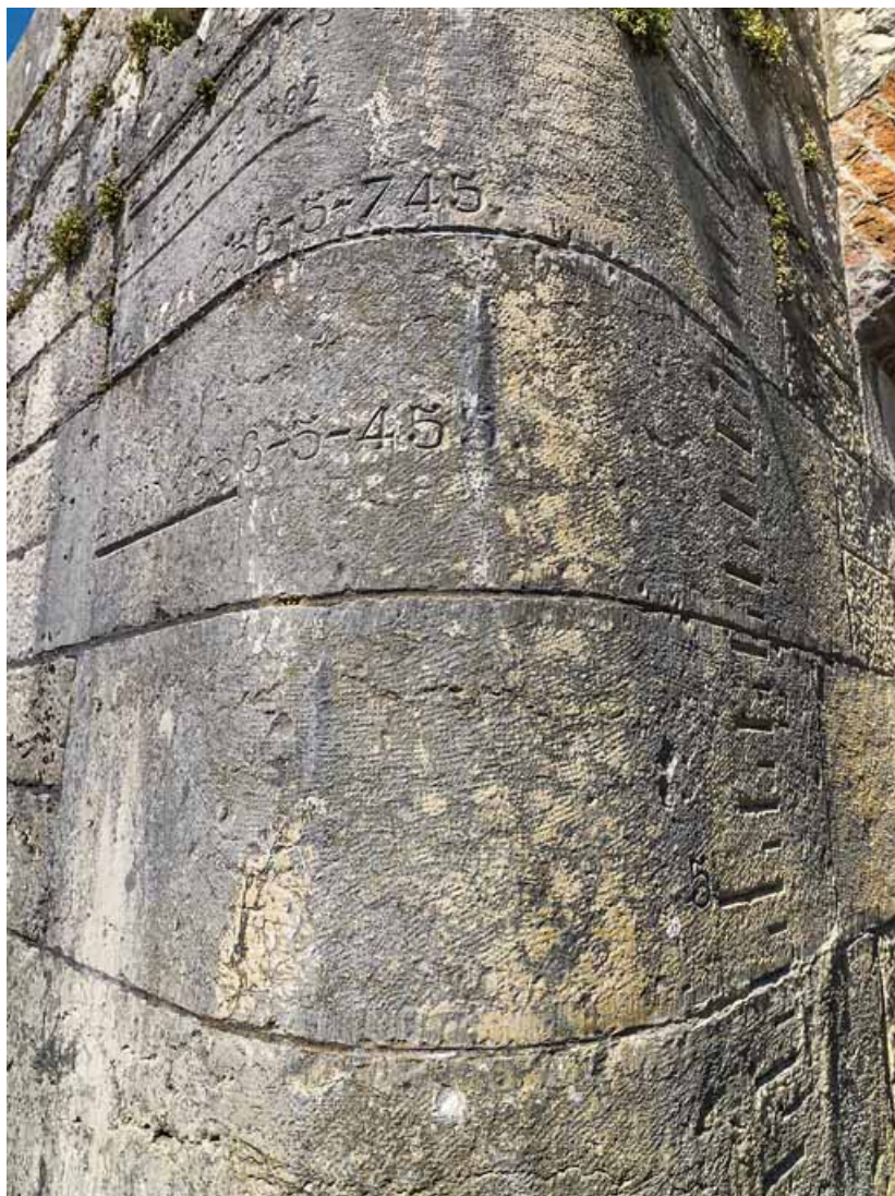
Détail de l'échelle de crue sur la culée du pont.