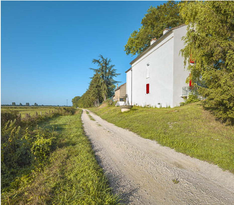
La maison éclusière de 3/4 : pignon, face arrière et puits.