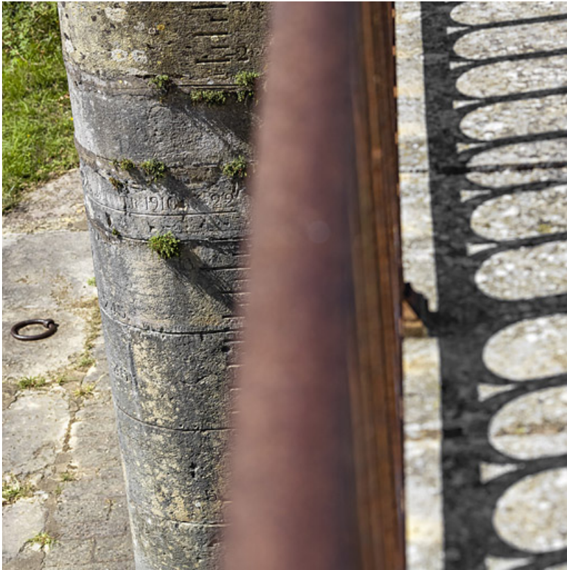
Echelle de crue sur la culée du pont.