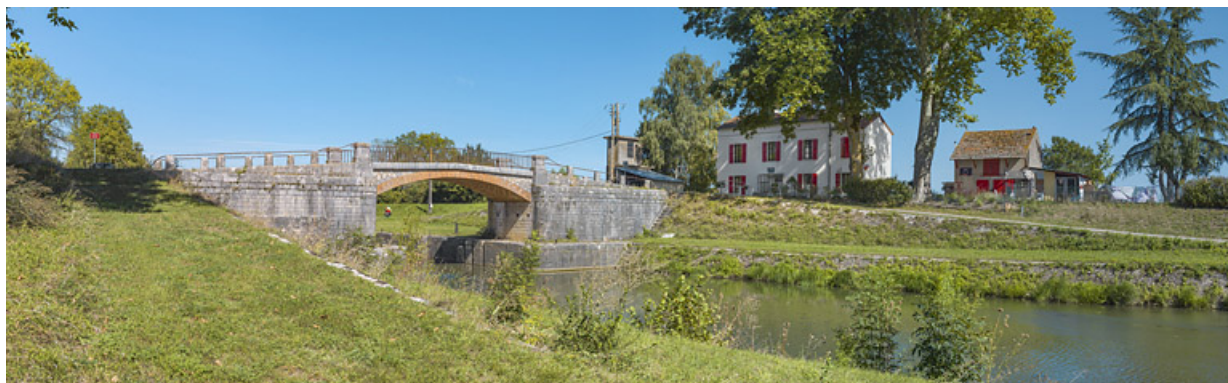
Vue d'ensemble du site, avec au centre, le pont sur écluse et à droite la maison éclusière et ses dépendances.