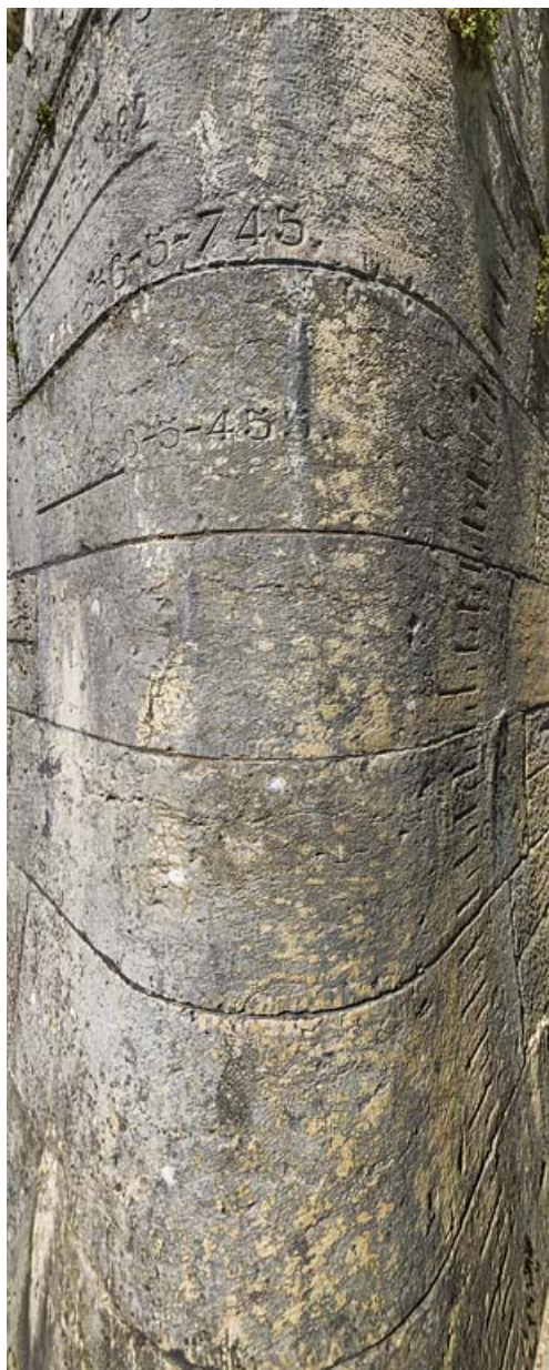
Détail de l'échelle de crue sur la culée du pont.