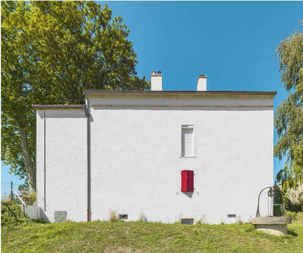
La maison éclusière : face arrière.