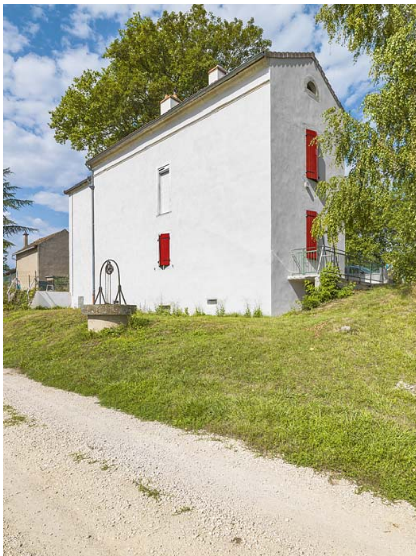
La maison éclusière de 3/4 : pignon, face arrière et puits.