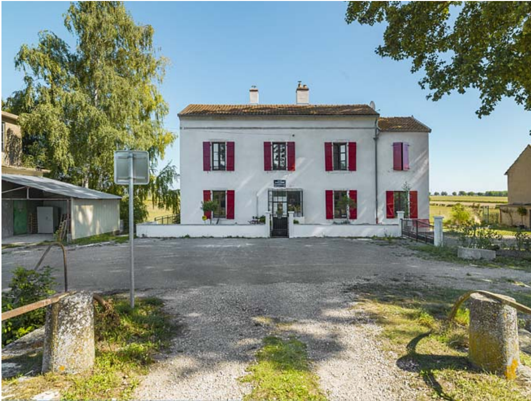
La maison éclusière : façade principale.