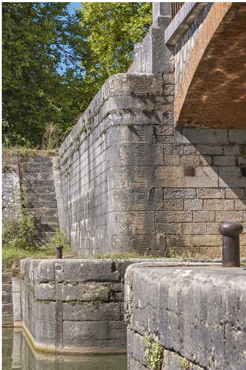
Echelle de crue sur la culée du pont et escaliers.