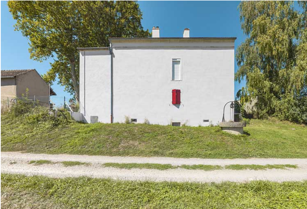
La maison éclusière : face arrière.