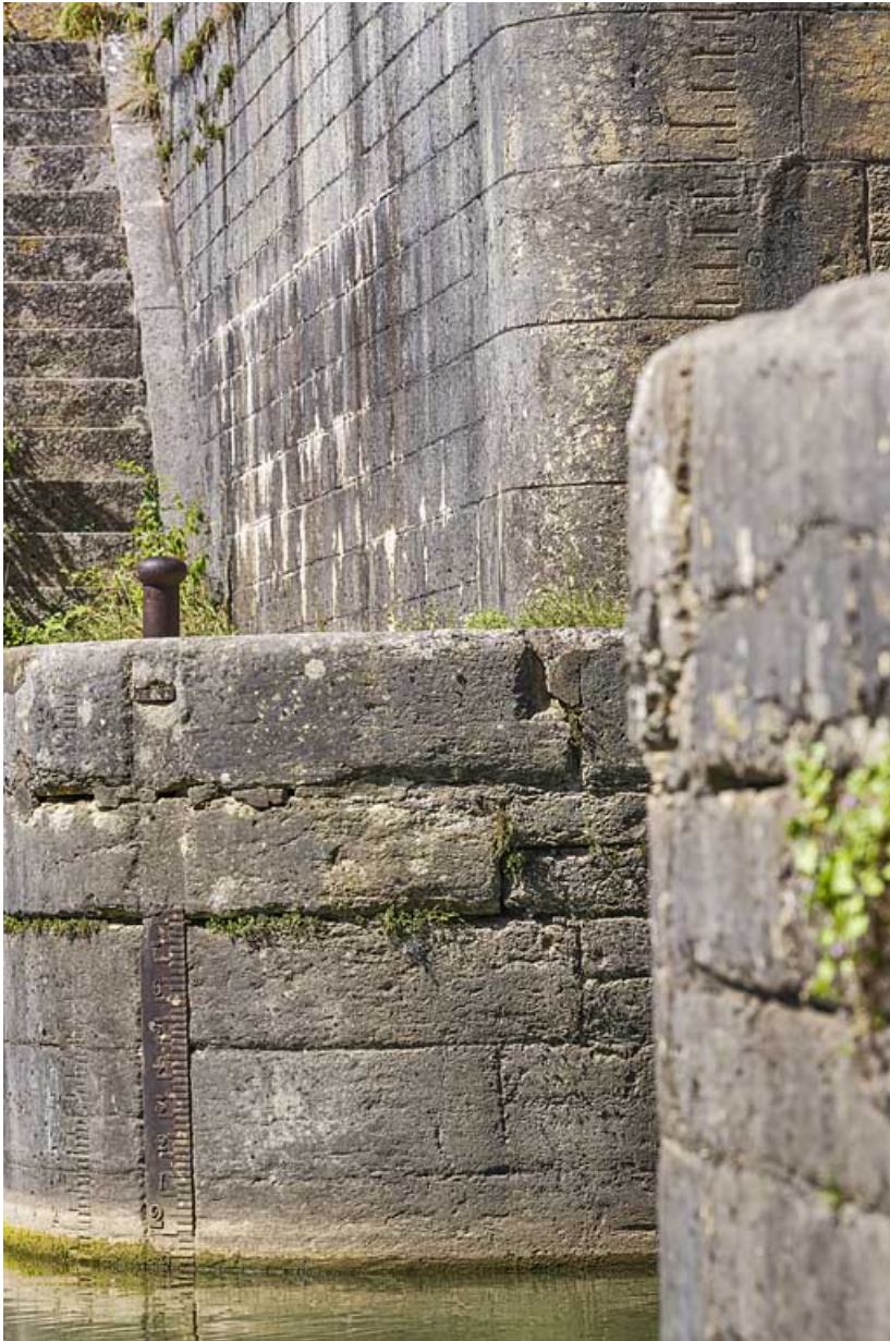
Echelle de crue sur la culée du pont et sur le bajoyer.