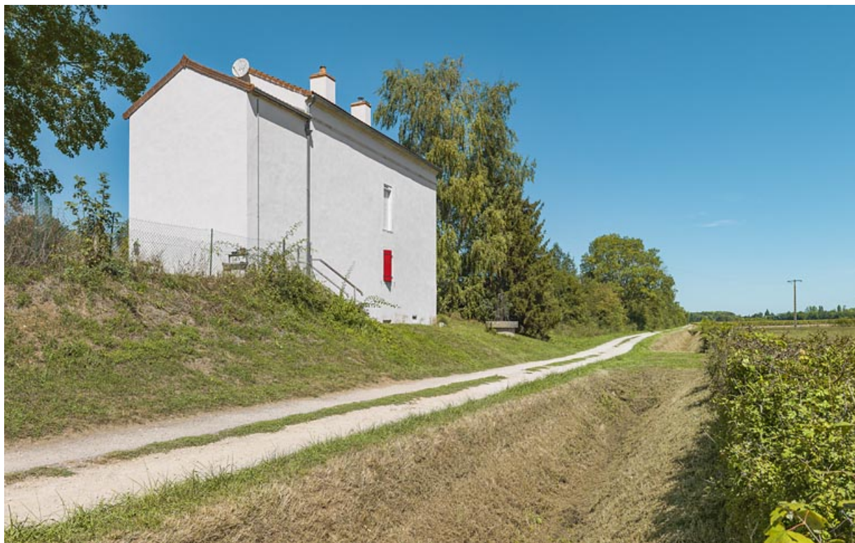
La maison éclusière de 3/4 : pignon de l'annexe latérale droite et face arrière. 21, Trugny, lieudit : PK 184