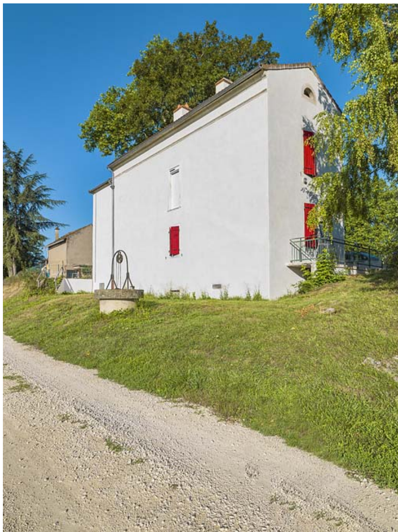
La maison éclusière de 3/4 : pignon, face arrière et puits.