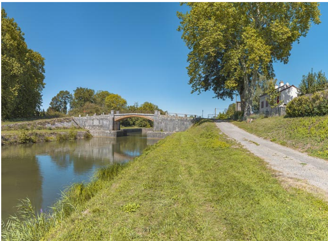
Vue d'ensemble du site, d'aval avec, à droite, la maison éclusière.