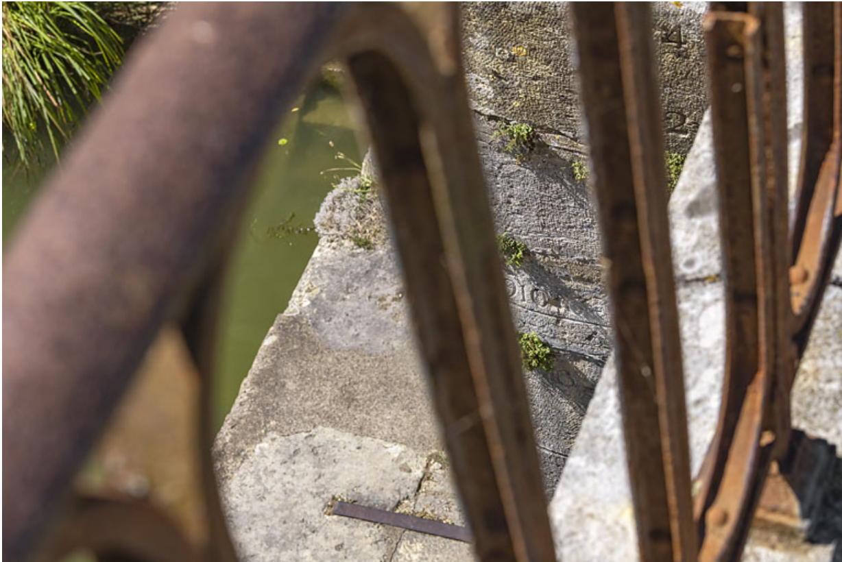
Détail de l'échelle de crue sur la culée du pont.