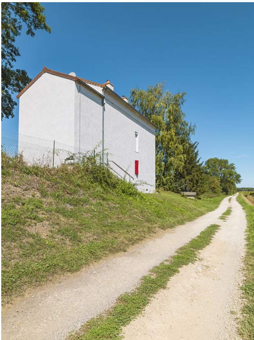
La maison éclusière de 3/4 : pignon de l'annexe latérale droite, face arrière et puits. 21, Trugny, lieudit : PK 184