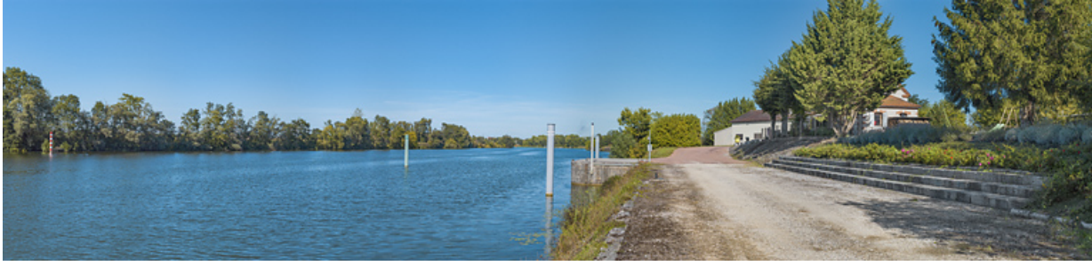
Le site de l'ancien barrage et la maison du barragiste, d'aval. Au fond, le bâtiment de VNF.