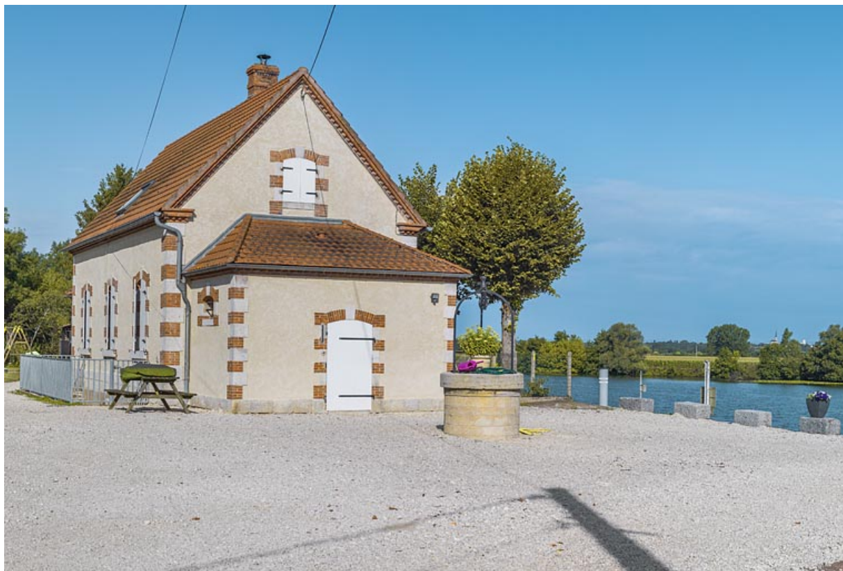
Vue de 3/4 : annexe latérale et face arrière. Au premier plan, le puits.