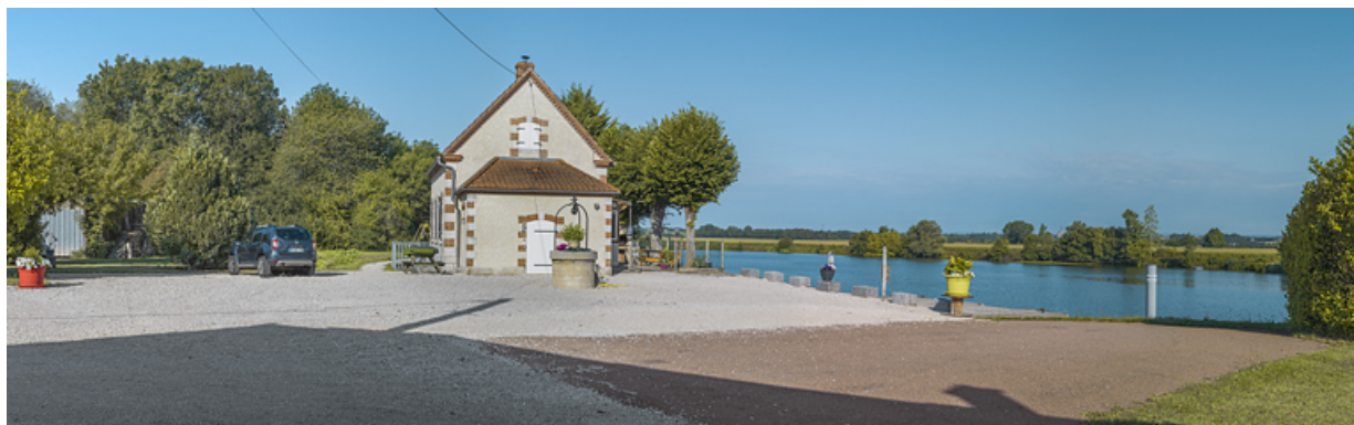
La maison du barragiste et le site de l'ancien barrage.