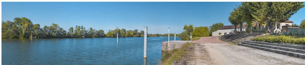
Le site de l'ancien barrage et la maison du barragiste, d'aval. Au fond, le bâtiment de VNF.