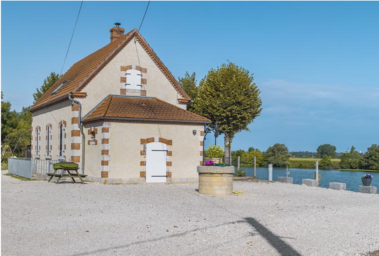
Vue de 3/4 : annexe latérale et face arrière. Au premier plan, le puits.