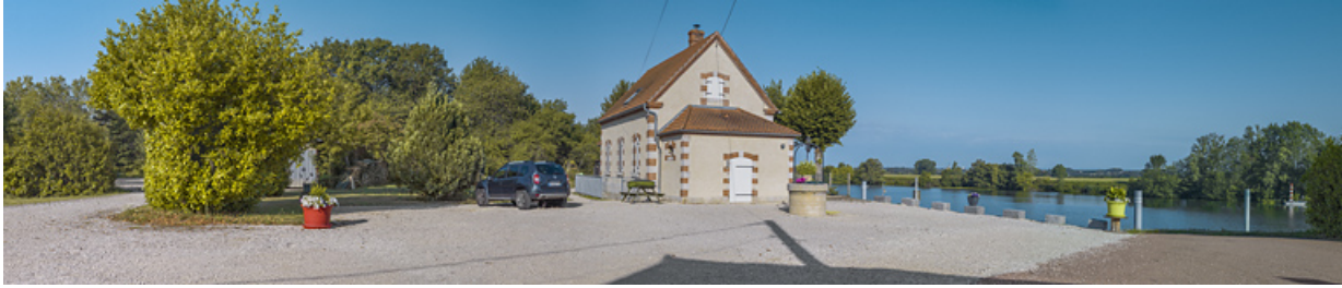
La maison du barragiste et le site de l'ancien barrage.