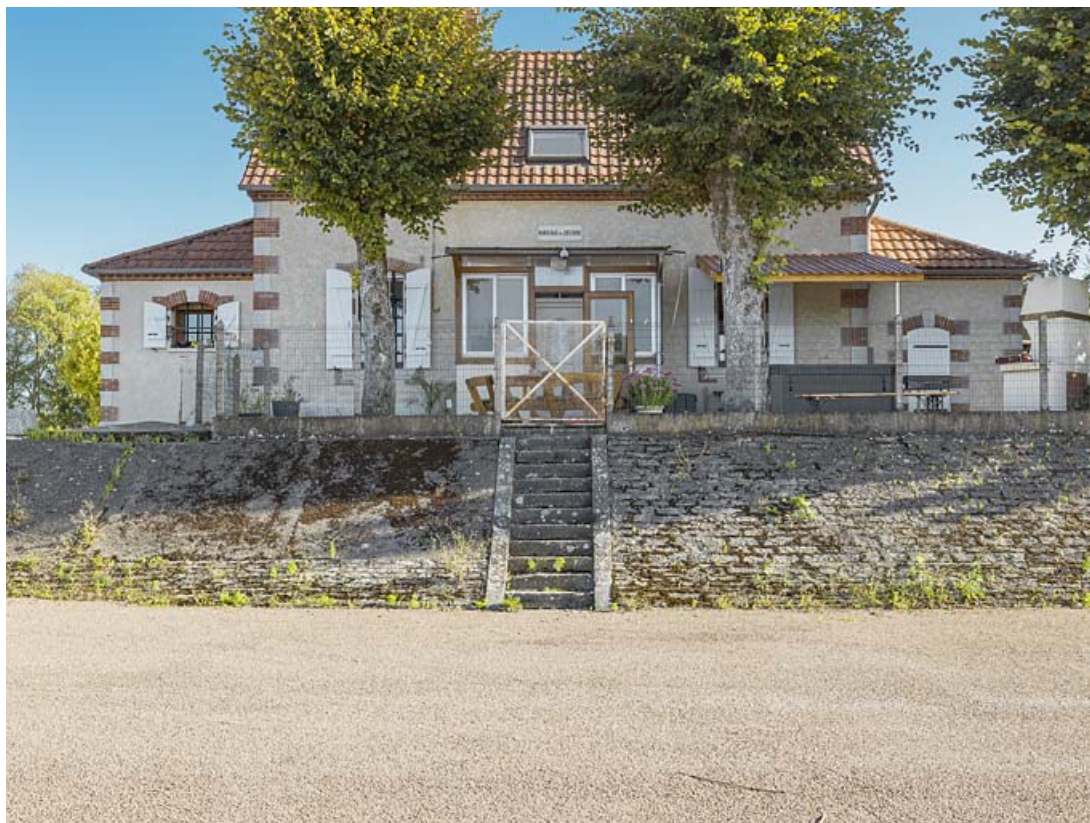
Vue d'ensemble de la maison du barragiste.