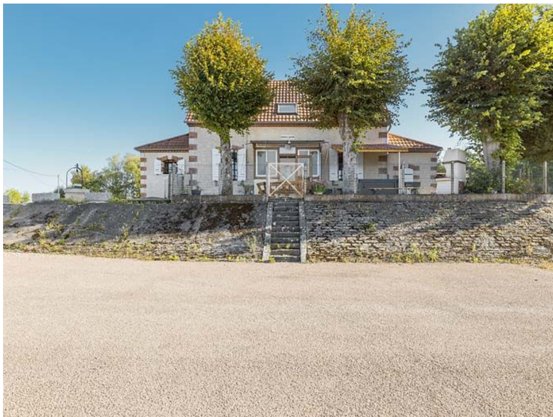
Vue d'ensemble de la maison du barragiste.