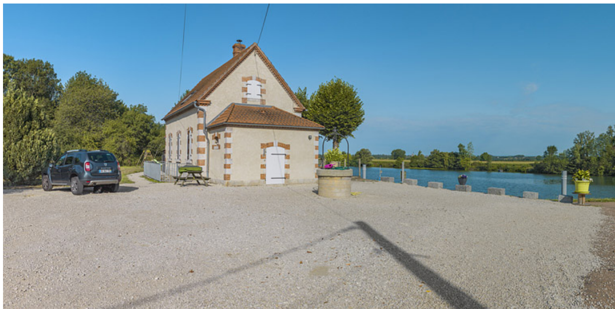
Vue de 3/4 : annexe latérale et face arrière. Au premier plan, le puits. 21, Trugny, lieudit : PK 185