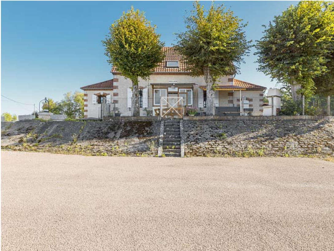
Vue d'ensemble de la maison du barragiste.