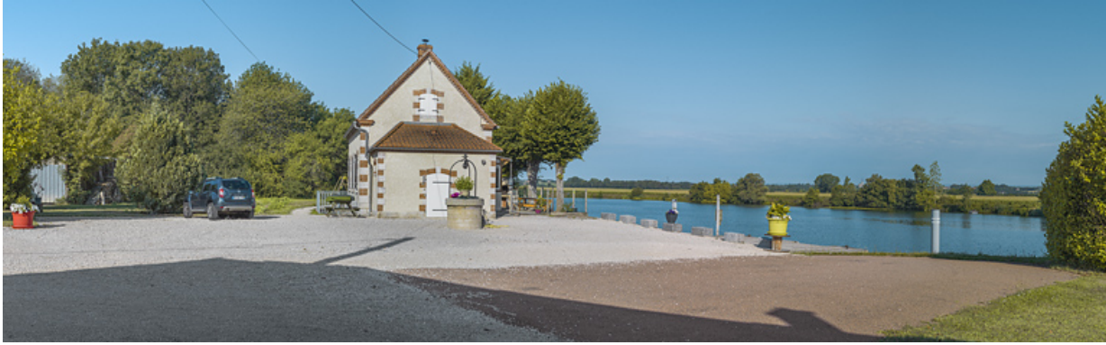
La maison du barragiste et le site de l'ancien barrage.