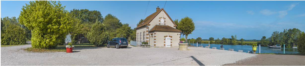
La maison du barragiste et le site de l'ancien barrage.