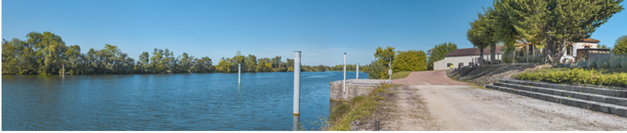
Le site de l'ancien barrage et la maison du barragiste, d'aval. Au fond, le bâtiment de VNF.