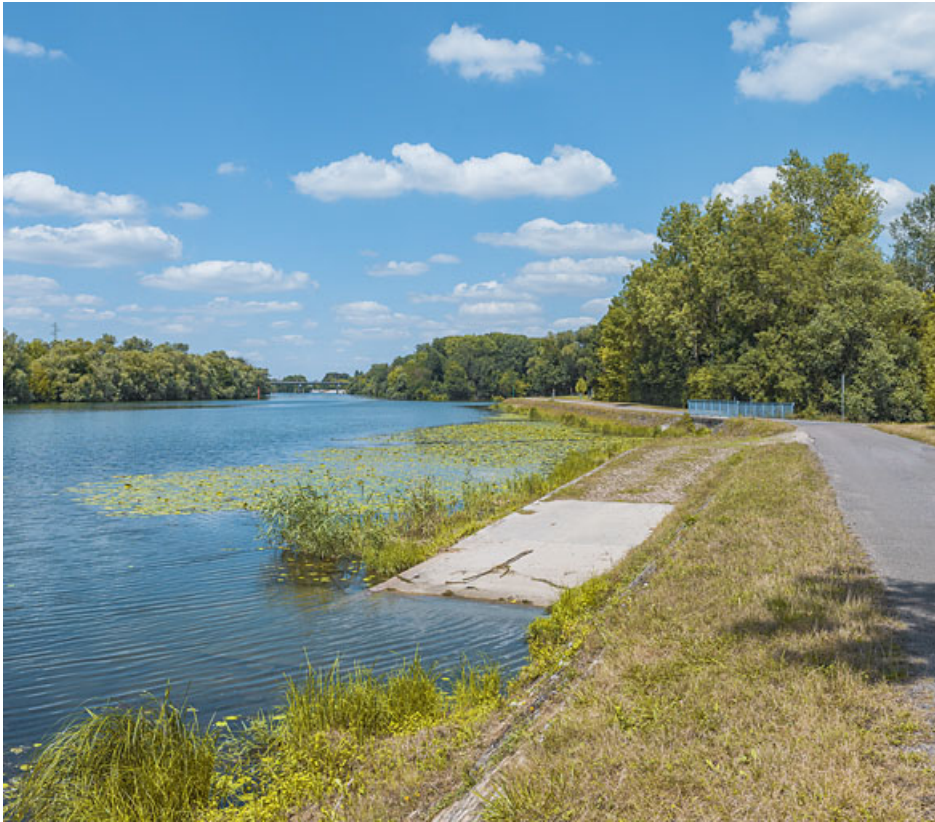
La rampe d'abreuvoir et les perrés.