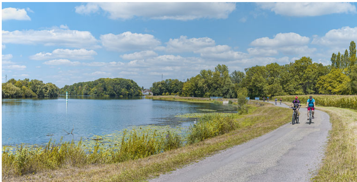
Vue d'ensemble d'aval des aménagements de rive à hauteur de Jallanges. En arrière-plan, la ville de Seurre. 21, Jallanges, lieudit : PK 186