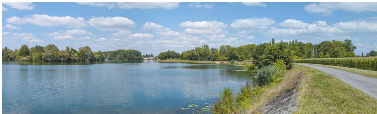
Vue d'ensemble d'aval des aménagements de rive à hauteur de Jallanges. En arrière-plan, la ville de Seurre. 21, Jallanges, lieudit : PK 186