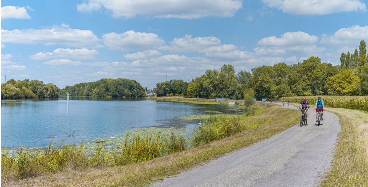
Vue d'ensemble d'aval des aménagements de rive à hauteur de Jallanges. En arrière-plan, la ville de Seurre. 21, Jallanges, lieudit : PK 186