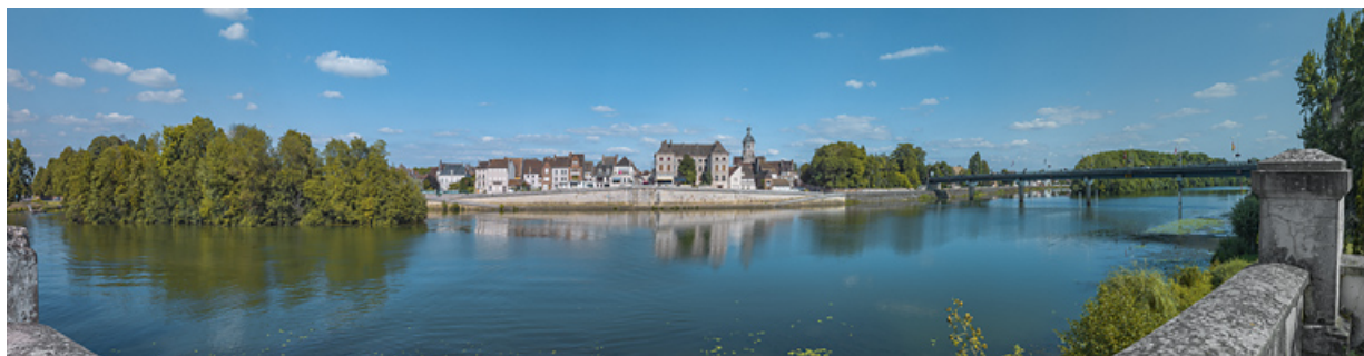
La ville de Seurre, ses quais et le nouveau pont, vus depuis la culée de l'ancien pont.