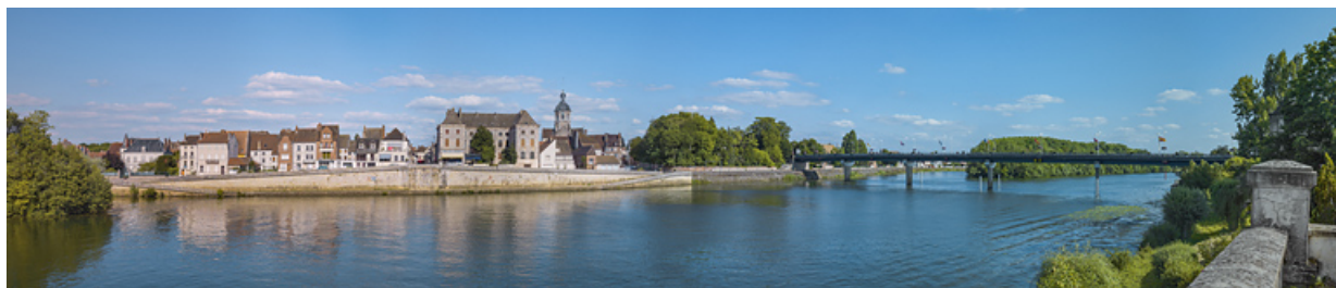
La ville de Seurre et ses quais et le nouveau pont, vus depuis la culée de l'ancien pont.