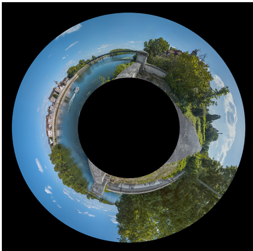
Panoramique de la traversée de la Saône à Seurre.