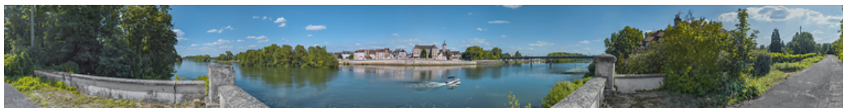
La ville de Seurre et ses quais, vus depuis l'ancienne culée du pont.