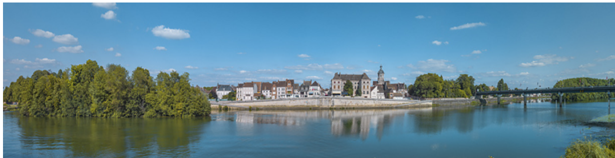
La ville de Seurre, ses quais et le nouveau pont, vus depuis la culée de l'ancien pont.