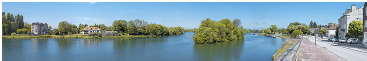
Panorama de Seurre avec l'île aux Boeufs au premier plan.