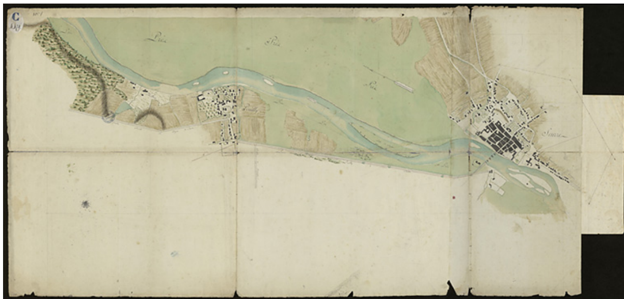
Plan n°18 du cours de la rivière sur les territoires de Pouilly et de Seurre. 21, Seurre