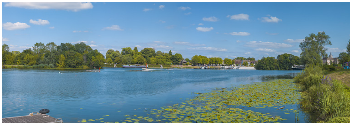
La ville de Seurre et ses quais, vus d'amont, depuis la rive droite.