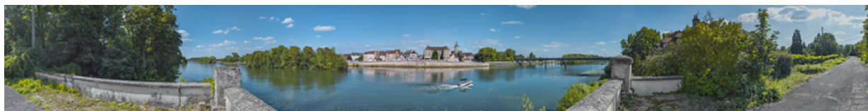
La ville de Seurre et ses quais, vus depuis l'ancienne culée du pont.