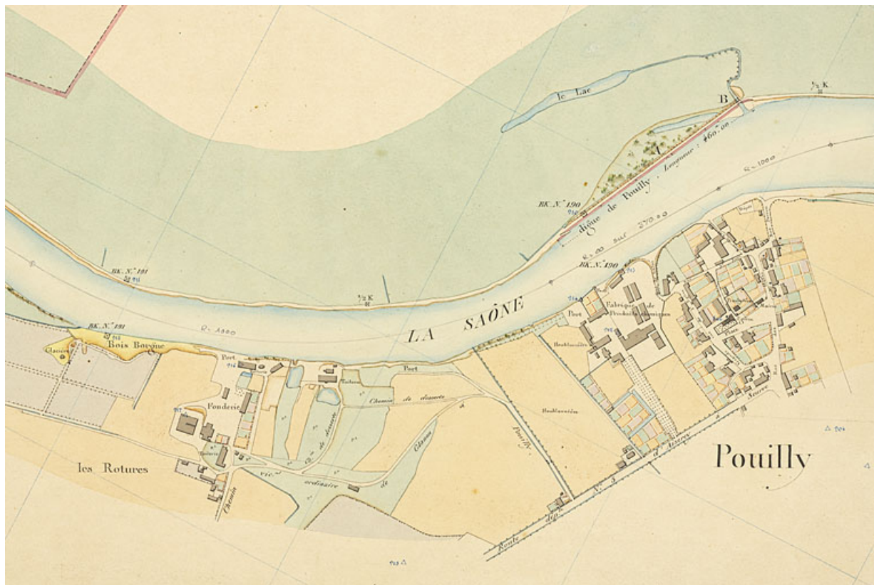
Carte de la Saône. Volume 4. Feuille n°35. Détail de Pouilly. 21, Seurre