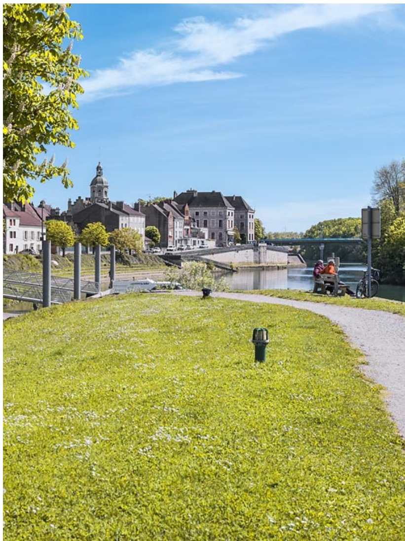
Vue rapprochée de la rive gauche de la Saône : les quais à gradins et l'église Saint-Martin se dégagent nettement. 21, Seurre