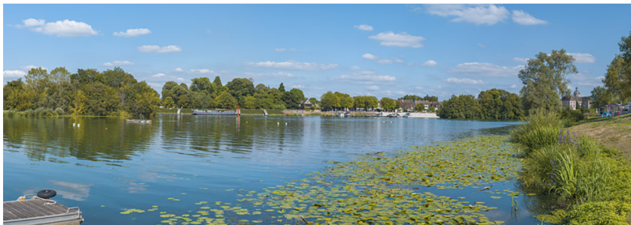
La ville de Seurre et ses quais, vus d'amont, depuis la rive droite. 21, Seurre