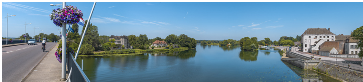
La Saône : à droite, la ville de Seurre et ses quais, à gauche, le Portail de Pouilly.