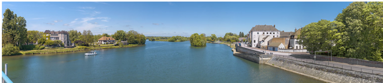
Panorama de Seurre : au centre, la Saône et à droite, les quais et la ville. 21, Seurre