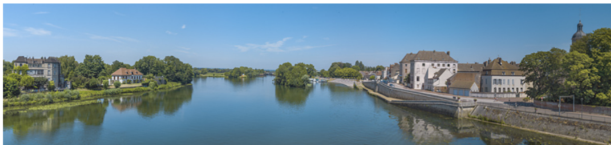
La Saône : à droite, la ville de Seurre et ses quais, à gauche, le Portail de Pouilly.