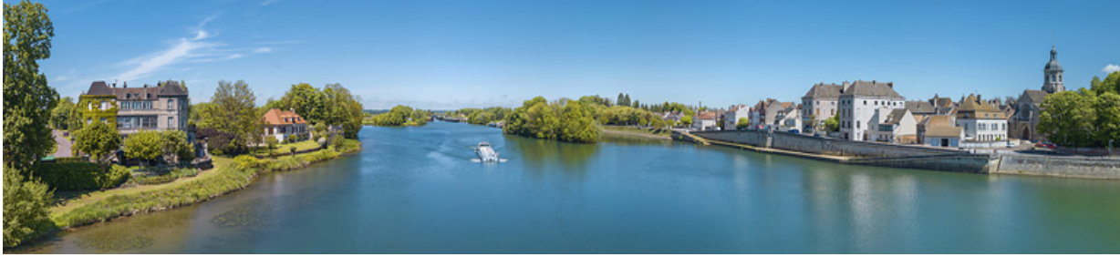
Panorama de la ville de Seurre, avec la Saône en axe médian. A droite, on peut voir les quais de Saône et l'église Saint-Martin. En arrière-plan, le site d'écluse de Seurre.