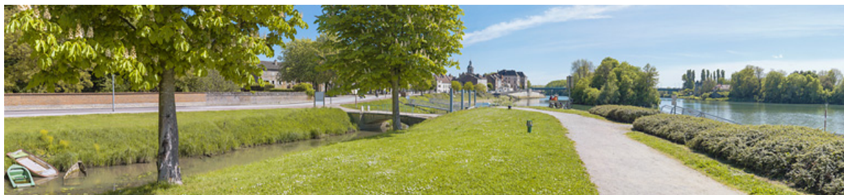
La ville de Seurre depuis la raie Mignot, en amont. A droite, la Saône. 21, Seurre