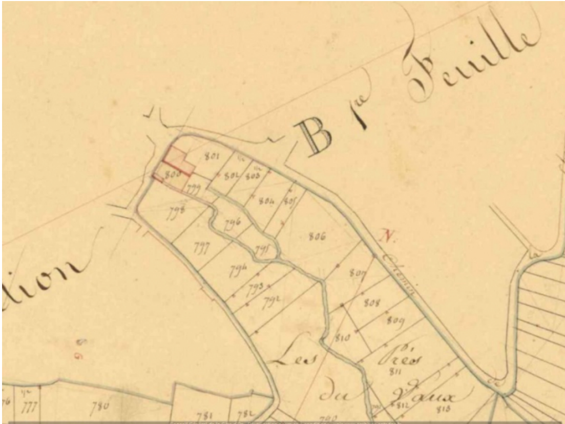
Plan masse du moulin extrait du plan cadastral de 1833 (archives départementales 21 : 3 P 321/5). 21, Gurgy-le-Château, 2 rue du Moulin