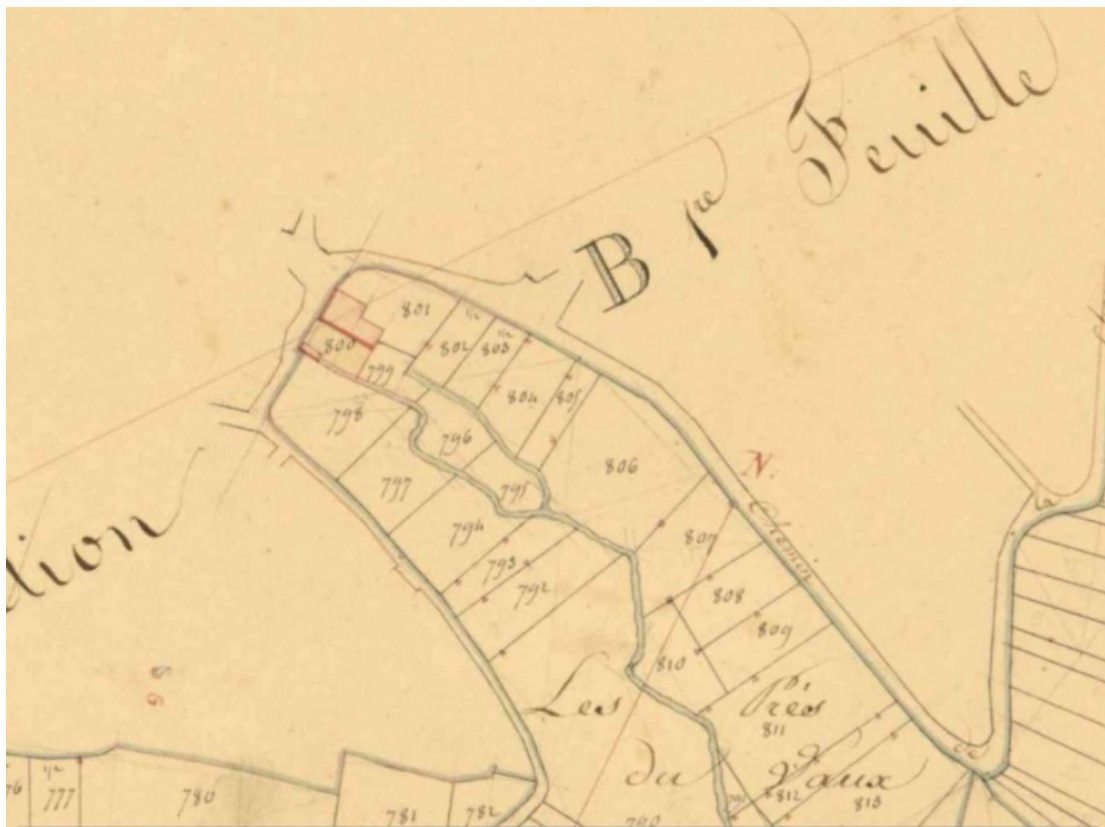
Plan masse du moulin extrait du plan cadastral de 1833 (archives départementales 21 : 3 P 321/5). 21, Gurgy-le-Château, 2 rue du Moulin