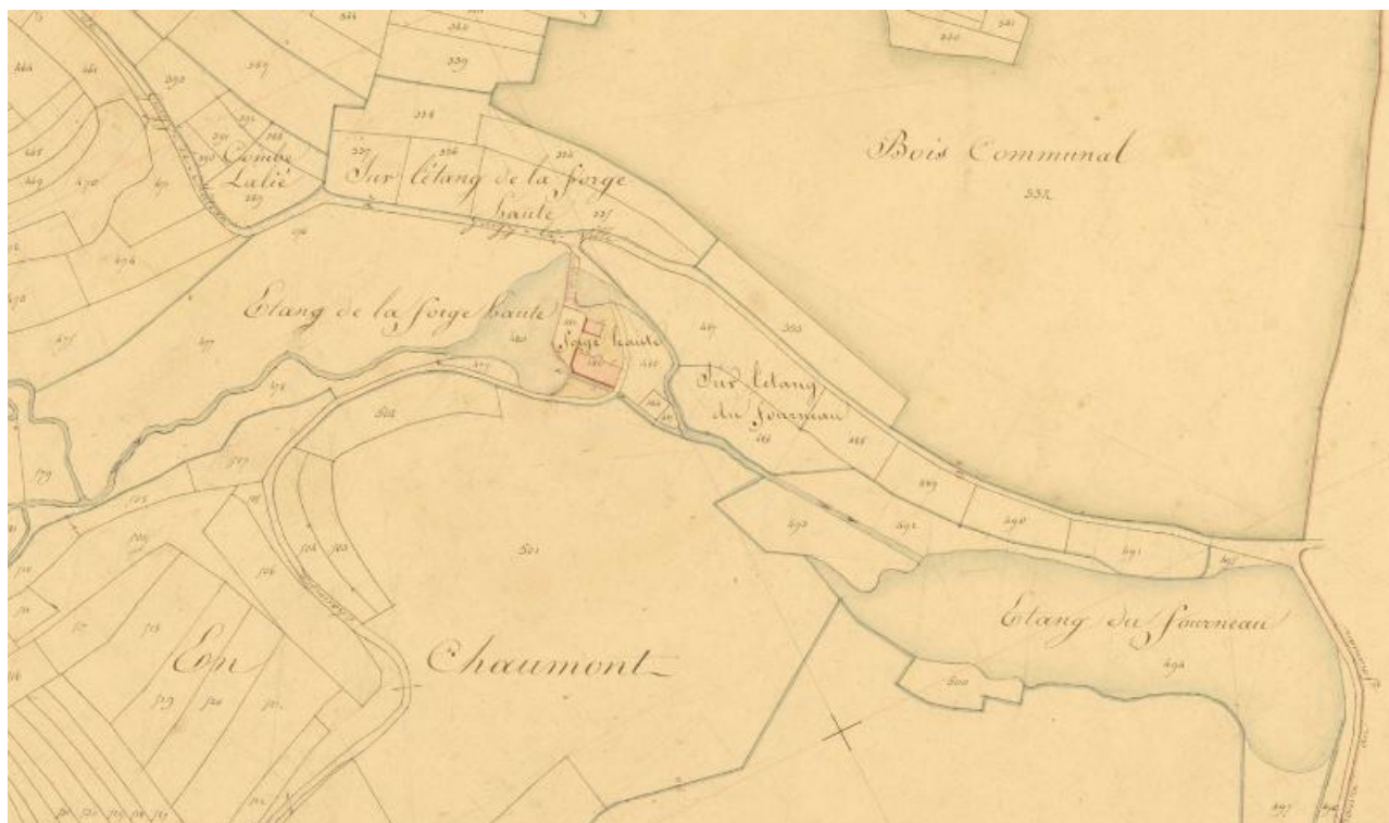
Extrait du plan cadastral napoléonien (1833) présentant le site de la forge haute (archives départementales 21 : 3 P 321/5). 21, Gurgy-le-Château, lieudit : Ancien barrage de la forge haute