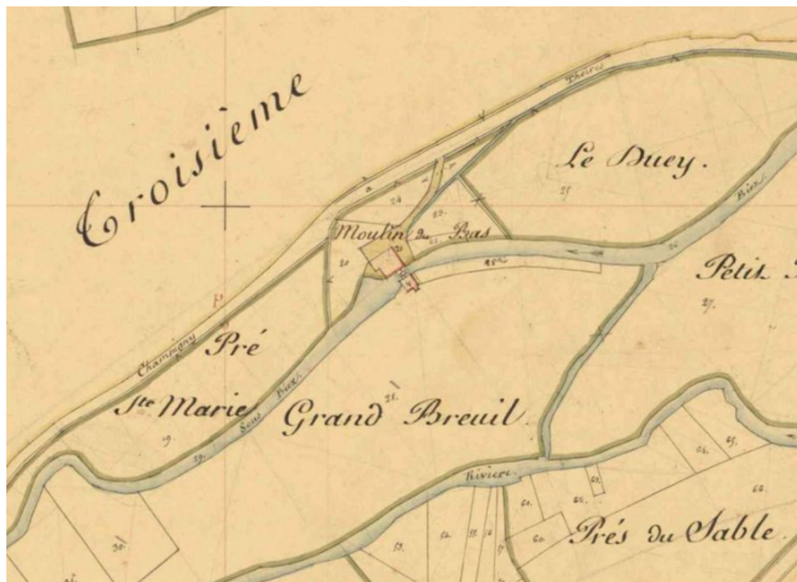
Extrait du plan cadastral napoléonien (archives départementales 21 : 3 P 628/7).