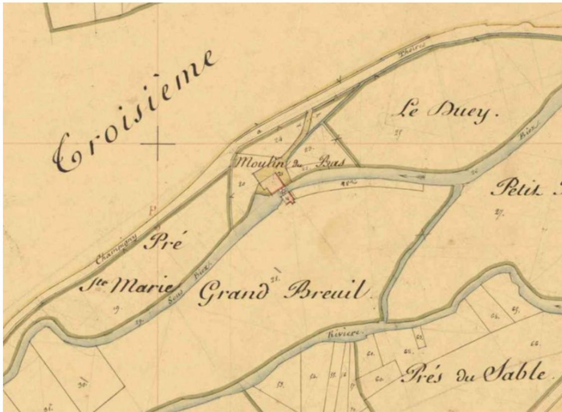
Extrait du plan cadastral napoléonien (archives départementales 21 : 3 P 628/7).