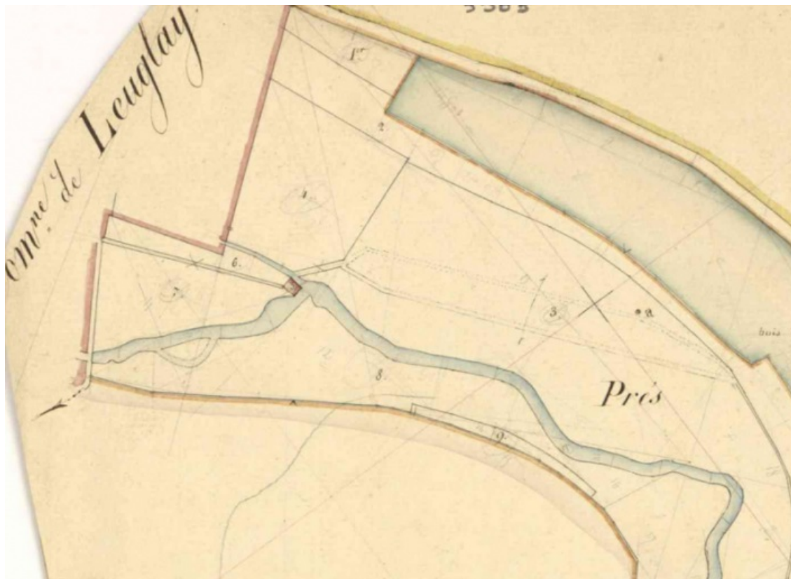
Extrait du plan cadastral napoléonien de 1833 (Archives départementales 21 : 3 P 519/13). 21, Recey-sur-Ource, lieudit : Ancienne Chartreuse de Lugny