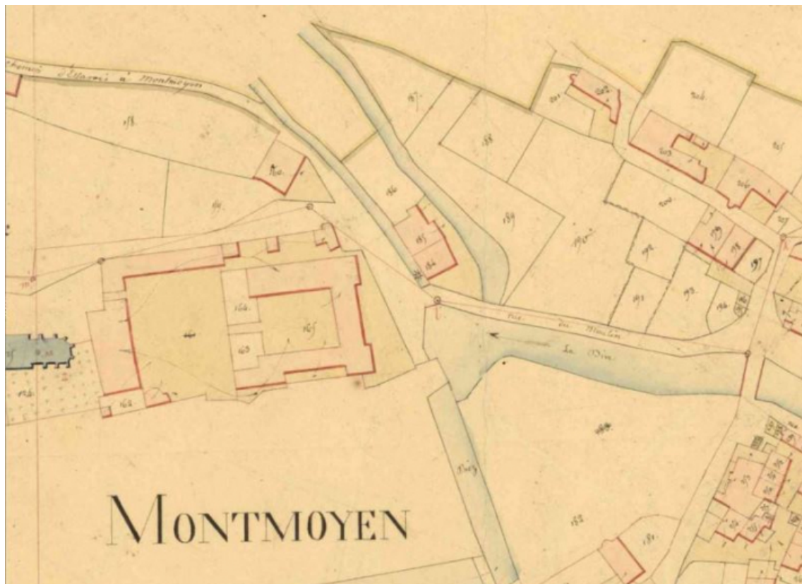
Extrait du plan cadastral dit napoléonien représentant, au pied du château, le moulin de Montmoyen (Archives départementales 21 : 3 P 437/11).