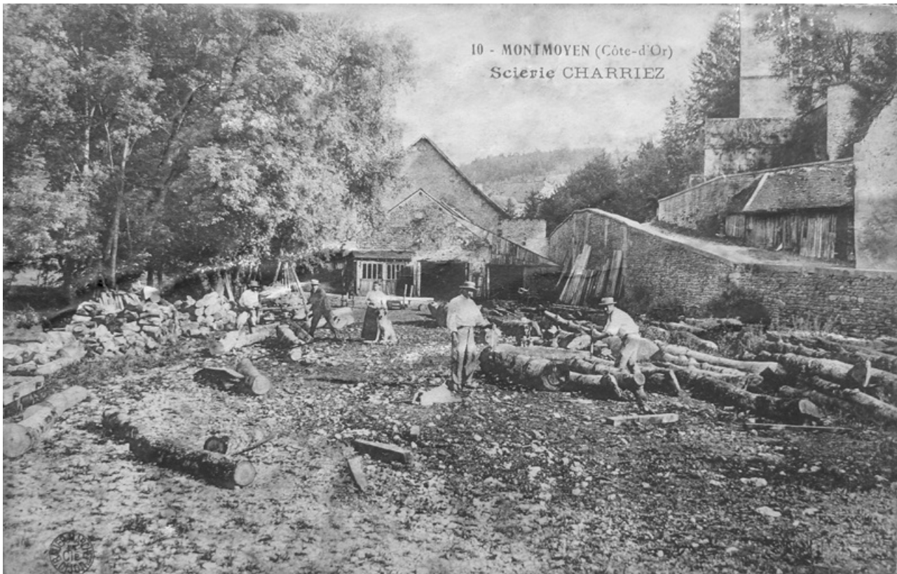
Carte postale ancienne montrant la partie nord du moulin, convertie en scierie. 21, Montmoyen, 2 rue de la Roche