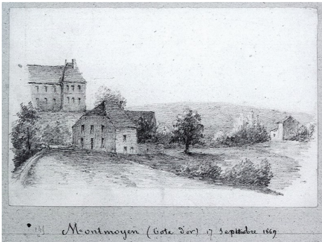
Vue du moulin en 1869 par Louis Victor Petitot. 21, Montmoyen, 2 rue de la Roche