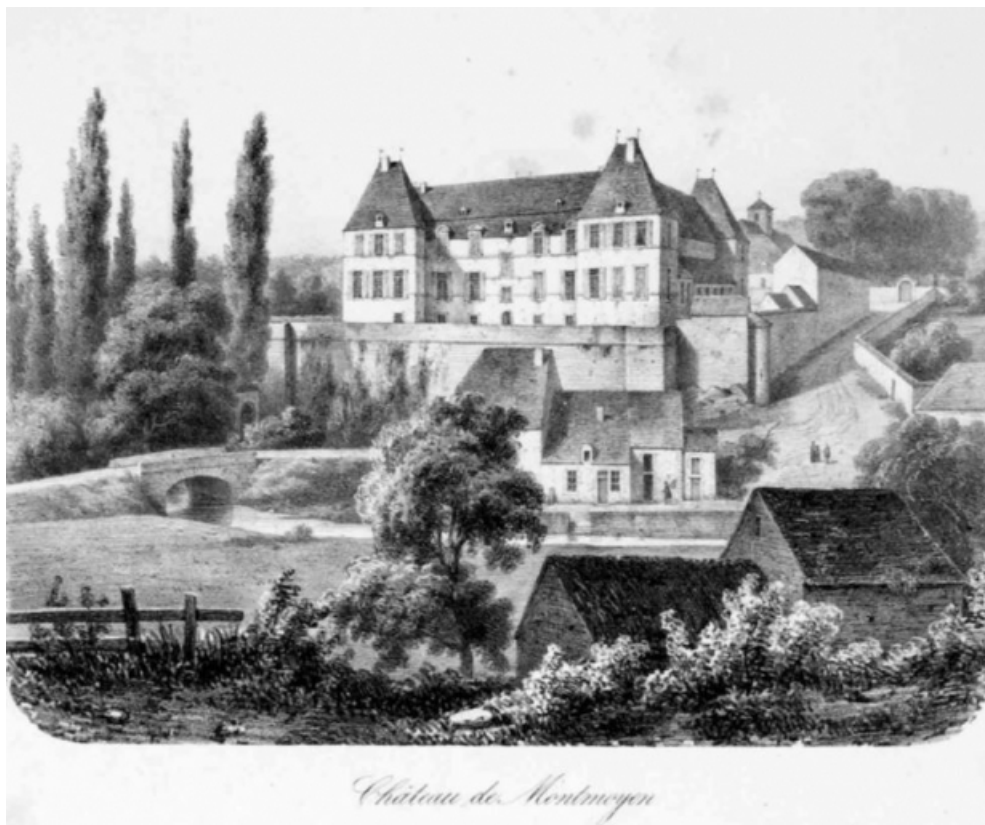
Lithographie du Château et du moulin de Montmoyen, publiée en 1853 par Eugène Nesle. 21, Montmoyen, 2 rue de la Roche