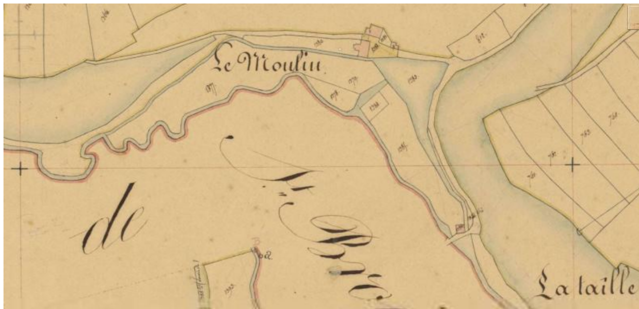
Extrait du plan cadastral napoléonien (3 P 414/3).