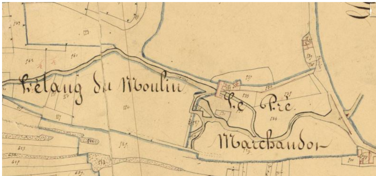
Extrait du plan cadastral dit napoléonien (1833) présentant l'emplacement du moulin et de son bassin de retenue (AD 21 : 3 P 258/1).