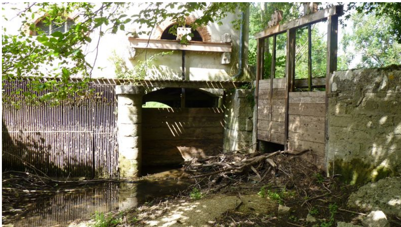
Vue du raccordement du moulin sur le bief.