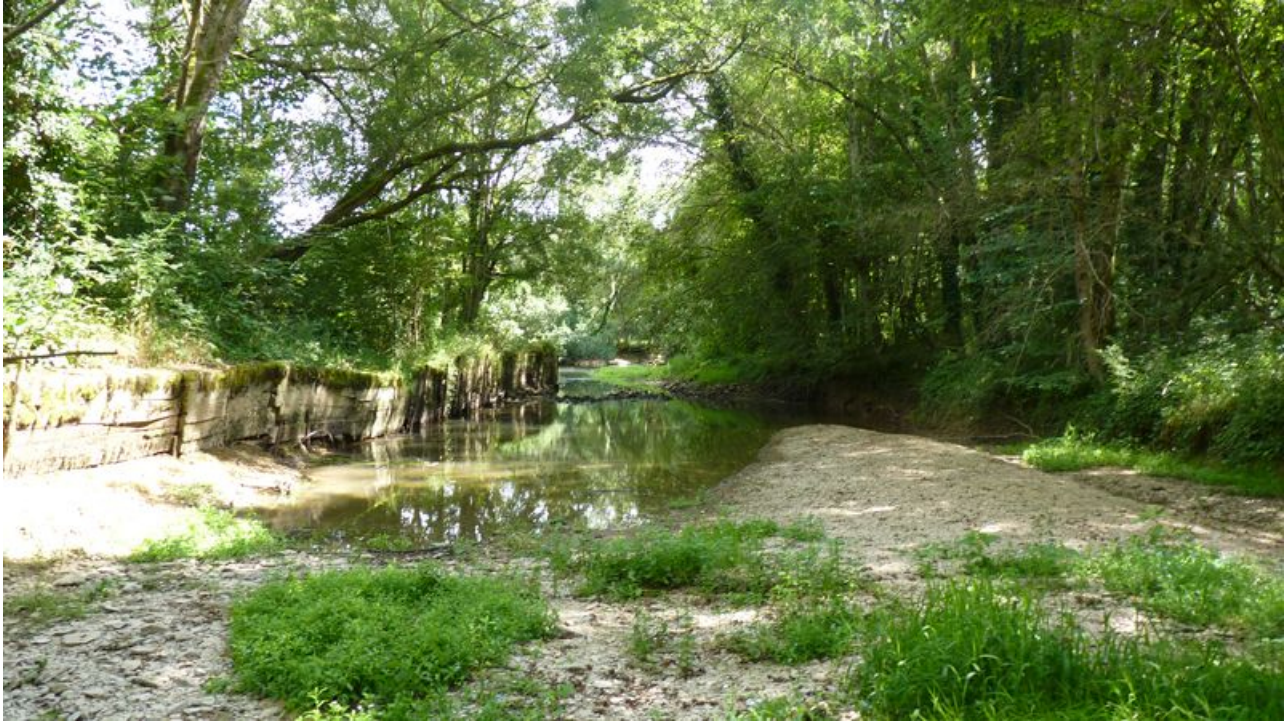
Vue du bief qui dessert le moulin.