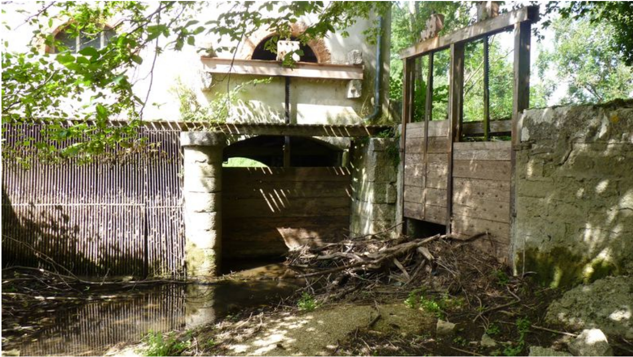
Vue du raccordement du moulin sur le bief.