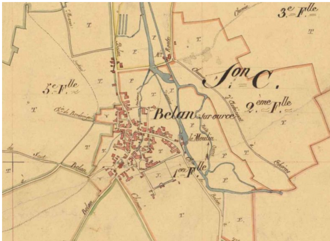
Vue du site du moulin sur le plan cadastral napoléonien de 1833 (AD 21 : 3 P 61/1) 21, Belan-sur-Ource