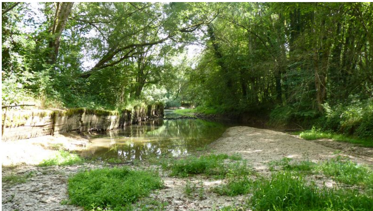
Vue du bief qui dessert le moulin.