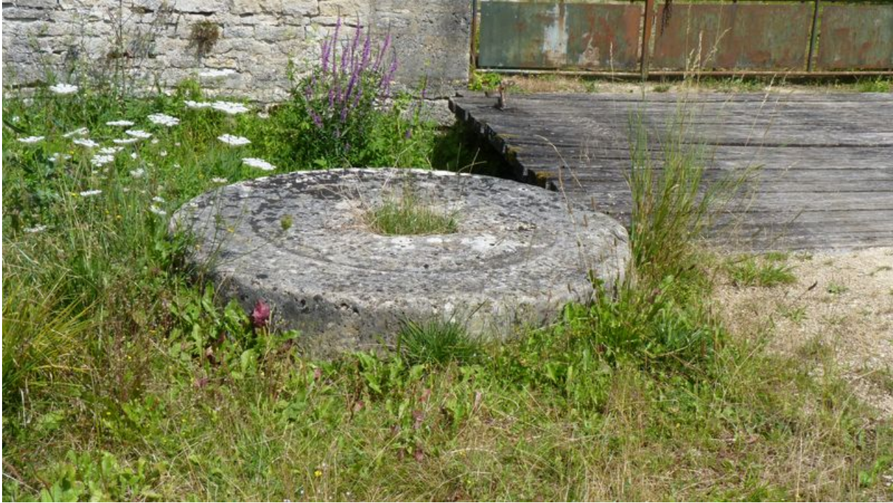
Vue des anciennes meules entreposées au pied de l'édifice.