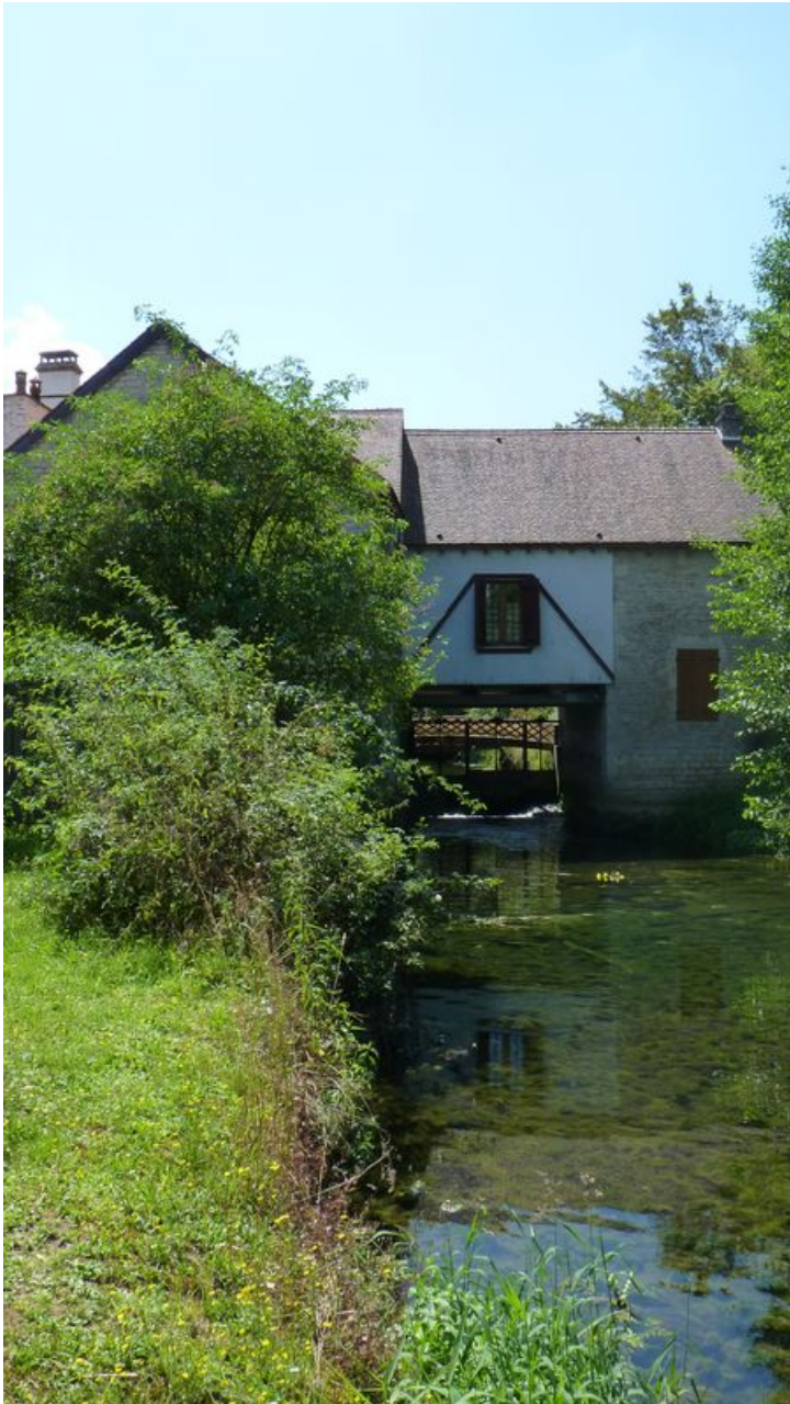
Vue du moulin depuis l'ouest.