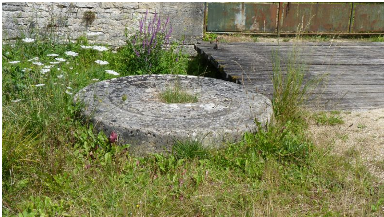
Vue des anciennes meules entreposées au pied de l'édifice.