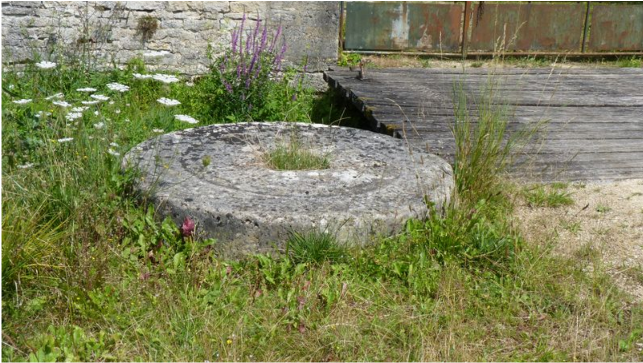
Vue des anciennes meules entreposées au pied de l'édifice.