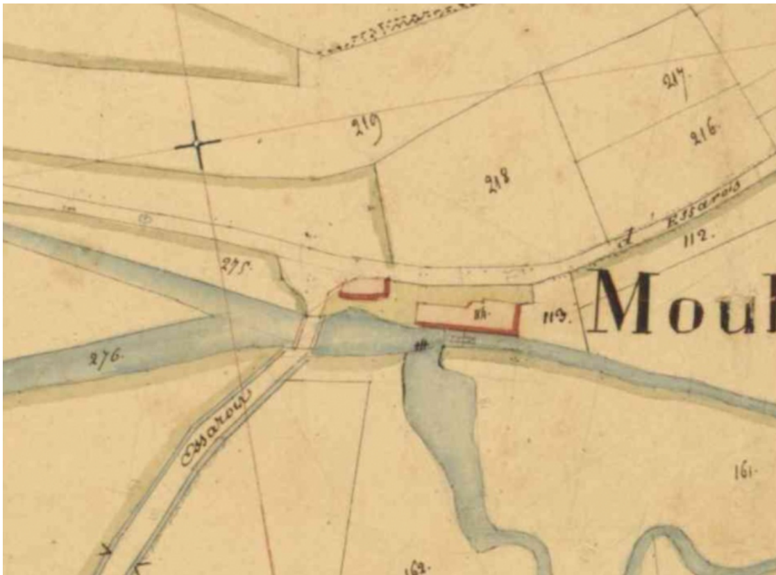
Détail du plan cadastral napoléonien (AD 21 : 3 P 717/1).

21, Voulaines-les-Templiers, lieudit : Champs Perrault