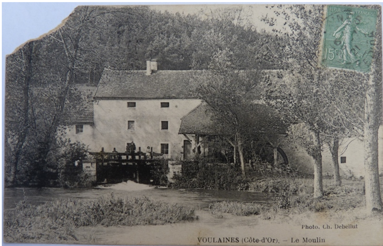
Carte postale ancienne représentant le moulin depuis l'est. 21, Voulaines-les-Templiers, lieudit : Champs Perrault