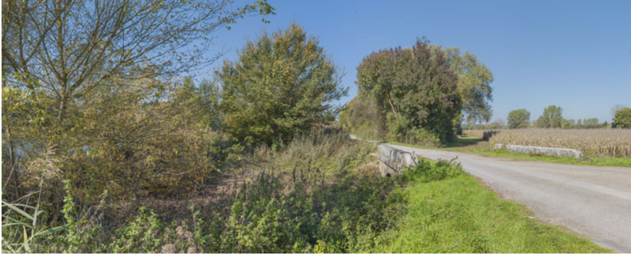
Vue depuis le chemin de halage.