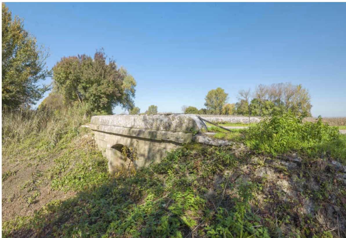
Vue d'ensemble, côté Saône.