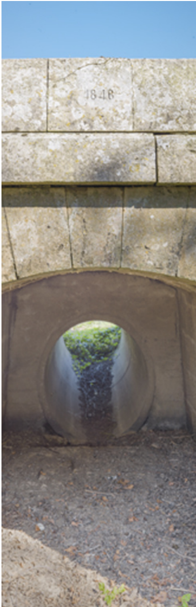
Détail de la maçonnerie en pierre de taille, particulièrement soignée.