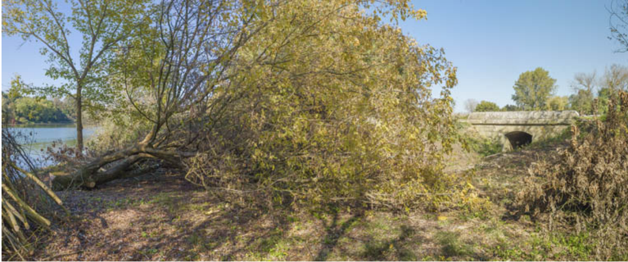
Vue d'ensemble, côté Saône.