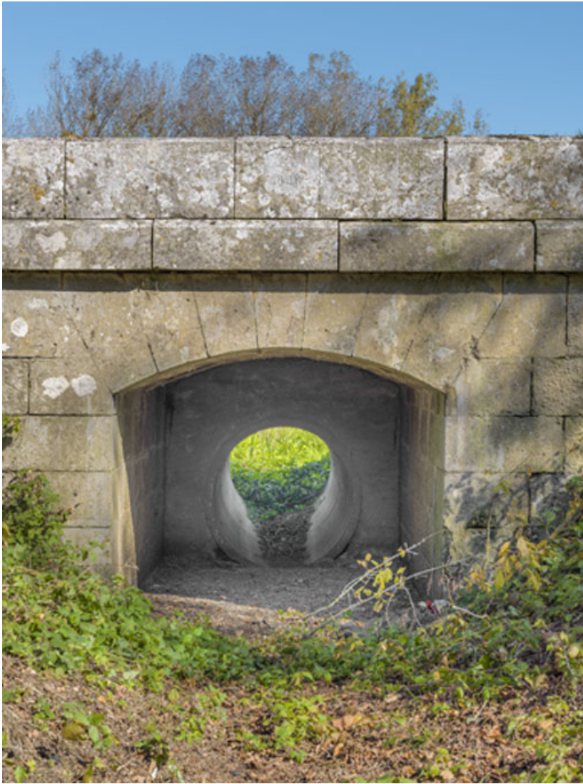
Vue rapprochée de l'arc surbaissé et de la buse.