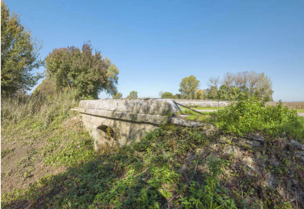
Vue d'ensemble, côté Saône.