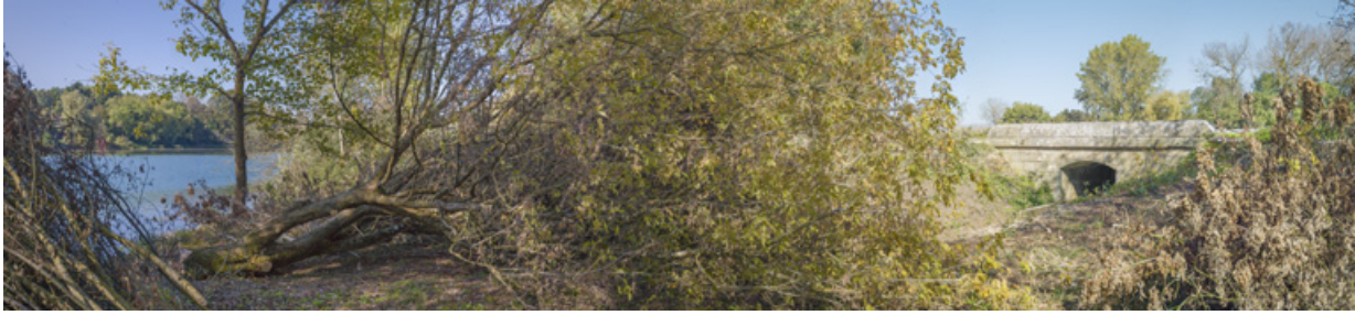
Vue d'ensemble, côté Saône.