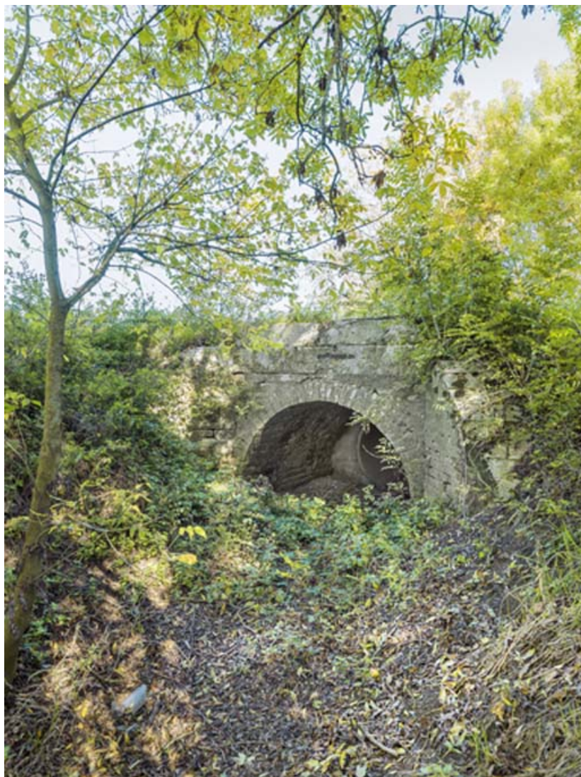
Vue d'ensemble, côté Saône.