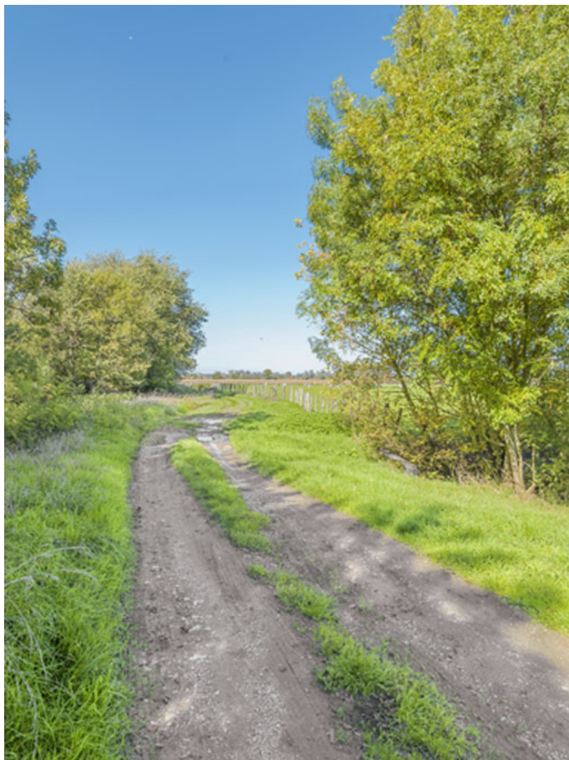
Vue du dessus : chemin de halage.