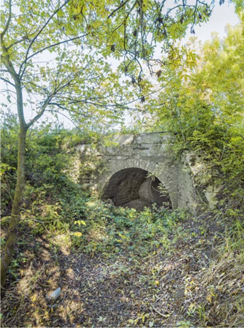
Vue d'ensemble, côté Saône.